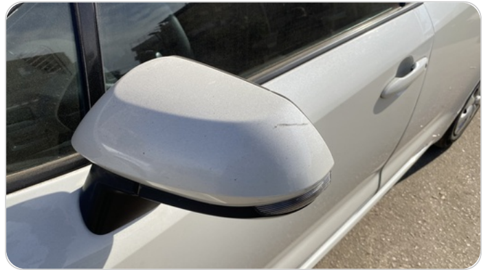
مراية الباب الأمامي شمال : فبريكة (خرابيش)