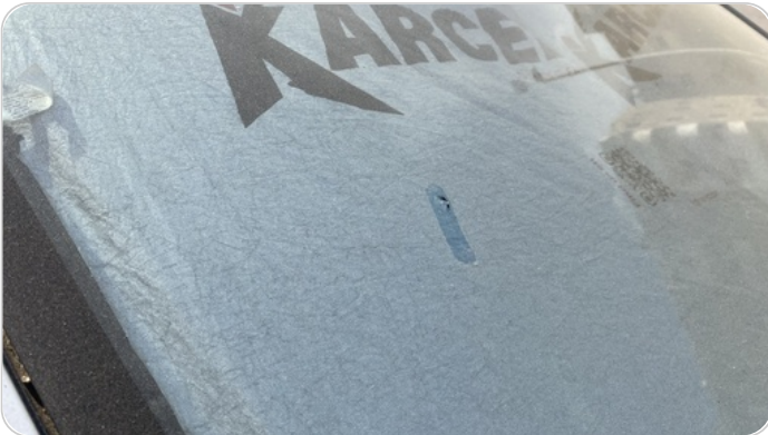
زجاج السيارة الأمامي : نقرة