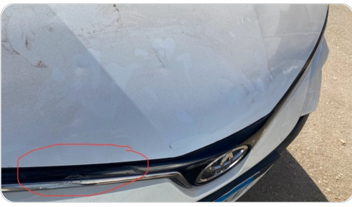
شبكة أمامية : شرخ / كسر