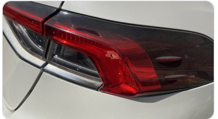
الكشاف الخلفي يمين : كسر بالباغة