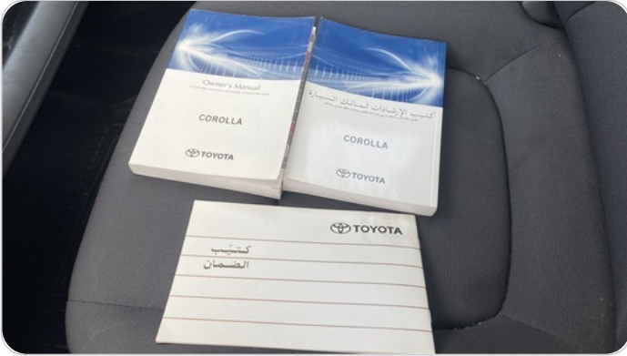
كتاب الضمان : موجود