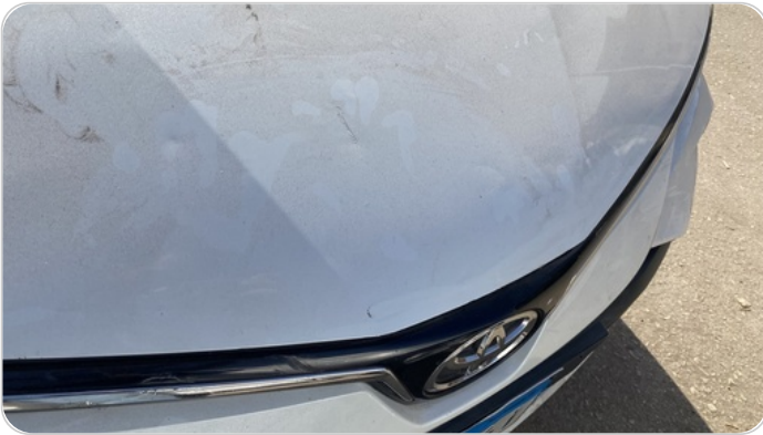
الكبوت : فبريكة (سمكره على الباردا)