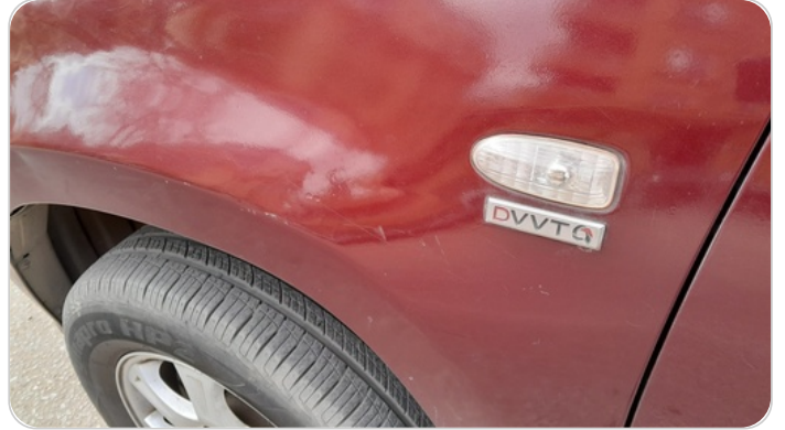
الرفرف الأمامي شمال : رش بدون معجون (خرابيش)