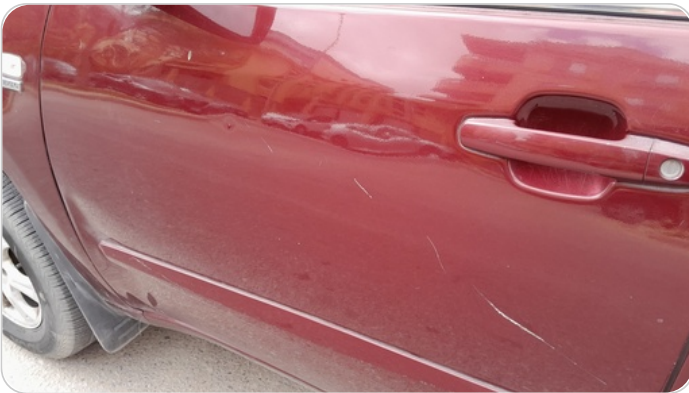
الباب الأمامي شمال : فبريكة (خرابيش)