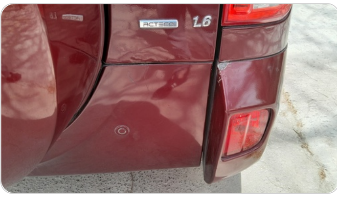
الاكصدام الخلفي : رش مع معجون (خرايش)