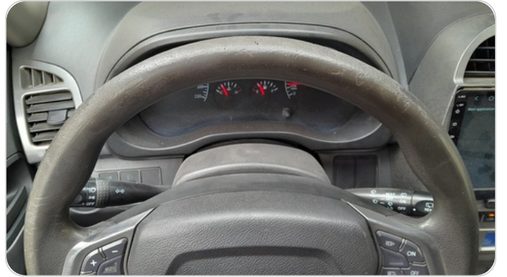
الطاره : متآكله