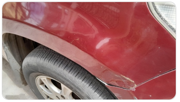
الرفراف الأمامي يمين : فبريكة (سمكره على البارد)