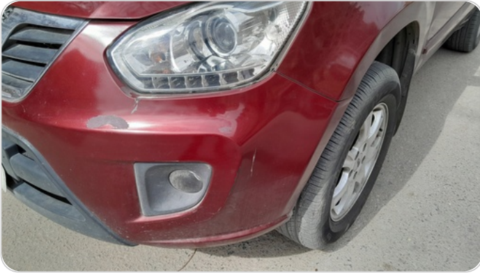
الاكصدام الامامي : رش بدون معجون (خرايش)