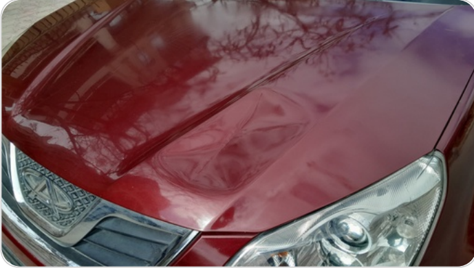
الكبوت : رش بدون معجون (خبطات)