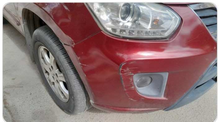
الاكصدام الأمامي : رش بدون معجون (خرابيش)