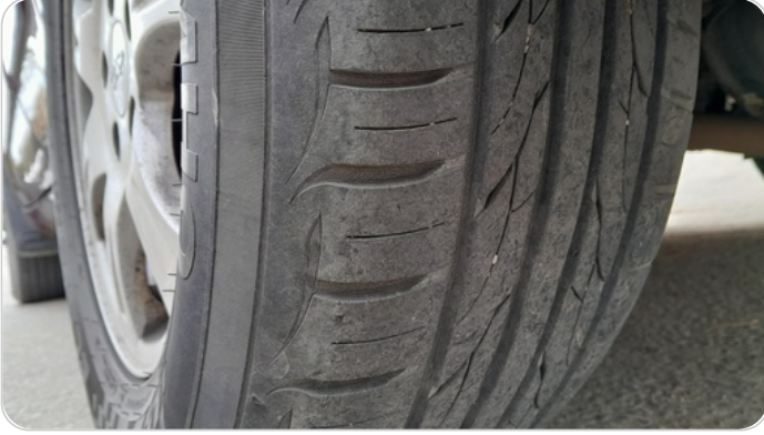
حالة الكاوتش الخلفي : النقشة متآكلة