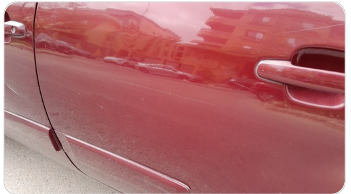
الباب الخلفي شمال : فبريكة (خرابيش)