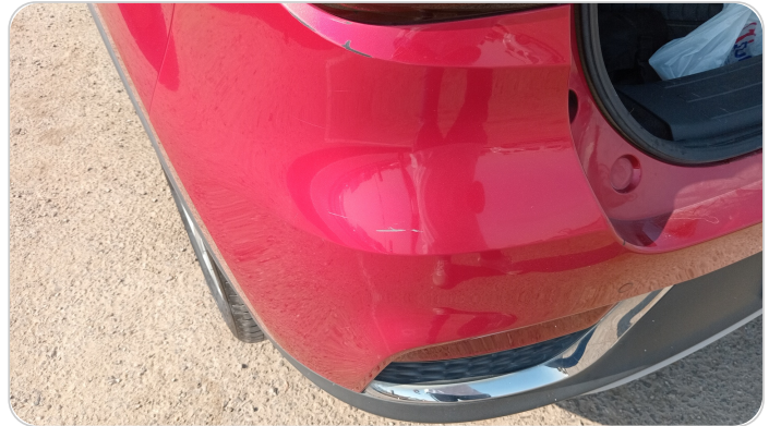
الاكصدام الخلفي : فبريكة (خرايش)