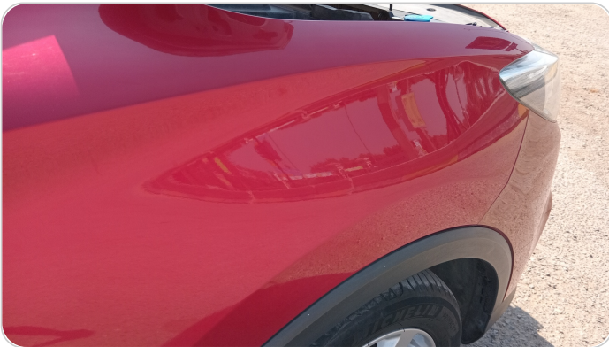
الرفرف الأمامي يمين : فبريكة (خرايش)