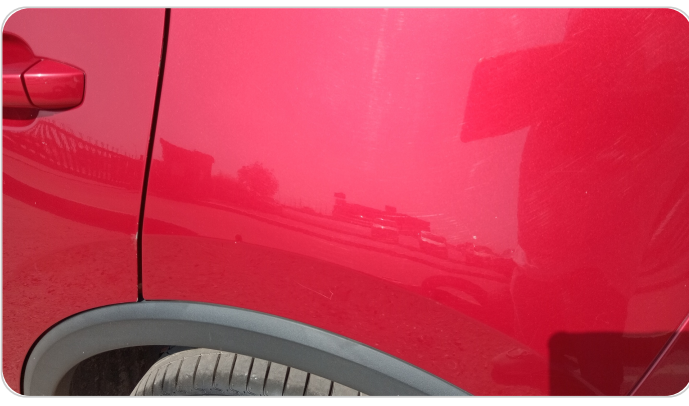
الرفرف الخلفي شمال : فبريكة (خرايش)