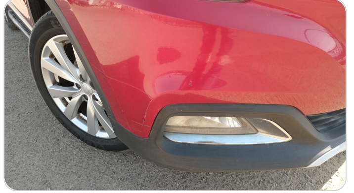
الاكصدام الأمامي : رش بدون معجون (خرايش)