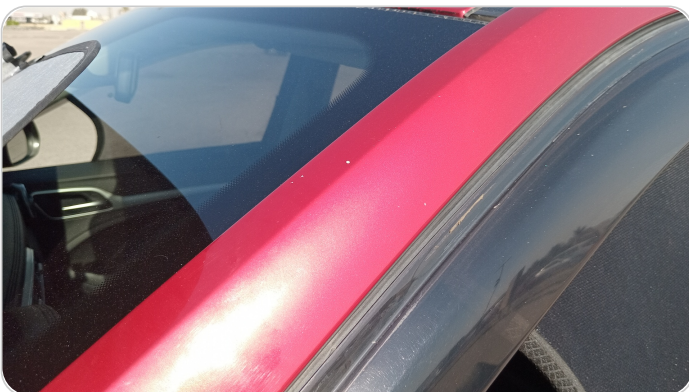
قائم خارجي أمامي شمال : فبريكة (خرابيش)