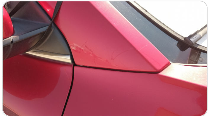
قائم خارجي أمامي يمين : فبريكة (خرايش)