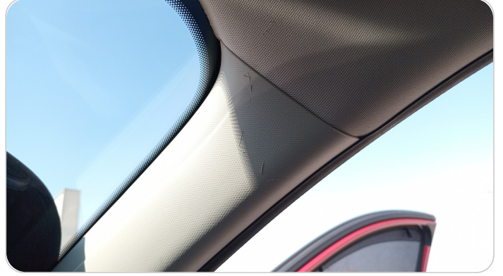
فيبر قائم أمامي يمين : قطع /كسر /شرح /تلف