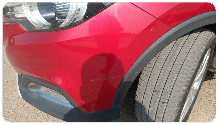
الاكصدام الامامي : رش بدون معجون (خرابيش)