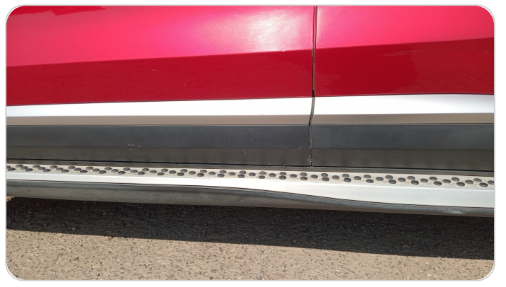
العتب السفلي شمال : فبريكة (خرايش)