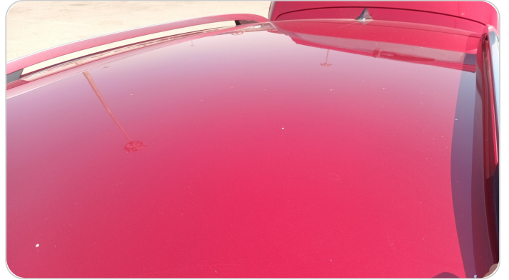
السقف : فبريكة (خرابيش)