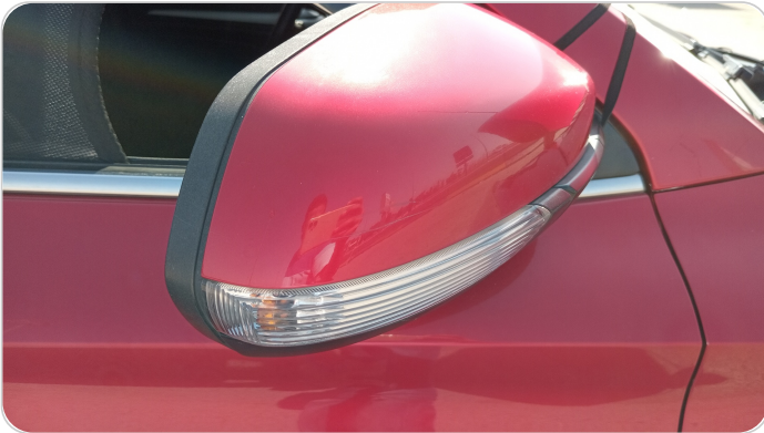
مراية الباب الأمامي يمين : فبريكة (خرايش)