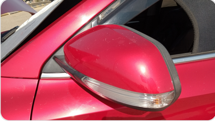
مراية الباب الأمامي شمال : فبريكة (خرايش)