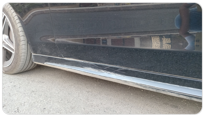
العتب السفلي شمال : فبريكة (خرايش - خبطات)