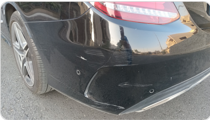
الاكصدام الخلفي : فبريكة (خرايش)