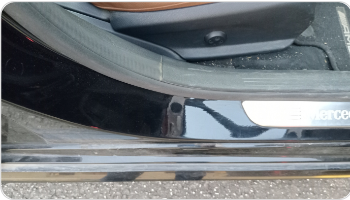
دواخل وقوائم باب أمامي يمين : فبريكة (خرابيش)