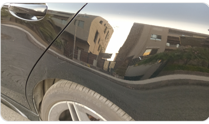
الرفرف الخلفي شمال : فبريكة (خرايش)