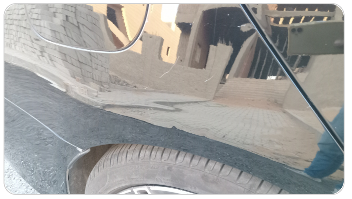
الرفرف الخلفي يمين : فبريكة (خرابيش)