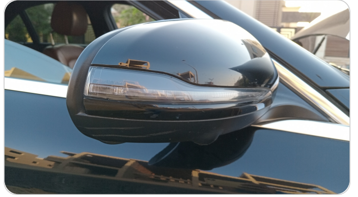
مراية الباب الأمامي يمين : فبريكة (خرابيش)