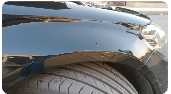
الرفرف الأمامي يمين : فبريكة (خرايش - خبطات)