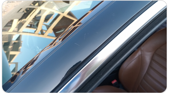
قائم خارجي أمامي شمال : فبريكة (خرابيش)