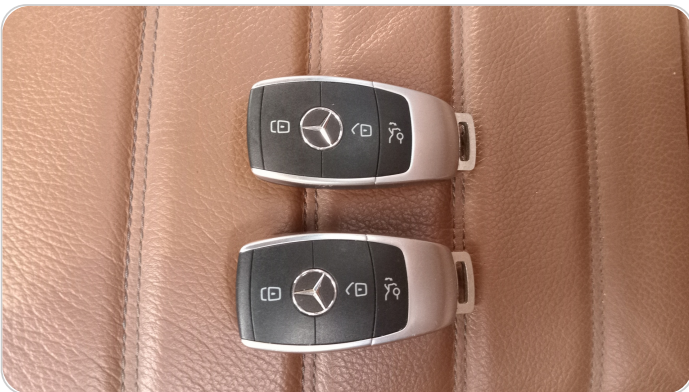
الريموت /المفتاح الاضافي : يعمل بكفاءة