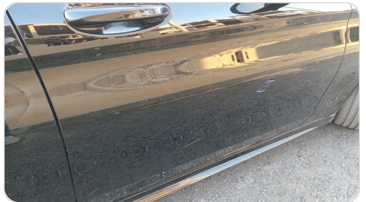
الباب الأمامي يمين : فبريكة (خرايش - خبطات)