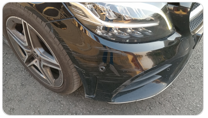
الاكصدام الامامي : فبريكة (خرابيش - خبطات)