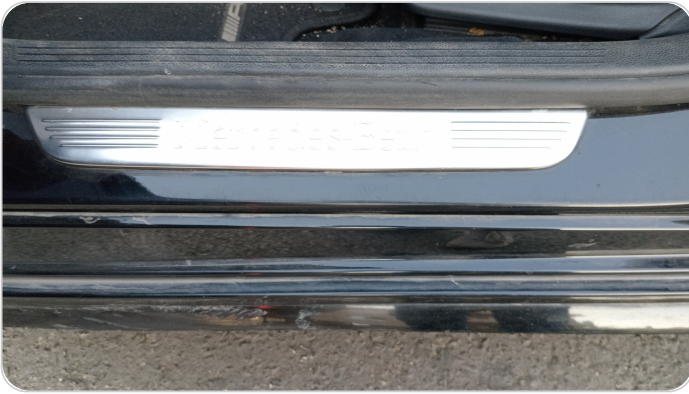
دواخل وقوائم باب الأمامي شمال : فبريكة (خرابيش)