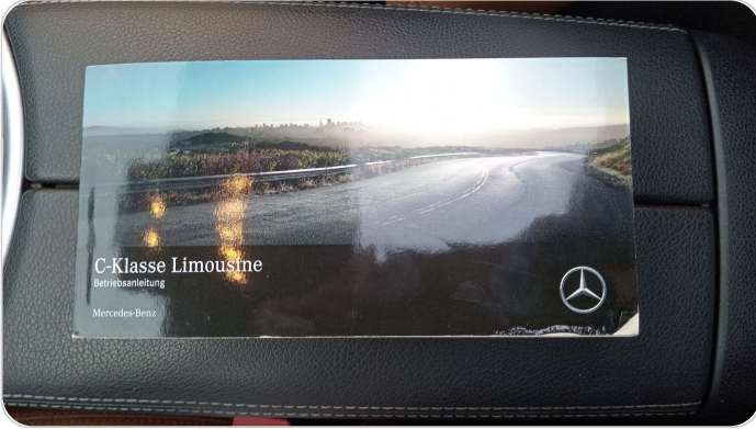
كتالوج السيارة : موجود