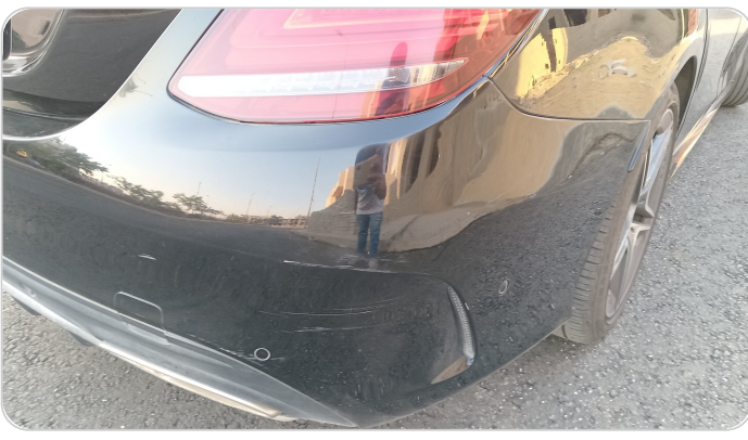
الاكصدام الخلفي : فبريكة (خرابيش)