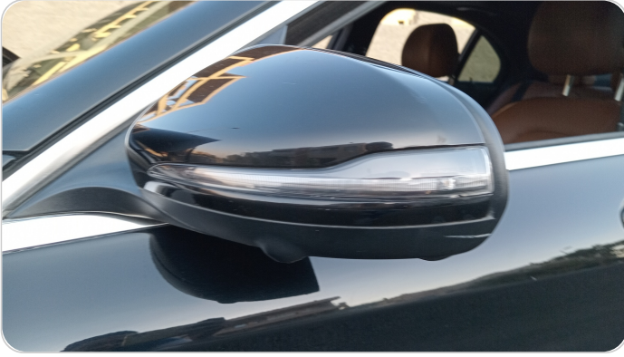
مرآة الباب الأمامي شمال : فبريكة (خرايش)