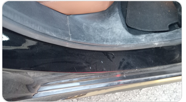
دواخل وقوائم باب خلفي يمين : فبريكة (خرابيش)