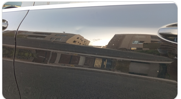
الباب الخلفي شمال : فبريكة (خرابيش - خبطات)