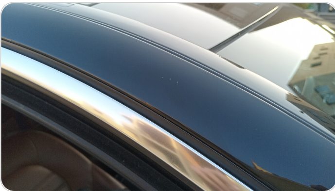
قائم خارجي أمامي يمين : فبريكة (خرايش)