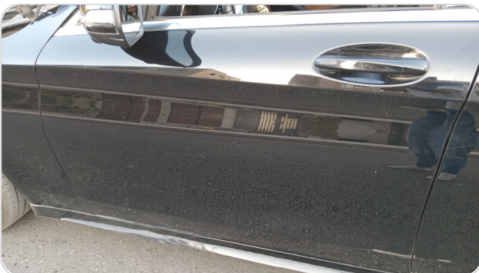
الباب الأمامي شمال : فبريكة (خرابيش)