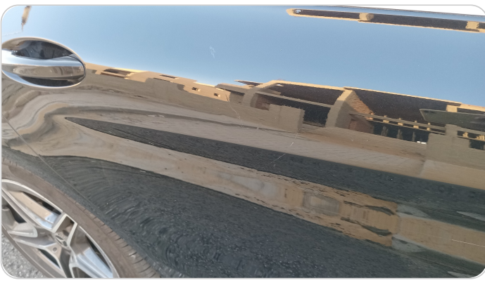
الباب الخلفي يمين : فبريكة (خرابيش)