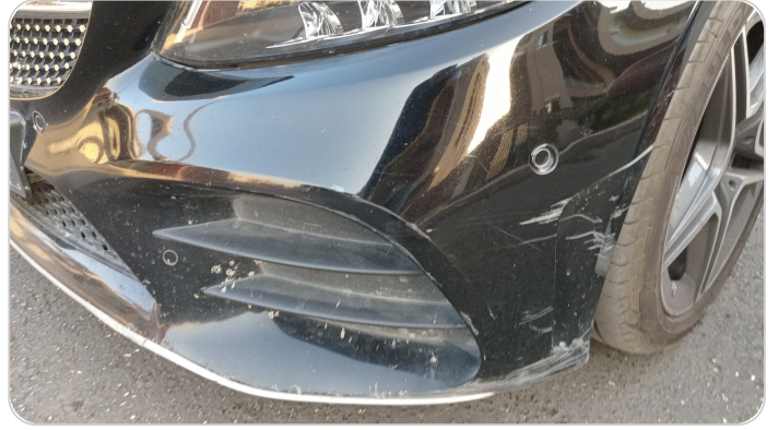
الاكصدام الأمامي : فبريكة (خرايش - خبطات)