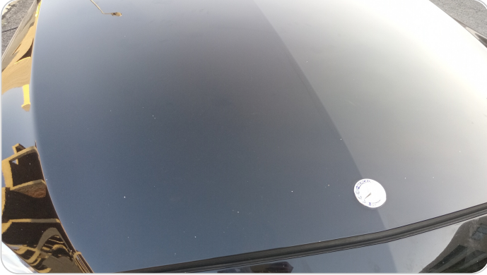
الكبوت : فبريكة (خرابيش)