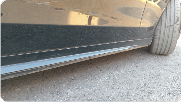
العتب السفلي يمين : فبريكة (خرابيش)