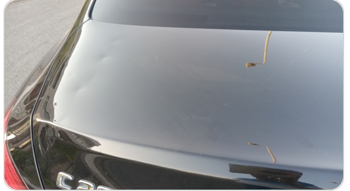
باب الشنطة : فبريكة ( خرابيش _ خبطات )