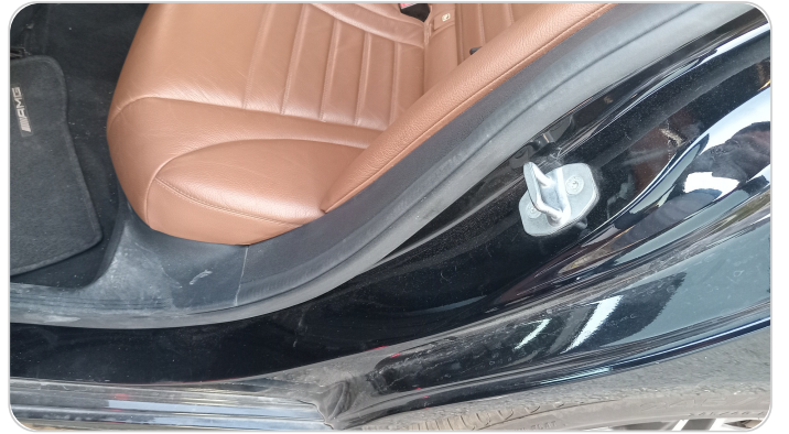
دواخل وقوائم باب الخلفي شمال : فبريكة (خرابيش)