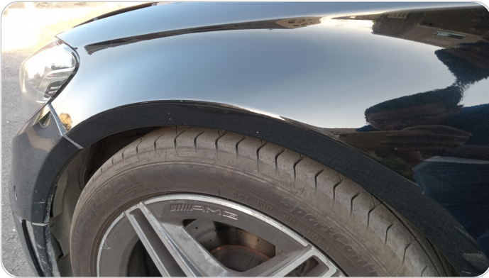
الرفرف الأمامي شمال : فبريكة (خرابيش)