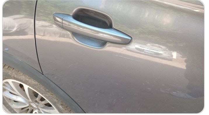
الباب الخلفي يمين : رش مع معجون (خرابيش)