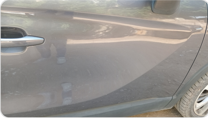
الباب الأمامي يمين : رش مع معجون (خرابيش)