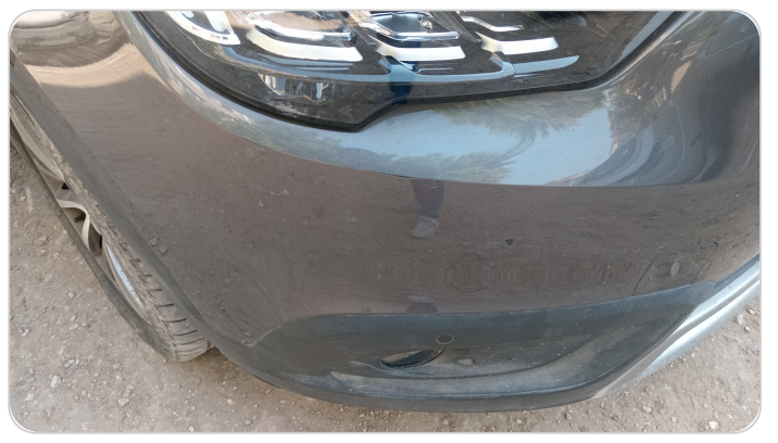
الاكصدام الأمامي : رش بدون معجون (خرابيش)