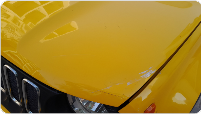
الكبوت : رش مع معجون (خرابيش)