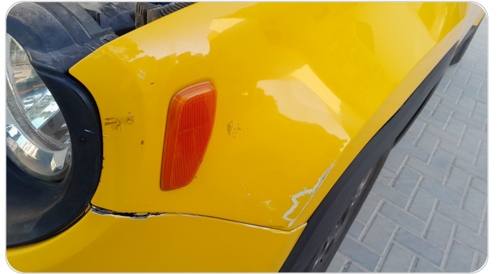
الرفرف الأمامي شمال : رش بدون معجون (خرابيش)