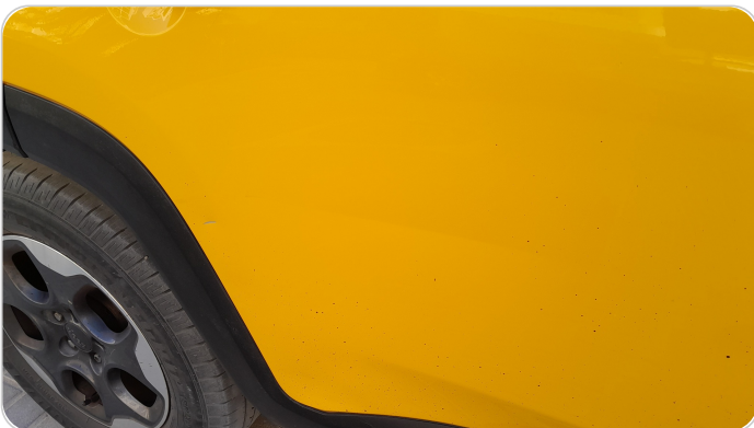
الباب الخلفي يمين : فبريكة (خرابيش)