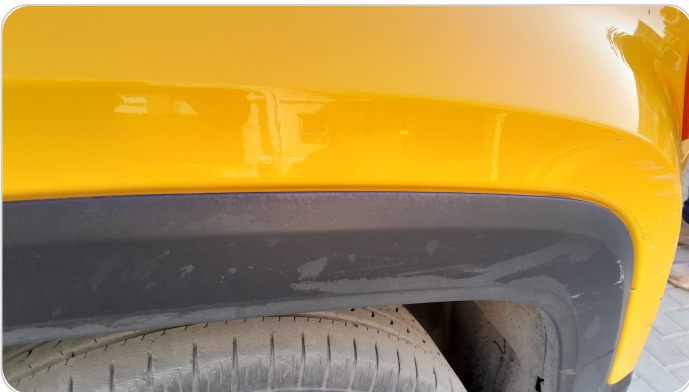
الرفرف الأمامي يمين : فبريكة (خرابيش)