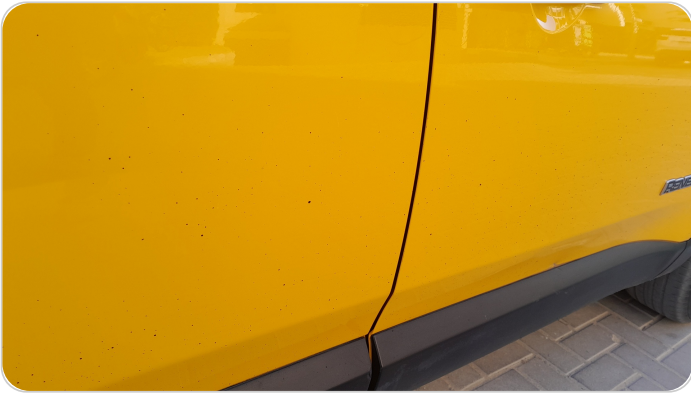
جانب السيارة : يوجد نقط دهان اسود علي جانبي السيارة