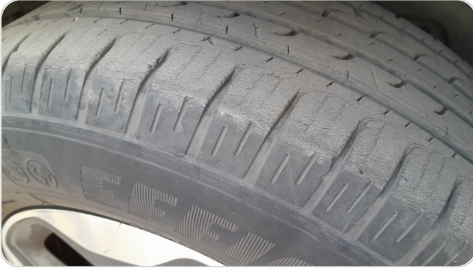
حالة الكاوتش الأمامي : النقشة متآكلة