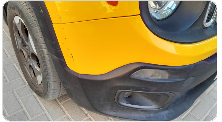
الاكصدام الامامي : رش مع معجون (خرابيش)