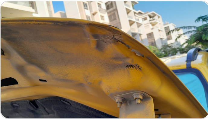
الكبوت : رش مع معجون (خرابيش- خبطات)