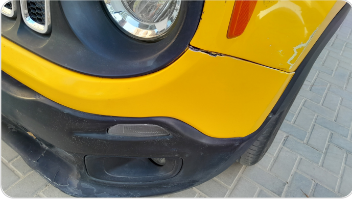
الاكصدام الأمامي : رش مع معجون (خرابيش)