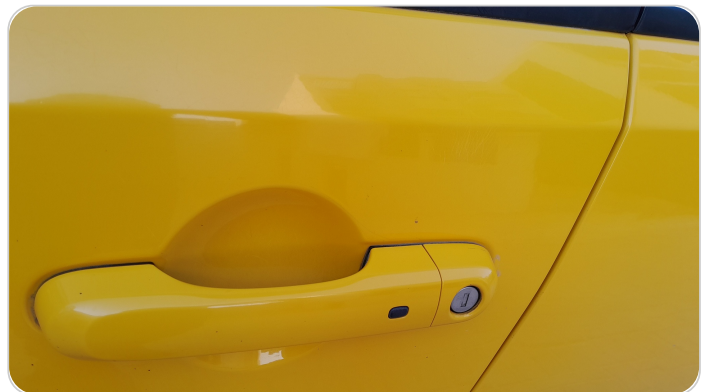
الباب الأمامي شمال : رش بدون معجون (خرابيش)