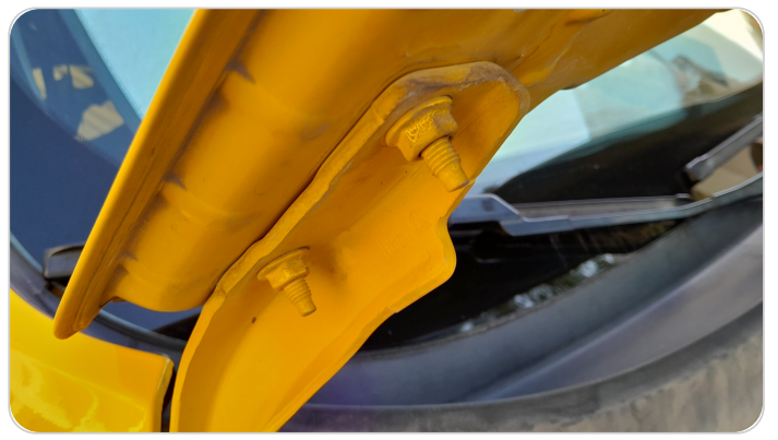
مفصلات ومسامير الكبوت : آثار فك وتركيب