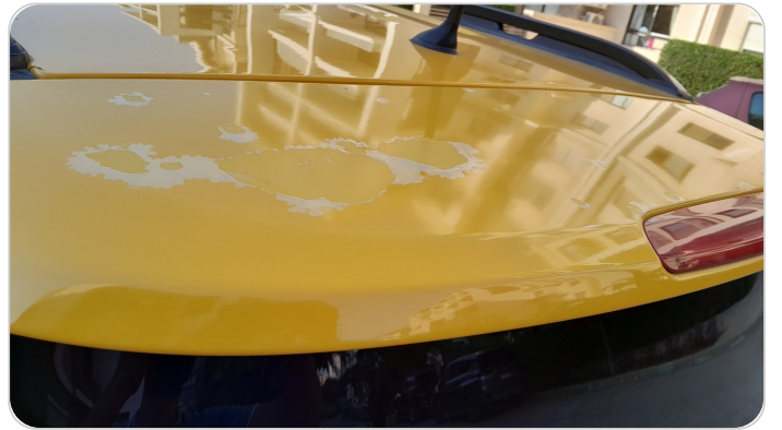
باب الشنطة : فبريكة (خرابيش)