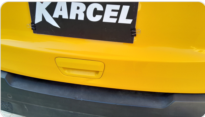
باب الشنطة : فبريكة (خرابيش)