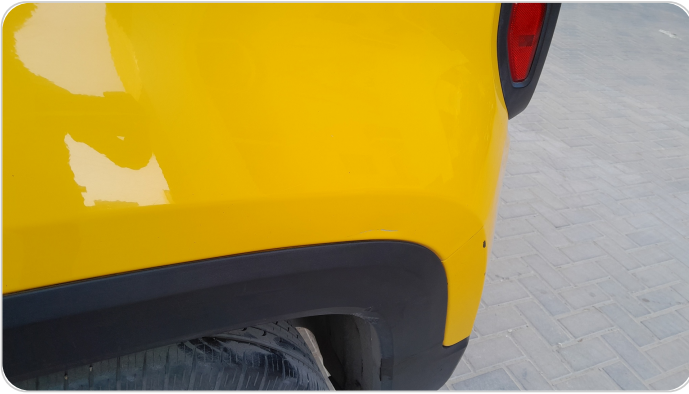
الرفرف الخلفي شمال : فبريكة (خرابيش)