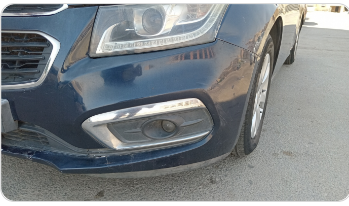
الاكصدام الامامي : رش مع معجون (صدمة)