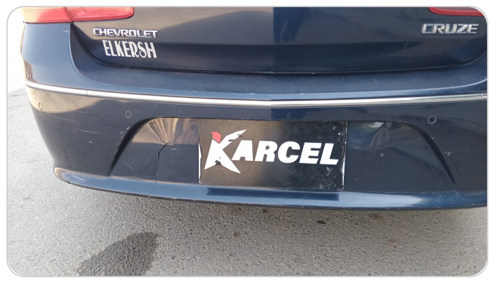
الاكصدام الخلفي : فبريكة (خرابيش - خبطات)