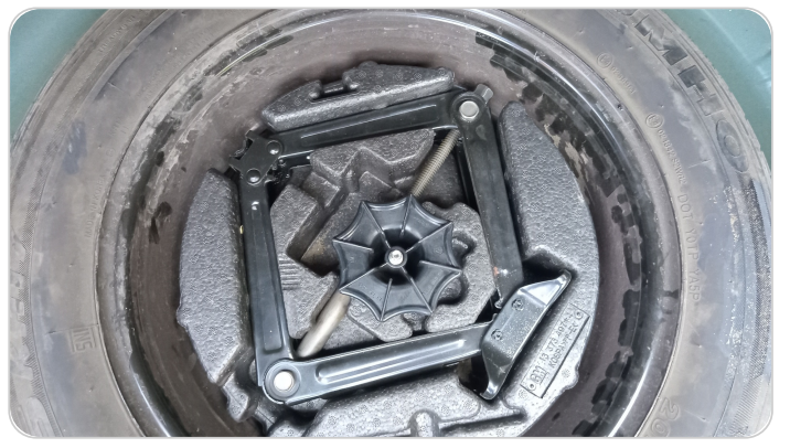
العدة وأدوات الأمان : متوفرة (بحالة جيدة)