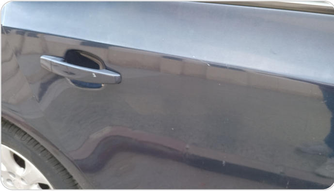
الباب الخلفي يمين : رش مع معجون (خرابيش)