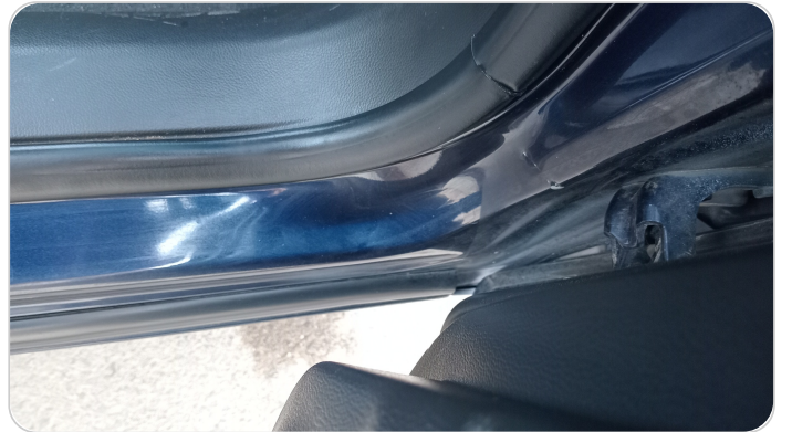
دواخل وقوائم باب أمامي يمين : فبريكة (نقرة)