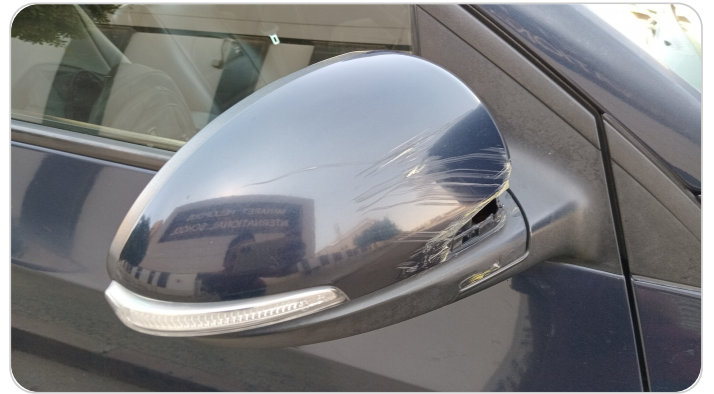
مراية الباب الأمامي يمين : فبريكة (خرابيش)