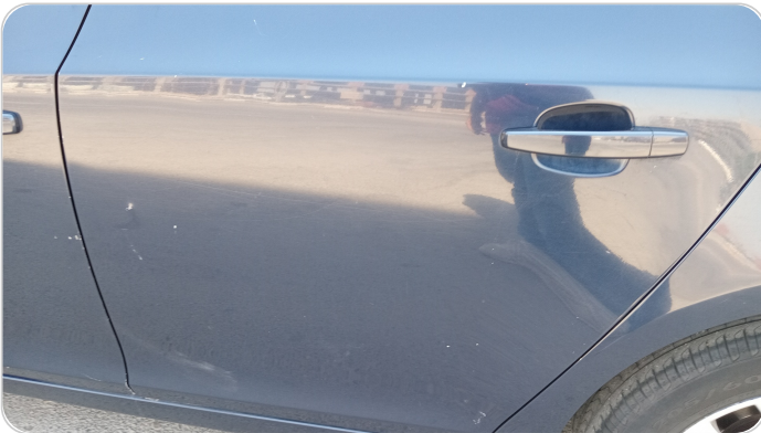
الباب الخلفي شمال : فبريكة (خرابيش)