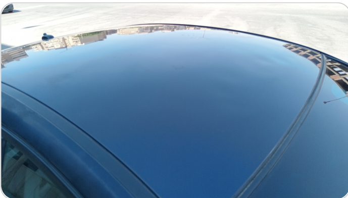
السقف : فبريكة (خرايش)