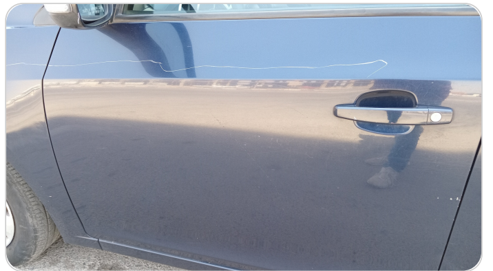
الباب الأمامي شمال : فبريكة (خرابيش)