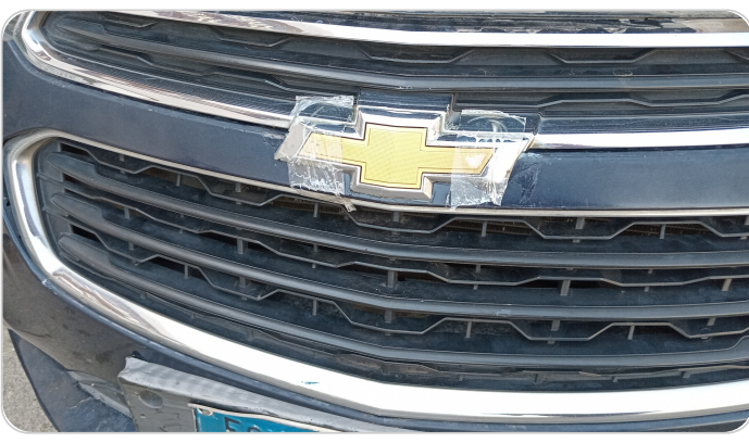
شبكة أمامية : شرخ / كسر