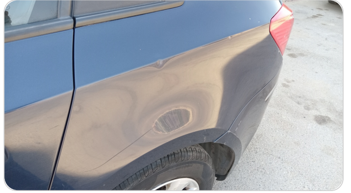
الرفرف الخلفي شمال : فبريكة (خرابيش - خبطات)