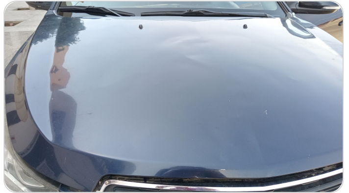
الكبوت : فبريكة (خرايش - خبطات)