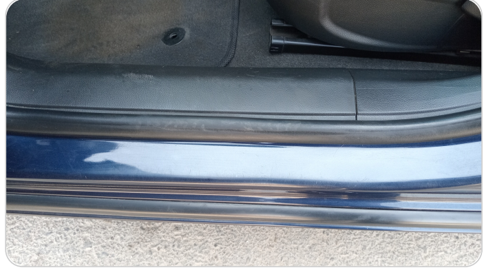
دواخل وقوائم باب الأمامي شمال : فبريكة (خرابيش)