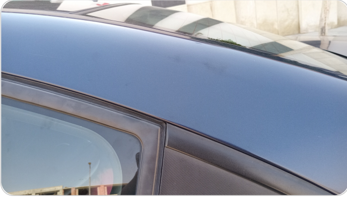
قائم خارجي خلفي شمال : فبريكة (خرابيش)