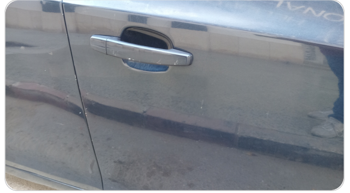
الباب الأمامي يمين : رش مع معجون (خرابيش)