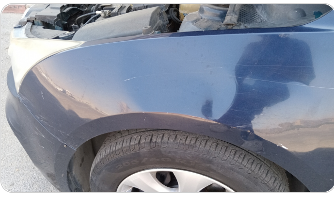
الرفرف الأمامي شمال : رش بدون معجون (خبطات)