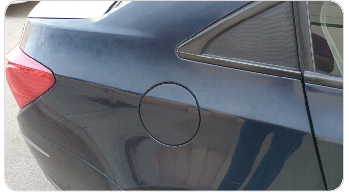
الرفرف الخلفي يمين : رش بدون معجون (خرابيش)