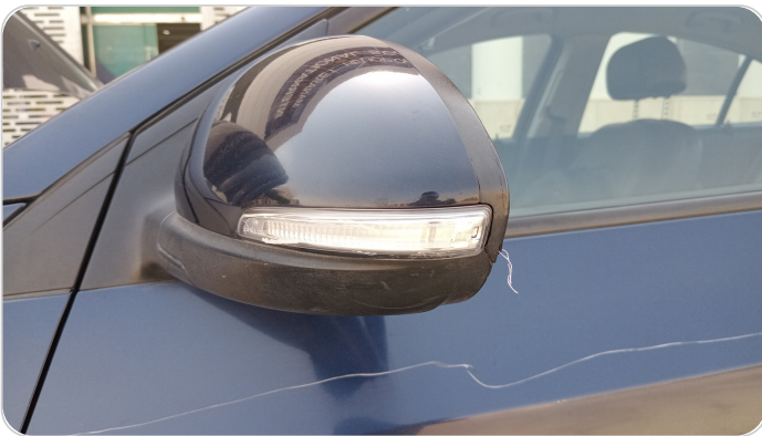
مراية الباب الأمامي شمال : فبريكة (خرابيش)