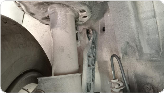
ذراع الميزان : تشققات (كاوتش الميزان)