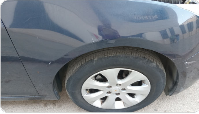
الرفرف الأمامي يمين : رش مع معجون (خرابيش)