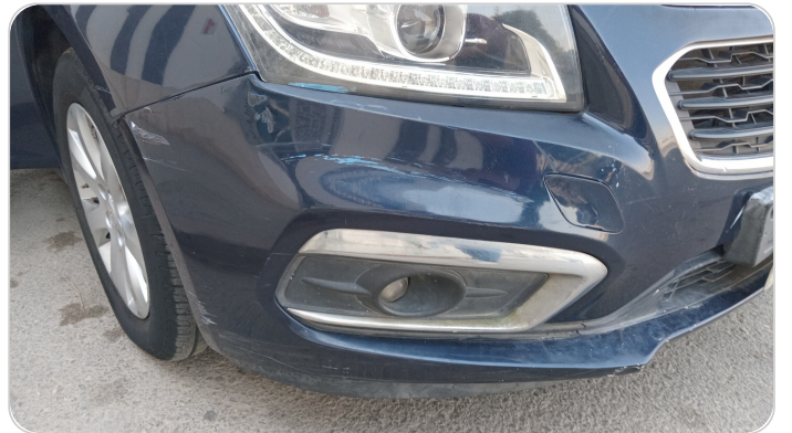
الاكصدام الأمامي : رش مع معجون (صدمة)