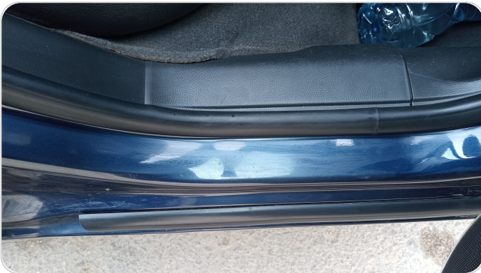
دواخل وقوائم باب خلفي يمين : فبريكة (خرابيش)