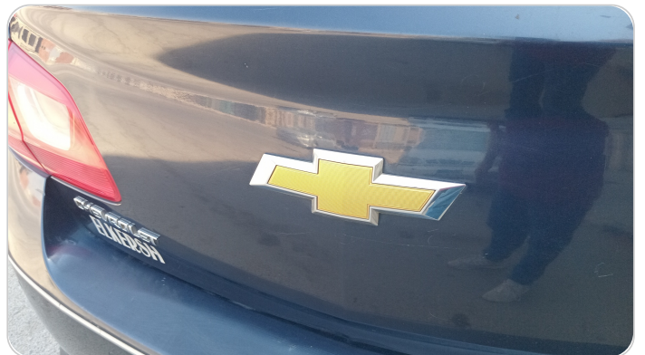
باب الشنطة : فبريكة ( خرايش _خبطات )