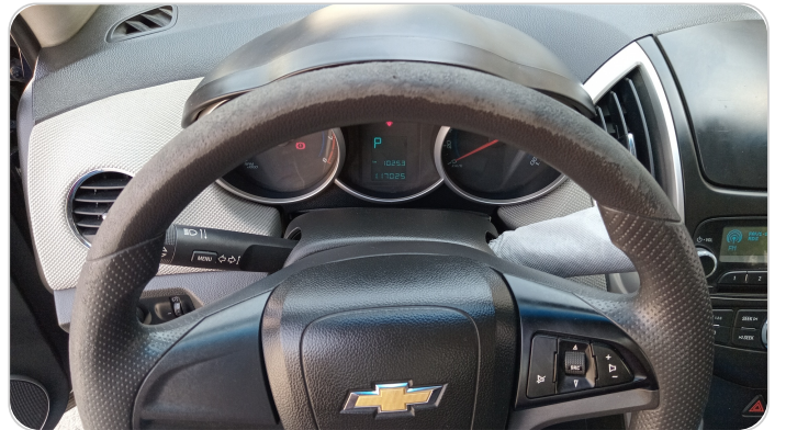
الطاره : متاكله