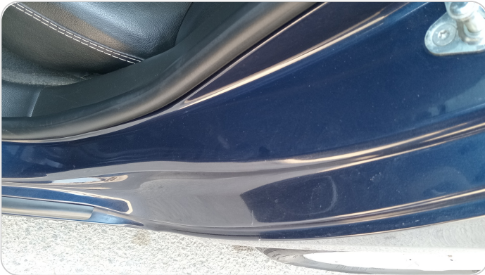
دواخل وقوائم باب الخلفي شمال : فبريكة (خرابيش)