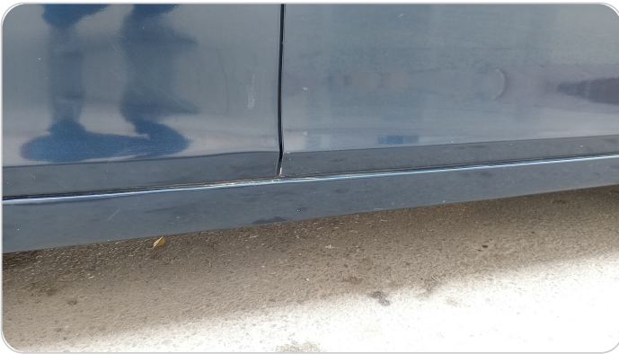
العتب السفلي يمين : رش مع معجون (خرابيش)