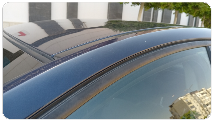
قائم خارجي أمامي شمال : فبريكة (خرابيش - خبطات)