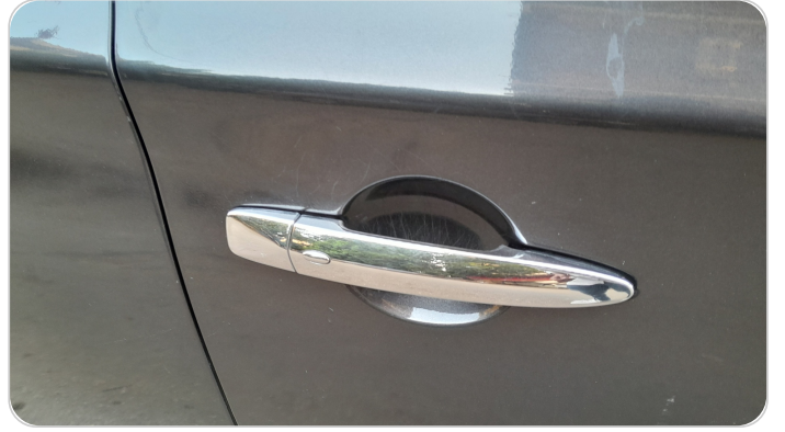
الباب الأمامي يمين : رش مع معجون (خرابيش)