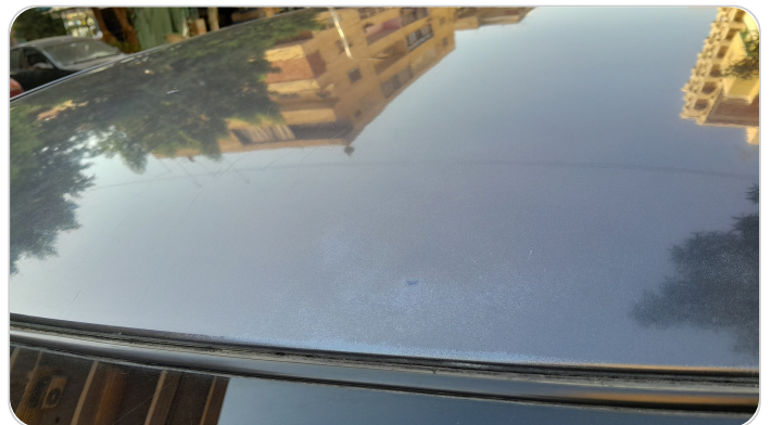
السقف : فبريكة ( الدهان متاكل )