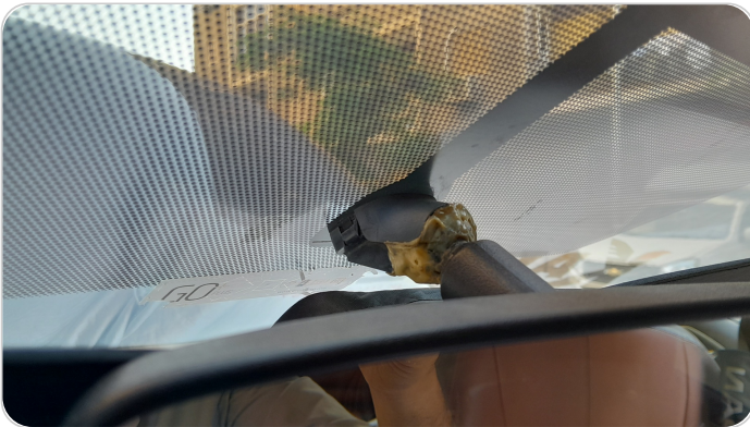
مراية الزجاج الأمامي : كسر/شرخ