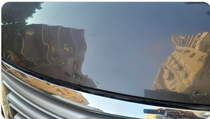
الكبوت : فبريكة (سمكره على البارد)