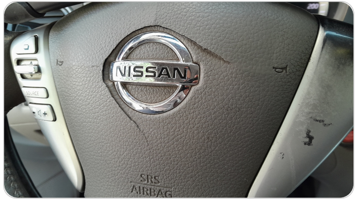
الطارة : كسر