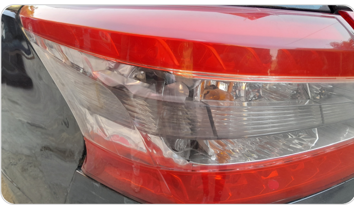
الكشاف الخلفي شمال : كسر في الكشاف