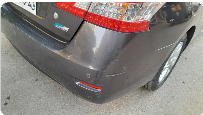
الكصدام الخلفي : فبريكة (خرابيش)