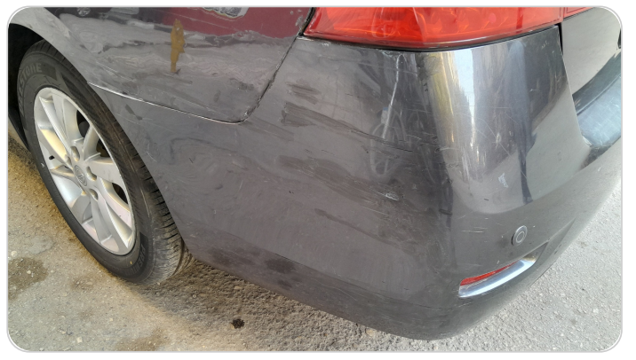
الاصدام الخلفي : فبريكة (خرابيش)