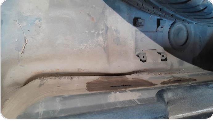
حوض الشنطة : عصرة