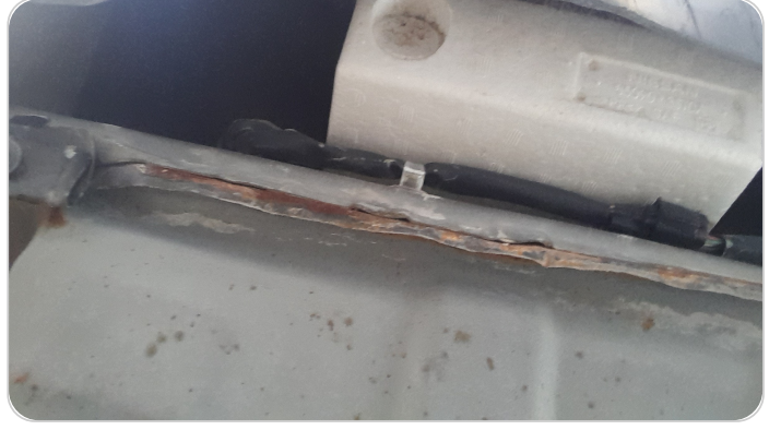
الستارة الخلفية : عصرة