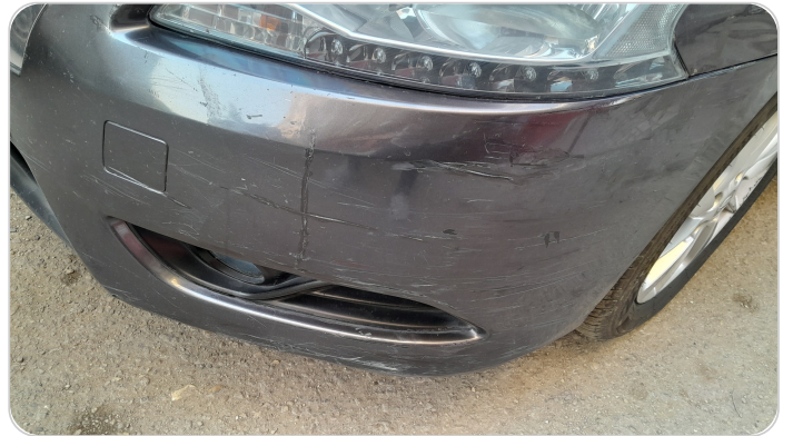
الكصدام الامامي : فبريكة (خرابيش)