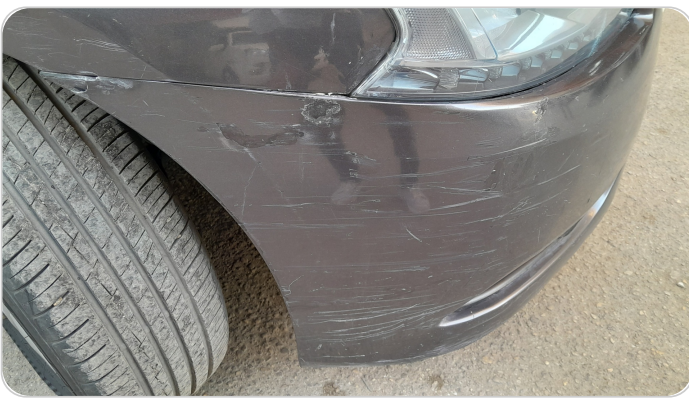
الاصدام الأمامي : فبريكة (خرابيش)