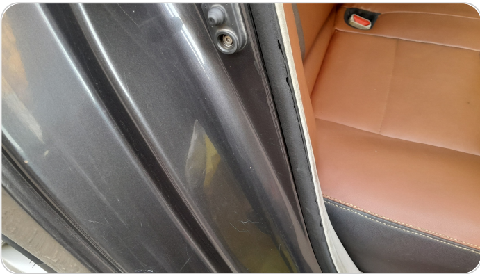
كاوتش الابواب : متاكل