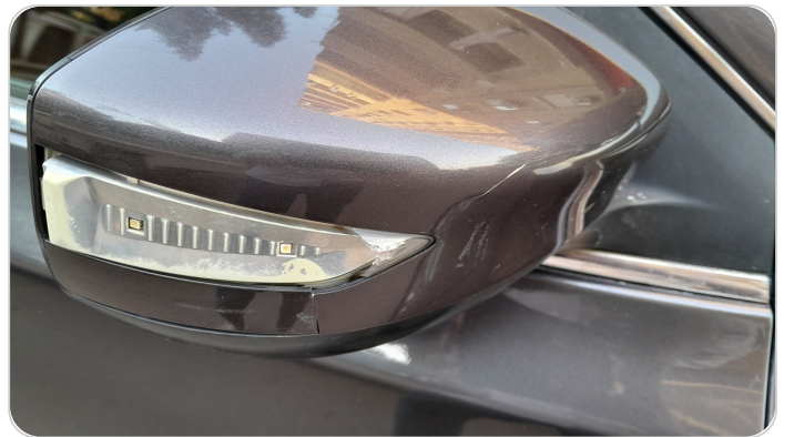
مراية الباب الأمامي يمين : كسر في الغطاء