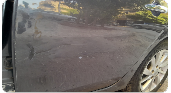
الباب الخلفي شمال : فبريكة (سمكره على البارد)