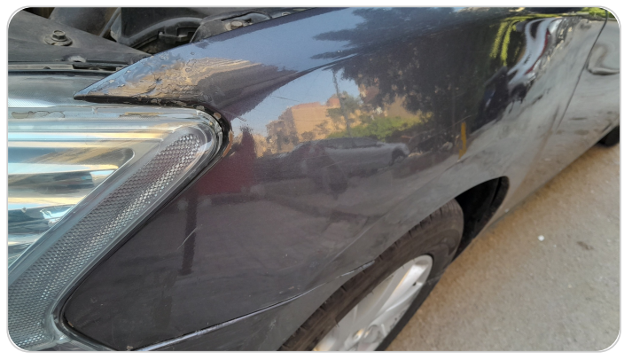
الرفرف الأمامي شمال : فبريكة (سمكره على البارد)