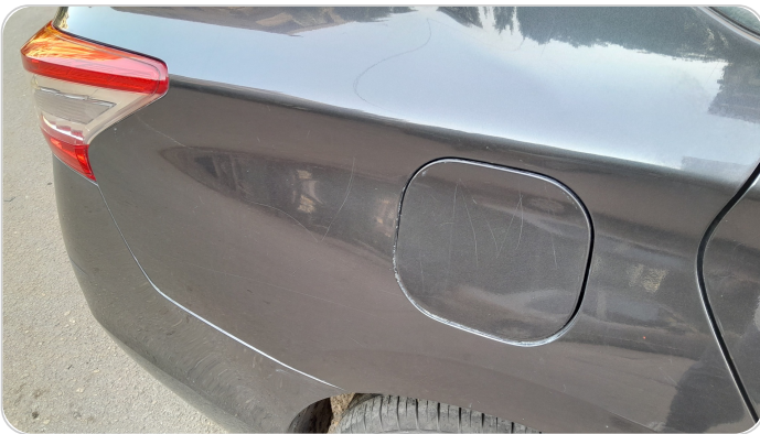
الرفرف الخلفي يمين : رش مع معجون (خرابيش)