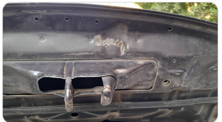
الكبوت : فبريكة (سمكره على البارد)