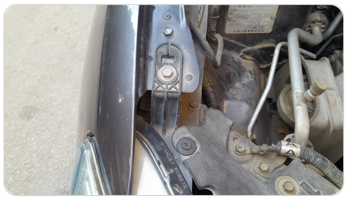
الكشاف الأمامي يمين : كسر في قواعد الكشاف