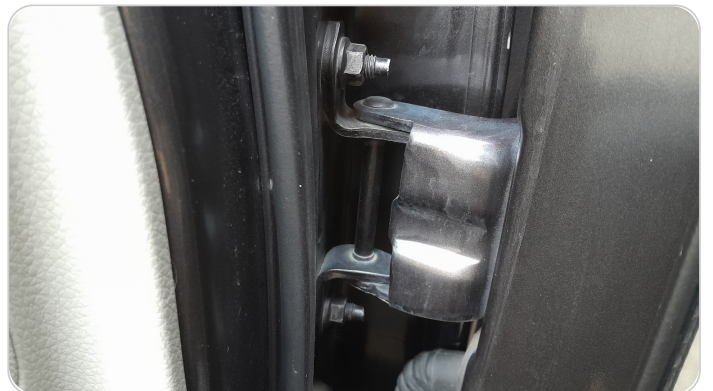
مفصلات ومسامير الباب الخلفي شمال : آثار فك وتركيب