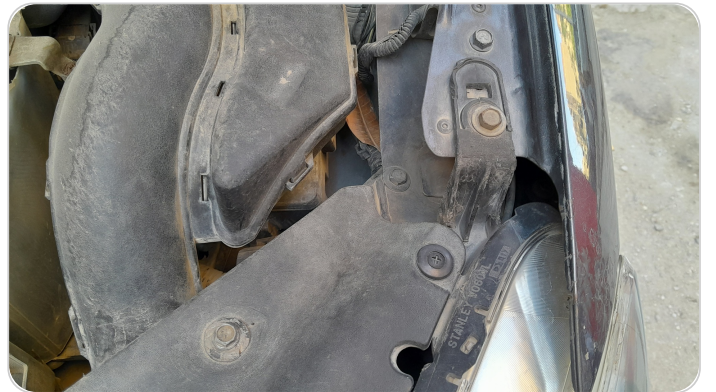
الكشاف الأمامي شمال : كسر في قواعد الكشاف