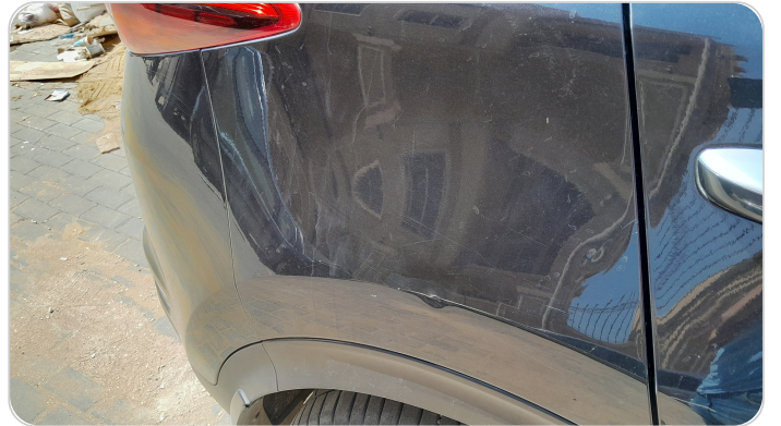
الرفرف الخلفي يمين : فبريكة (خرابيش)