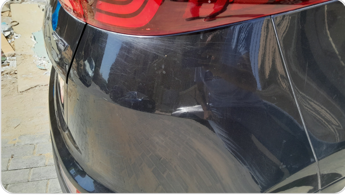
الاكصدام الخلفي : فبريكة (خرابيش)