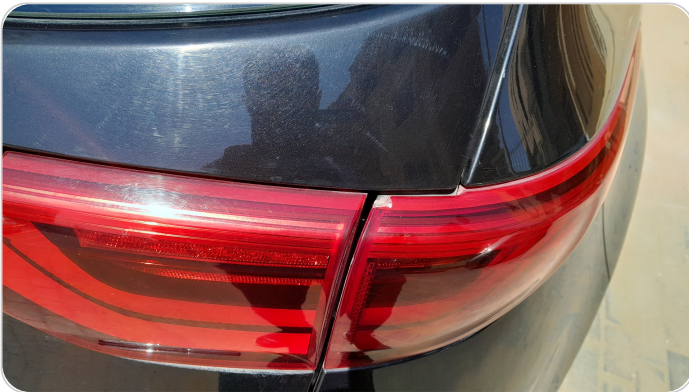
الكشاف الخلفي يمين : كسر بالباغة