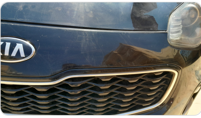
الاكصدام الأمامي : فبريكة (خرابيش)