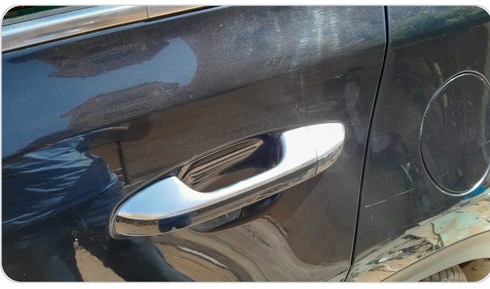
الباب الخلفي شمال : فبريكة (خرابيش)