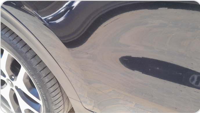
الباب الخلفي يمين : فبريكة (خرابيش)