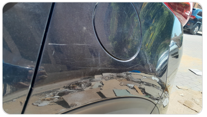
الرفرف الخلفي شمال : فبريكة (خرابيش)