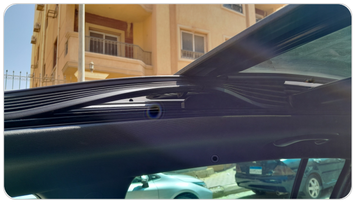
كاوتش فتحة السقف : خلع