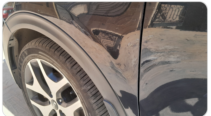
الرفرف الأمامي شمال : فبريكة (خرابيش)