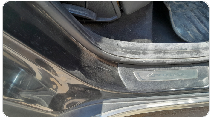
دواخل وقوائم باب خلفي يمين : فبريكة (خرابيش)