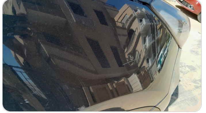
الرفرف الأمامي يمين : فبريكة (خرابيش)