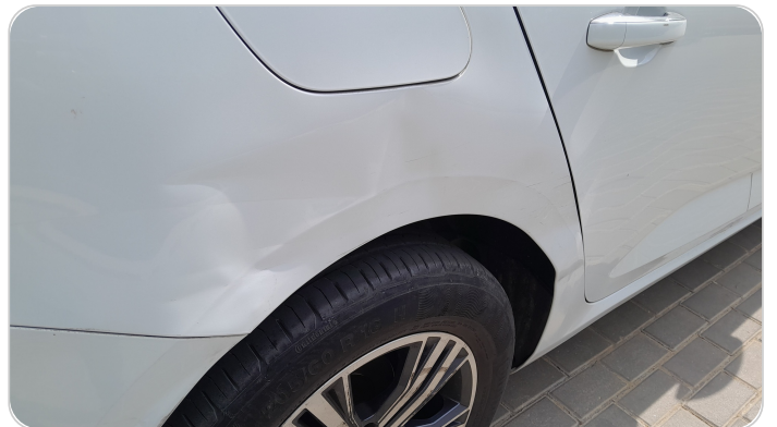
الرفرف الخلفي يمين : فبريكة (خبطات)