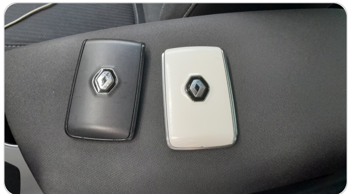
الريموت /المفتاح الاضافي : يعمل بكفاءة