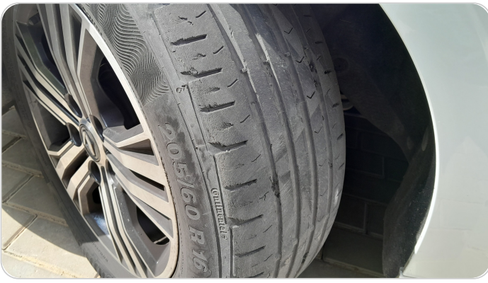
حالة الكاوتش الأمامي : تشققات/قطع بسيط