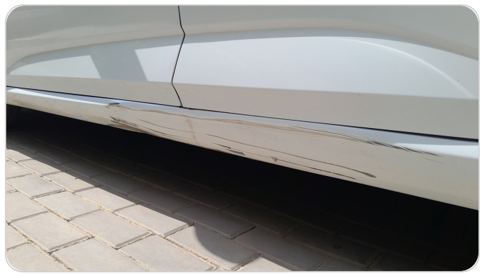
العتب السفلي شمال : فبريكة (خبطات)