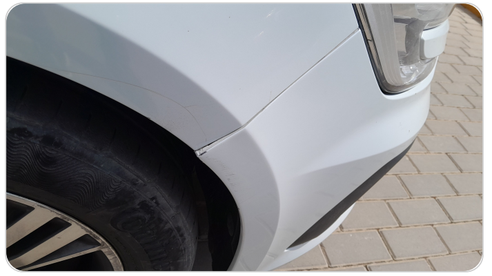
الاكصدام الامامي : فبريكة (خرابيش)