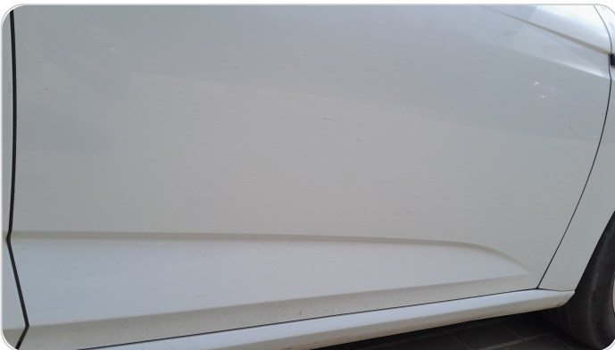
الباب الأمامي يمين : رش بدون معجون (خرابيش)