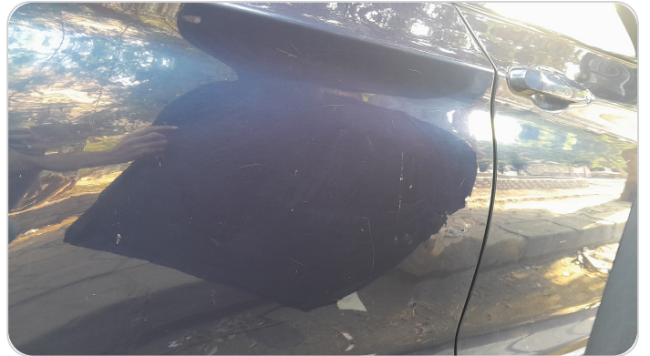
الباب الخلفي يمين : فبريكة (خرابيش - خبطات)