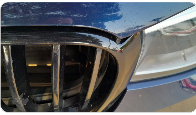
شبكة أمامية : شرخ / كسر