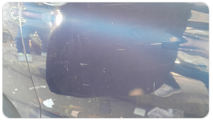
الباب الأمامي يمين : فبريكة (الدهان متآكل)