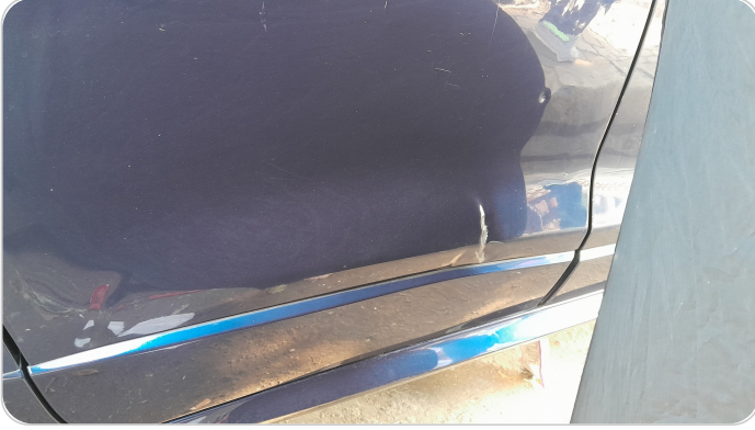
الباب الخلفي يمين : فبريكة (خرابيش - خبطات)