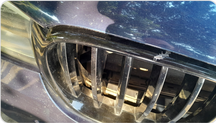
شبكة أمامية : شرخ / كسر