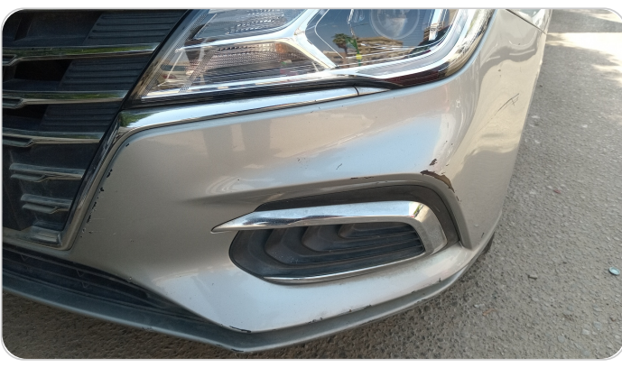
الاصدام الامامي : فبريكة (خرايبش)