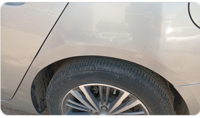
الرفرف الخلفي شمال : رش بدون معجون (خبطات)