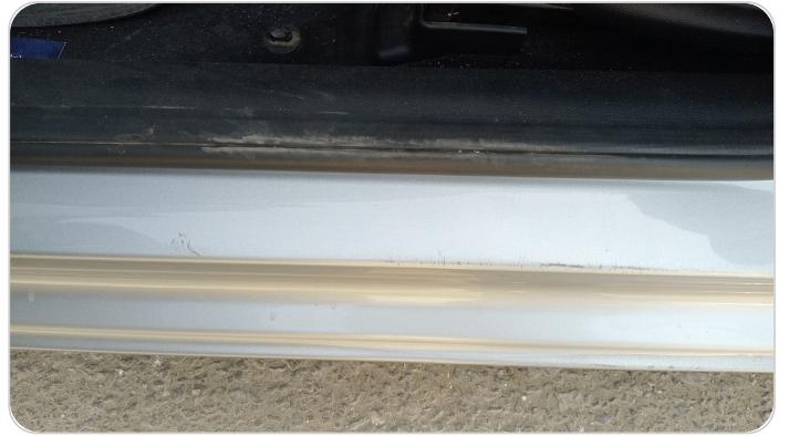
دواخل وقوائم باب الأمامي شمال : فبريكة (خرابيش)