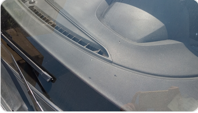
زجاج السيارة الأمامي : نقرة