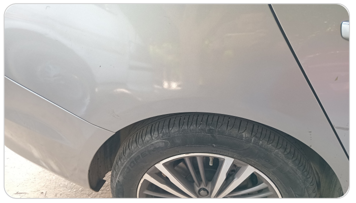
الرفرف الخلفي يمين : رش بدون معجون (خبطات)