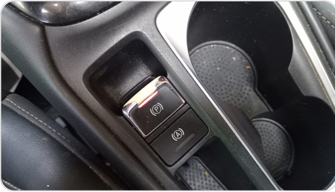
الكونسول الوسط : قطع / كسر / شرخ / تلف