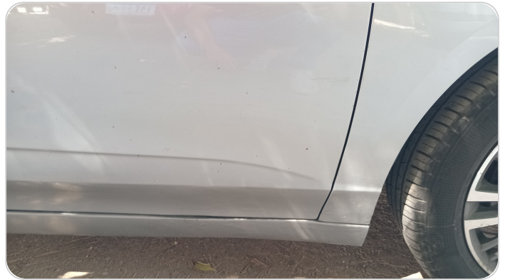
الباب الأمامي يمين : رش بدون معجون (خبطات)