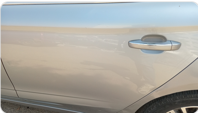
الباب الخلفي شمال : فبريكة (خرابيش)