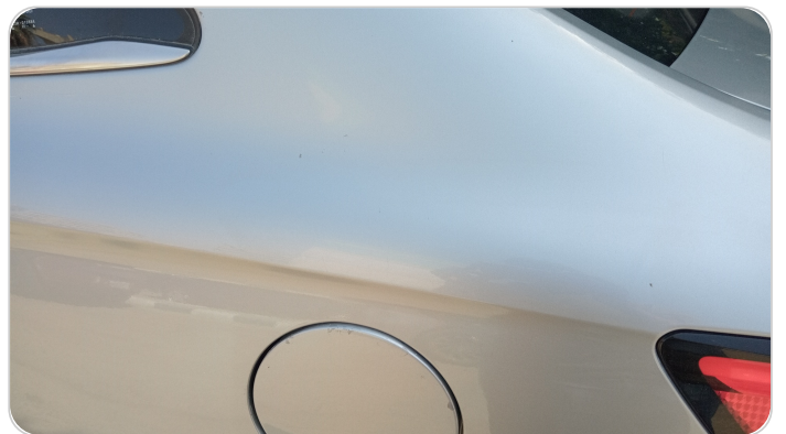
قائم خارجي خلفي شمال : فبريكة (خرابيش)