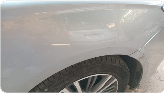
الرفرف الأمامي يمين : فبريكة (خرابيش)