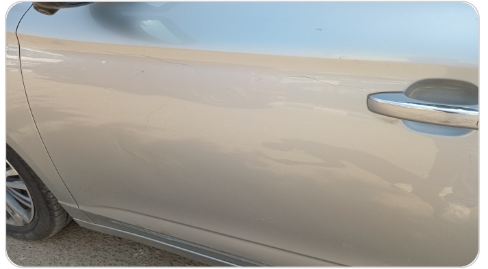
الباب الأمامي شمال : فبريكة (خرابيش - خبطات)