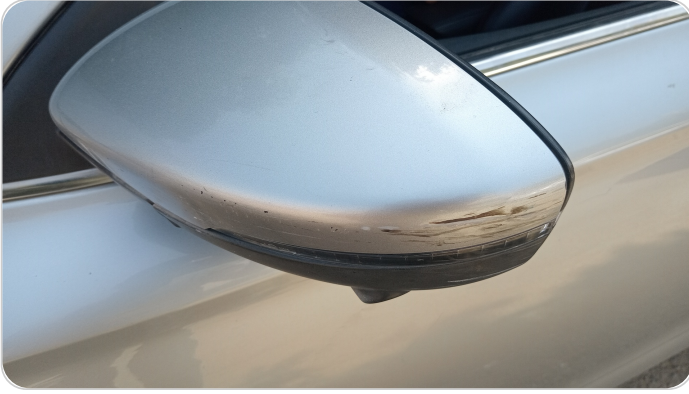
مراية الباب الأمامي شمال : فبريكة (خرابيش)