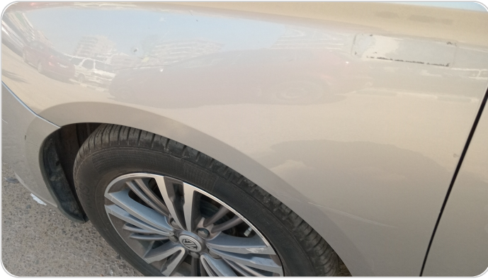
الرفرف الأمامي شمال : فبريكة (خرابيش)