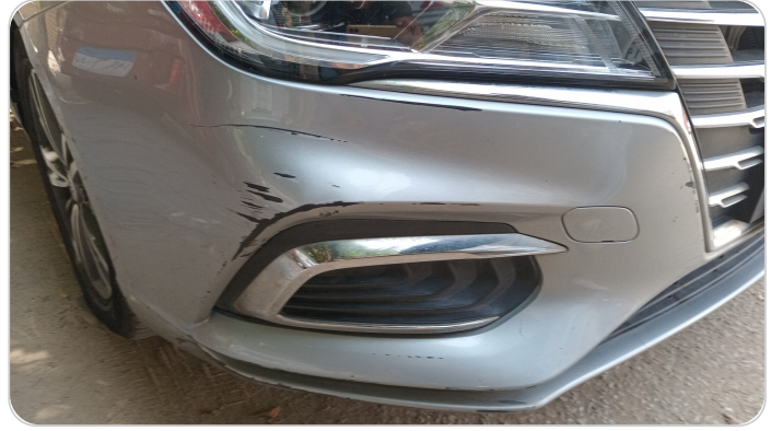
الاكصدام الأمامي : فبريكة (خرابيش)