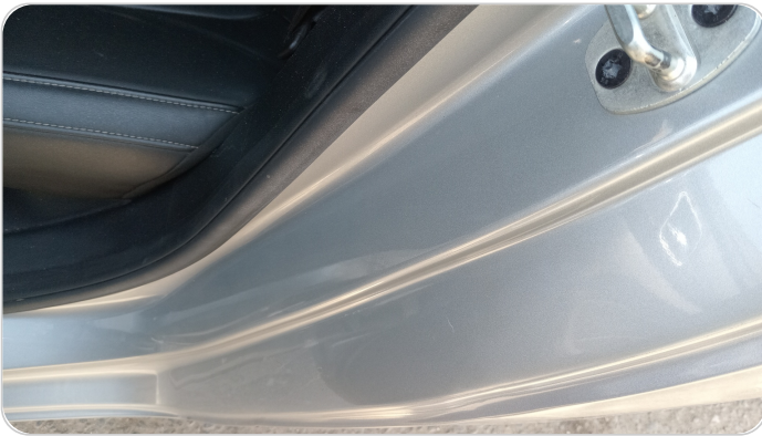
دواخل وقوائم باب الخلفي شمال : فبريكة (خرابيش)