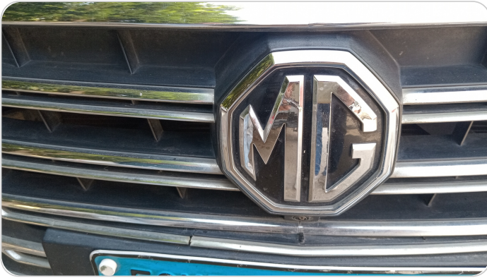
شبكة أمامية : الدهان / النيكل (متآكل)