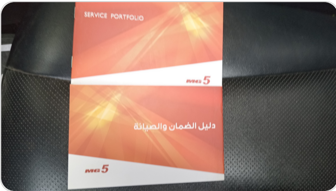
كتيب الضمان : موجود