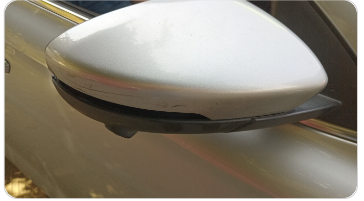
مراية الباب الأمامي يمين : فبريكة (خرابيش)