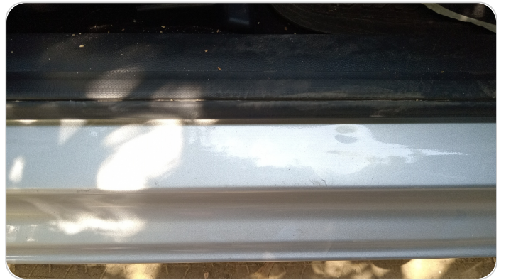
دواخل وقوائم باب أمامي يمين : فبريكة (خرابيش)