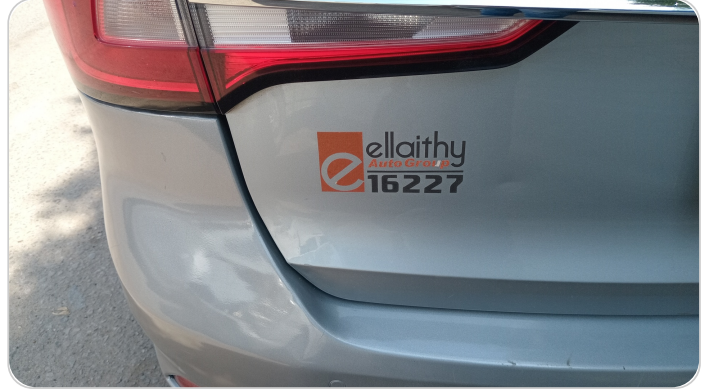
باب الشنطة : فبريكة ( خرابيش _ خبطات )