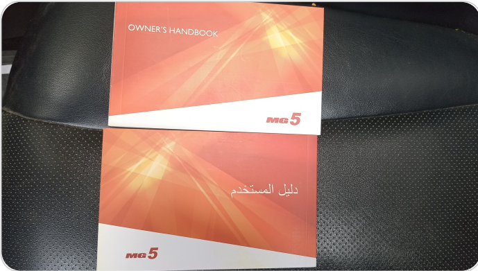
كتالوج السيارة : موجود