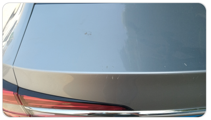
باب الشنطة : فبريكة ( خرايبش _خبطات )