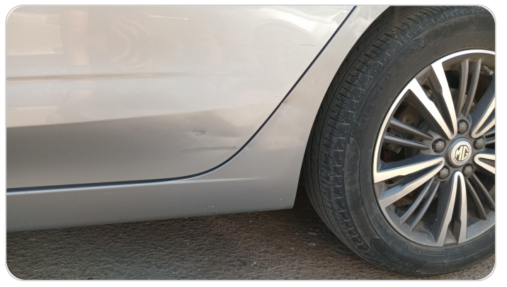
العتب السفلي شمال : رش بدون معجون (خبطات)