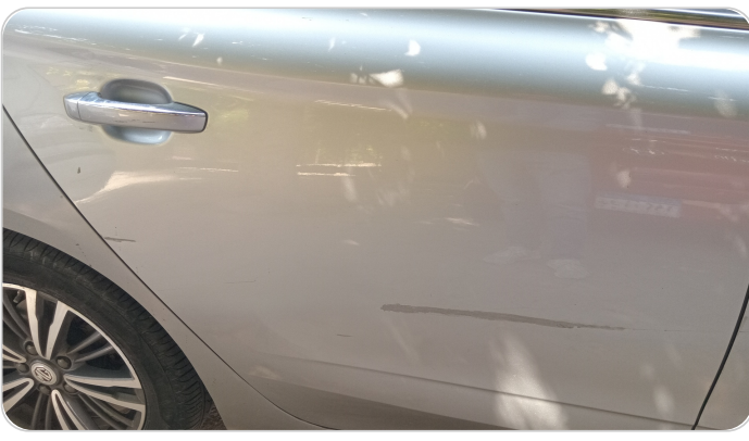
الباب الخلفي يمين : رش بدون معجون (خبطات)