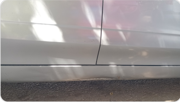
العتب السفلي يمين : رش بدون معجون (خبطات)