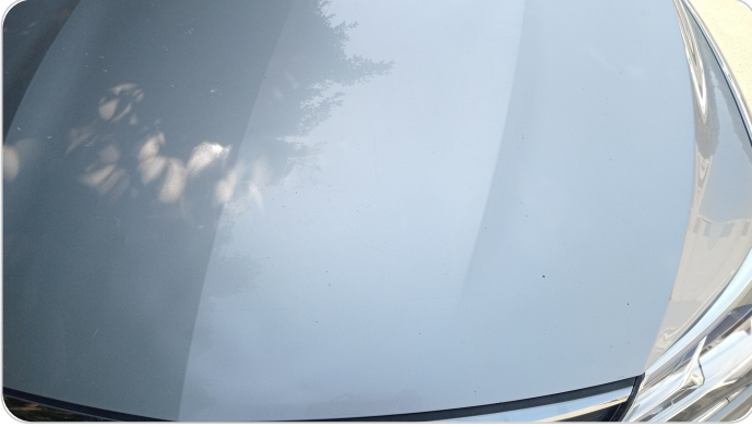
الكبوت : فبريكة (خرابيش)