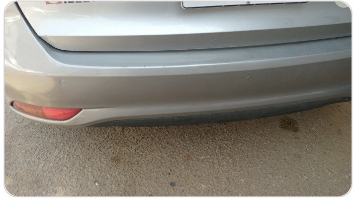
الاكصدام الخلفي : رش بدون معجون (خرابيش)