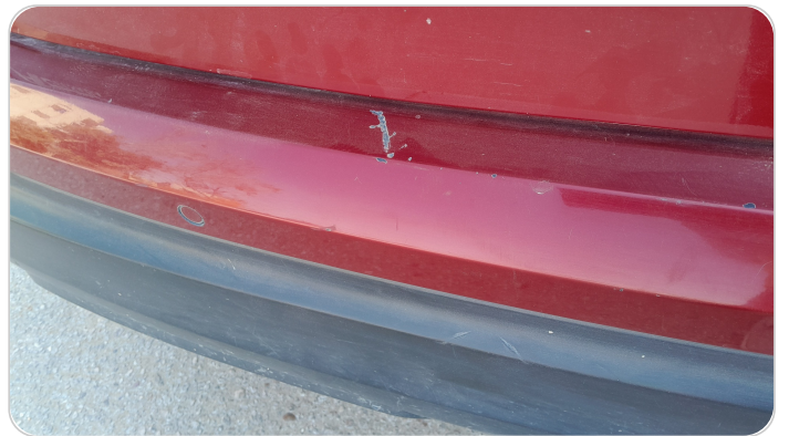
الاكصدام الخلفي : رش بدون معجون (خرابيش)