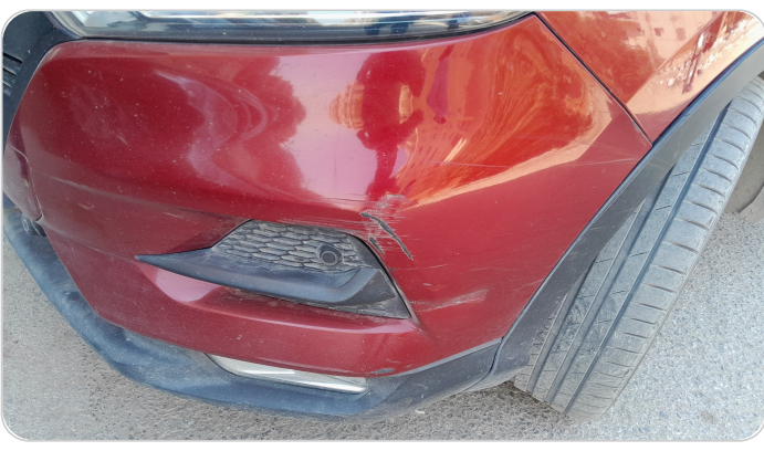
الاكصدام الأمامي : رش بدون معجون (خبطات)