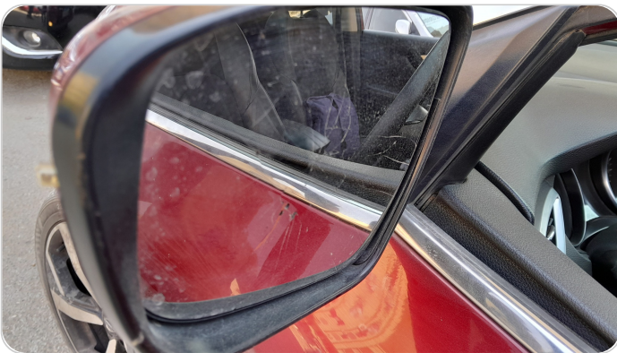
مراية الباب الأمامي شمال : كسر/فقد (زجاج المراية)