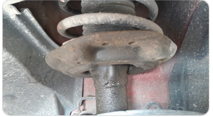
مساعدين أمامي : تسريب زيت