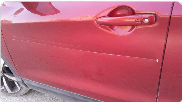
الباب الأمامي شمال : رش بدون معجون (خبطات)