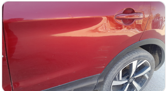
الباب الخلفي شمال : رش بدون معجون (خبطات)