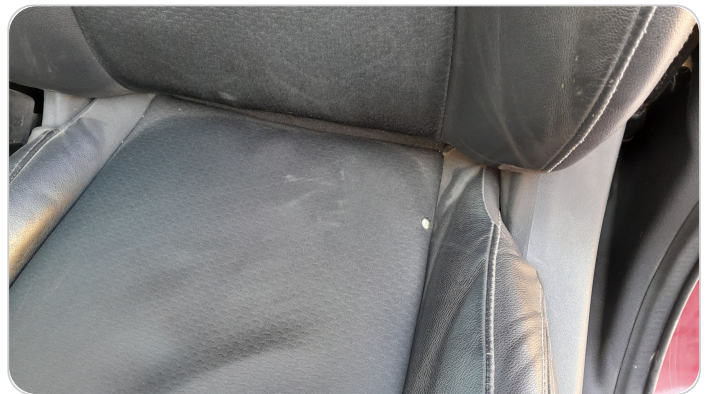
فرش كرسي أمامي شمال : قطع / كسر / شرخ / تلف