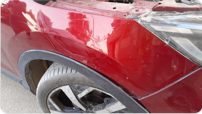
الرفرف الأمامي يمين : رش مع معجون (خبطات)