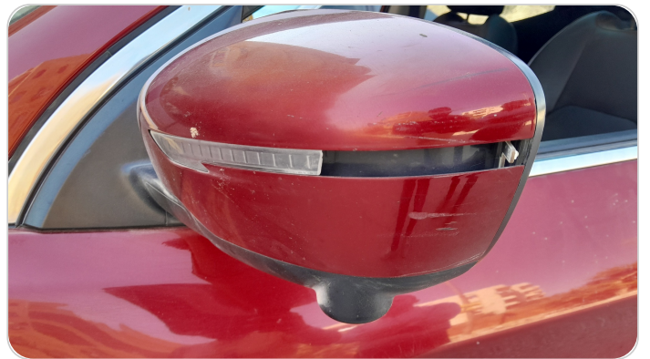
كشافات إشاره أمامي : كسر بالباغة