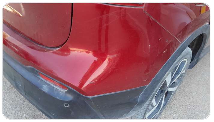
الاكصدام الخلفي : رش بدون معجون (خرابيش)