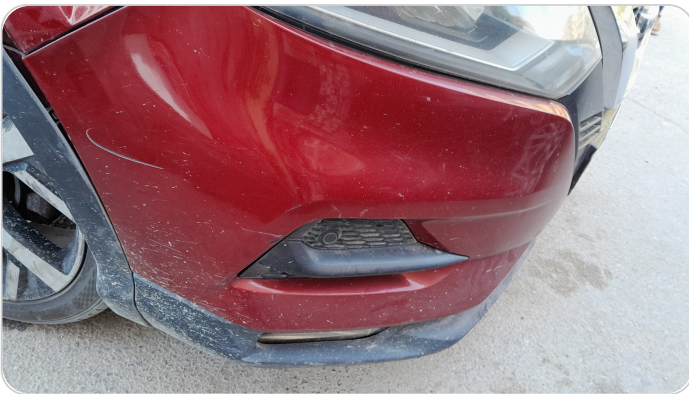
الاكصدام الامامي : رش بدون معجون (خرابيش)