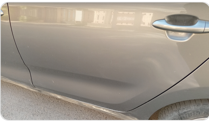
الباب الخلفي شمال : فبريكة (خرابيش)