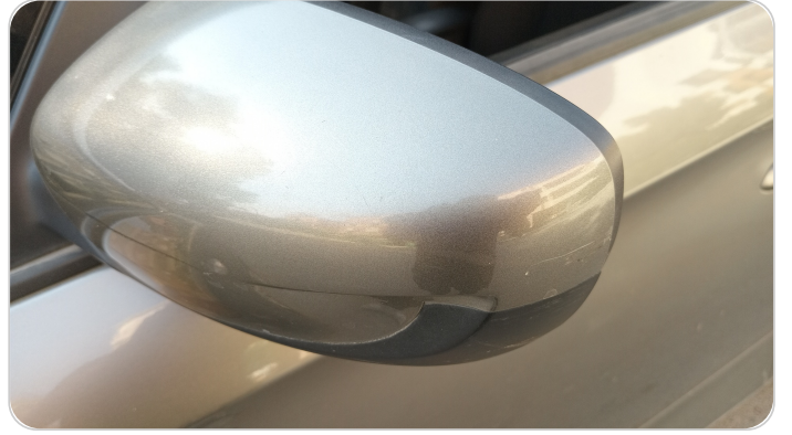
مرآة الباب الأمامي شمال : فبريكة (خرابيش)