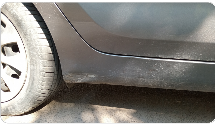
العتب السفلي يمين : فبريكة (صدمة كبيرة)