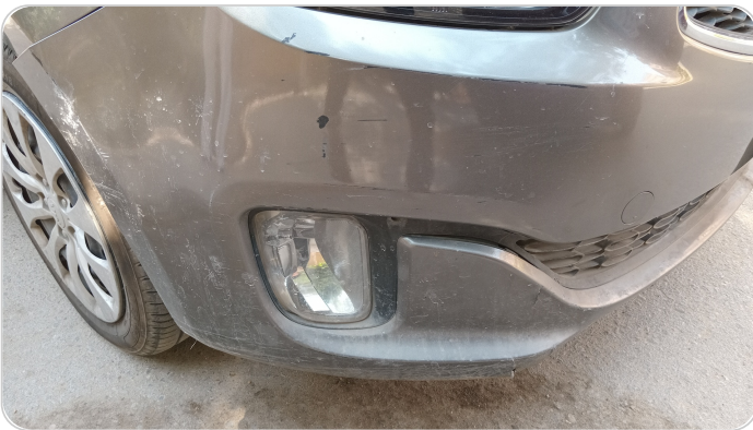
الكصدام الأمامي : فبريكة (خرابيش - خبطات)