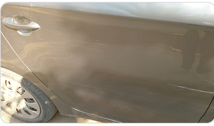
الباب الخلفي يمين : فبريكة (خرابيش - خبطات)