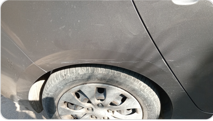
الرفرف الخلفي يمين : فبريكة (خرابيش)