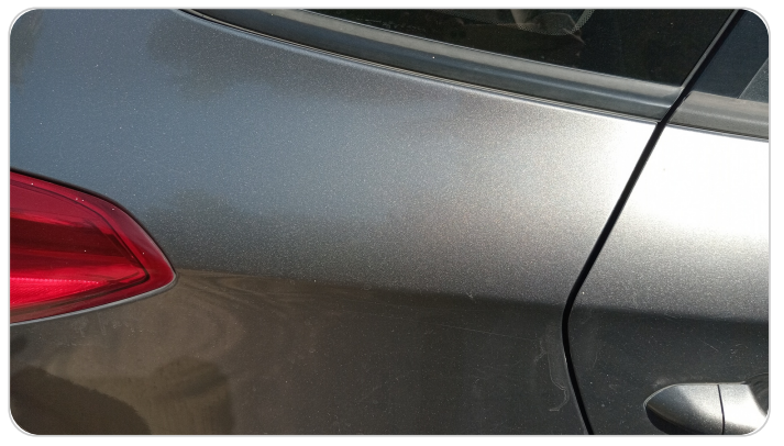
قائم خارجي خلفي يمين : فبريكة ( خرابيش )