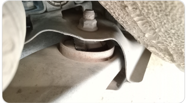
مقصات أمامي سفلي : تشققات / قطع (الجلب)