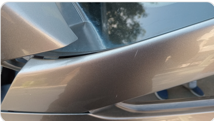
قائم خارجي أمامي شمال : فبريكة (خرابيش)