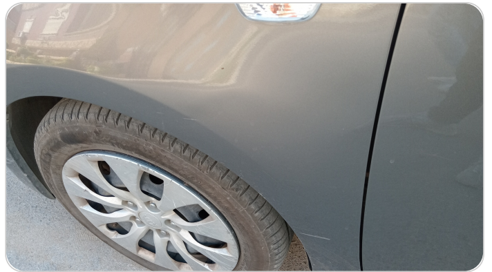
الرفرف الأمامي شمال : فبريكة (خرابيش)