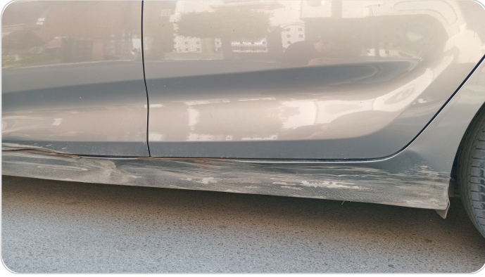
العتب السفلي شمال : فبريكة (صدمة كبيرة)