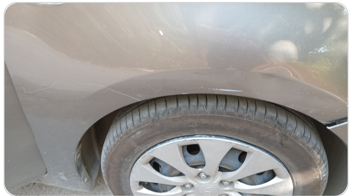
الرفرف الأمامي يمين : فبريكة (خرابيش - خبطات)