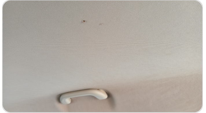
فرش السقف : قطع / كسر / شرخ / تلف