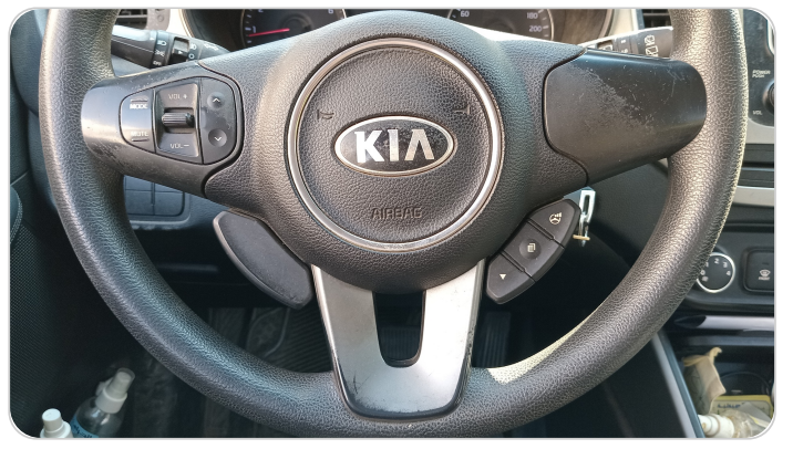
الطاره : بها خدوش