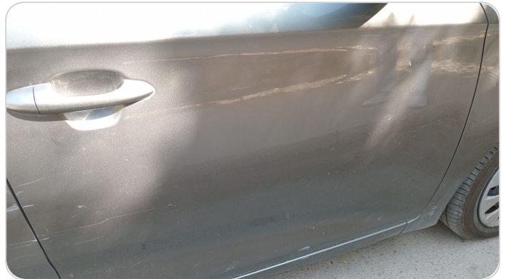
الباب الأمامي يمين : فبريكة (خرابيش)