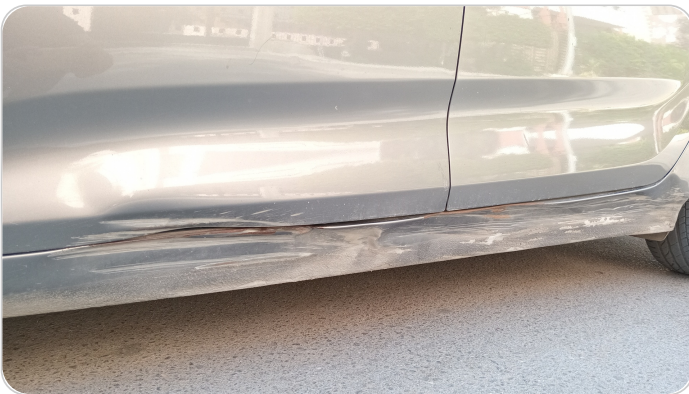
العتب السفلي شمال : فبريكة (صدمة كبيرة)