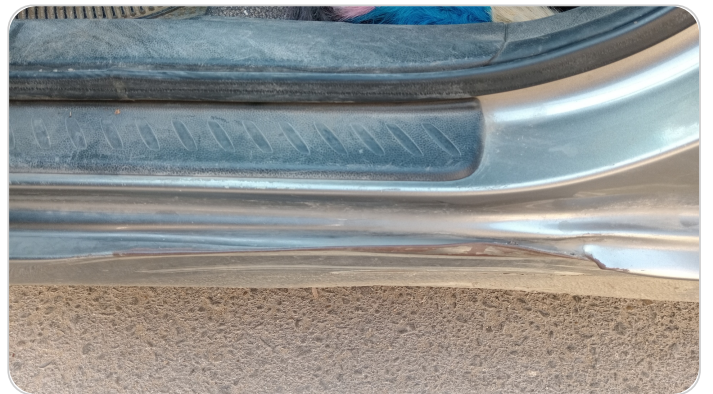
دواخل وقوائم باب الأمامي شمال : فبريكة (خرابيش)