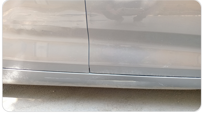
العتب السفلي يمين : فبريكة (صدمة كبيرة)