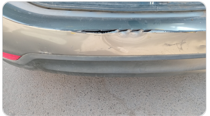
الاكصدام الخلفي : فبريكة (صدمة كبيرة)