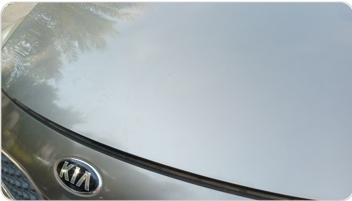
الكبوت : فبريكة (خرابيش)