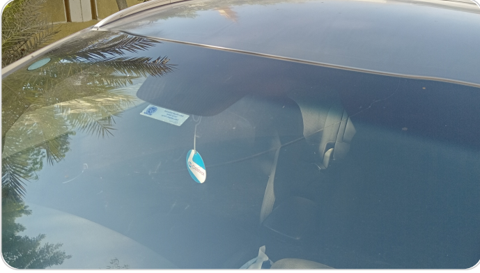
زجاج السيارة الأمامي : شروخ أو كسور