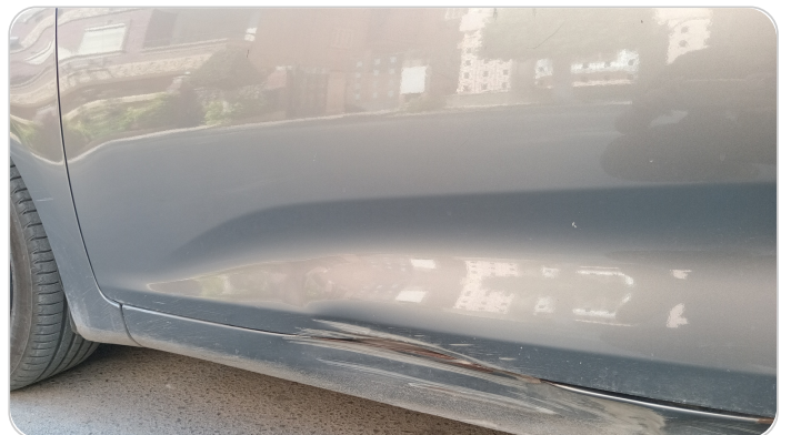
الباب الأمامي شمال : فبريكة (خرابيش - خبطات)