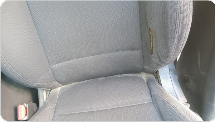
فرش كرسي أمامي شمال : قطع / كسر / شرخ / تلف