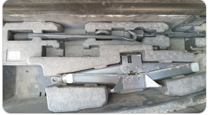
العدة وأدوات الأمان : متوفرة (بحالة جيدة)