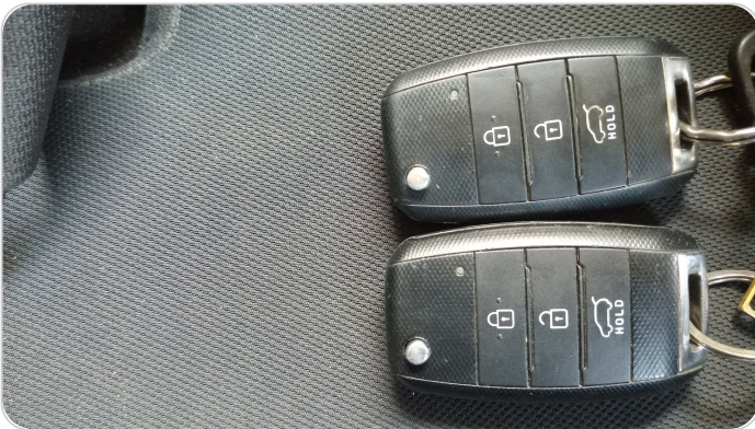
الريموت /المفتاح الاضافي : يعمل بكفاءة