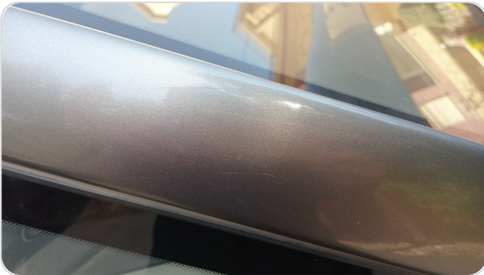
قائم خارجي أمامي يمين : فبريكة (خرابيش)