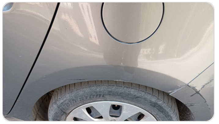
الرفرف الخلفي شمال : فبريكة (خرابيش)