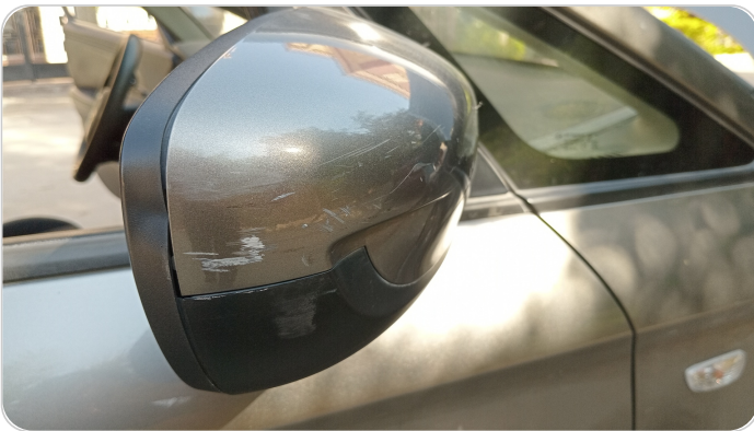
مرآة الباب الأمامي يمين : فبريكة (خرابيش)