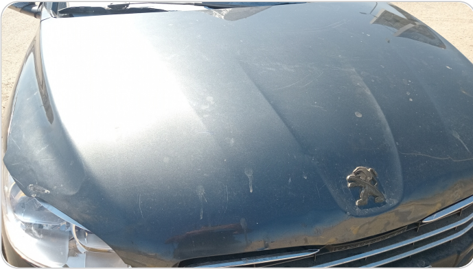
الكبوت : فبريكة (خرايش - خبطات)