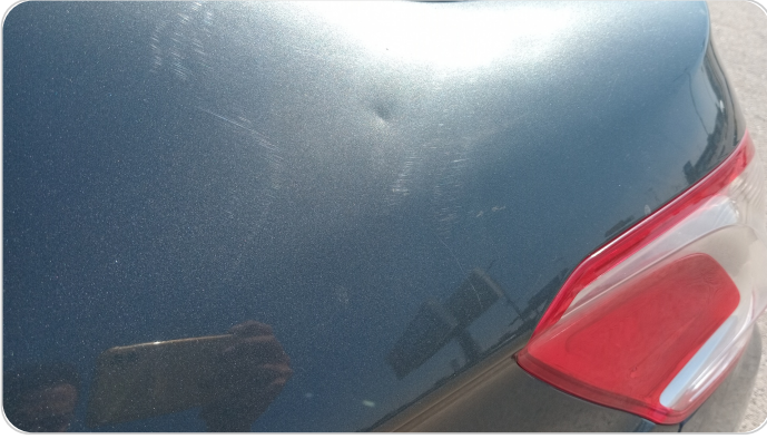
قائم خارجي خلفي شمال : رش بدون معجون (خبطات)