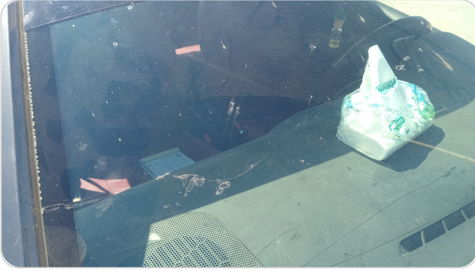
زجاج السيارة الأمامي : شروخ أو كسور