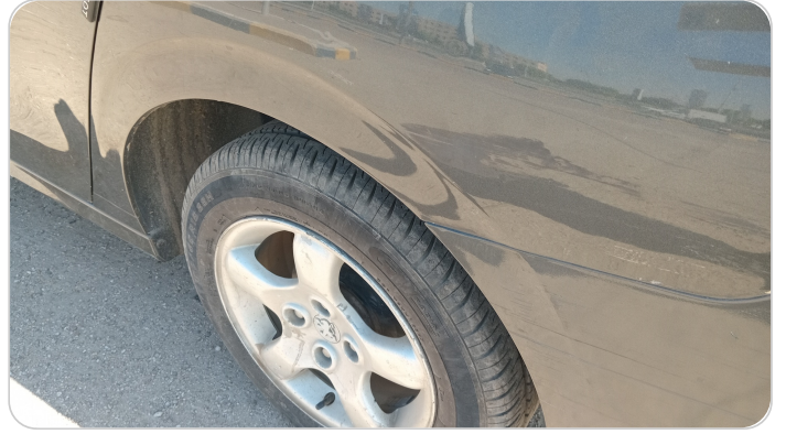
الرفرف الخلفي شمال : رش مع معجون (خرابيش)