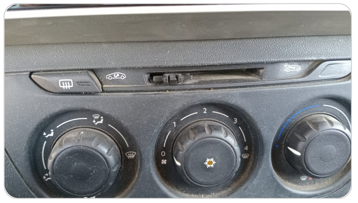
الكونسول الوسط : قطع /كسر/ شرخ /تلف