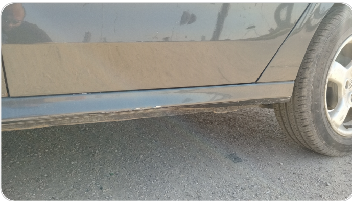
العتب السفلي شمال : فبريكة (خرابيش - خبطات)