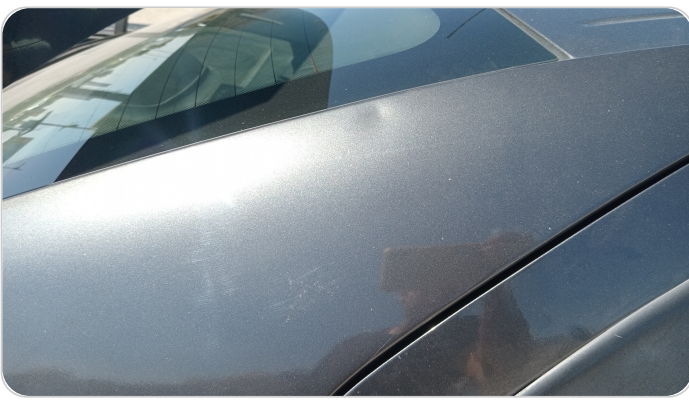
قائم خارجي خلفي يمين : رش بدون معجون (خبطات)