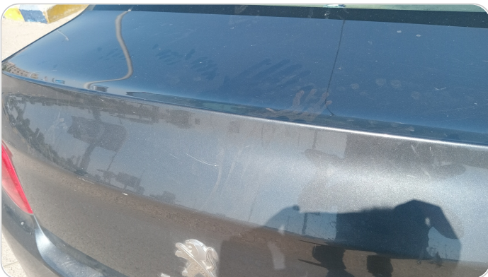
باب الشنطة : فبريكة (خرايش)