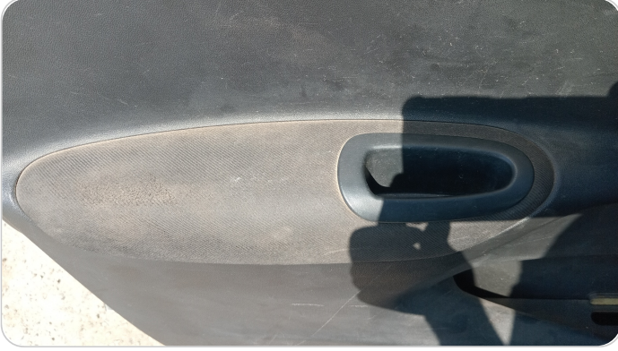
فرش الباب الأمامي شمال : قطع/كسر/شرخ/تلف