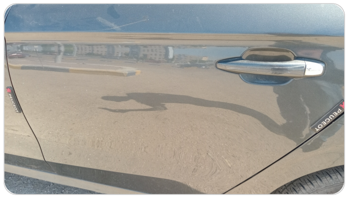
الباب الخلفي شمال : رش مع معجون (خرابيش)