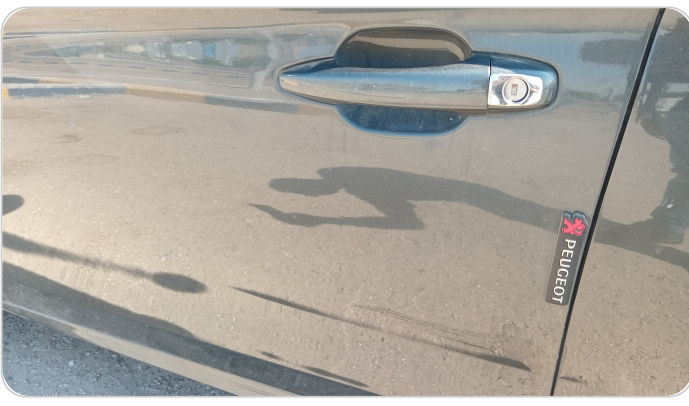
الباب الأمامي شمال : رش مع معجون (خرابيش)