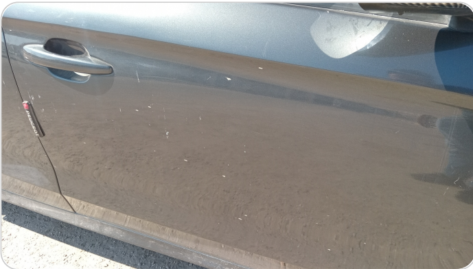
الباب الأمامي يمين : رش مع معجون (خرابيش)