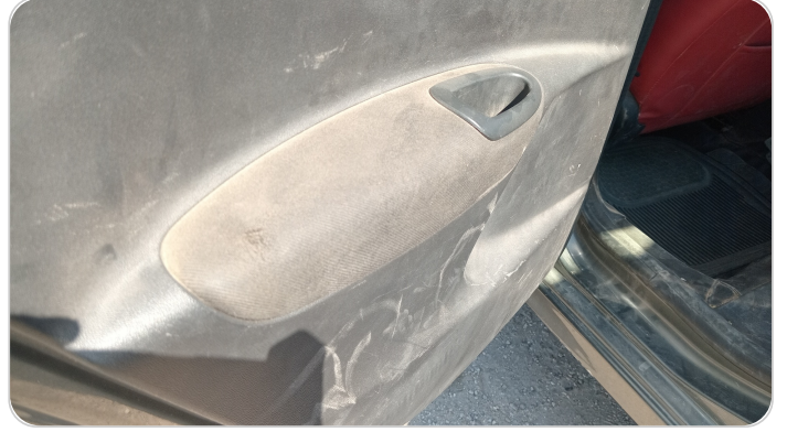
فرش الباب الخلفي شمال : قطع/كسر/شرخ/تلف