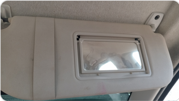
شماسات أمامية : تلف في اليمين