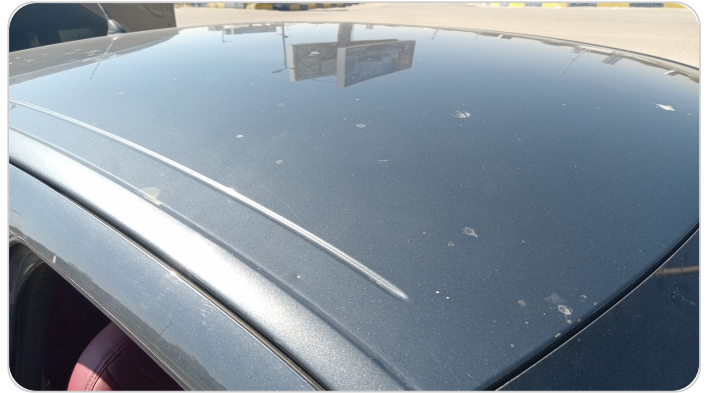
السقف : فبريكة (خرايش)