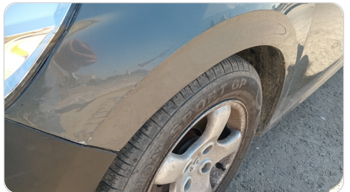
الرفرف الأمامي شمال : فبريكة (خرايش - خبطات)