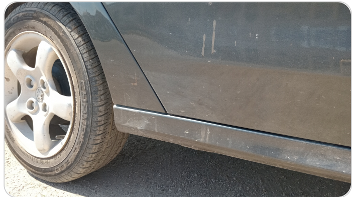
العتب السفلي يمين : رش بدون معجون (خرابيش)