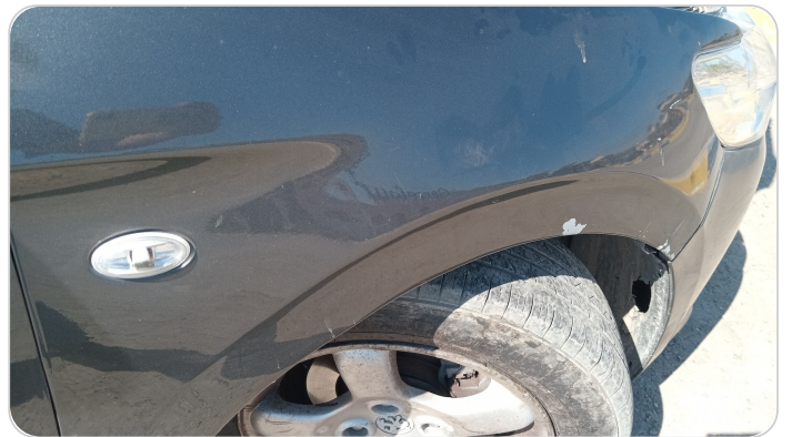
الرفرف الأمامي يمين : رش مع معجون (خبطات)