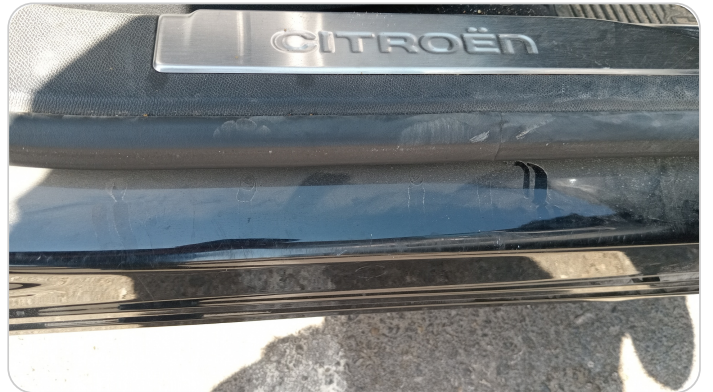
دواخل وقوائم باب أمامي يمين : فبريكة (خرابيش)