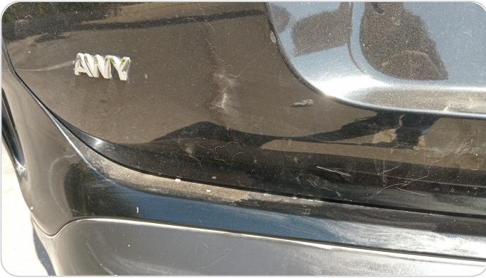
باب الشنطة : فبريكة (خرابيش)