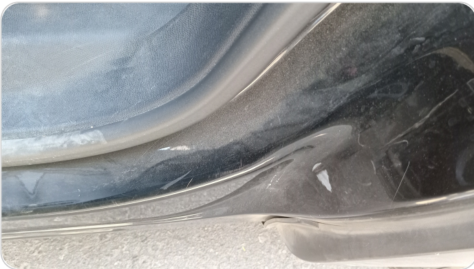
دواخل وقوائم باب الخلفي شمال : فبريكة (خرابيش)