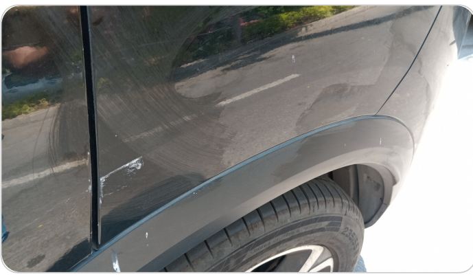
الرفرف الخلفي شمال : فبريكة (خرابيش)