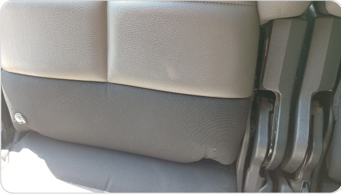
فرش كنبه خلفي : قطع /كسر /شرخ /تلف