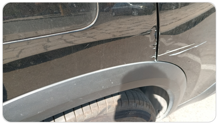
الرفرف الخلفي يمين : فبريكة (خرابيش - خبطات)