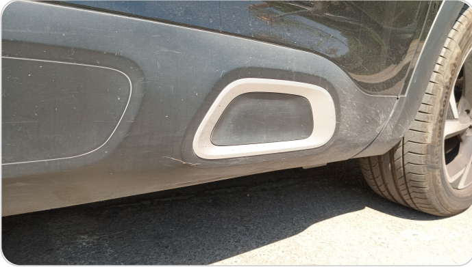
العتب السفلي يمين : فبريكة (خرابيش)