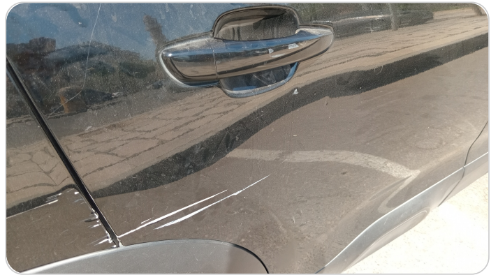
الباب الخلفي يمين : فبريكة (خرابيش - خبطات)