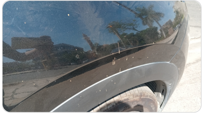
الرفرف الأمامي يمين : فبريكة (خرابيش)