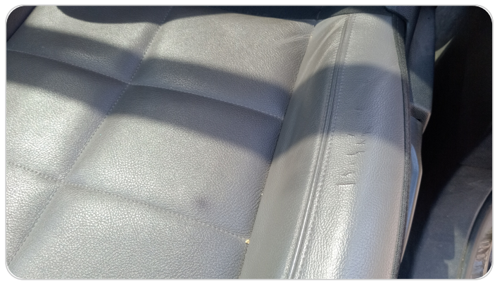
فرش كرسي أمامي شمال : قطع /كسر / شرخ /تلف