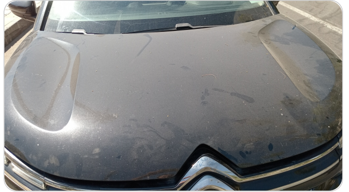
الكبوت : فبريكة (خرابيش)