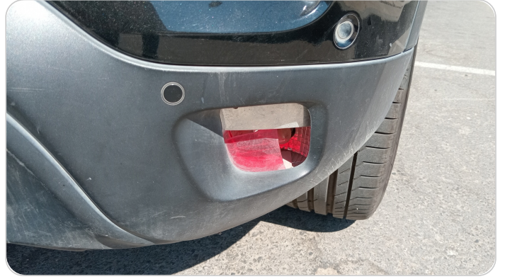
كشافات شبورة خلفي : كسر بالباغة