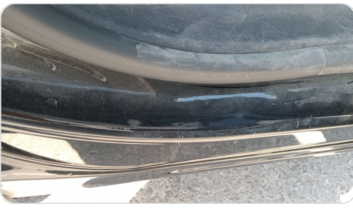
دواخل وقوائم باب خلفي يمين : فبريكة (خرابيش)