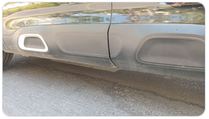
العتب السفلي شمال : فبريكة (خرابيش)