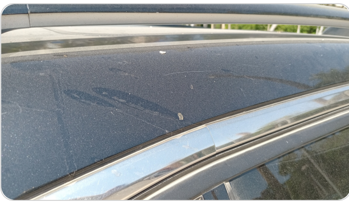
قائم خارجي خلفي يمين : فبريكة ( خرابيش )