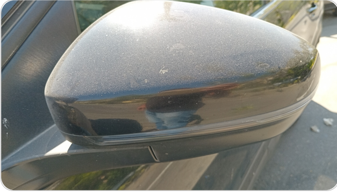
مرآة الباب الأمامي شمال : فبريكة (خرابيش)