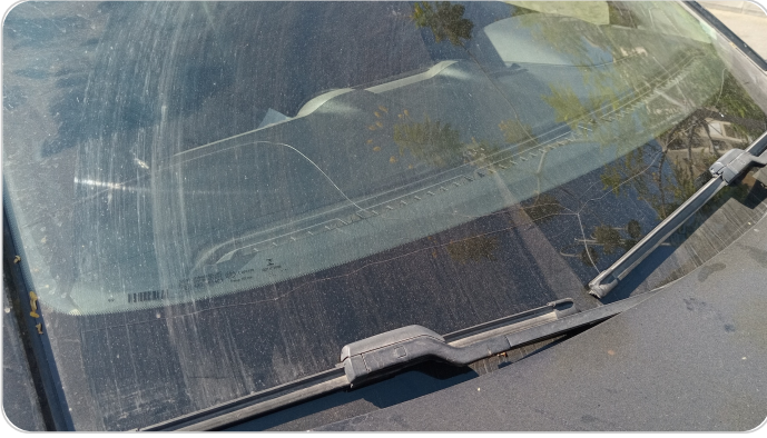
زجاج السيارة الأمامي : شروخ أو كسور