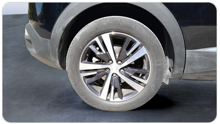
RR R TIRE