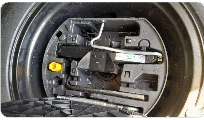
العدة وأدوات الأمان : متوفرة (بحالة جيدة)