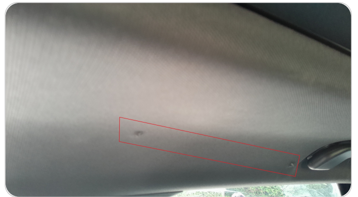
فرش السقف : قطع بسيط