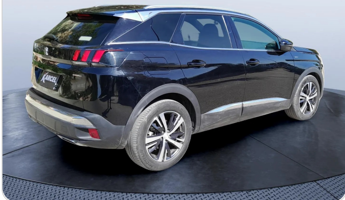
RR R 45