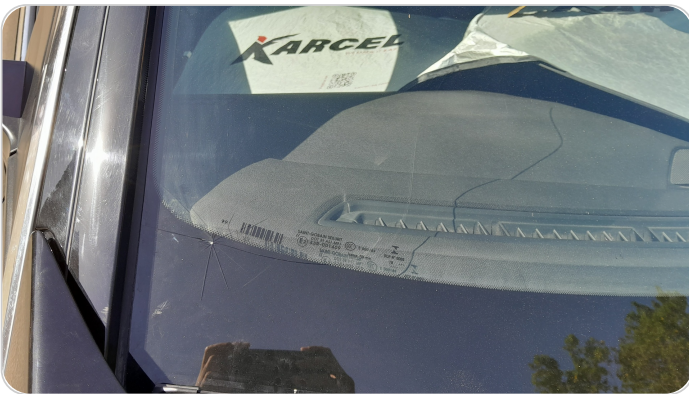
زجاج السيارة الأمامي : شروخ أو كسور