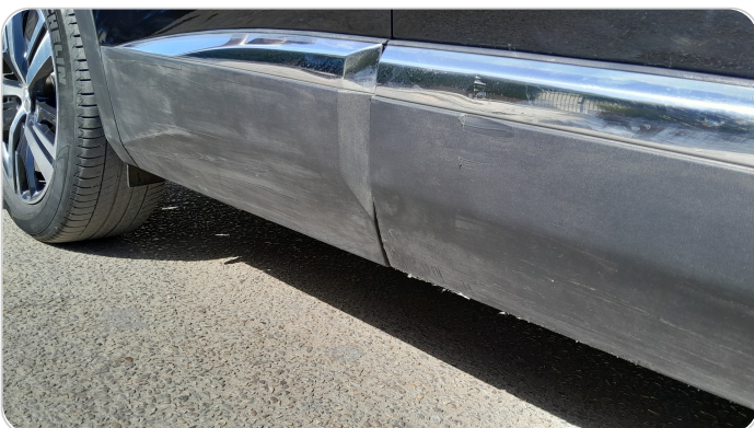
العتب السفلي يمين : فبريكة (خرابيش)