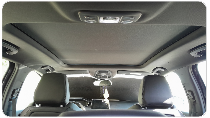
CAR ROOF MAT