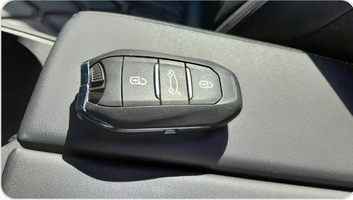
حالة الريموت / المفتاح : يعمل بكفاءة