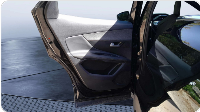
RR L DOOR