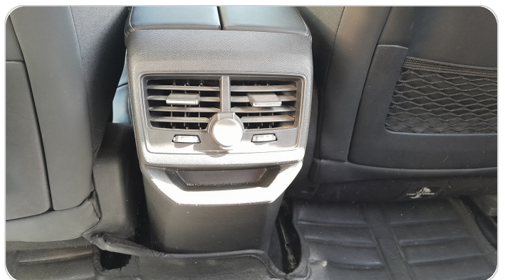
RR AC GRILL