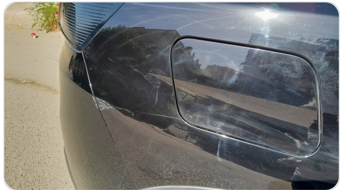
الرفرف الخلفي يمين : فبريكة (خرابيش)