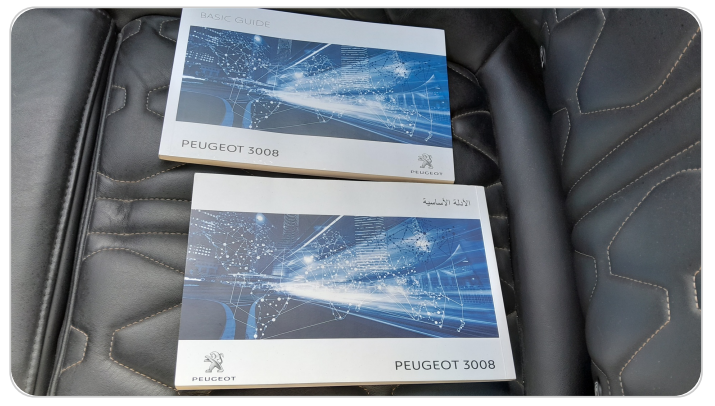
كتالوج السيارة : موجود