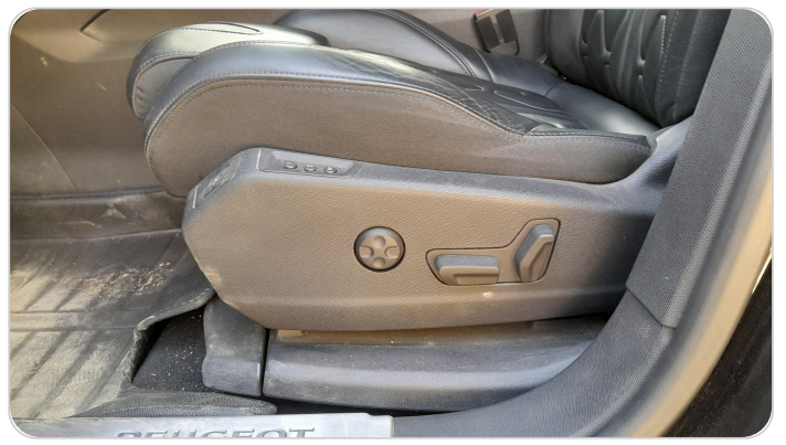
DRIVER SEAT SWITCHES