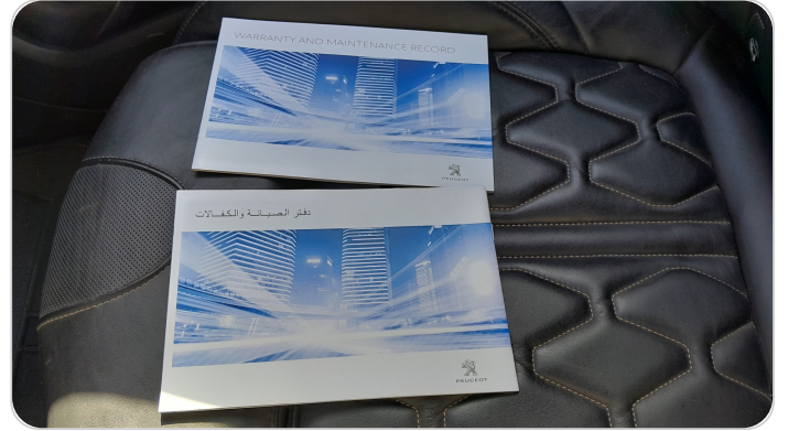
كتيب الضمان : موجود