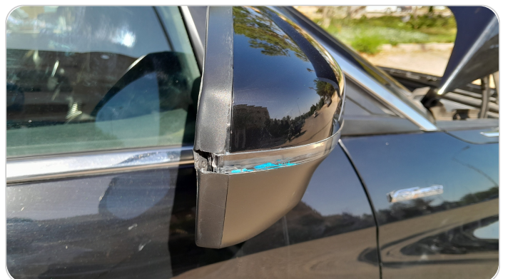
مرآة الباب الأمامي يمين : كسر في الغطاء