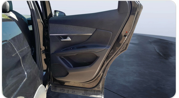
RR R DOOR