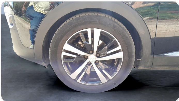
FR L TIRE