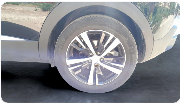
RR L TIRE