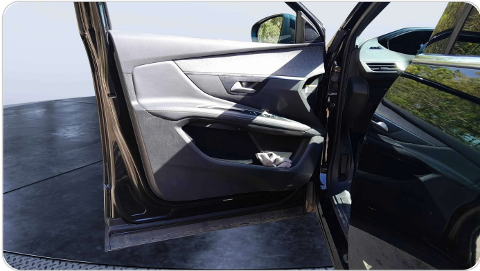
FR L DOOR