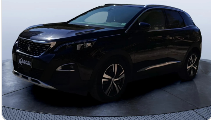
FR L 45