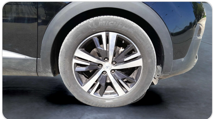
FR R TIRE