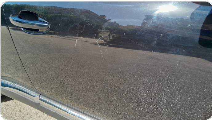
الباب الأمامي يمين : فبريكة (خرابيش)