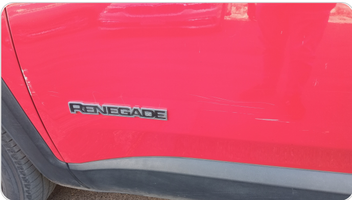
الباب الأمامي شمال : فبريكة (خرابيش)