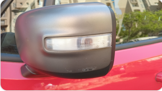
مراية الباب الأمامي شمال : فبريكة (خرايش)