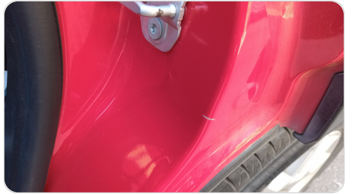
دواخل وقوائم باب الخلفي شمال : فبريكة (خرابيش)