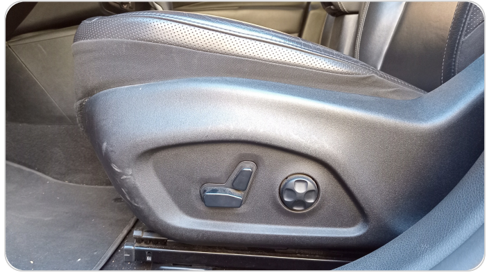
DRIVER SEAT SWITCHES