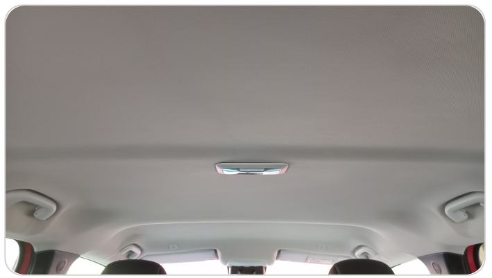
CAR ROOF MAT