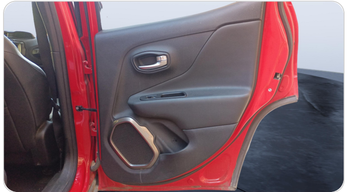
RR R DOOR