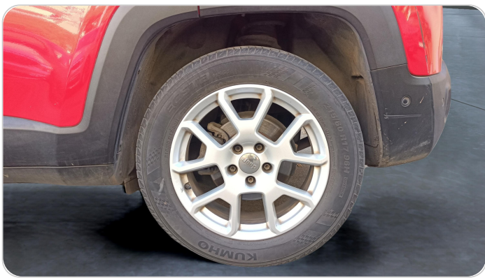
RR L TIRE