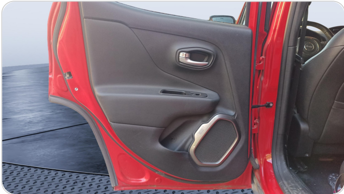
RR L DOOR