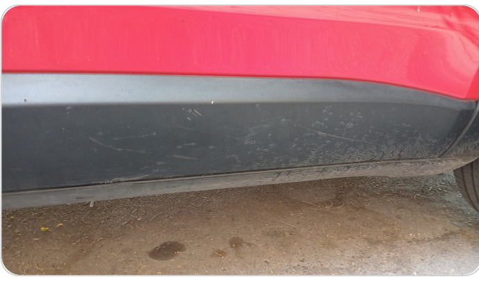
العتب السفلي يمين : فبريكة (خرابيش)