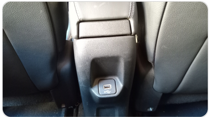
RR AC GRILL