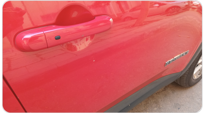
الباب الأمامي يمين : فبريكة (خرايش)