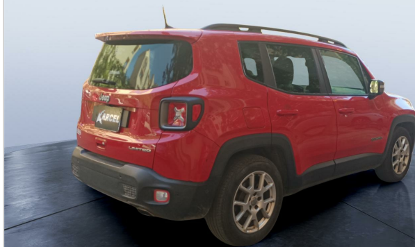
RR R 45