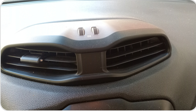
هوايات التكييف : كسر (هواية واحدة)