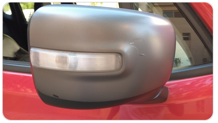
مراية الباب الأمامي يمين : فبريكة (خرابيش)