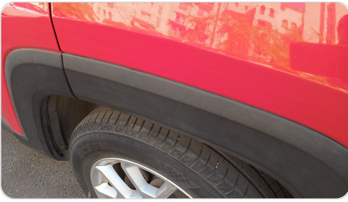
الرفرف الخلفي شمال : فبريكة (خرايش)