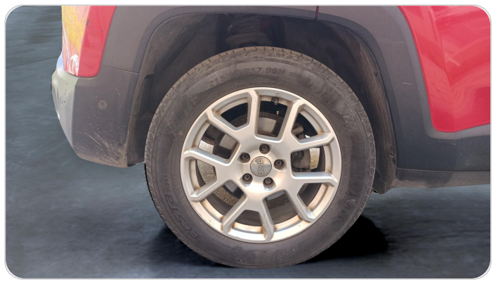
RR R TIRE