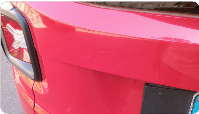
باب الشنطة : فبريكة (خرابيش)