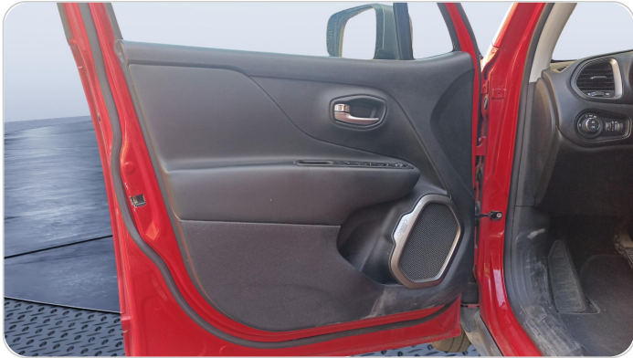
FR L DOOR