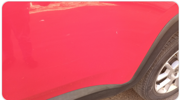
الباب الخلفي شمال : فبريكة (خرابيش)