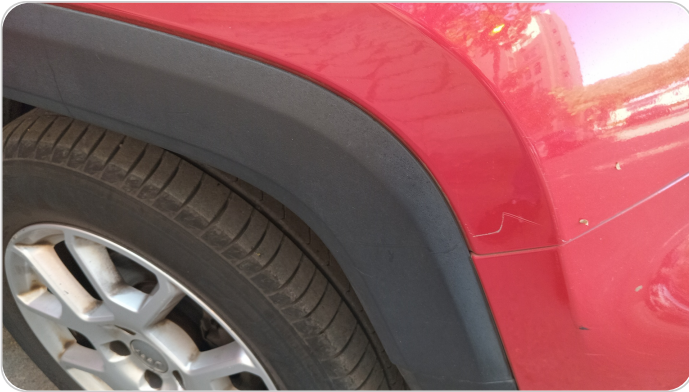
الرفرف الأمامي يمين : فبريكة (خرايش)