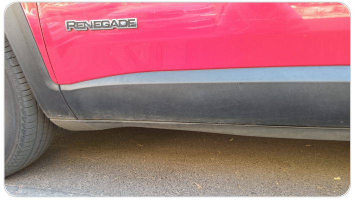
العتب السفلي شمال : فبريكة (خرايش)