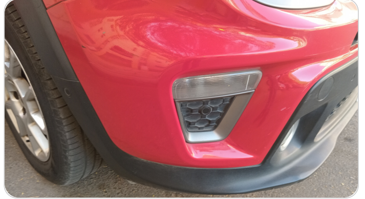
الكصدام الأمامي : فبريكة (خرايش)