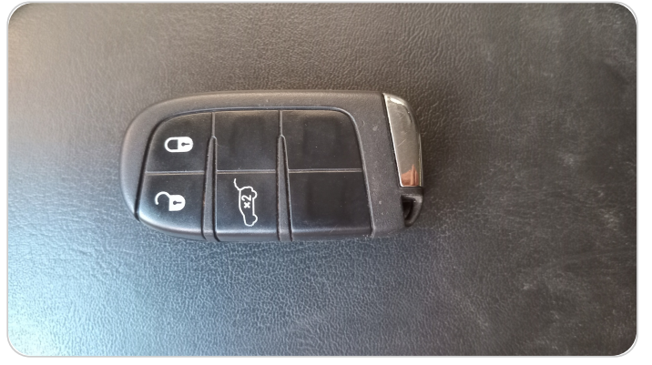
حالة الريموت / المفتاح : يعمل بكفاءة