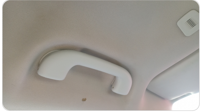
فرش السقف : قطع /كسر/ شرخ /تلف