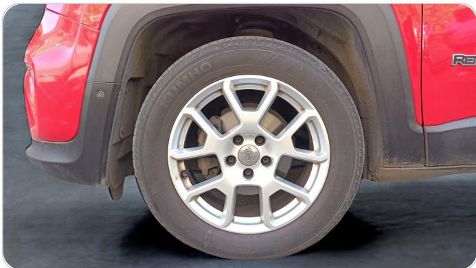
FR L TIRE