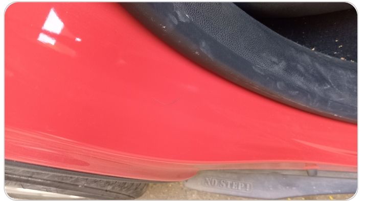
دواخل وقوائم باب خلفي يمين : فبريكة (نقرة)