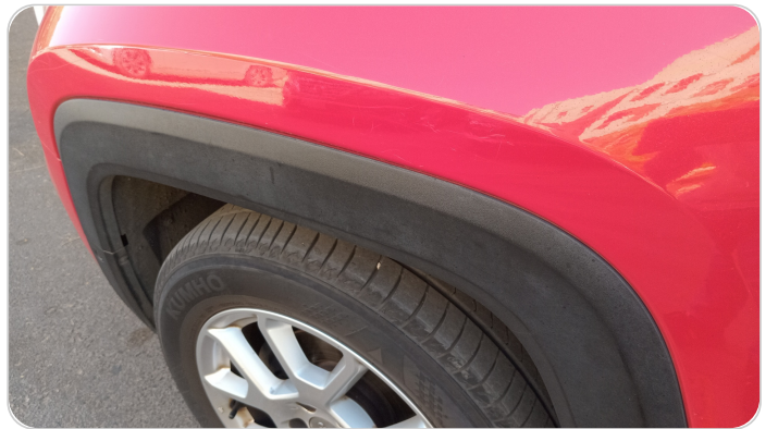
الرفرف الأمامي شمال : فبريكة (خرابيش)