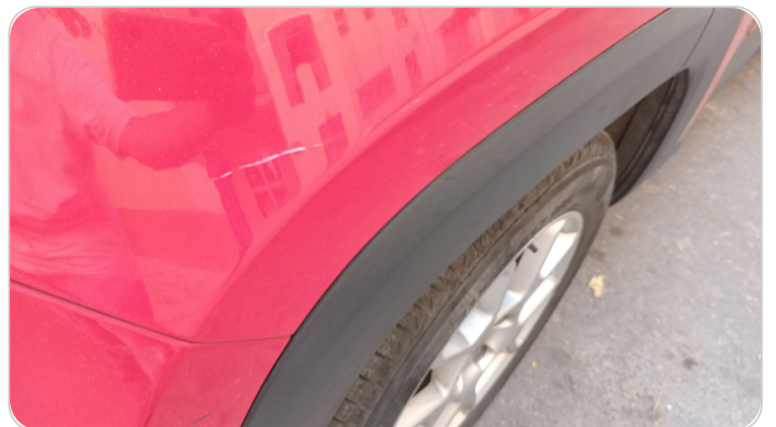
الرفرف الخلفي يمين : فبريكة (خرايش)