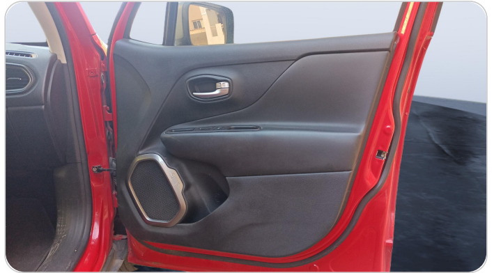
FR R DOOR