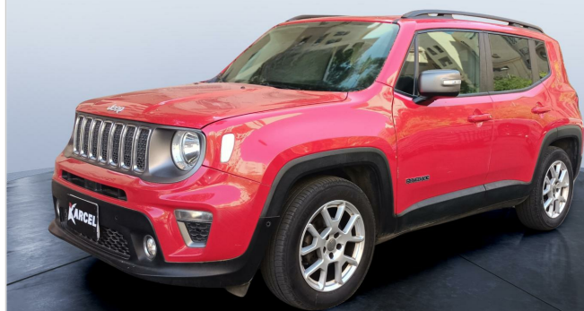
FR L 45