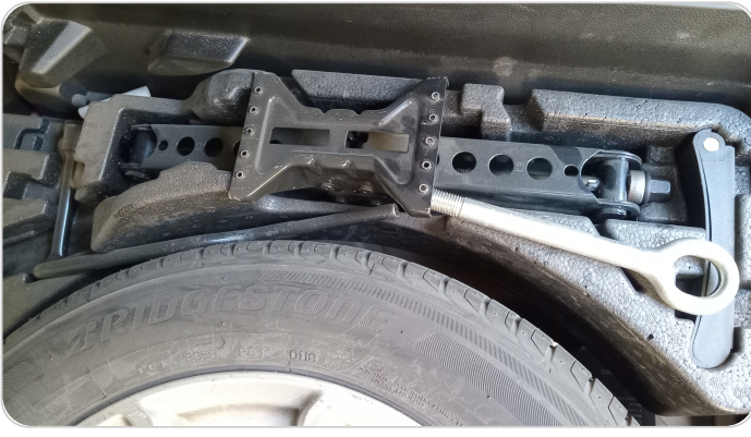
العدة وأدوات الأمان : متوفرة (بحالة جيدة)