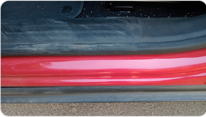
دواخل وقوائم باب الأمامي شمال : فبريكة (خرابيش)