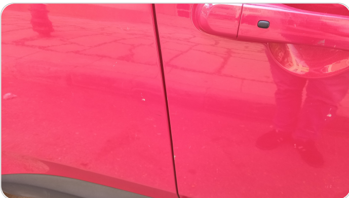
الباب الخلفي يمين : فبريكة (خرايش)