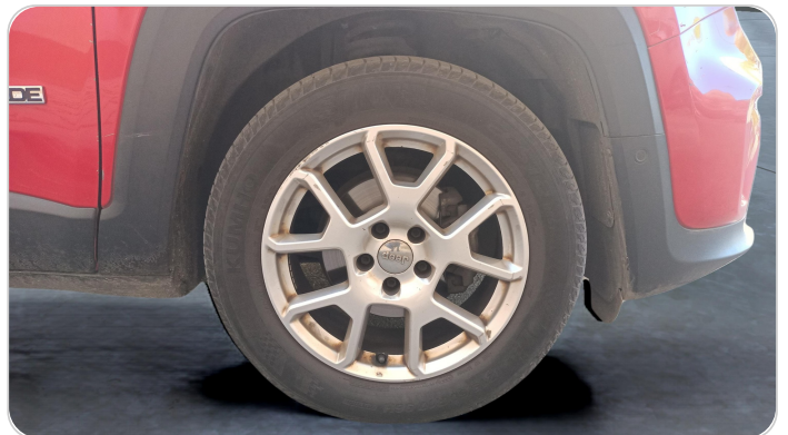
FR R TIRE