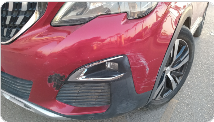
الاكصدام الأمامي : فبريكة (خرابيش - خبطات)