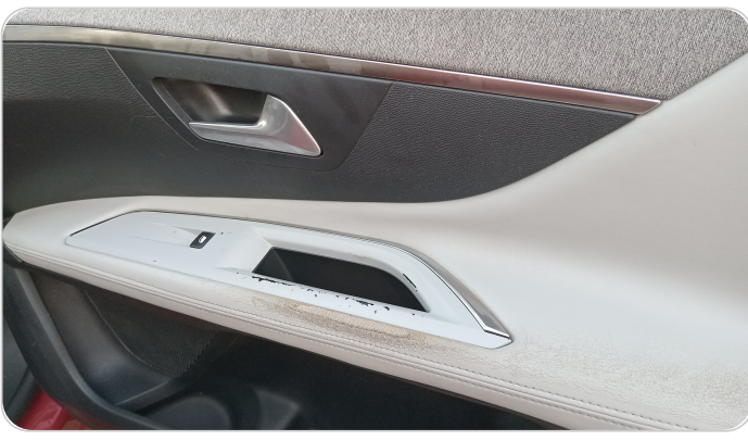
فرش الباب الأمامي يمين : قطع / كسر / شرخ / تلف