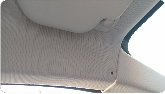
فرش السقف : قطع / كسر / شرخ / تلف