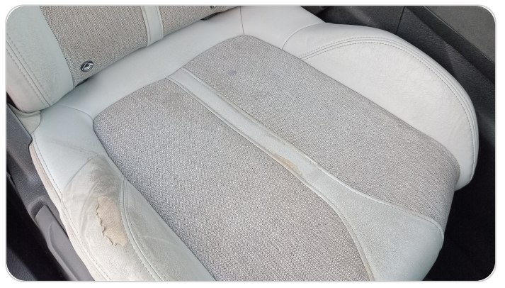
فرش كرسي أمامي يمين : قطع / كسر / شرخ / تلف