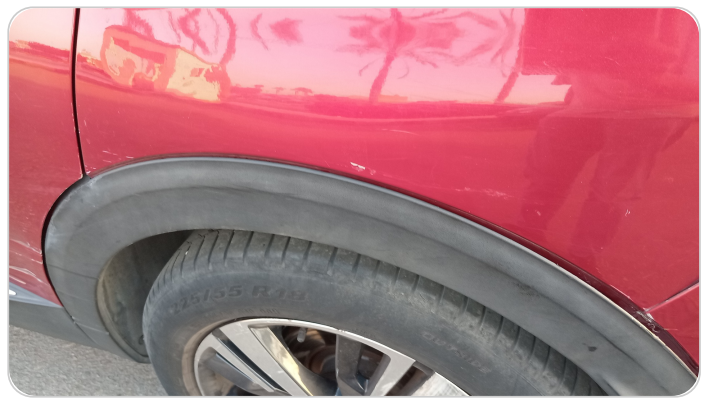
الرفرف الخلفي شمال : فبريكة (خرابيش - خبطات)