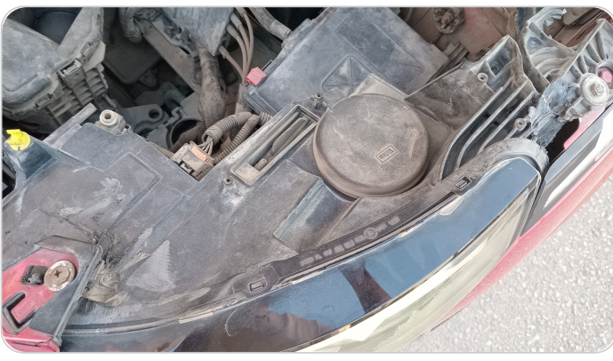
الكشاف الأمامي شمال : كسر في قواعد الكشاف