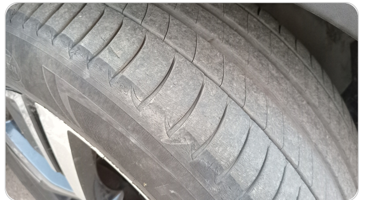
حالة الكاوتش الأمامي : النقشة متآكلة