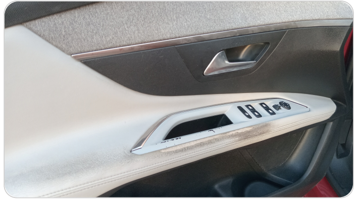
فرش الباب الأمامي شمال : قطع/كسر/شرخ/تلف