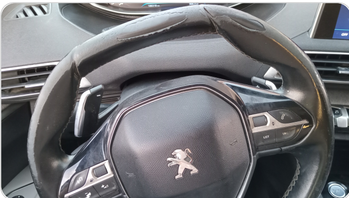
الطاره : متاكله