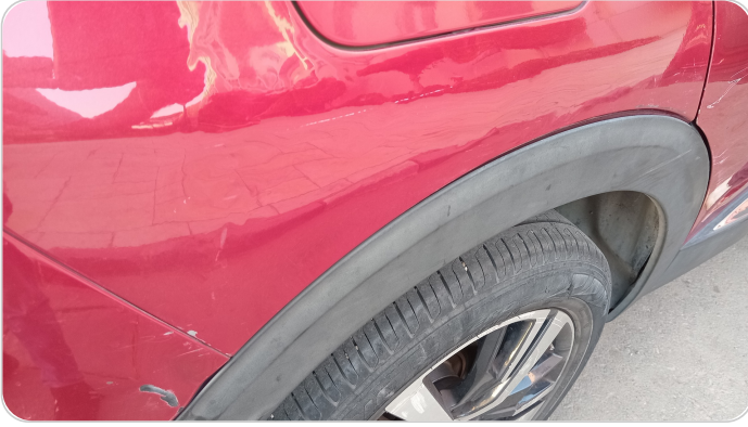
الرفرف الخلفي يمين : فبريكة (خرابيش - خبطات)