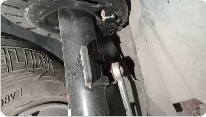
ذراع الميزان : تشققات (كاوتش الميزان)