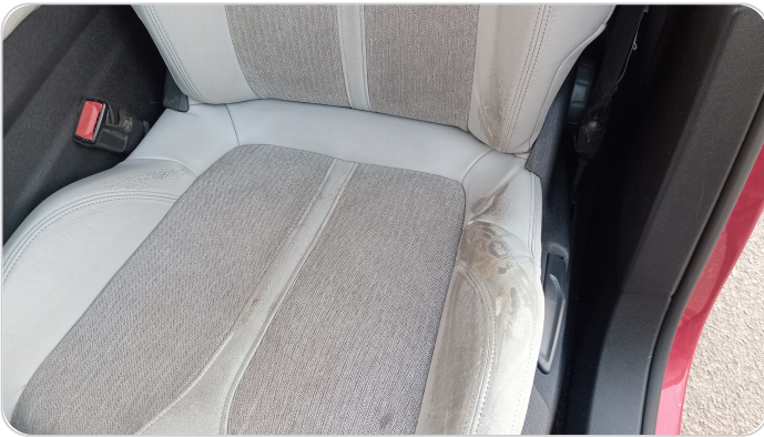
فرش كرسي أمامي شمال : قطع / كسر / شرخ / تلف