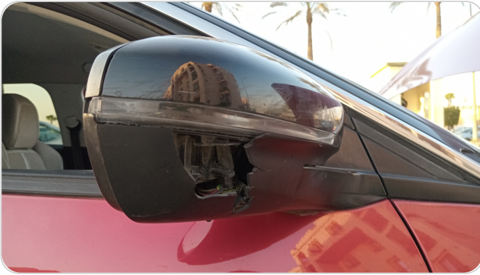
مراية الباب الأمامي يمين : كسر في الغطاء