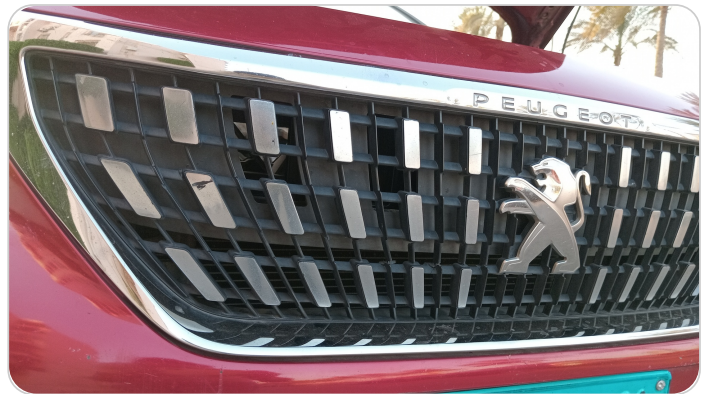
شبكة أمامية : الدهان / النيكل (متآكل)