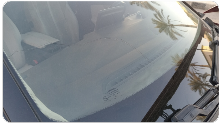
زجاج السيارة الأمامي : شروخ أو كسور