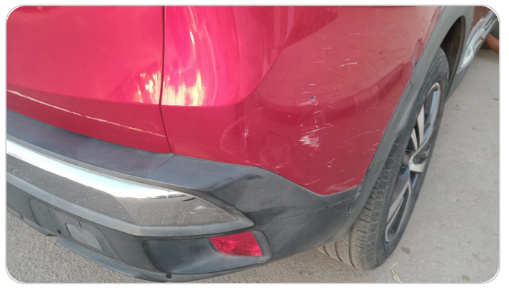
الاكصدام الخلفي : فبريكة (خرابيش - خبطات)