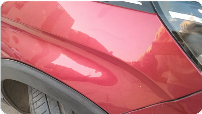
الرفرف الأمامي يمين : فبريكة (خرابيش - خبطات)