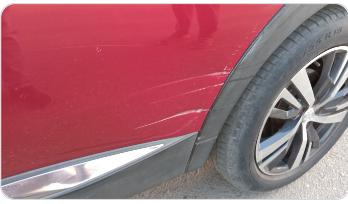
الباب الخلفي شمال : فبريكة (خرابيش - خبطات)