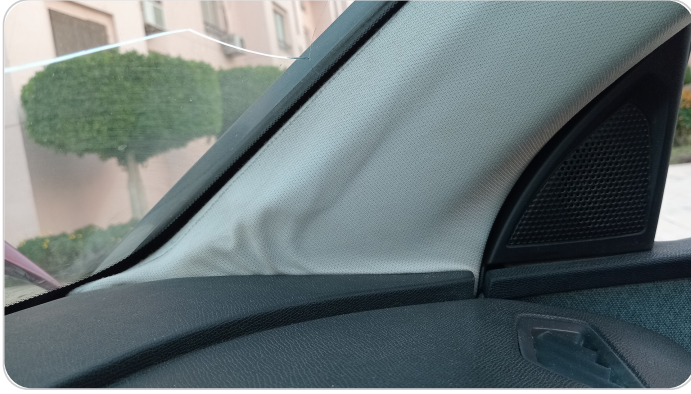
فيبر قائم أمامي يمين : قطع / كسر / شرخ / تلف