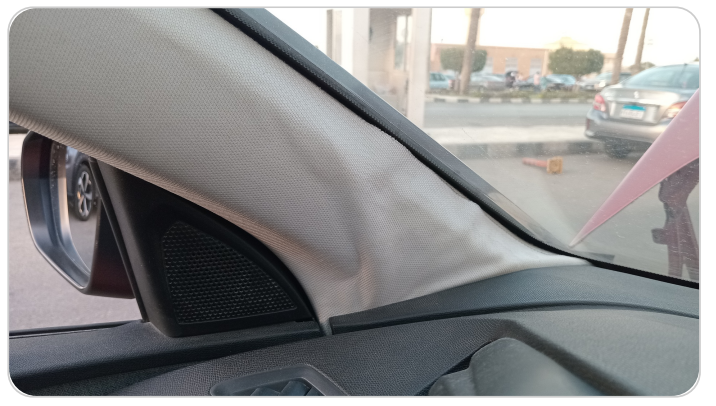
فيبر قائم أمامي شمال : قطع / كسر / شرخ / تلف