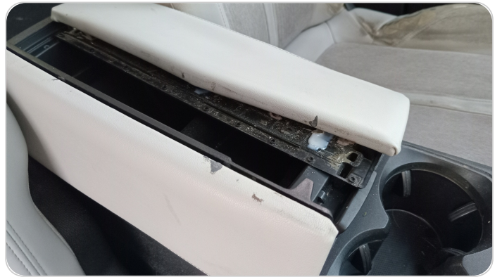
الكونسول الوسط : قطع / كسر / شرخ / تلف