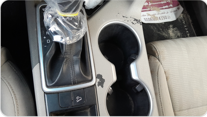
الكنسلول الوسطي : خدوش