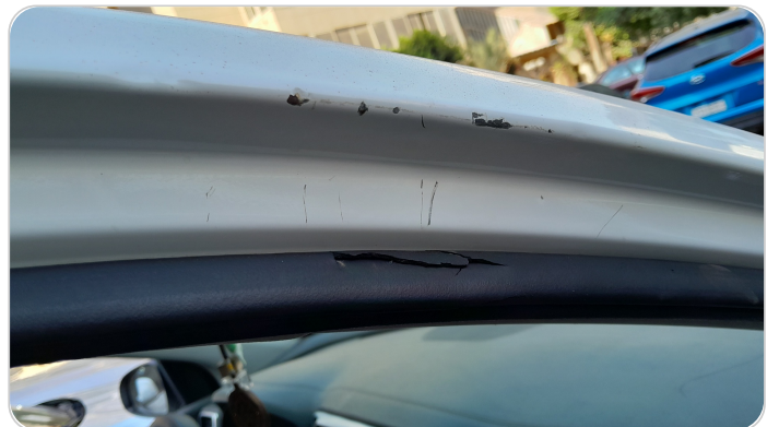
دواخل وقوائم باب أمامي يمين : فبريكة (خرابيش)