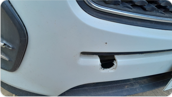
الاكصدام الامامي : فقد في الطية