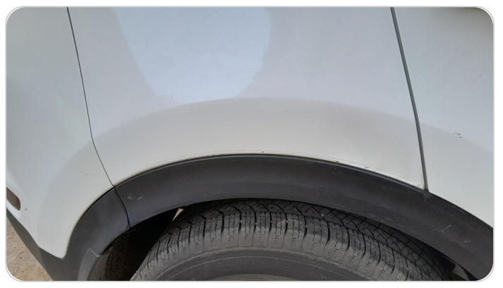
الرفرف الخلفي يمين : فبريكة (خرابيش)