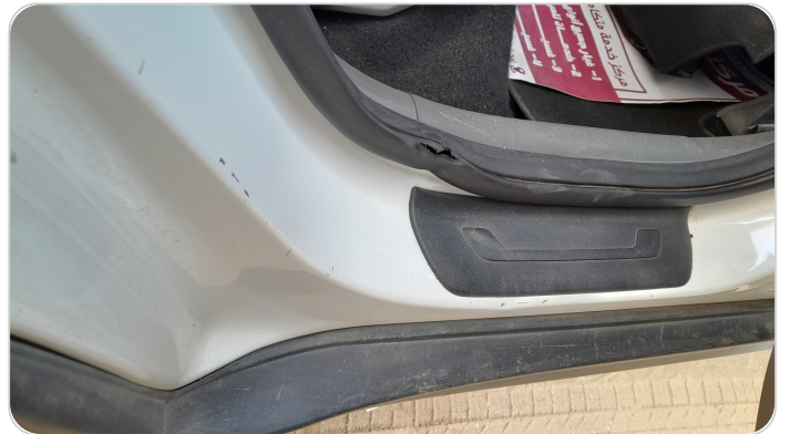
دواخل وقوائم باب خلفي يمين : فبريكة (خرابيش)