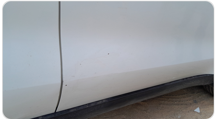
الباب الأمامي يمين : فبريكة (خرابيش)