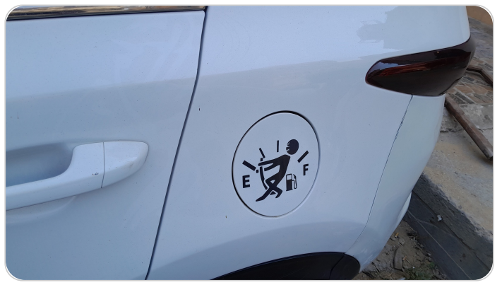
باب التتڭ : يوجد استيكر