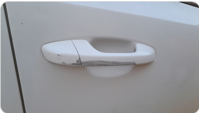
الباب الأمامي يمين : فبريكة (خرابيش)