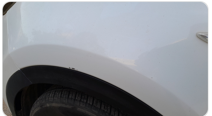
الرفرف الأمامي شمال : فبريكة (خرابيش)