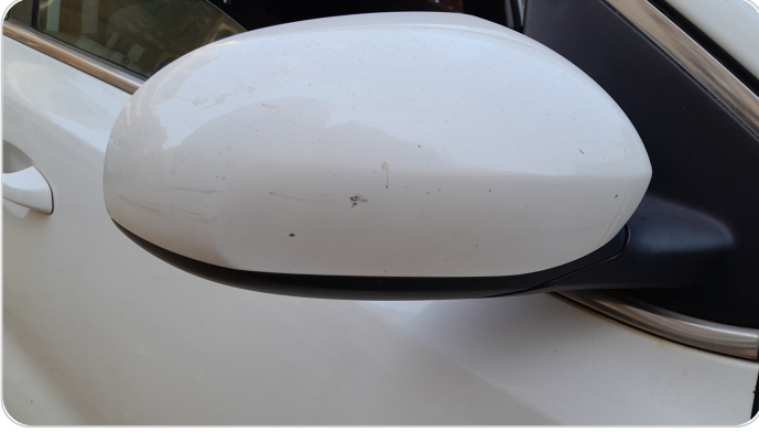
مراية الباب الأمامي يمين : فبريكة (خرابيش)