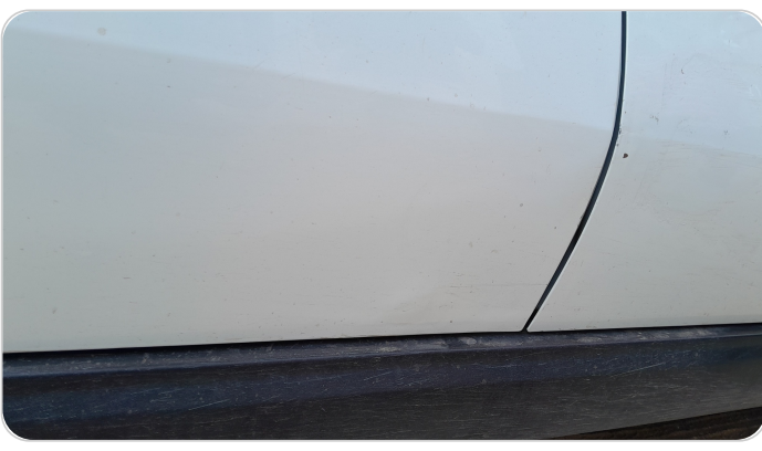
الباب الخلفي يمين : فبريكة (خرابيش)