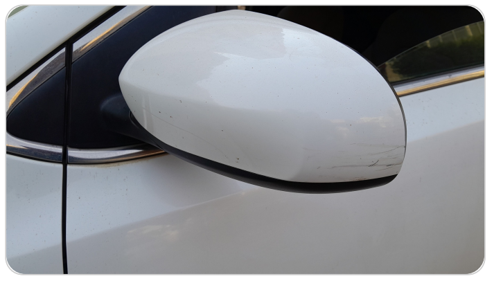
مراية الباب الأمامي شمال : فبريكة (خرابيش)