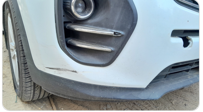
الاكصدام الأمامي : رش مع معجون (خرابيش)