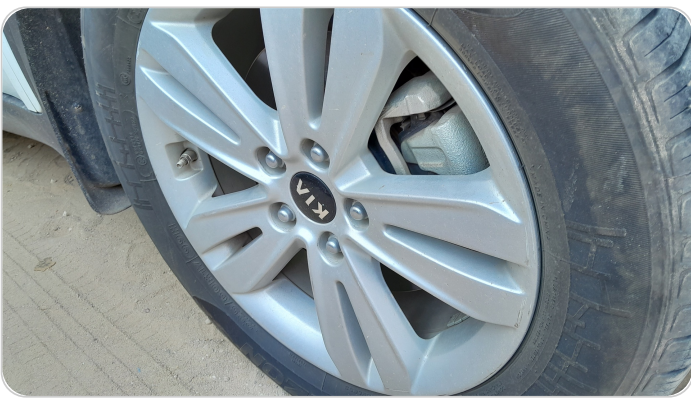
حالة الجنوط الأمامي : تجريحات بسيطة