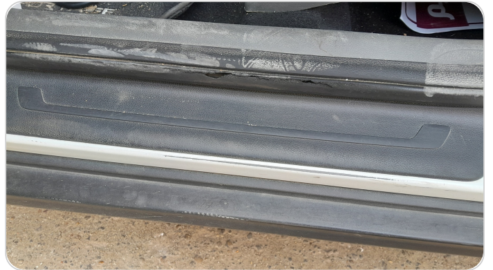
دواخل وقوائم باب الأمامي شمال : فبريكة (خرابيش)