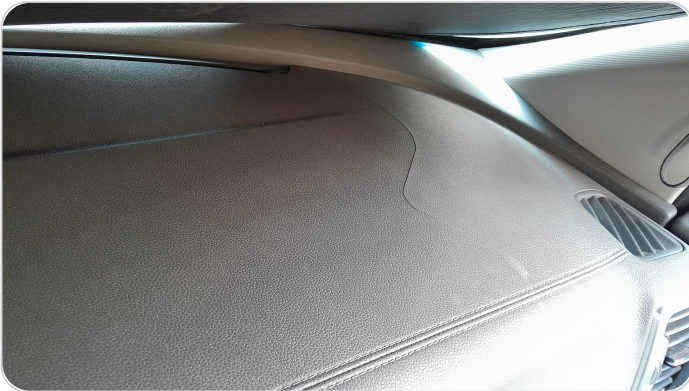
التابلوه : قطع / كسر / تلف / شرخ