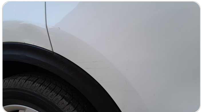
الباب الخلفي يمين : فبريكة (خرابيش)