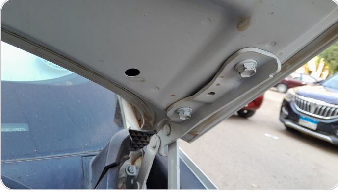
مفصلات ومسامير الكبوت : آثار فك وتركيب