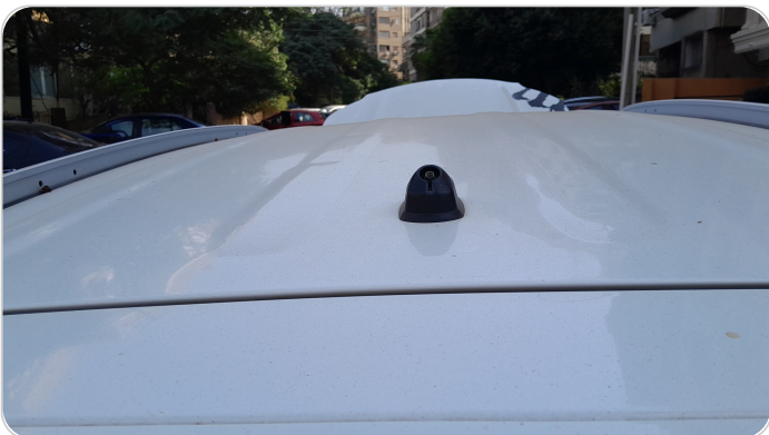
الاريلال : فقد