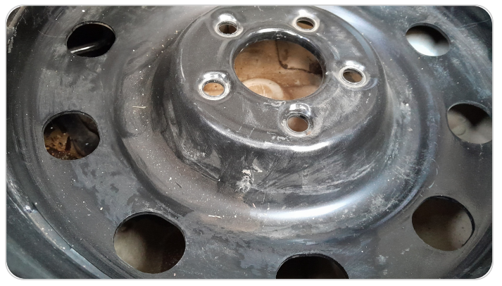
حالة جنط الاستين : تجريحات بسيطة