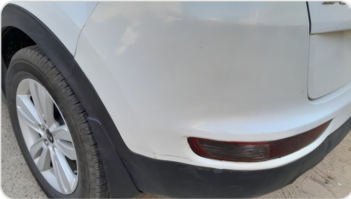
الاكصدام الخلفي : رش مع معجون (خرابيش)