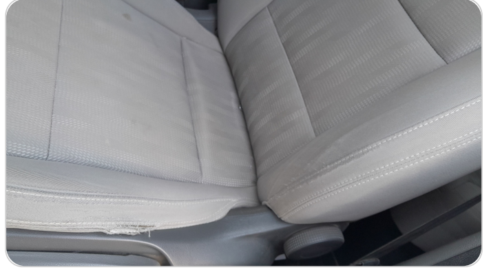
فرش كرسي أمامي شمال : قطع / كسر / شرخ / تلف