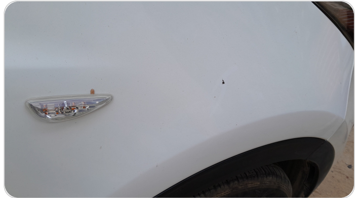
الرفرف الأمامي يمين : فبريكة (خرابيش)