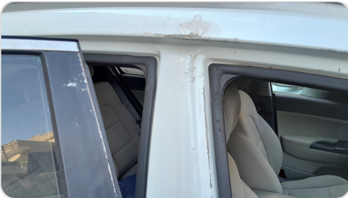
دواخل وقوائم باب أمامي يمين : فبريكة (خرابيش)