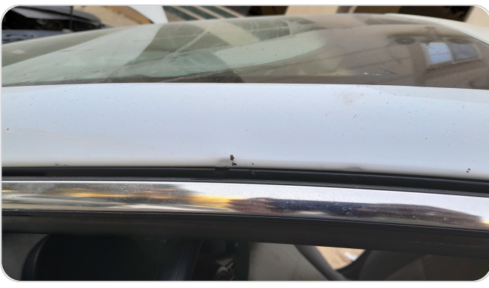
قائم خارجي أمامي شمال : فبريكة (خرابيش)