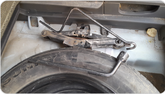
العدة وأدوات الأمان : متوفرة (بحالة جيدة)