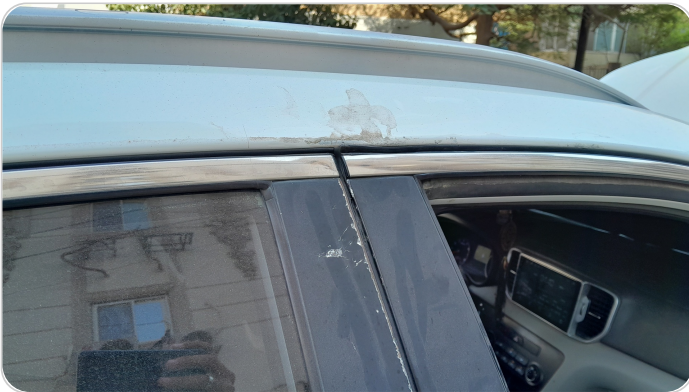
قائم خارجي أمامي يمين : فبريكة (خبطات)