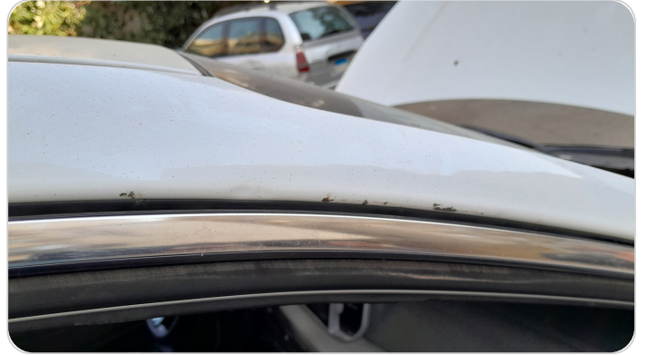
قائم خارجي أمامي يمين : فبريكة (خبطات)