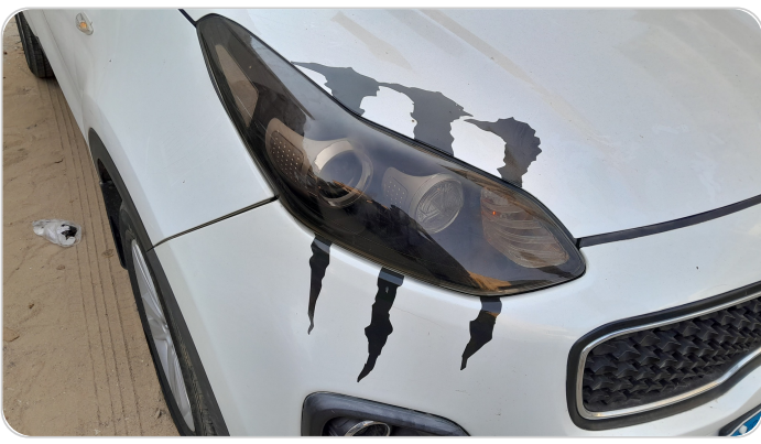
الكبوت + اكصدام امامي : يوجد استيكر