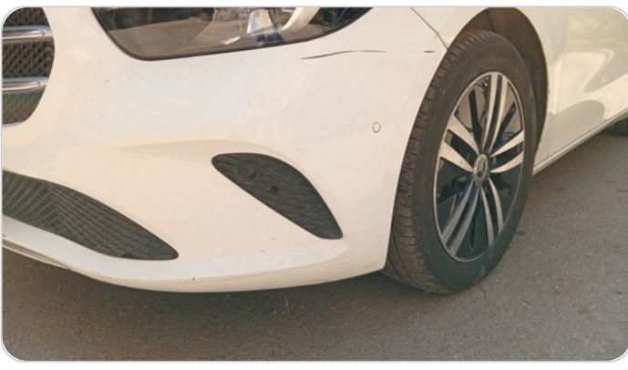
الاصدام الامامي : فبريكة (خرابيش - خبطات)