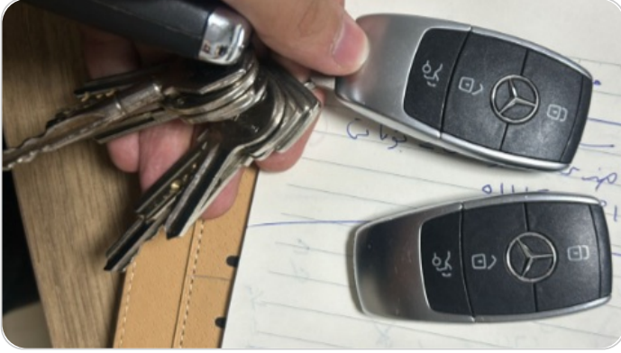
الريموت /المفتاح الاضافي : موجود (لم يتم التجربة)