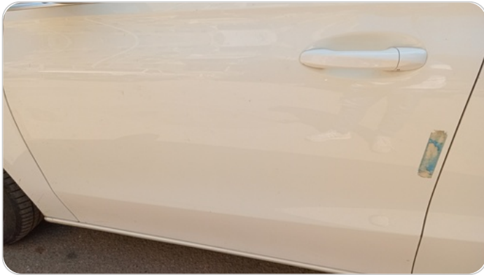
الباب الأمامي شمال : رش بدون معجون (خرايش)