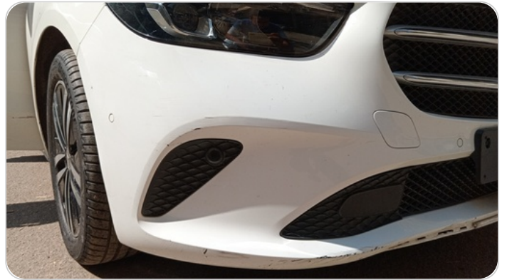
الاكصدام الأمامي : فبريكة (خرايش - خبطات)