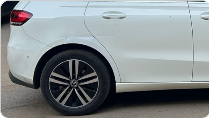
الرفرف الخلفي يمين : فبريكة (خرابيش - خبطات)