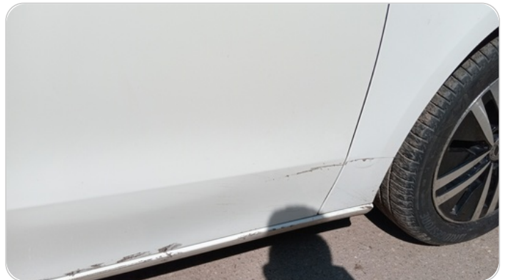
الباب الأمامي يمين : فبريكة (خرايش - خبطات)