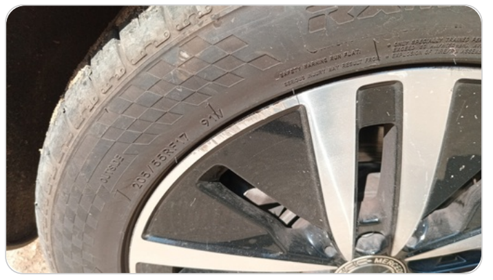
حالة الجنوط الخلفي : تجريحات بسيطة