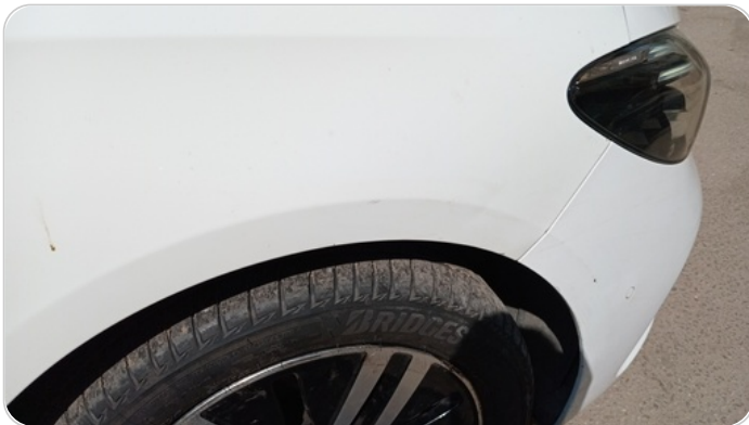
الررف الأمامي يمين : فبريكة (خرايش - خبطات)