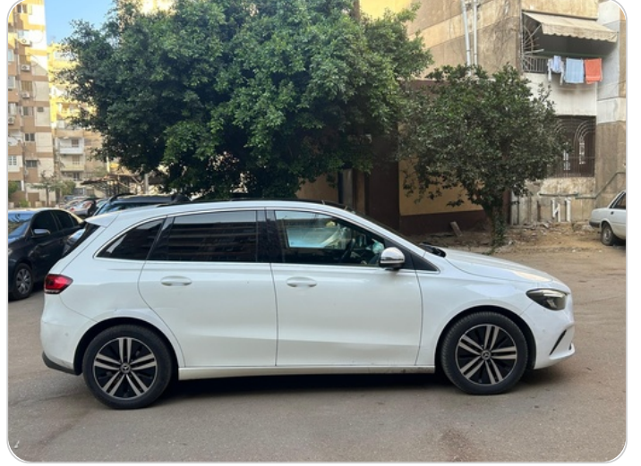
الباب الخلفي يمين : فبريكة (خرابيش - خبطات)