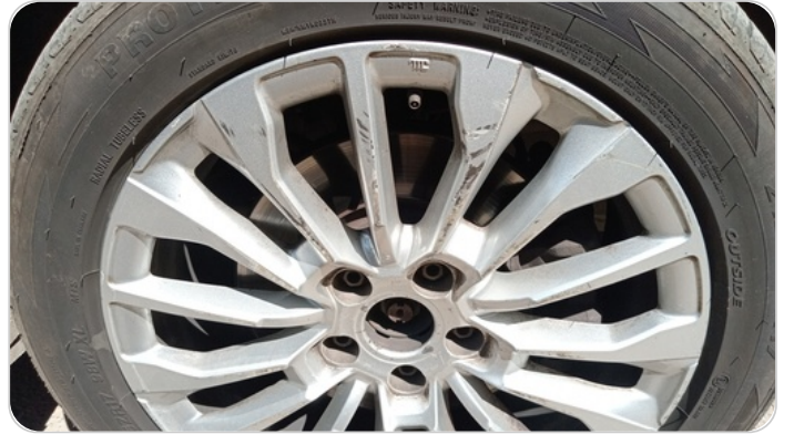
حالة الجنوط الأمامي : تجريحات بسيطة