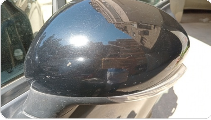
مراية الباب الأمامي شمال : فبريكة (خرابيش)