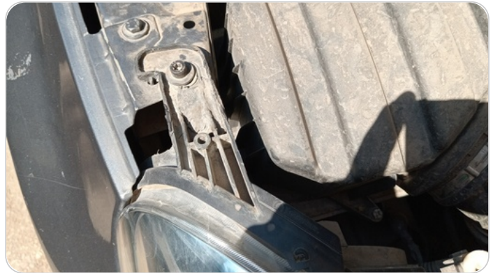
الكشاف الأمامي يمين : كسر في قواعد الكشاف