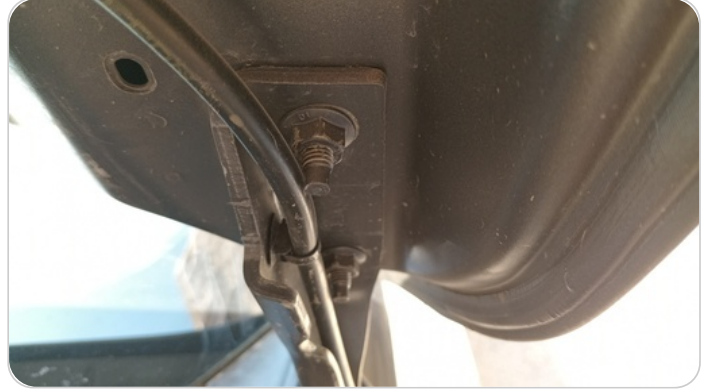
مفصلات ومسامير الكبوت : آثار فك وتركيب