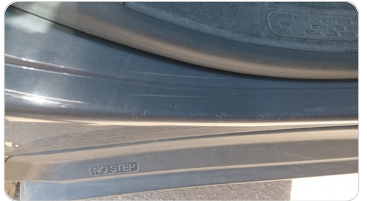
دواخل وقوائم باب خلفي يمين : فبريكة (خرابيش)