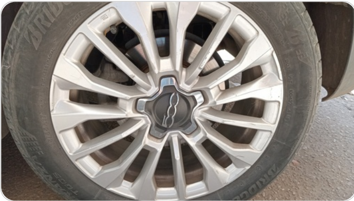
حالة الجنوط الخلفي : تجريحات بسيطه