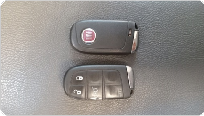
الريموت /المفتاح الاضافي : يعمل بكفاءة