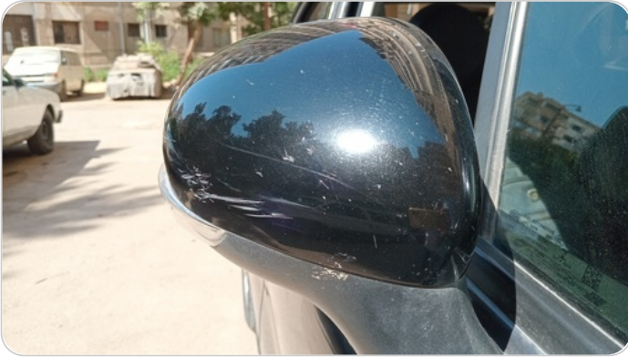
مرآة الباب الأمامي يمين : فبريكة (خرابيش)