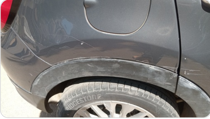
الرفرف الخلفي يمين : فبريكة (خرابيش - خبطات)