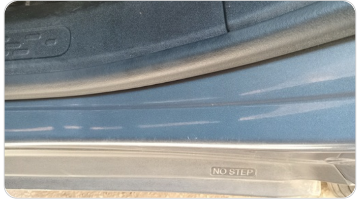
دواخل وقوائم باب الخلفي شمال : فبريكة (خرابيش)