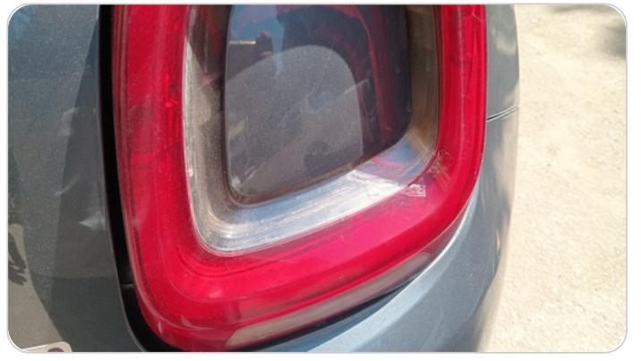
الكشاف الخلفي يمين : كسر بالباغة