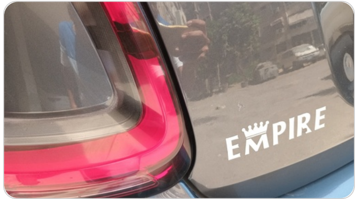
باب الشنطة : فبريكة (خرابيش)