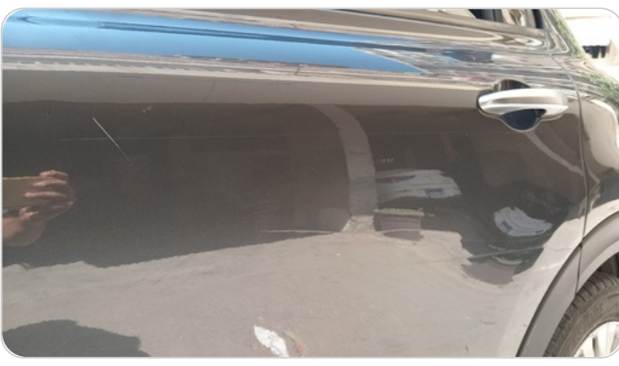
الباب الخلفي شمال : فبريكة (خرابيش)