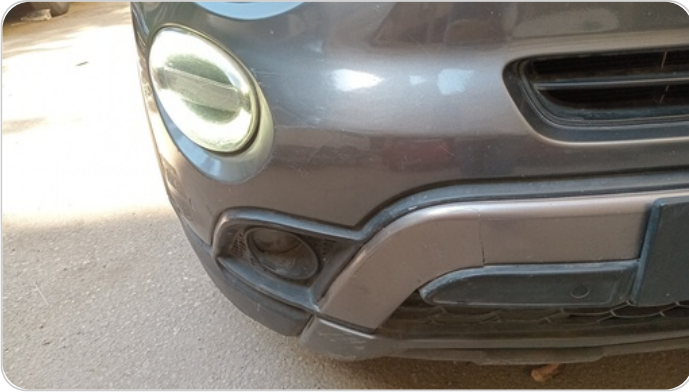
الاكصدام الأمامي : رش مع معجون (خرابيش)