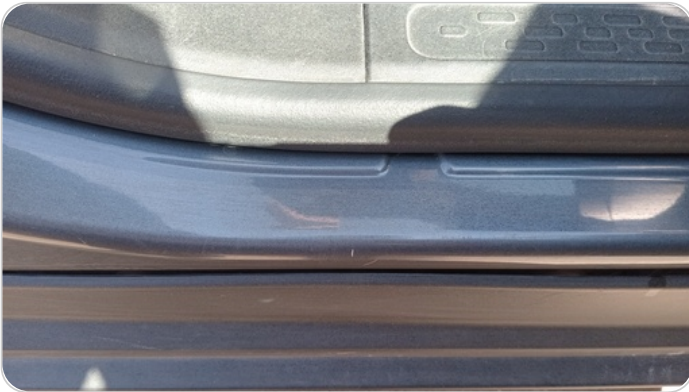
دواخل وقوائم باب أمامي يمين : فبريكة (خرابيش)