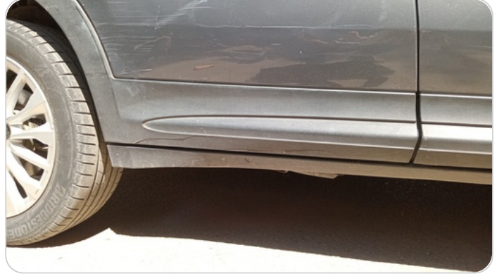
العتب السفلي يمين : فبريكة (خرابيش)