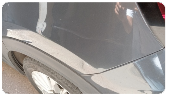
الرفرف الخلفي شمال : فبريكة (خرابيش)