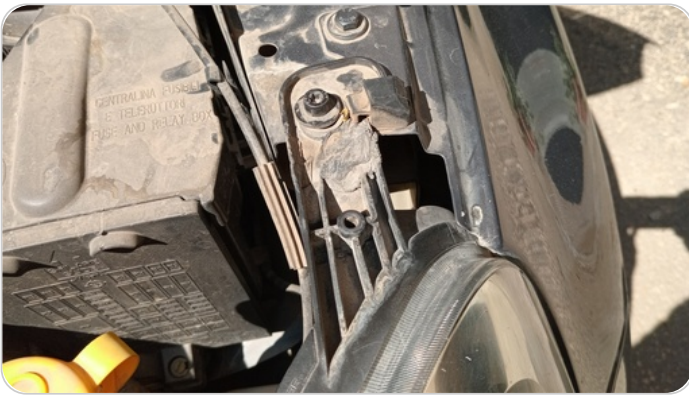
الكشاف الأمامي شمال : كسر في قواعد الكشاف