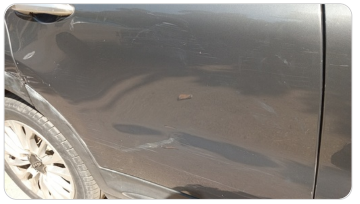
الباب الخلفي يمين : فبريكة (خرابيش - خبطات)