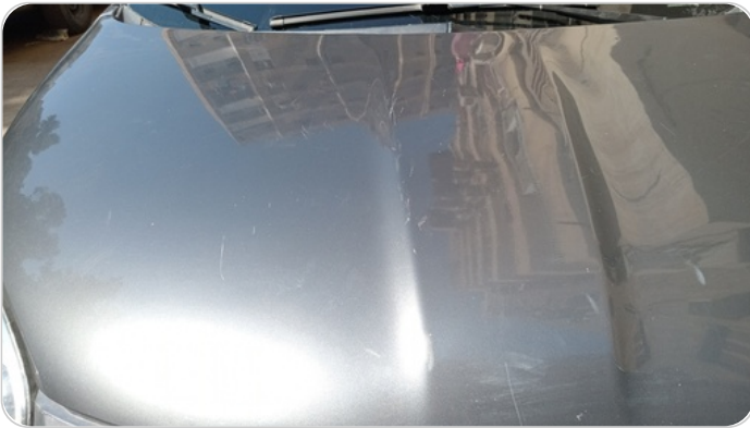
الكبوت : رش مع معجون (خرابيش)