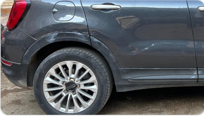
الرفرف/الباب الخلفي يمين : فبريكة (خرابيش - خبطات)