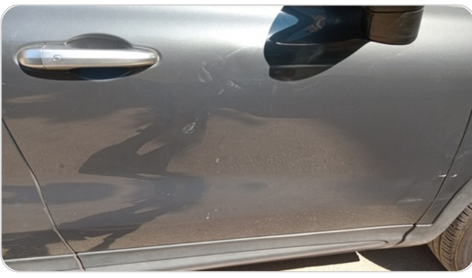
الباب الأمامي يمين : فبريكة (خرابيش - خبطات)