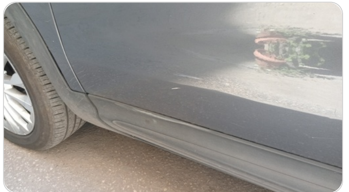
الباب الأمامي شمال : فبريكة (خرابيش)