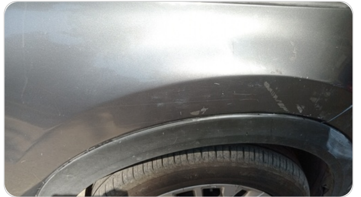
الرفرف الأمامي يمين : رش مع معجون (خرابيش)