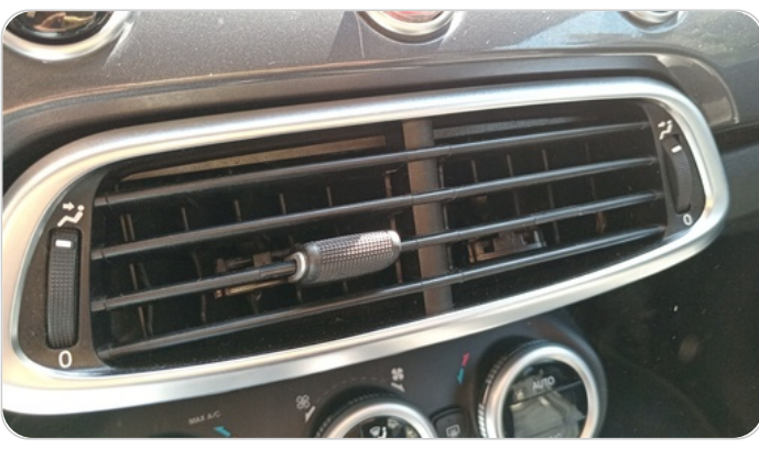
هوايات التكييف : كسر (أكثر من هواية)