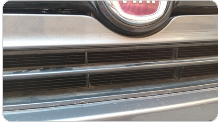
شبكة أمامية : شرخ / كسر