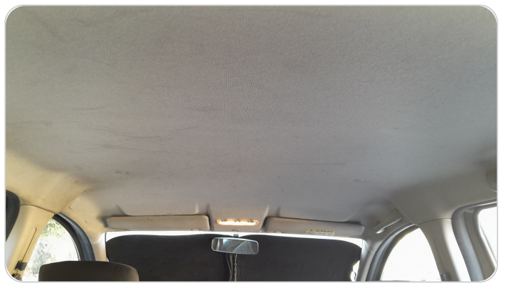
CAR ROOF MAT