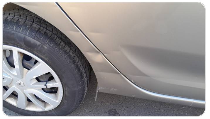
الرفرف الخلفي يمين : فبريكة (سمكره على البارد)