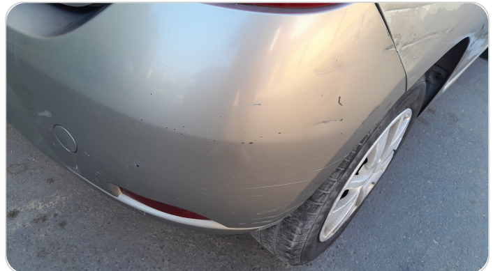
الاكصدام الخلفي : فبريكة (خرابيش)