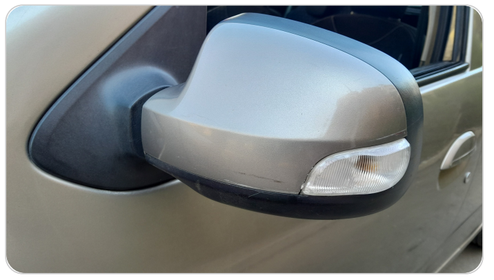
مراية الباب الأمامي شمال : فبريكة (خرابيش)