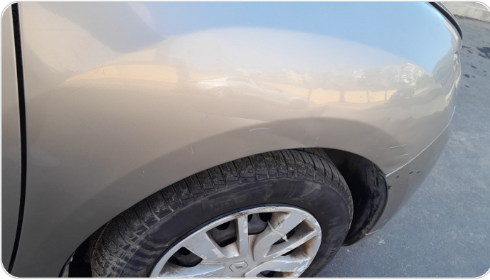
الرفرف الأمامي يمين : فبريكة (سمكره على البارد)