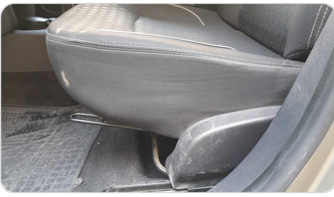
DRIVER SEAT SWITCHES