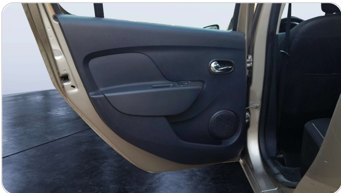
RR L DOOR