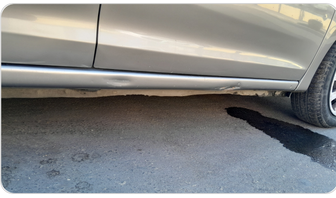
العتب السفلي يمين : رش مع معجون (خرابيش)