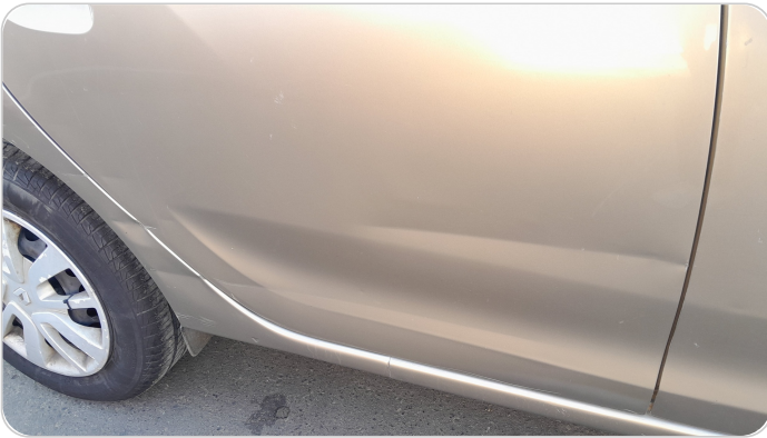
الباب الخلفي يمين : فبريكة (خرابيش - خبطات)