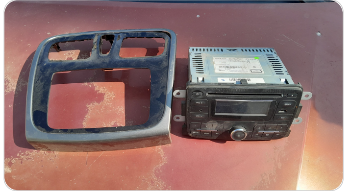
الكاست الاصلي : موجود