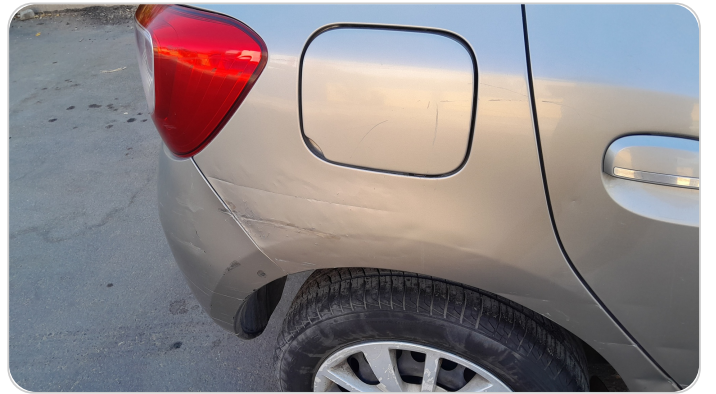
الرفرف الخلفي يمين : فبريكة (سمكره على البارد)