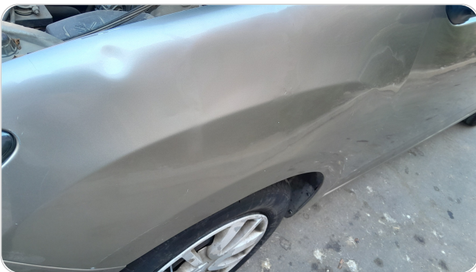
الرفرف الأمامي شمال : فبريكة (خرابيش)