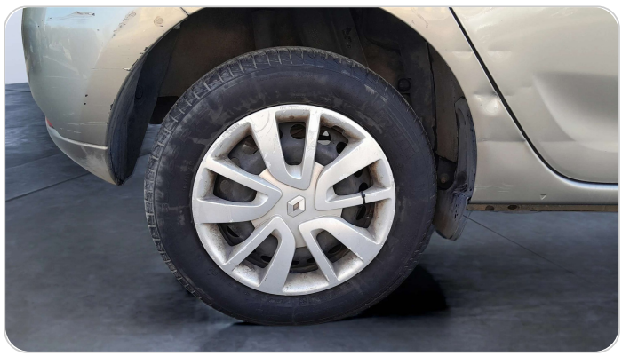
RR R TIRE