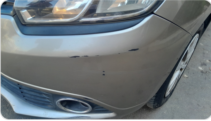
الاكصدام الأمامي : فبريكة (خرابيش)