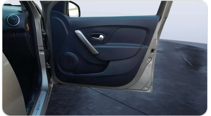
FR R DOOR