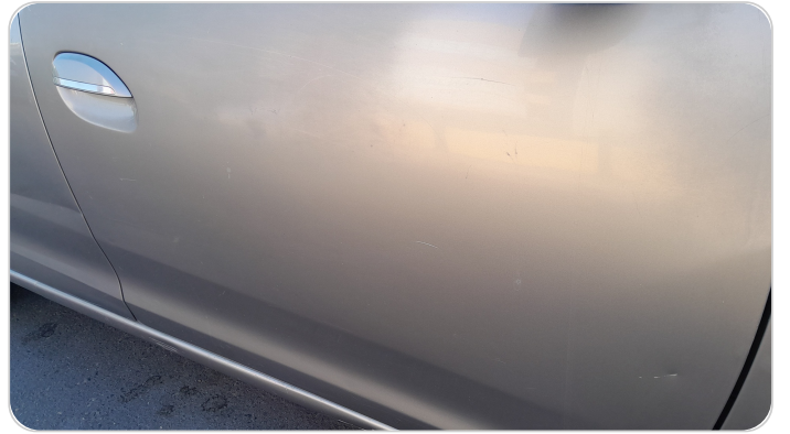
الباب الأمامي يمين : رش مع معجون (خرابيش)