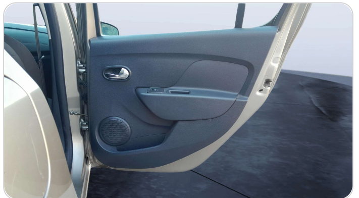
RR R DOOR