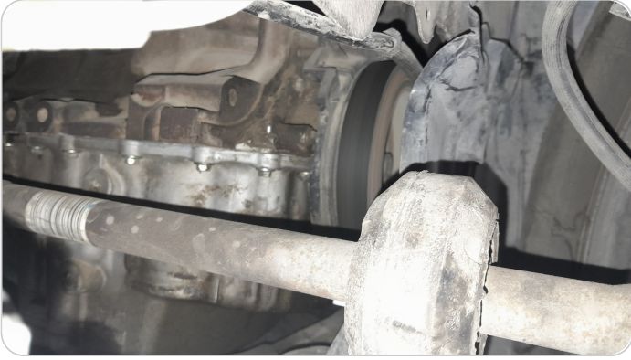
المحرك : اثار فك وتركيب في كرتيرة المحرك