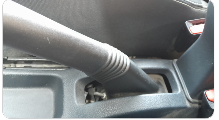
الكونسول الوسط : قطع / كسر / شرخ / تلف