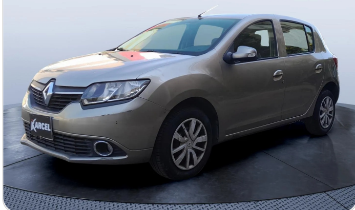
FR L 45