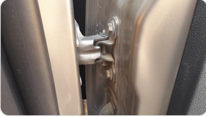
مفصلات ومسامير الباب الأمامي يمين : آثار فك وتركيب