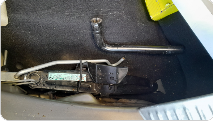
العدة وأدوات الأمان : متوفرة (بحالة جيدة)