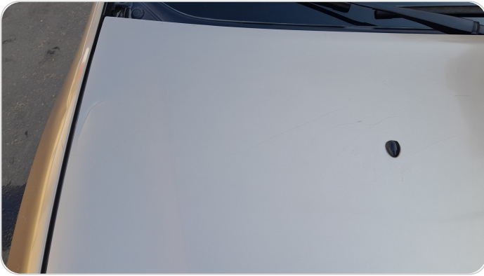
الكبوت : رش بدون معجون (خرابيش)