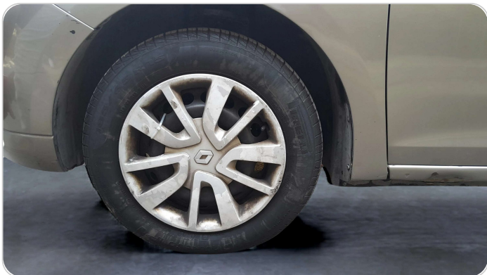
FR L TIRE