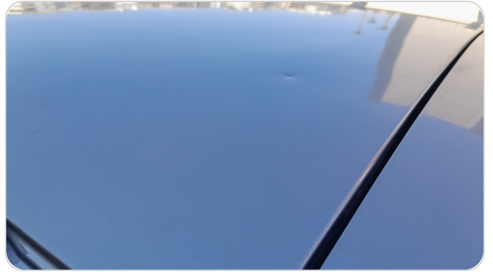
السقف : رش بدون معجون (خرابيش)