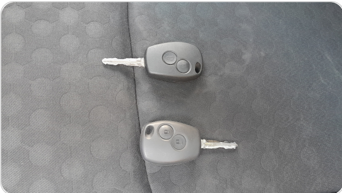
الريموت /المفتاح الاضافي : يعمل بكفاءة