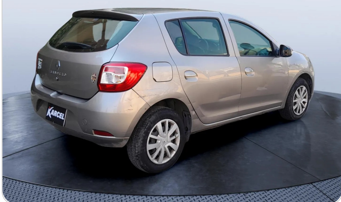
RR R 45