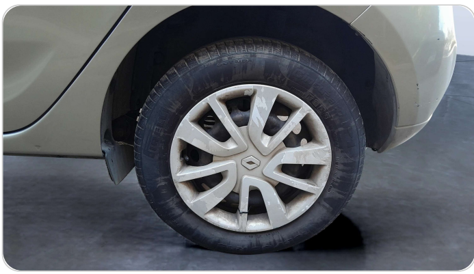
RR L TIRE