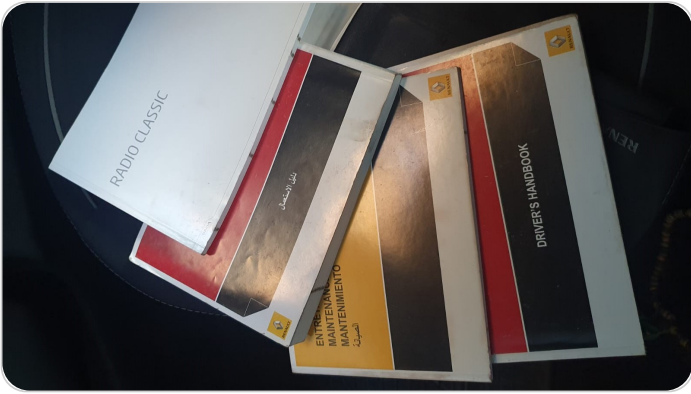
كتالوج السيارة : موجود