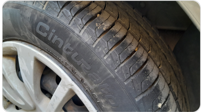
حالة الكاوتش الخلفي : النقشة متآكلة