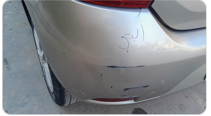
الاكصدام الخلفي : فبريكة (خرابيش)