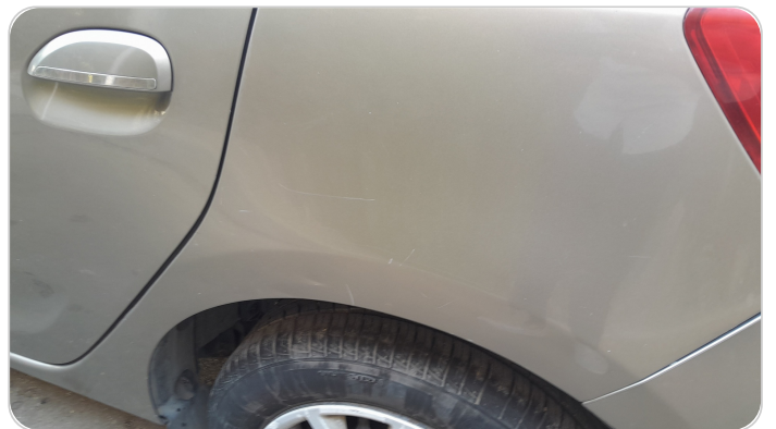
الرفرف الخلفي شمال : فبريكة (خرابيش)