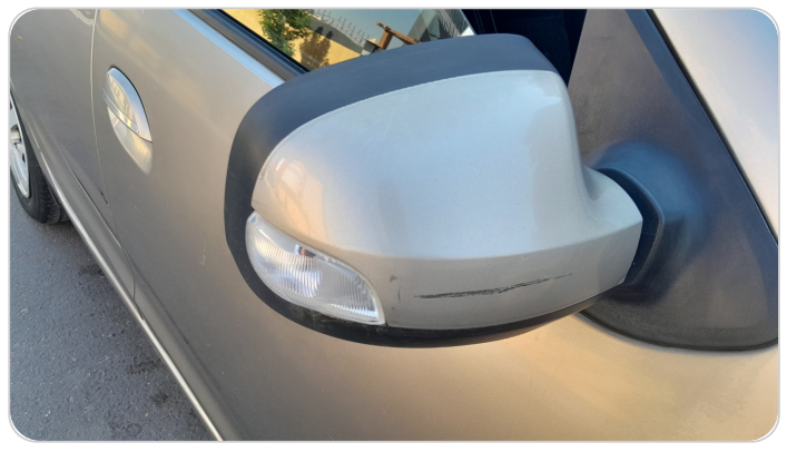
مراية الباب الأمامي يمين : فبريكة (خرابيش)