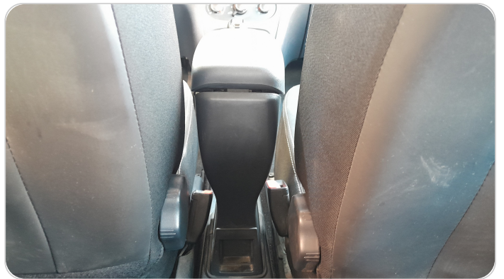
RR AC GRILL