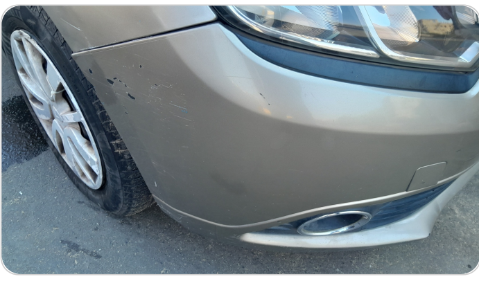
الاصدام الامامي : فبريكة (خرايبش)