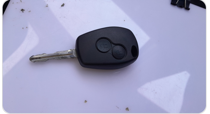
حالة الريموت / المفتاح : يعمل بكفاءة