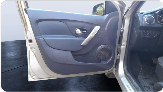
FR L DOOR