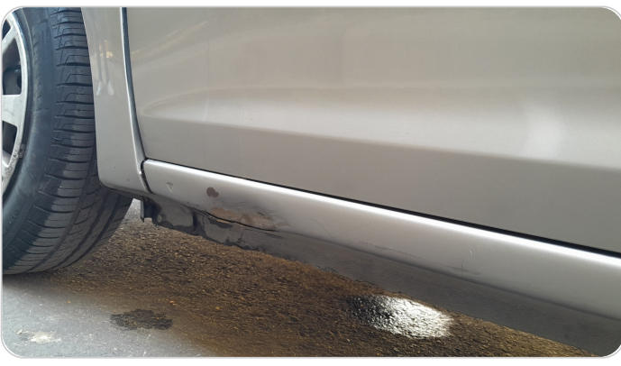
العتب السفلي شمال : رش مع معجون (خبطات)