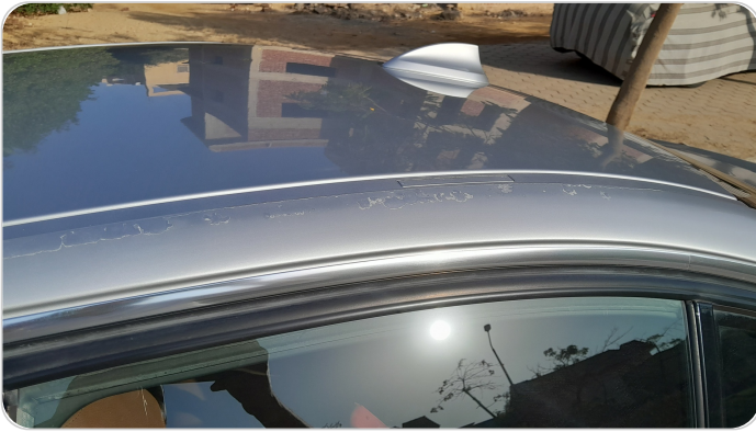
قائم خارجي خلفي شمال : رش مع معجون (خرابيش)