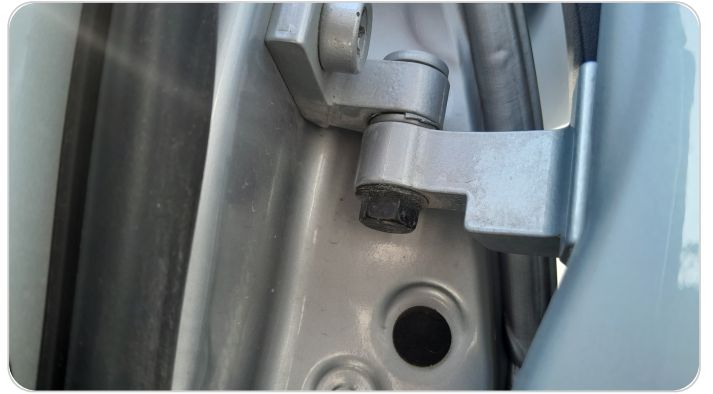
مفصلات ومسامير الباب الأمامي شمال : آثار فك وتركيب