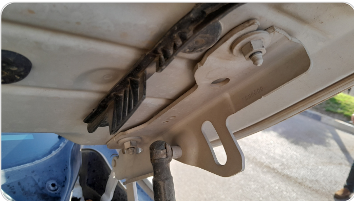
مفصلات ومسامير الكبوت : آثار فك وتركيب