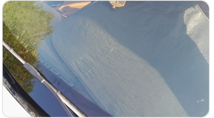
الزجاج الامامي : شرخ