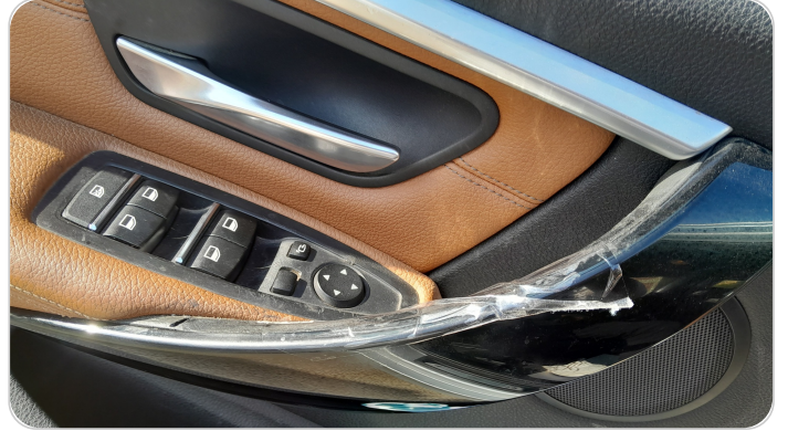
فرش الباب الأمامي شمال : قطع/كسر/شرخ/تلف