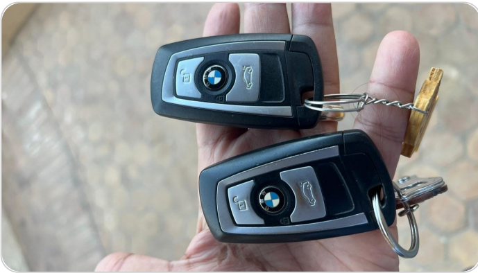
الريموت /المفتاح الاضافي : موجود (لم يتم التجربة)