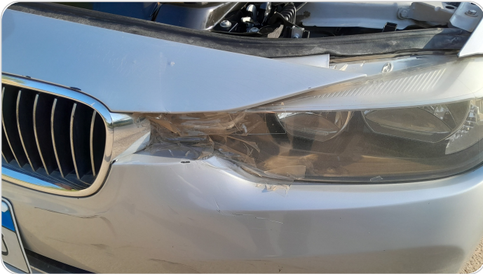
الكشاف الأمامي شمال : كسر بالباغة