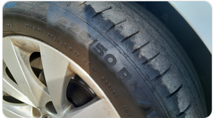
حالة الكاوتش الأمامي : النقشة متآكلة