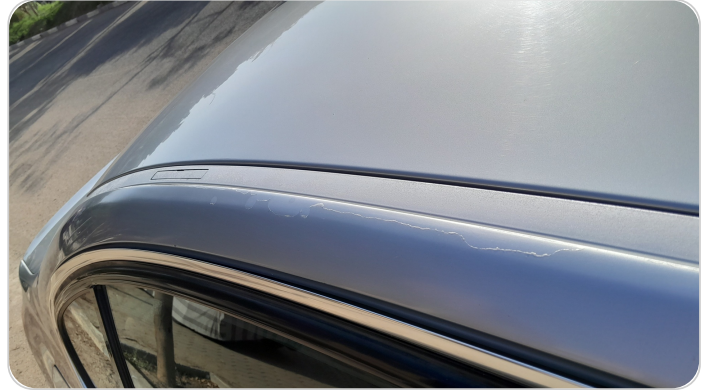
قائم خارجي خلفي يمين : (رش مع معجون (خرايش)