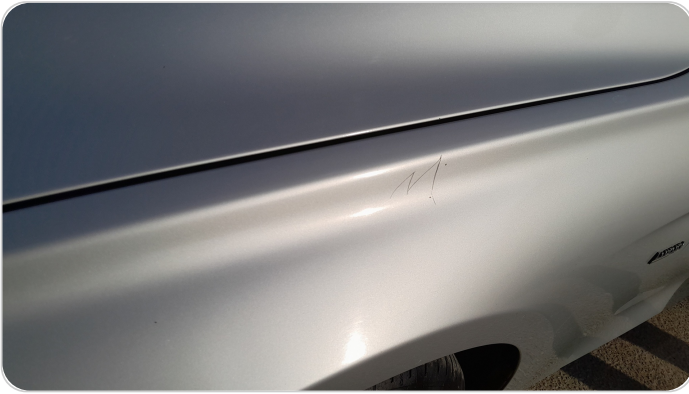
الرفرف الامامي شمال : خرابيش