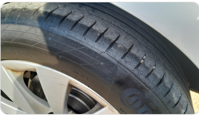
حالة الكاوتش الخلفي : النقشة متآكلة