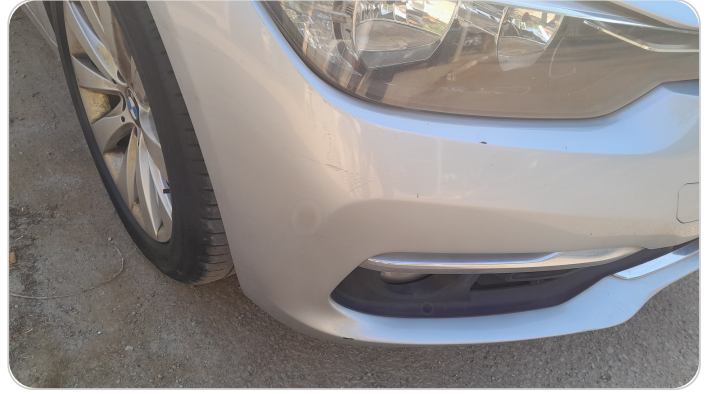
الاكصدام الامامي : خرابيش