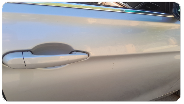
الباب الأمامي يمين : رش بدون معجون (خرايش)