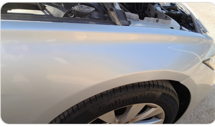
الرفرف الأمامي يمين : رش مع معجون (خرايش)