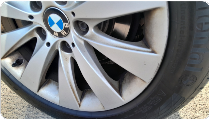
حالة الجنوط الخلفي : تجريحات بسيطه