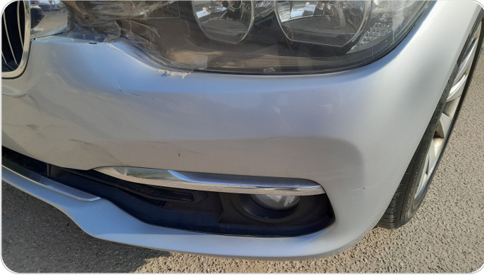
الاكصدام الامامي : خرابيش