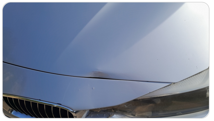
الكبوت : خرابيش