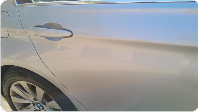
الباب الخلفي يمين : رش بدون معجون (خرايش)