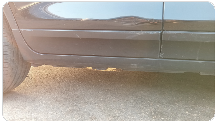
العتب السفلي يمين : فبريكة (خرابيش)