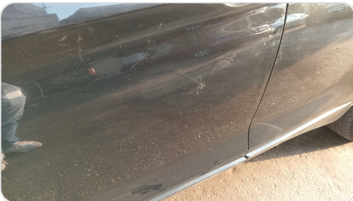
الباب الأمامي شمال : فبريكة (خرايش)