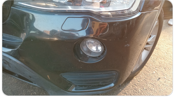
الاكصدام الأمامي : رش مع معجون (خرابيش)