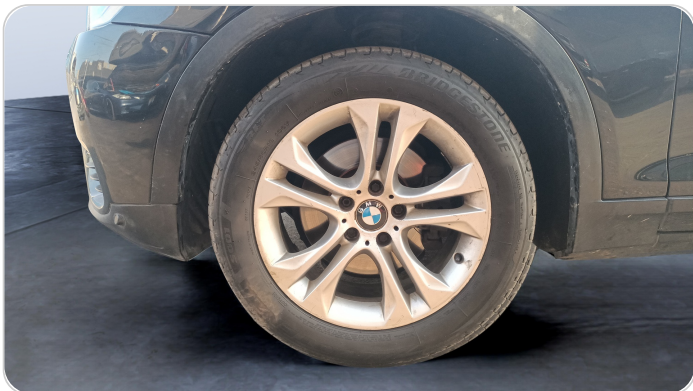
FR L TIRE