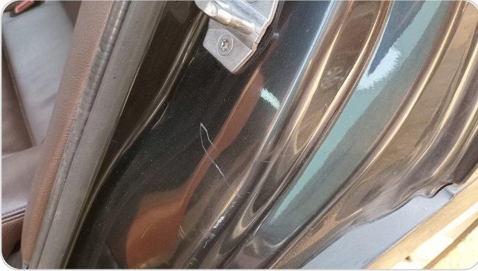
دواخل وقوائم باب الخلفي شمال : فبريكة (خرابيش)