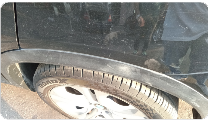
الرفرف الخلفي شمال : فبريكة (خرابيش)