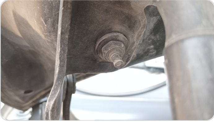
مفصلات ومسامير الكبوت : آثار فك وتركيب