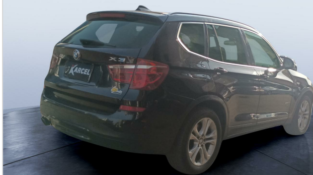
RR R 45