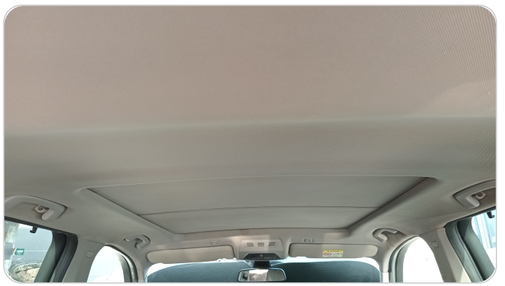
CAR ROOF MAT