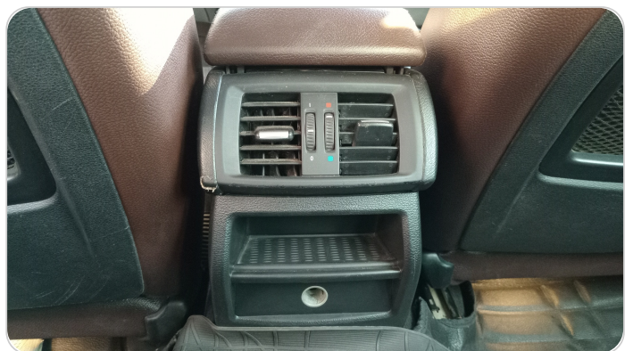
RR AC GRILL