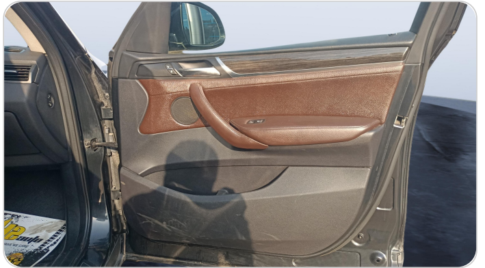
FR R DOOR