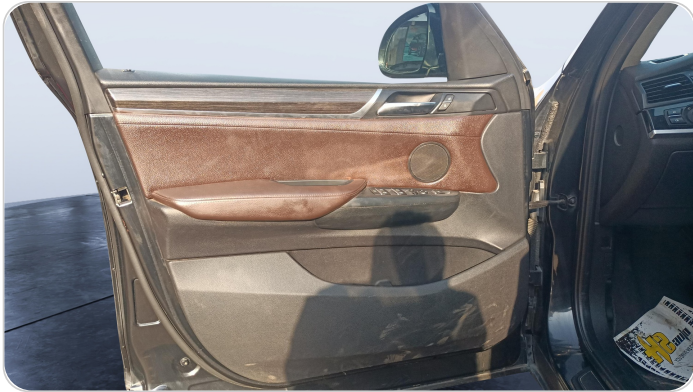
FR L DOOR