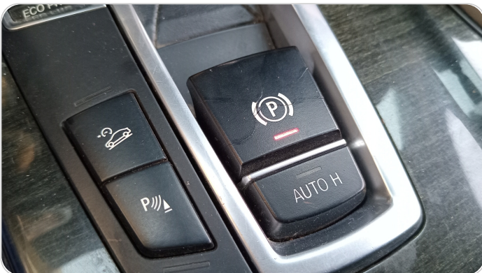
الكونسول الوسط : قطع / كسر / شرخ / تلف