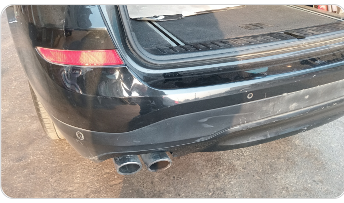
الاكصدام الخلفي : فبريكة (خرابيش - خبطات)