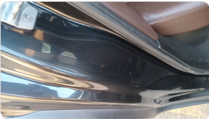
دواخل وقوائم باب خلفي يمين : فبريكة (خرابيش)