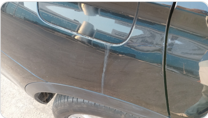
الرفرف الخلفي يمين : فبريكة (خرابيش)