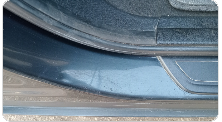
دواخل وقوائم باب أمامي يمين : فبريكة (خرابيش)