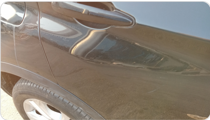
الباب الخلفي يمين : فبريكة (خرابيش)