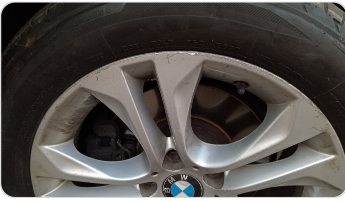
حالة الجنوط الأمامي : تجريحات بسيطة