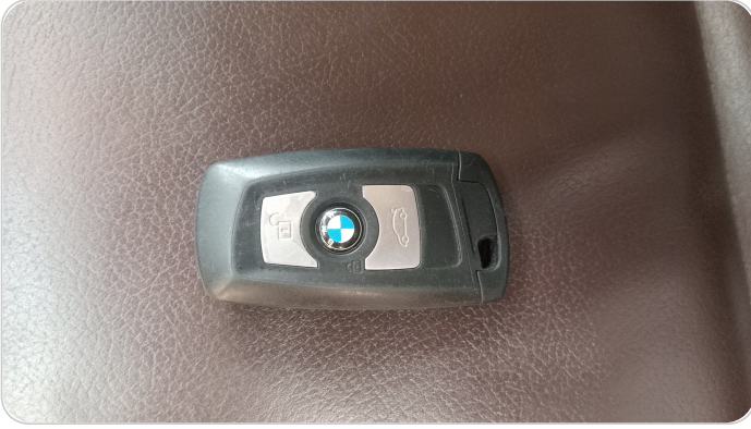
حالة الريموت / المفتاح : يعمل بكفاءة