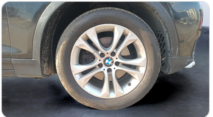
FR R TIRE