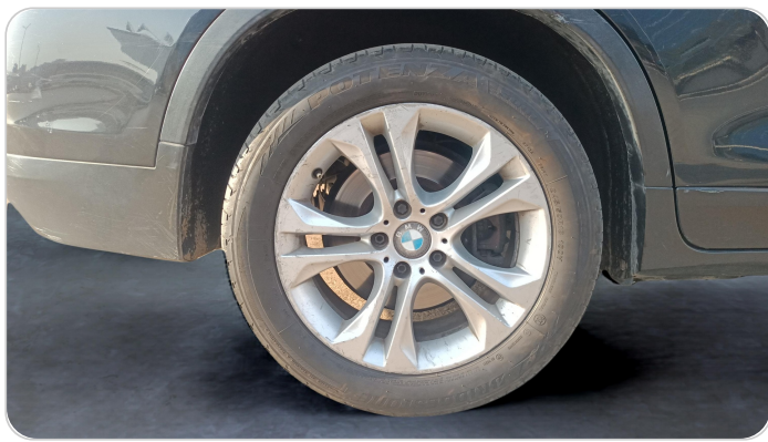
RR R TIRE