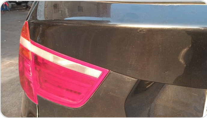
باب الشنطة : فبريكة (خرايش)