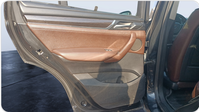
RR L DOOR