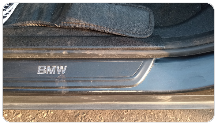
دواخل وقوائم باب الأمامي شمال : فبريكة (خرابيش)