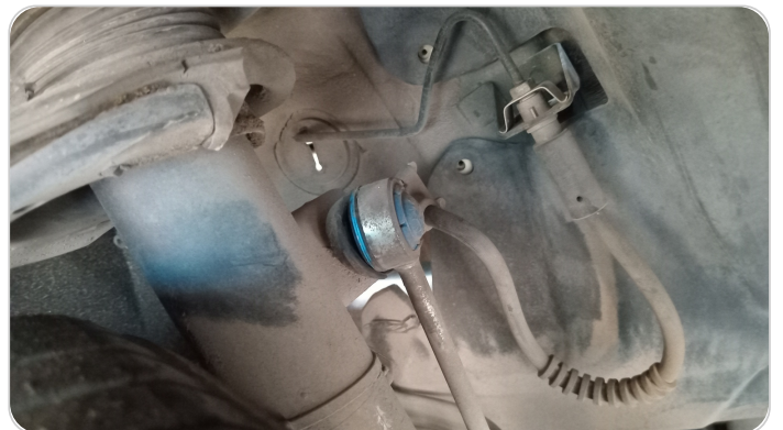
ذراع الميزان : تشققات (كاوتش الميزان)