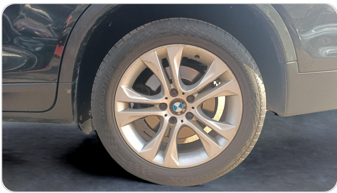
RR L TIRE