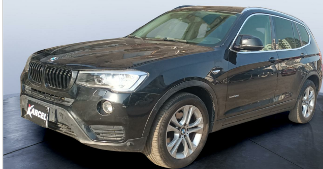
FR L 45