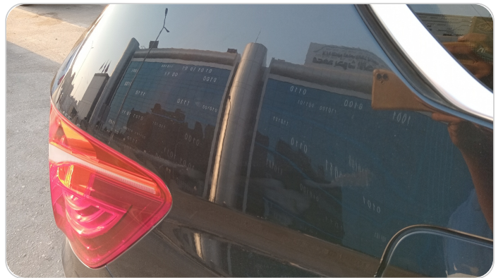
قائم خارجي خلفي يمين : فبريكة ( خرابيش )