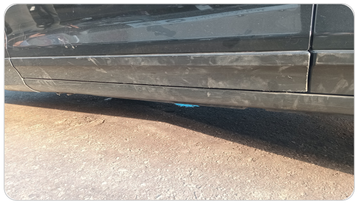
العتب السفلي شمال : فبريكة (خرابيش)