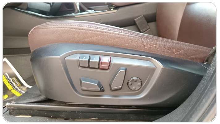
DRIVER SEAT SWITCHES