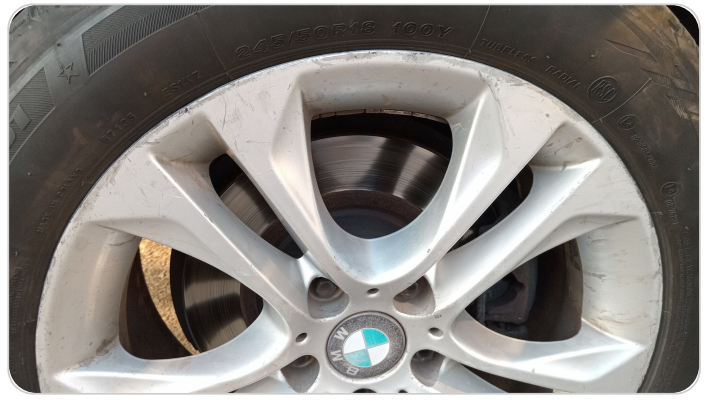
حالة الجنوط الخلفي : تجريحات بسيطه