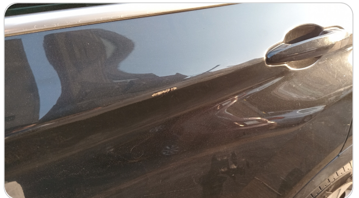
الباب الخلفي شمال : فبريكة (خرايش)