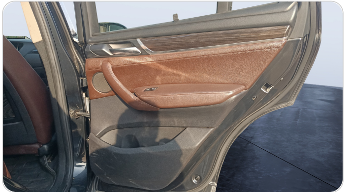
RR R DOOR