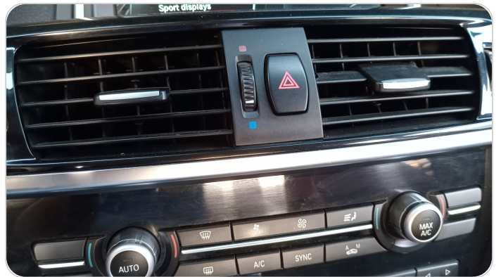
هوايات التكييف : كسر (أكثر من هواية)