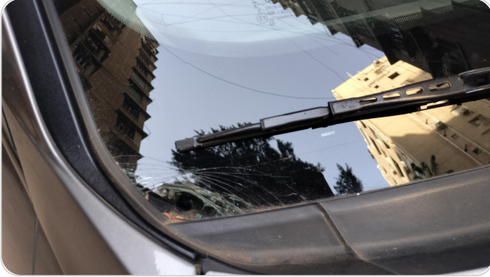
زجاج السيارة الأمامي : شروخ أو كسور