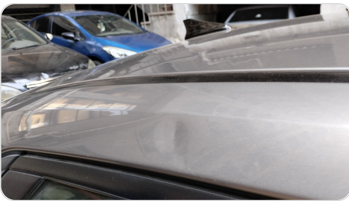
قائم خارجي خلفي يمين : فبريكة ( خرابيش )