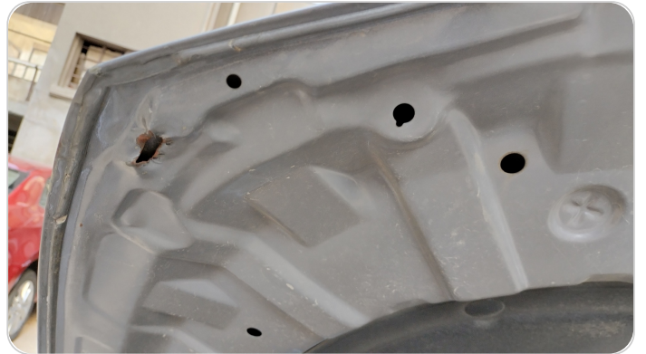
الكبوت : رش مع معجون (ملاحظات)