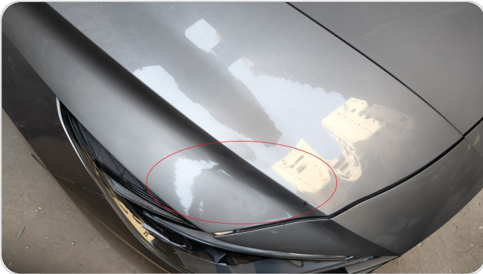
الكبوت : رش مع معجون (ملاحظات)