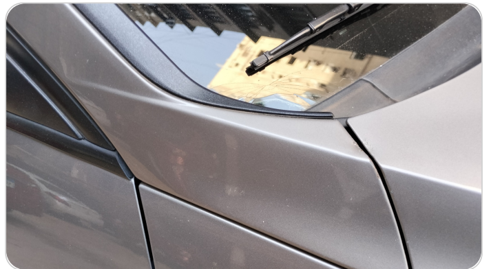
قائم خارجي أمامي يمين : فبريكة (خرابيش)