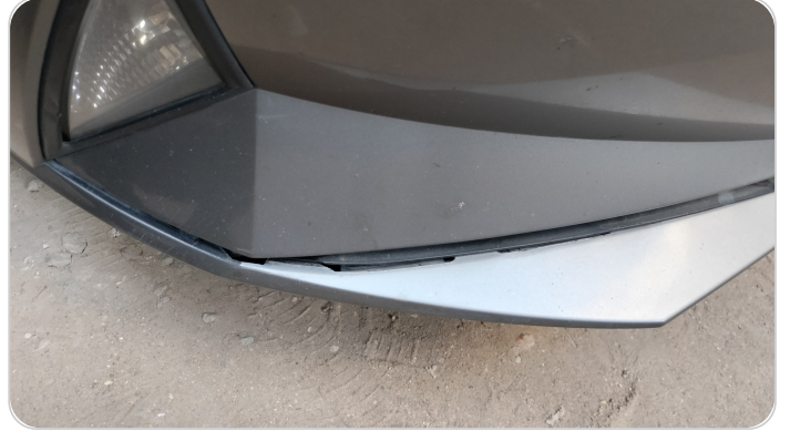
الاكصدام الأمامي : رش بدون معجون (خرابيش)