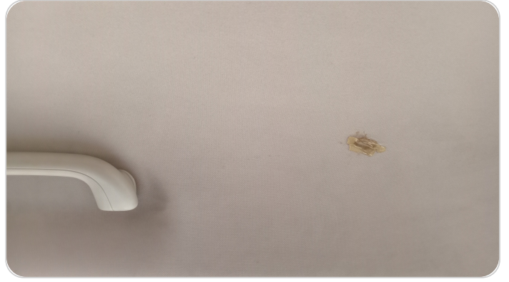
فرش السقف : قطع / كسر / شرخ / تلف