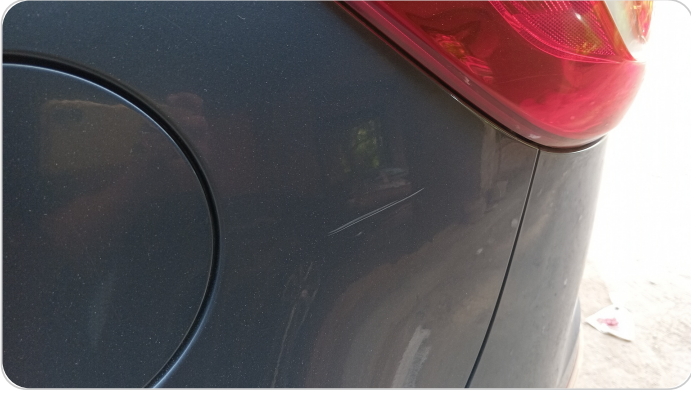
الرفرف الخلفي شمال : فبريكة (خرابيش)