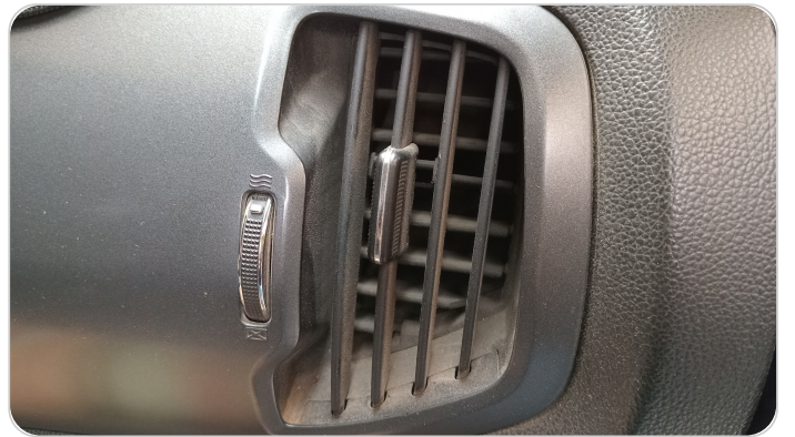
هوايات التكييف : كسر (أكثر من هواية)