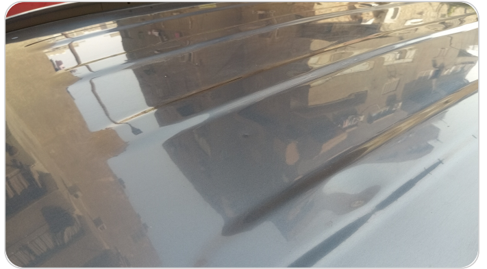
السقف : فبريكة (خطبات)