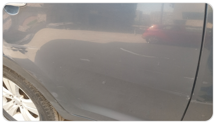
الباب الخلفي يمين : رش مع معجون (خرابيش)