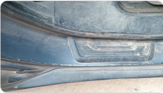
دواخل وقوائم باب خلفي يمين : فبريكة (خرابيش)