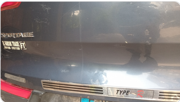
باب الشنطة : فبريكة ( خرابيش _ خطبات )