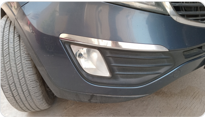
الاكصدام الأمامي : فبريكة (خرابيش)