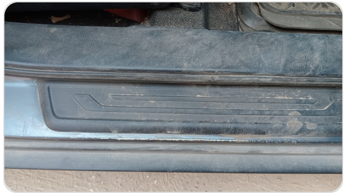
دواخل وقوائم باب أمامي يمين : فبريكة (خرابيش)