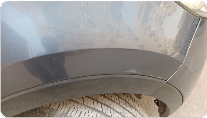
الرفرف الأمامي يمين : فبريكة (خرابيش)