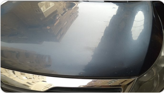
الكبوت : فبريكة (خرابيش)