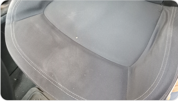
فرش كرسي أمامي شمال : قطع / كسر / شرخ / تلف