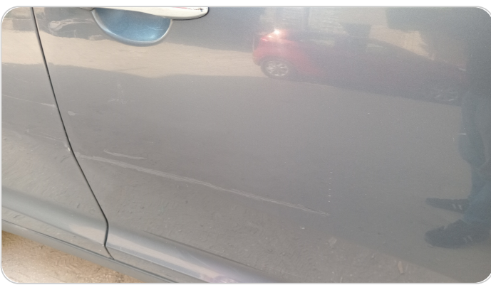
الباب الأمامي يمين : رش بدون معجون (خرابيش)