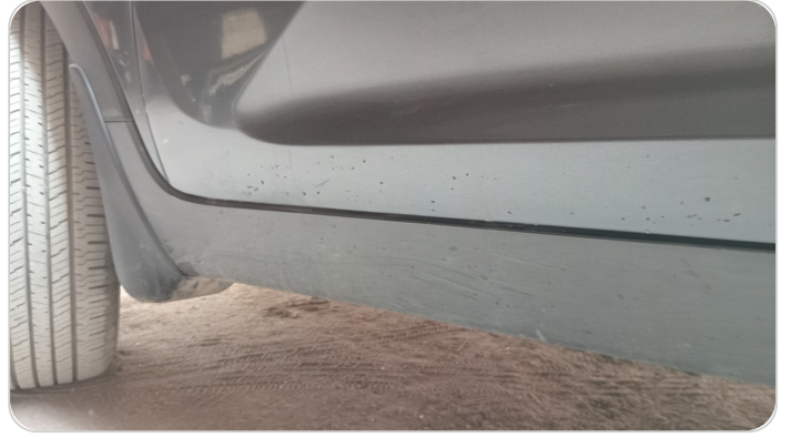
العتب السفلي شمال : فبريكة (خرابيش)