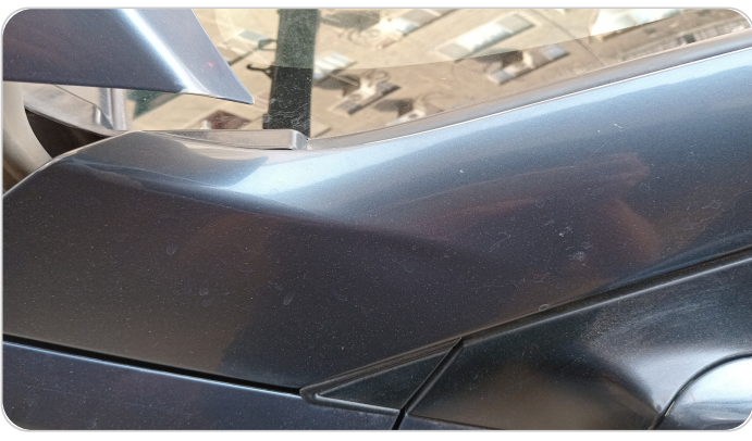
قائم خارجي أمامي شمال : فبريكة (الدهان متآكل)