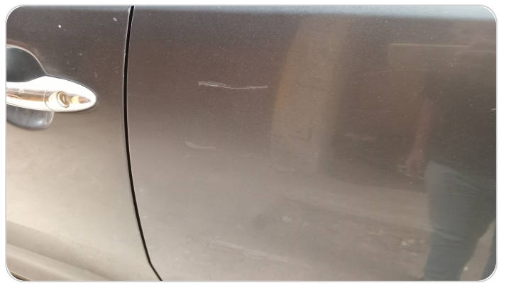
الباب الخلفي شمال : رش بدون معجون (خرابيش)