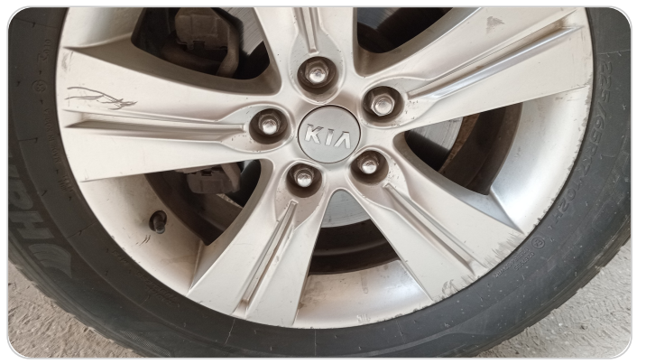
حالة الجنوط الأمامي : تجريحات بسيطة