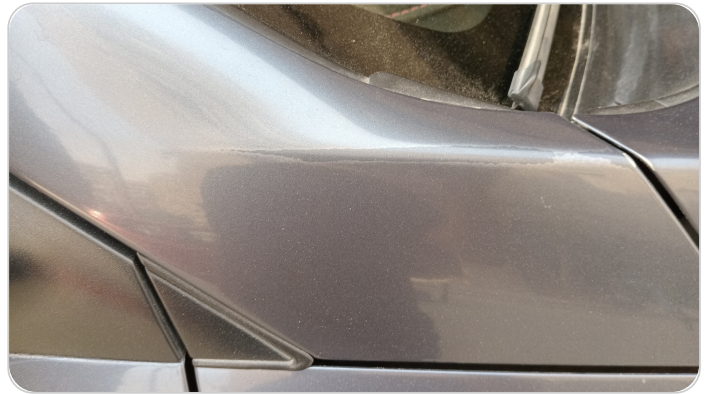
قائم خارجي أمامي يمين : فبريكة (الدهان متآكل)