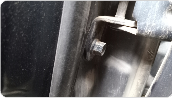
مفصلات ومسامير الباب الأمامي شمال : آثار فك وتركيب