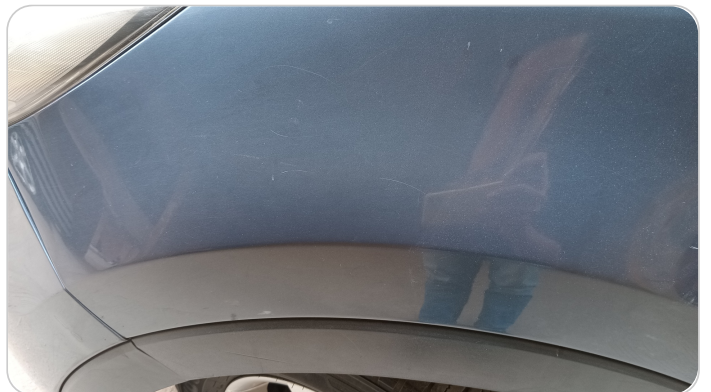
الرفرف الأمامي شمال : رش مع معجون (خرابيش)