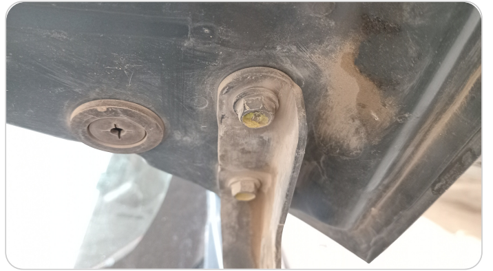
مفصلات ومسامير الكبوت : آثار فك وتركيب