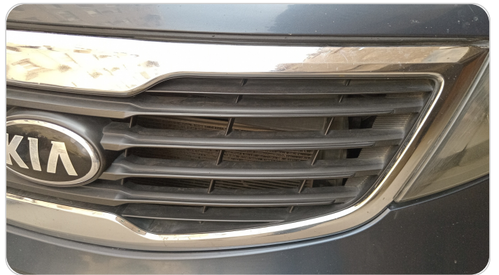
شبكة أمامية : الدهان / النيكل (متآكل)