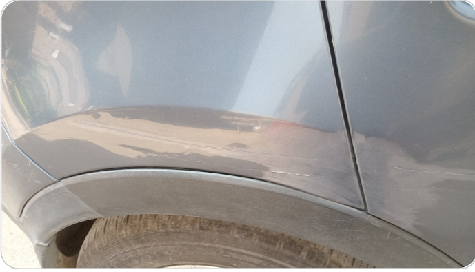
الرفرف الخلفي يمين : فبريكة (خرابيش)