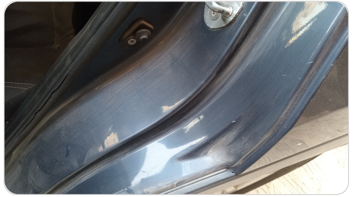
دواخل وقوائم باب الخلفي شمال : فبريكة (خرابيش)