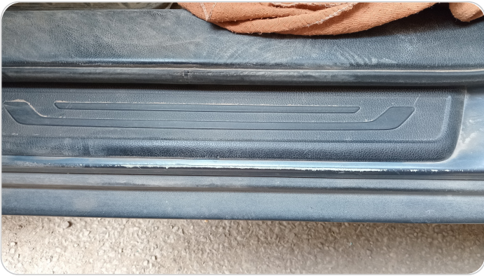
دواخل وقوائم باب الأمامي شمال : فبريكة (خرابيش)