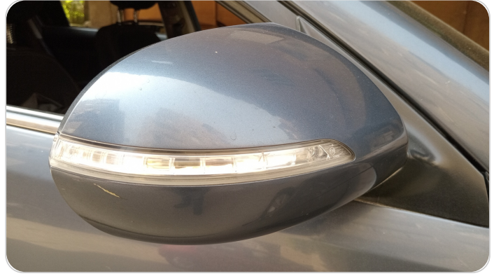
مراية الباب الأمامي يمين : فبريكة (خرابيش)