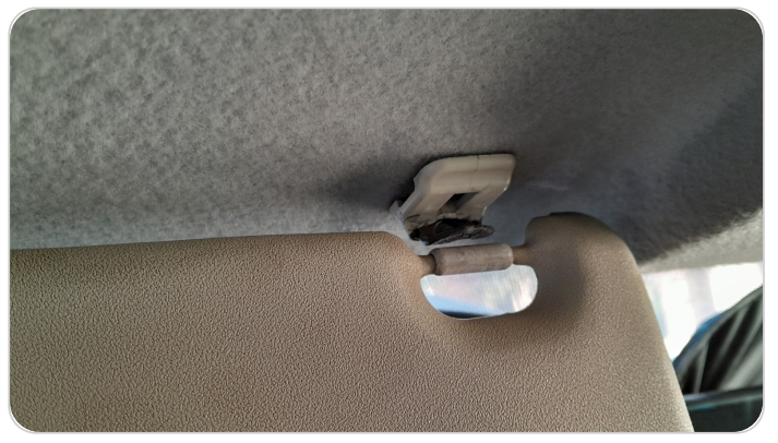
شماسات أمامية : تلف في الشمال