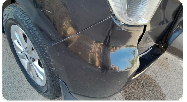
الاكصدام الخلفي : فبريكة (كس)