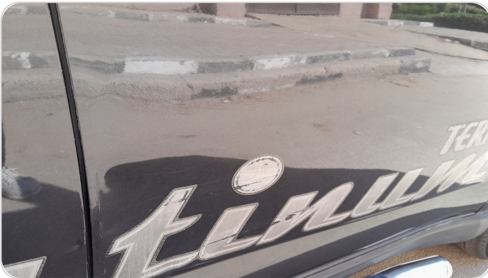
الباب الأمامي يمين : فبريكة (خرايش)