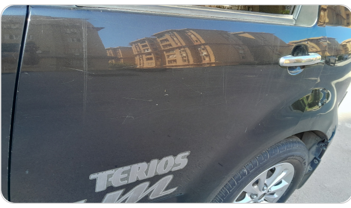
الباب الخلفي شمال : فبريكة (خرايش)