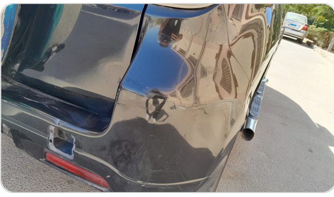
الاكصدام الخلفي : فبريكة (كسر) + فقد في الطبقة