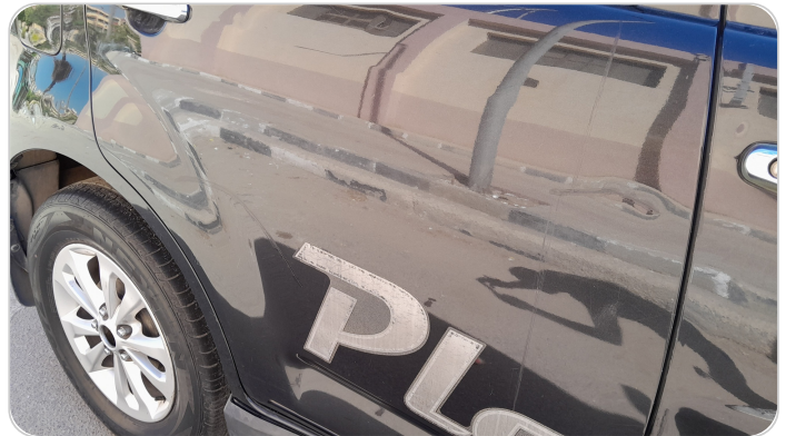
الباب الخلفي يمين : فبريكة (خرايش)