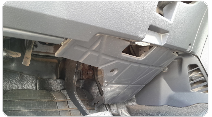
جزء من فيبرة اسفل الطارة : كسر