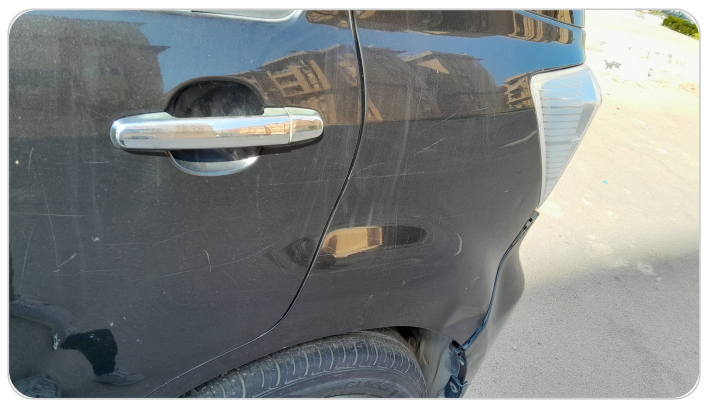
الرفرف الخلفي شمال : فبريكة (خبطات)