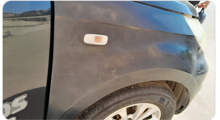
الرفرف الأمامي يمين : فبريكة (الدهان متآكل)