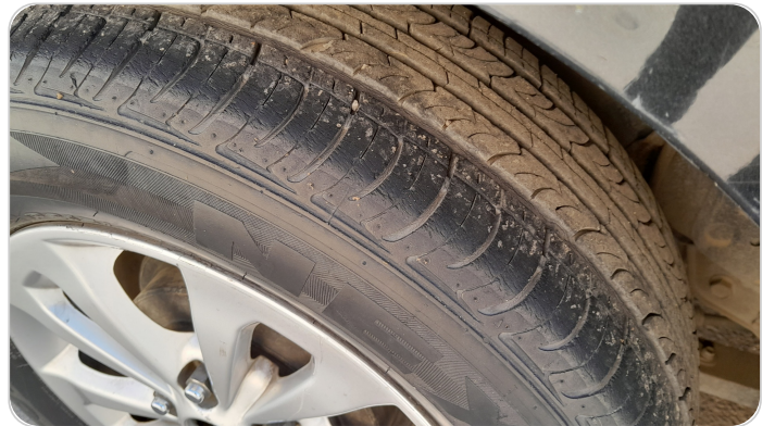
حالة الكاوتش الخلفي : النقشة متآكلة