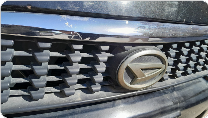
شبكة أمامية : الدهان / النيكل (متآكل)