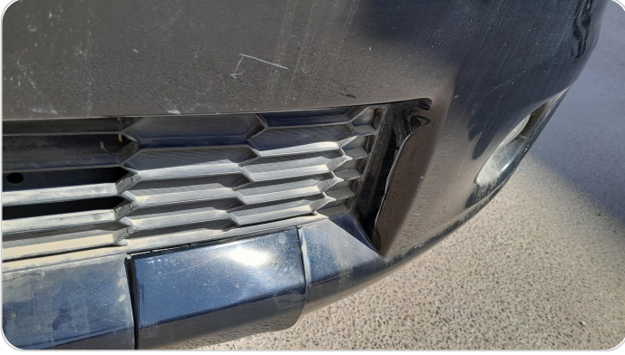
الاكصدام الأمامي : فبريكة (كس)