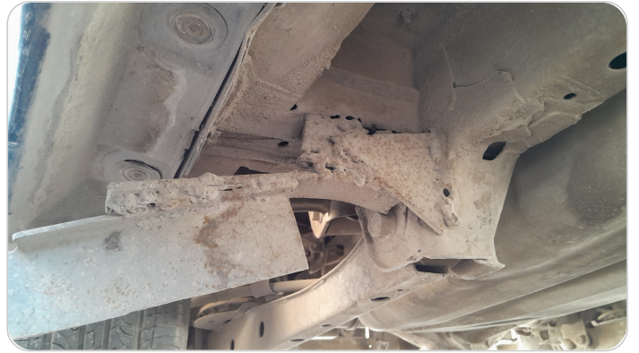
عتب خارجي : تم اضافة عتب