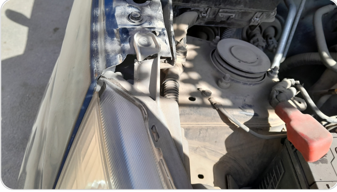
الكشاف الأمامي يمين : كسر في قواعد الكشاف