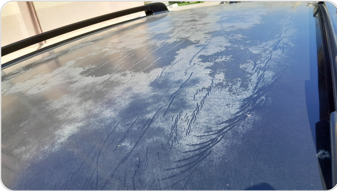
السقف : فبريكة ( الدهان متاكل )