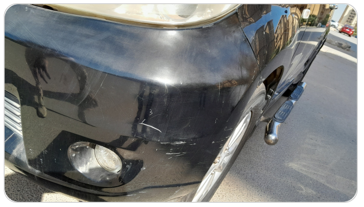
الاكصدام الامامي : فبريكة (كسر)