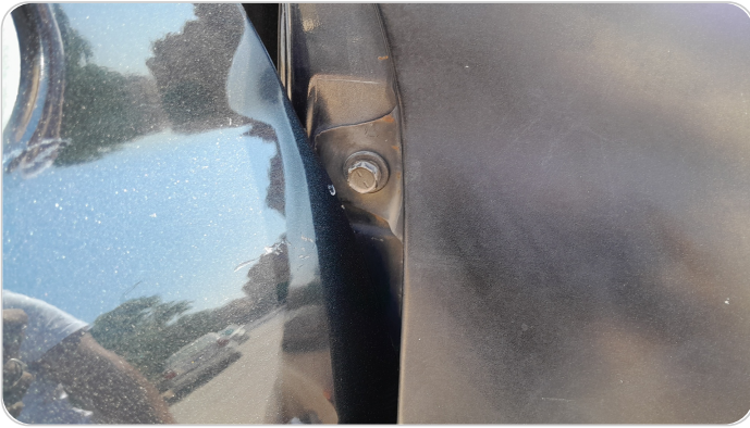
رفرف امامي شمال : اثار فك وتركيب