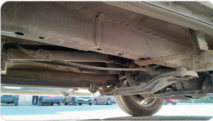
عتب خارجي : تم اضافة عتب