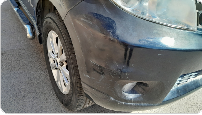
الاكصدام الامامي : فبريكة (كسر)