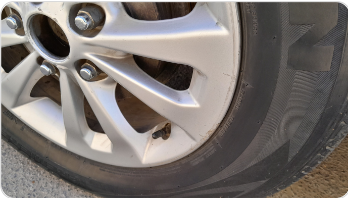
حالة الجنوط الخلفي : تجريحات بسيطه