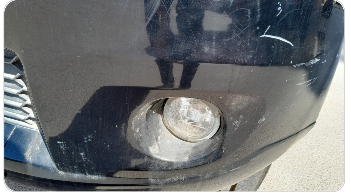
شابورة امامي : كسر في الباغة