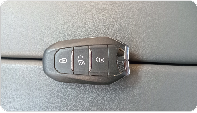
حالة الريموت / المفتاح : يعمل بكفاءة