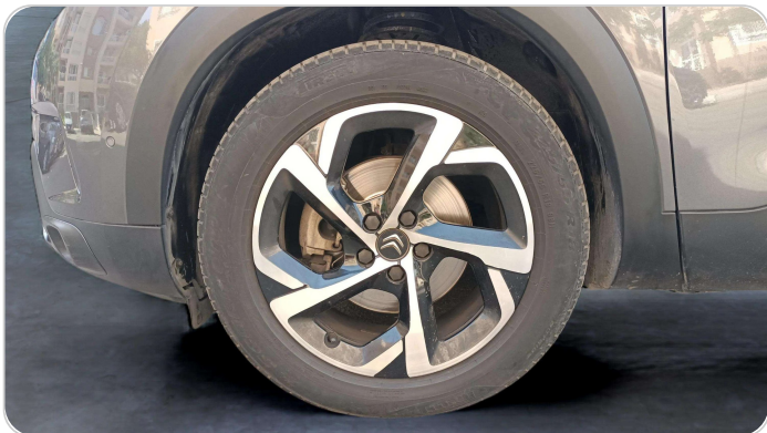
FR L TIRE