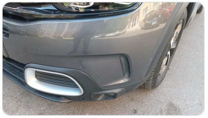
الاكصدام الأمامي : فبريكة (خرايش)