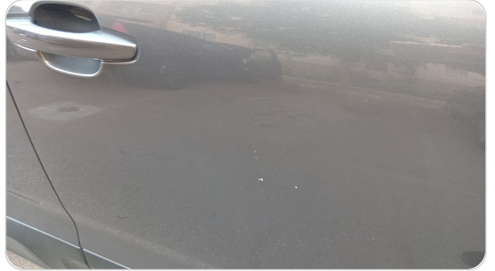
الباب الأمامي يمين : فبريكة (خرايش)