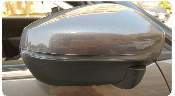
مراية الباب الأمامي يمين : فبريكة (خرايش)