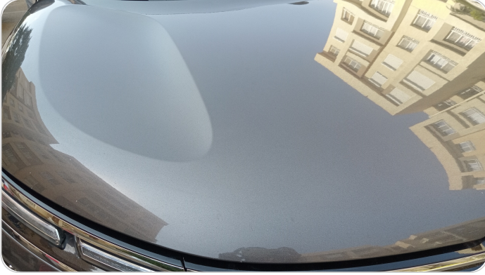
الكبوت : فبريكة (خرابيش)