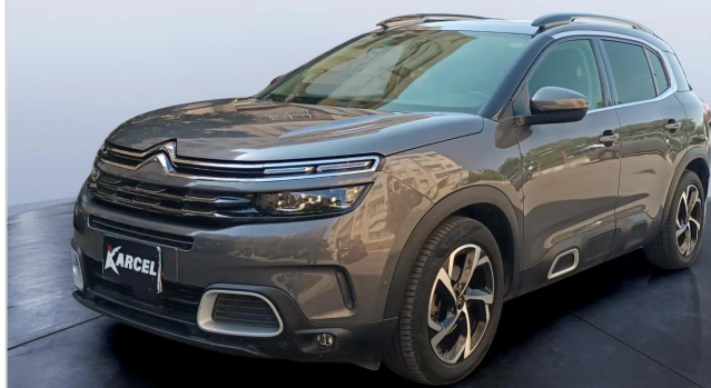
FR L 45