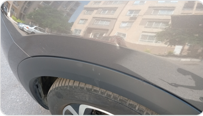
الرفرف الأمامي شمال : فبريكة (خرابيش)