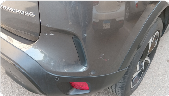
الاكصدام الخلفي :