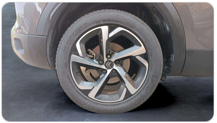
RR R TIRE