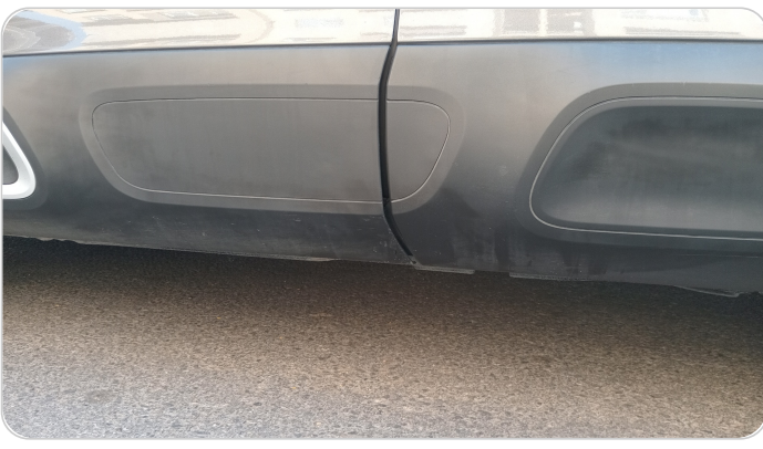
العتب السفلي شمال : فبريكة (خرايش)