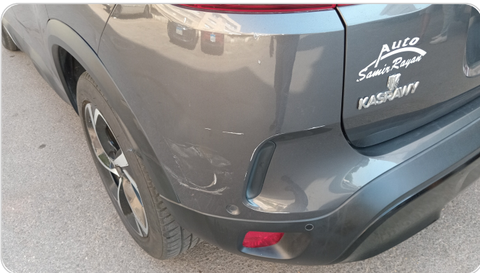
الاكصدام الخلفي : فبريكة (خرايش - خطبات)