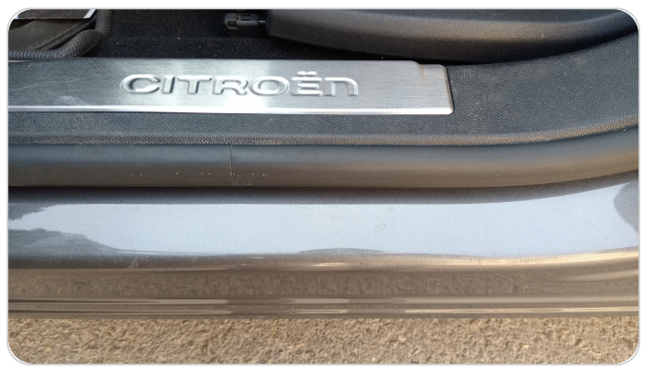
دواخل وقوائم باب الأمامي شمال : فبريكة (خرابيش)