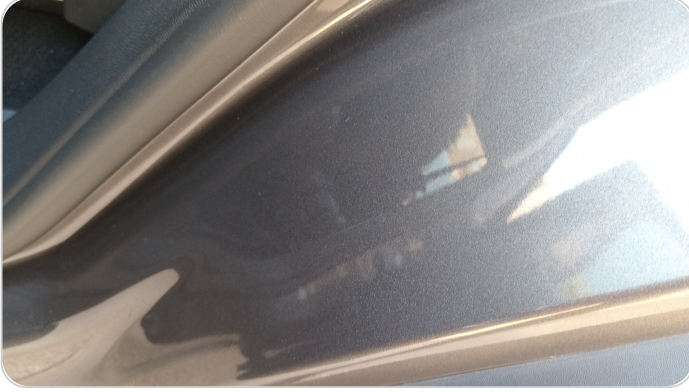
دواخل وقوائم باب الخلفي شمال : فبريكة (خرابيش)