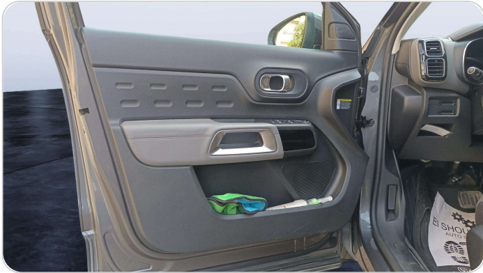
FR L DOOR