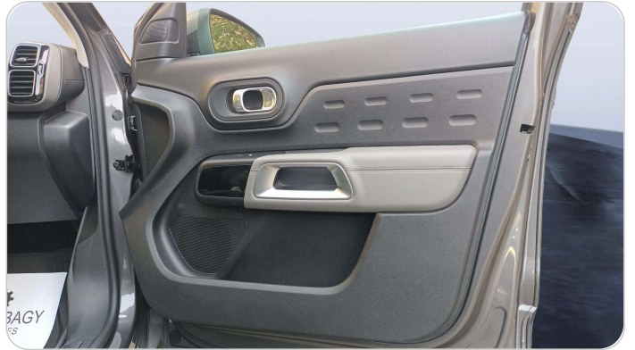
FR R DOOR