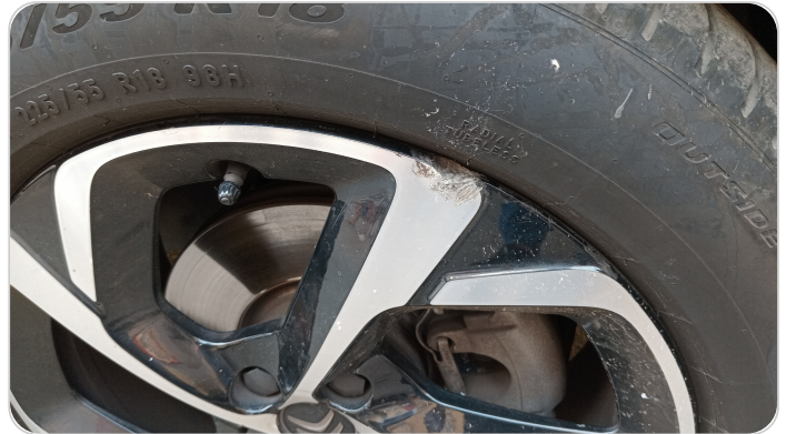
حالة الجنوط الأمامي : آثار خبط أو استعداد