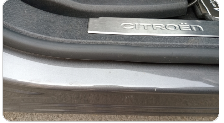
دواخل وقوائم باب أمامي يمين : فبريكة (خرابيش)