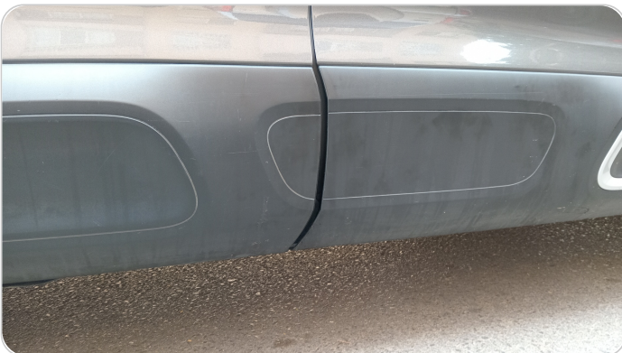
العتب السفلي يمين : فبريكة (خرايش)