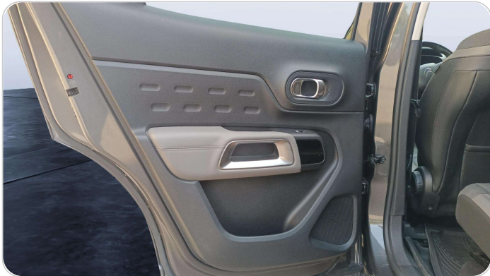
RR L DOOR