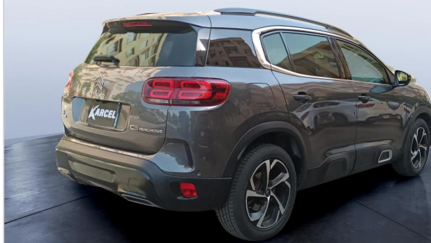
RR R 45