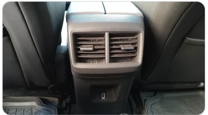
RR AC GRILL