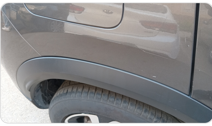
الرفرف الخلفي يمين : فبريكة (خرابيش)