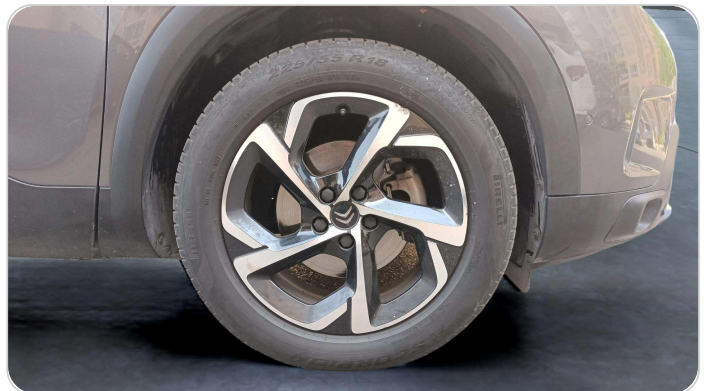
FR R TIRE