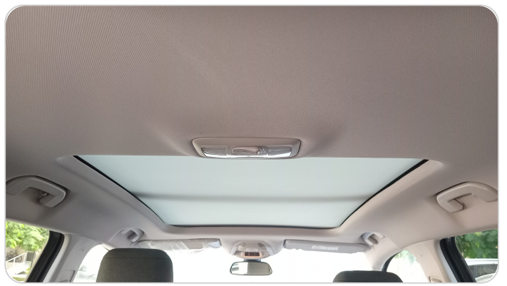
CAR ROOF MAT