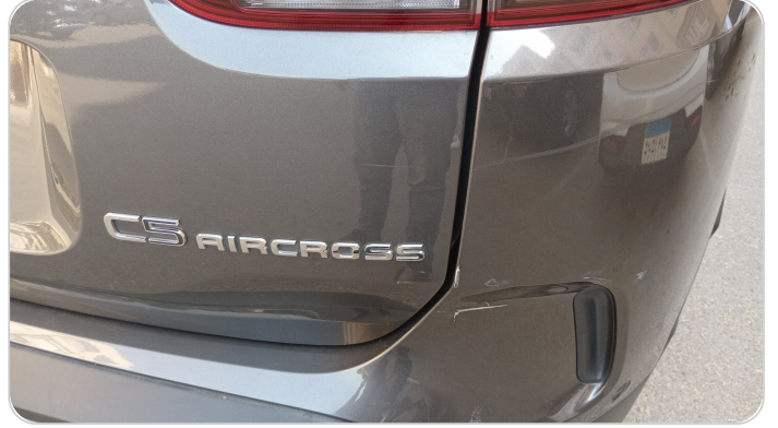
باب الشنطة : فبريكة (خرابيش)