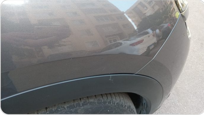
الرفرف الأمامي يمين : فبريكة (خرايش)