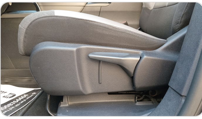
DRIVER SEAT SWITCHES