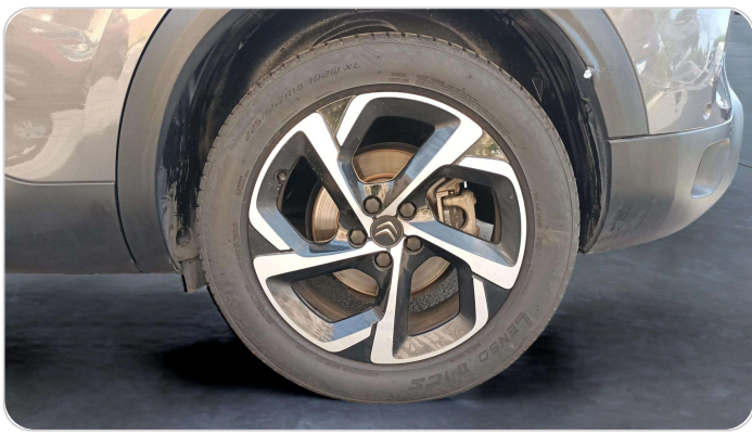
RR L TIRE