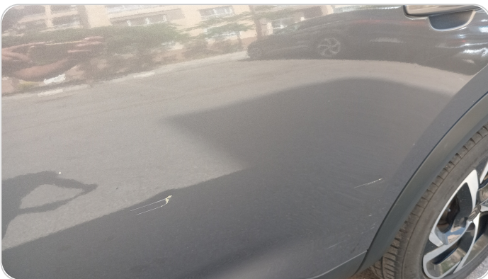
الباب الخلفي شمال : فبريكة (خرابيش)