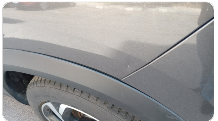
الرفرف الخلفي شمال : فبريكة (خبطات)