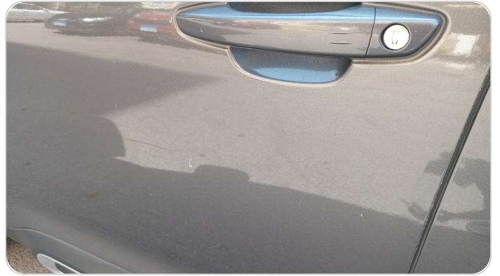
الباب الأمامي شمال : فبريكة (خرابيش)