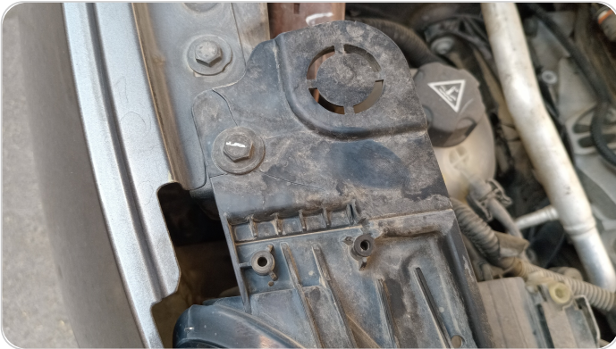
الكشاف الأمامي يمين : كسر في قواعد الكشاف