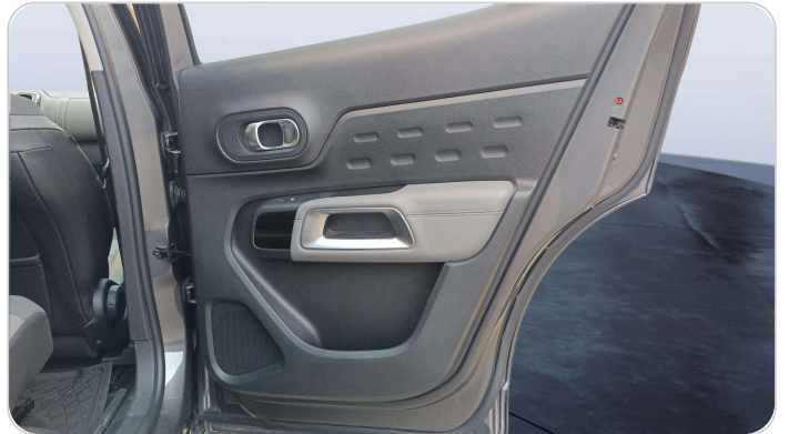
RR R DOOR