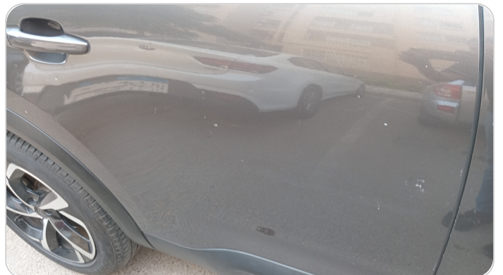
الباب الخلفي يمين : فبريكة (خرايش)