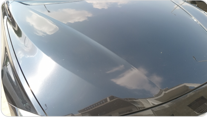
الكبوت : فبريكة (خرابيش)