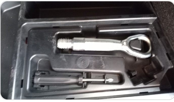
العدة وأدوات الأمان : لا يوجد كوريك