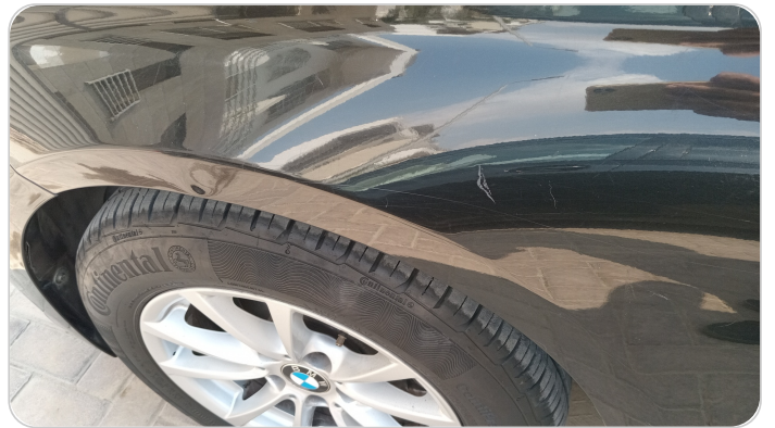
الرفرف الأمامي شمال : فبريكة (خرابيش)