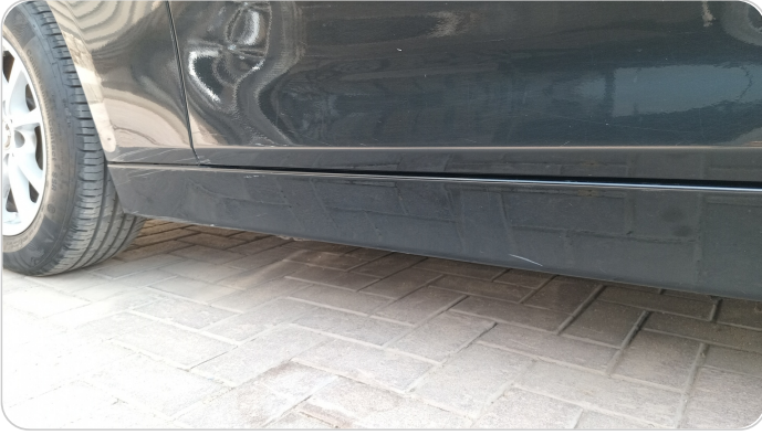
العتب السفلي شمال : فبريكة (خرابيش)