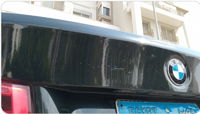
باب الشنطة : فبريكة (خرابيش)