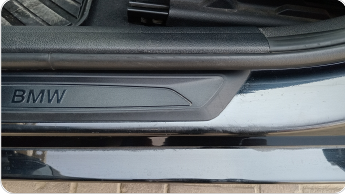
دواخل وقوائم باب الأمامي شمال : فبريكة (خرايش)