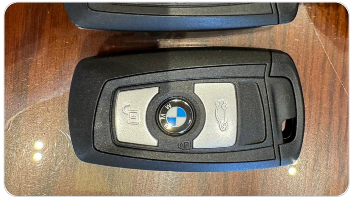
الريموت /المفتاح الاضافي : موجود (لم يتم التجربة)