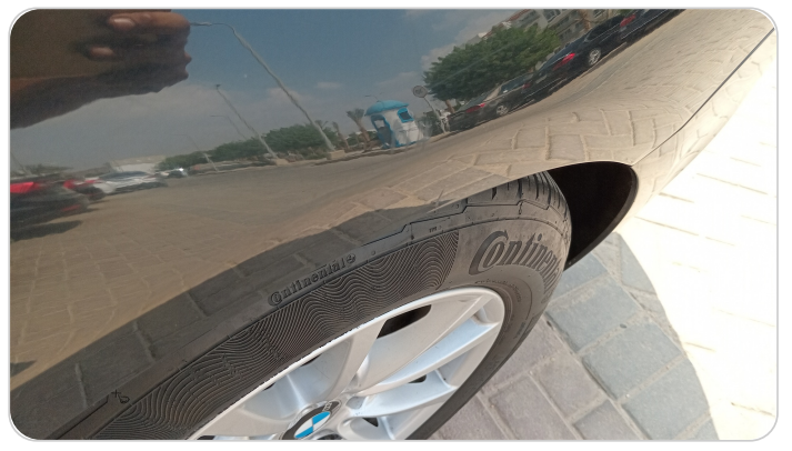
الرفرف الخلفي شمال : فبريكة (خرابيش)