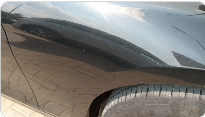
الرفرف الأمامي يمين : فبريكة (خرابيش)