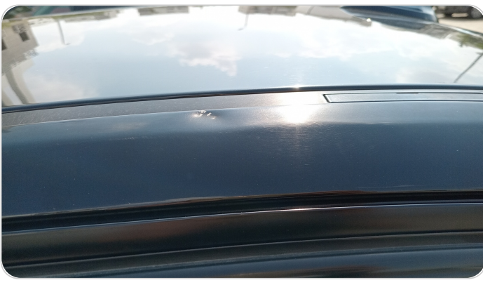
قائم خارجي خلفي شمال : فبريكة (خرابيش - خبطات)