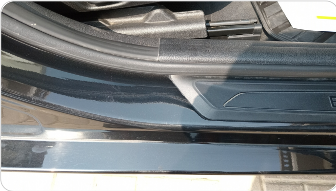
دواخل وقوائم باب أمامي يمين : فبريكة (خرايش)