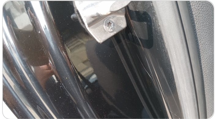
دواخل وقوائم باب خلفي يمين : فبريكة (خرايش)