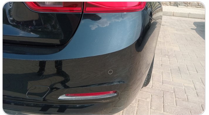
الاكصدام الخلفي : فبريكة (خرابيش)