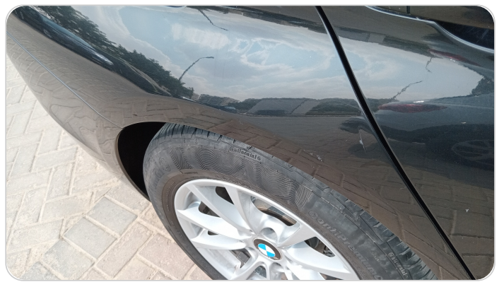
الرفرف الخلفي يمين : فبريكة (خرايش)