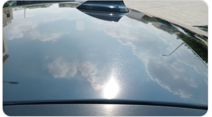
السقف : فبريكة (خرابيش)