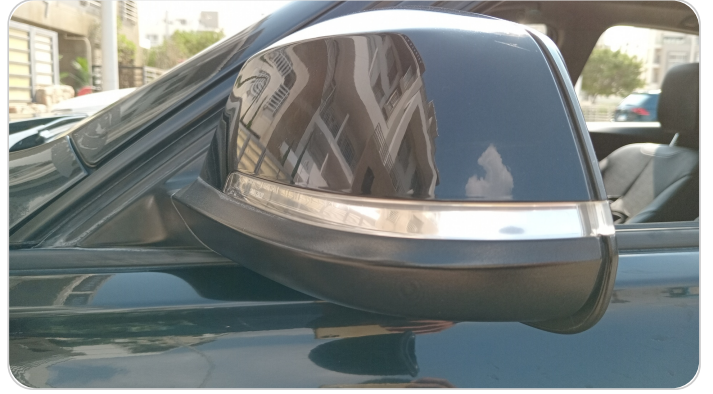
مراية الباب الأمامي شمال : فبريكة (خرابيش)