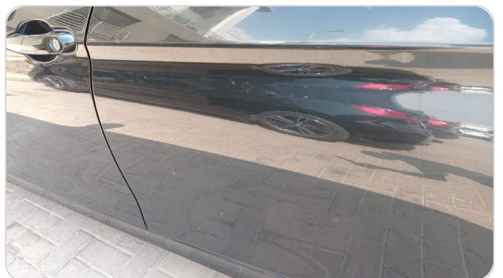
الباب الخلفي شمال : فبريكة (خرابيش)