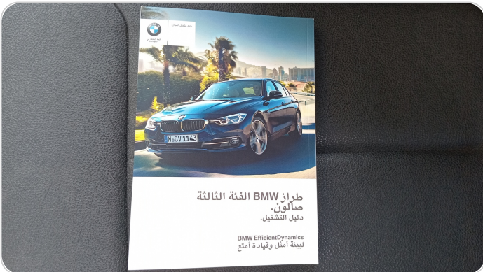
كتالوج السيارة : موجود