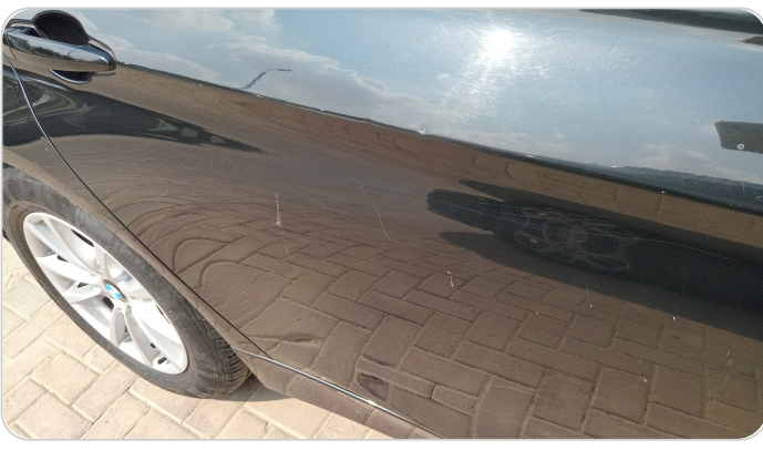
الباب الخلفي يمين : فبريكة (خرايش - خبطات)