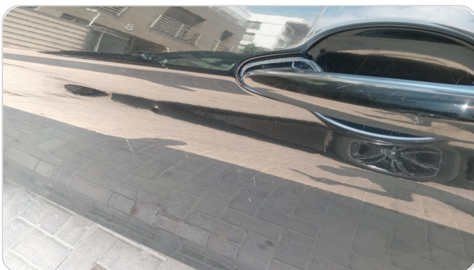
الباب الأمامي شمال : فبريكة (خرابيش)