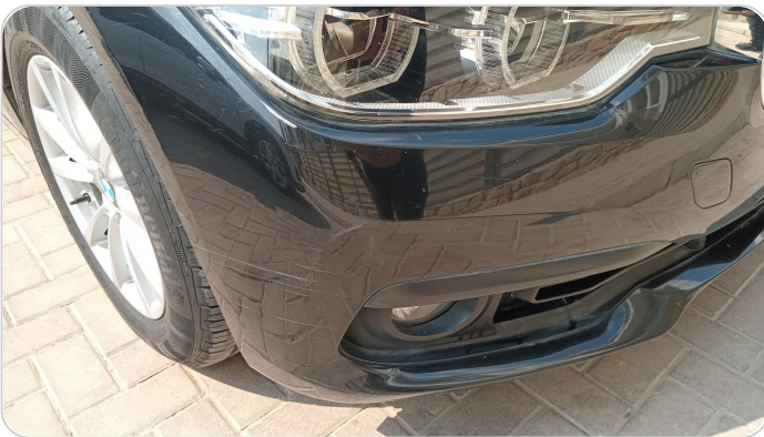
الاكصدام الأمامي : فبريكة (خرابيش)