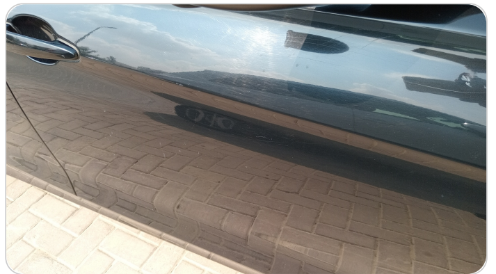
الباب الأمامي يمين : فبريكة (خرابيش)