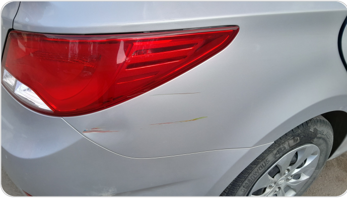
الرفرف الخلفي يمين : فبريكة (خرابيش)