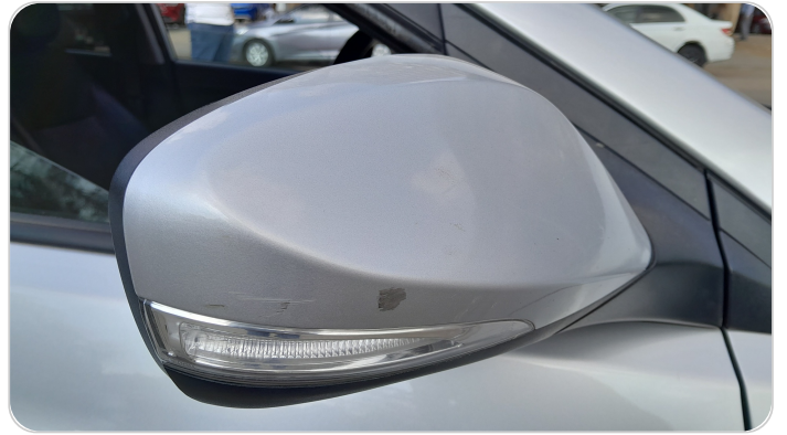
مراية الباب الأمامي يمين : فبريكة (خرابيش)