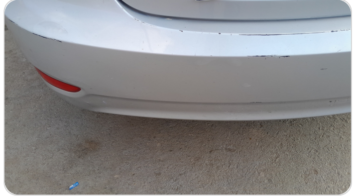
الاكصدام الخلفي : فبريكة (خرابيش)