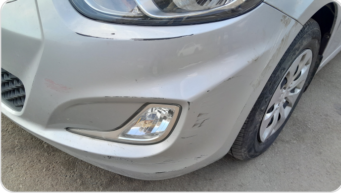
الاكصدام الأمامي : فبريكة (خرابيش)