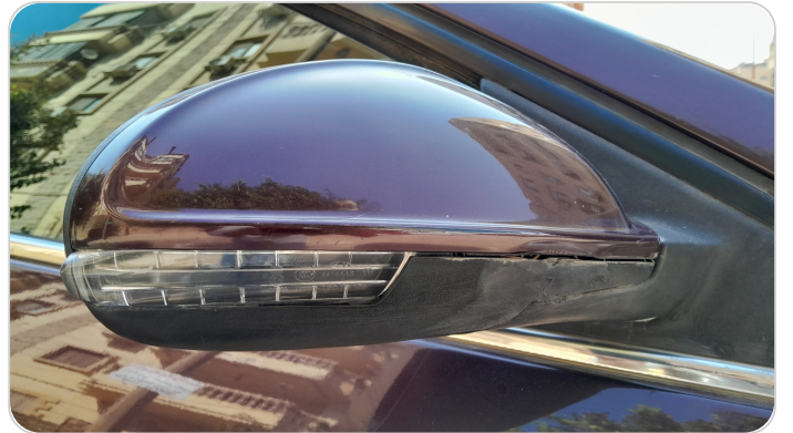
مرآة الباب الأمامي يمين : كسر في الغطاء