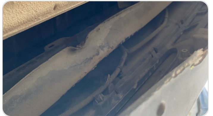
حامل الاكصدام الخلفي : عصرة