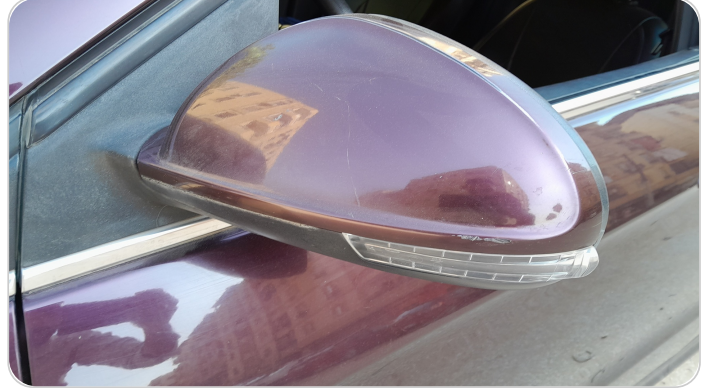
مرآة الباب الأمامي شمال : فبريكة (خرابيش)