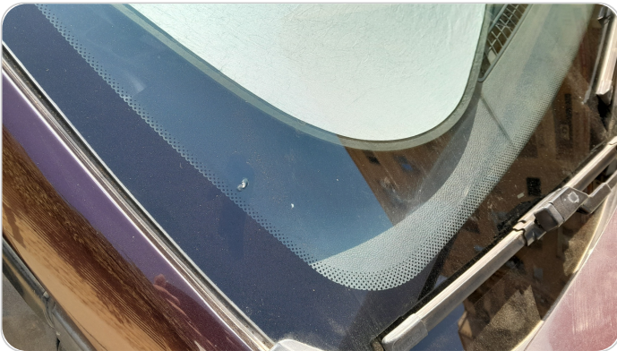
زجاج السيارة الأمامي : نقرة