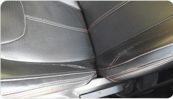
فرش كرسي أمامي شمال : قطع / كسر / شرخ / تلف