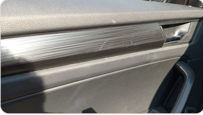
فرش الباب الأمامي شمال : قطع/كسر/شرخ/تلف