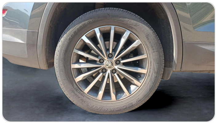
RR R TIRE