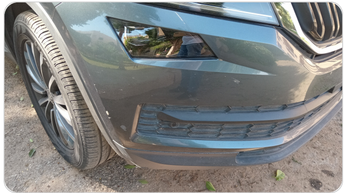
الاكصدام الأمامي : فبريكة (خرابيش)