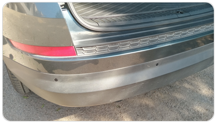
الاكصدام الخلفي : فبريكة (خرابيش)