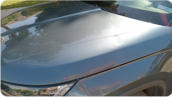
الكبوت : فبريكة (خبطات)