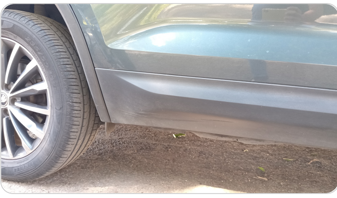
العتب السفلي يمين : فبريكة (خرابيش)