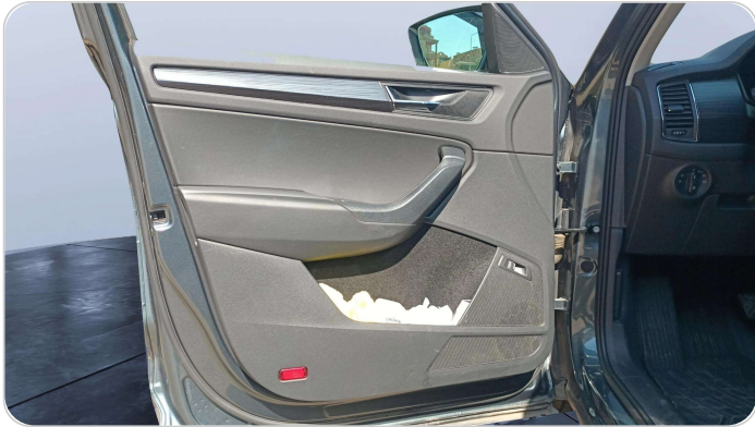
FR L DOOR