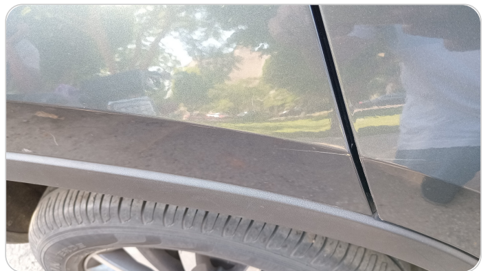
الرفرف الخلفي يمين : فبريكة (خرابيش)