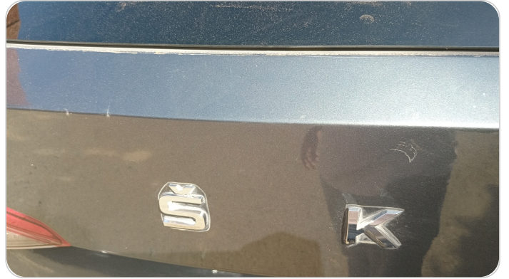
باب الشنطة : فبريكة (خرابيش)