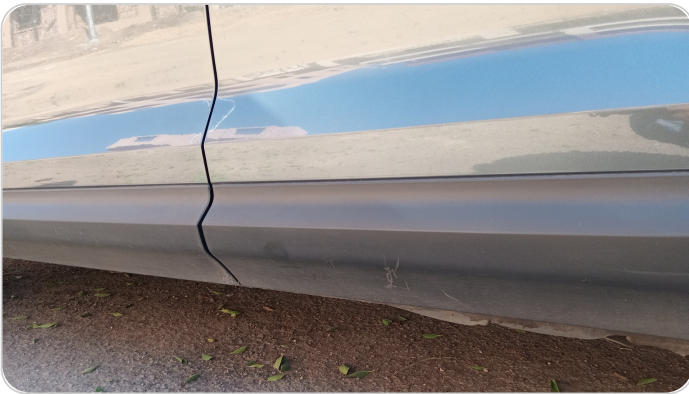
العتب السفلي شمال : فبريكة (خرابيش)