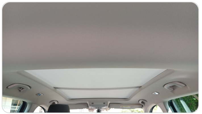
CAR ROOF MAT