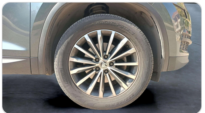
FR R TIRE