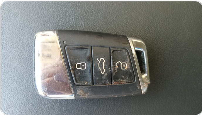
حالة الريموت / المفتاح : يعمل بكفاءة