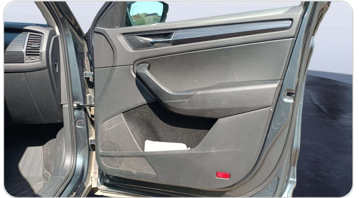
FR R DOOR