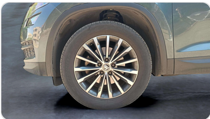
FR L TIRE