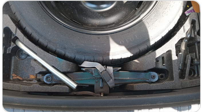
العدة وأدوات الأمان : متوفرة (بحالة جيدة)