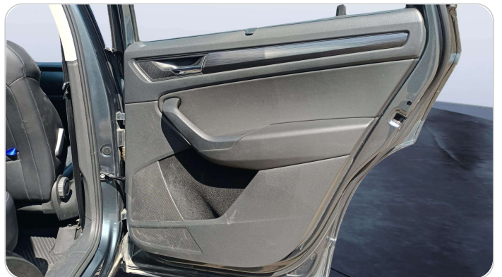
RR R DOOR