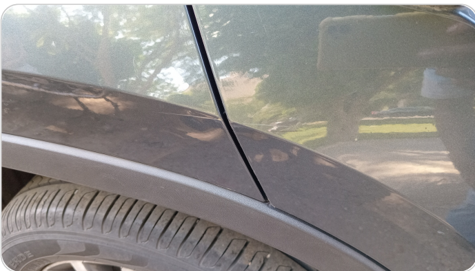
الباب الخلفي يمين : فبريكة (خرابيش)