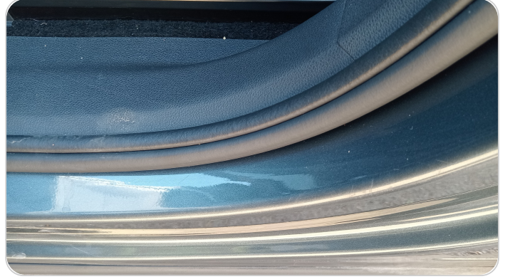
دواخل وقوائم باب الأمامي شمال : فبريكة (خرابيش)