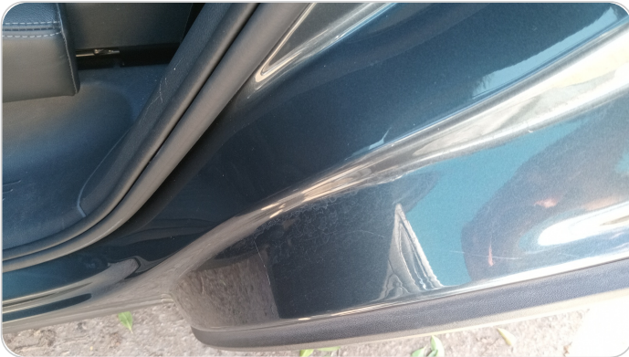
دواخل وقوائم باب الخلفي شمال : فبريكة (خرابيش)