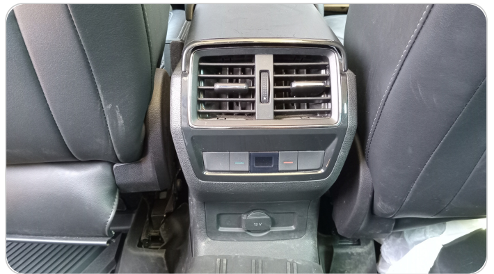
RR AC GRILL