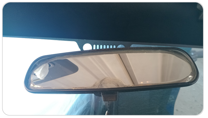
مرآة الزجاج الأمامي : كسر/شرخ