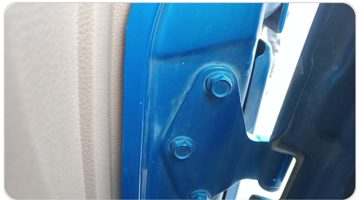
مفصلات ومسامير الباب الأمامي يمين : آثار فك وتركيب