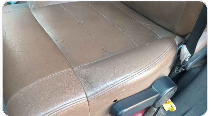
فرش كرسي أمامي شمال : قطع / كسر / شرخ / تلف