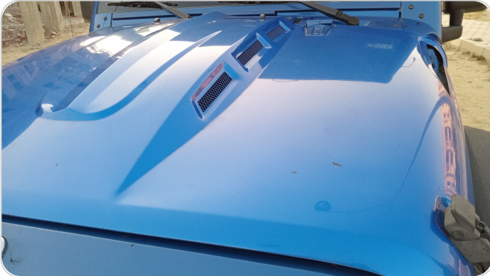
الكبوت : رش بدون معجون (خرابيش)