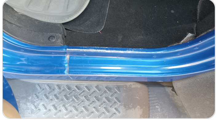
دواخل وقوائم باب الخلفي شمال : فبريكة (خرابيش)