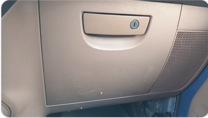
التابلوه : خرابيش