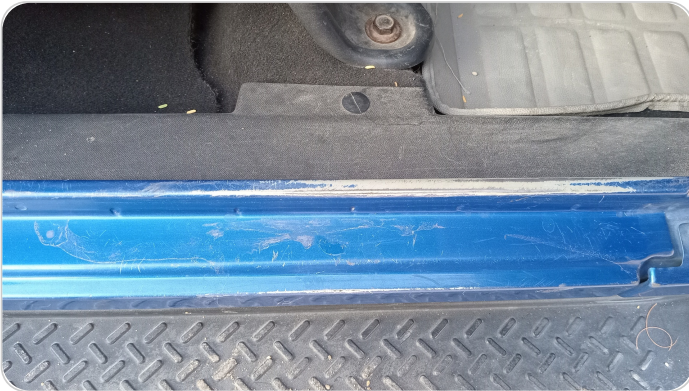
دواخل وقوائم باب أمامي يمين : فبريكة (خرابيش)