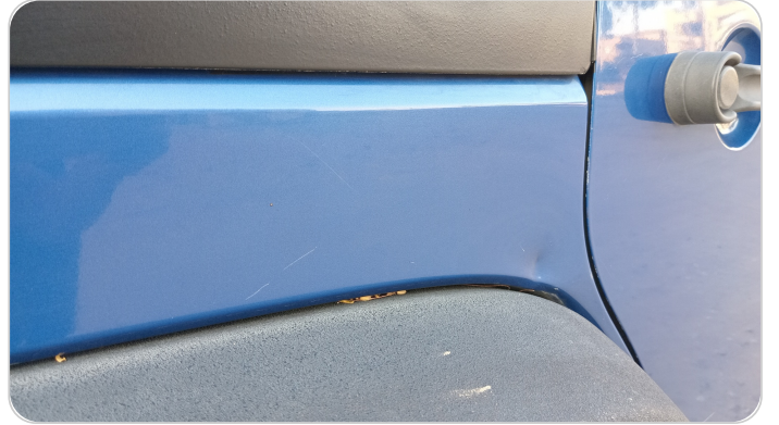
الرفرف الخلفي يمين : فبريكة (خرابيش - خبطات)