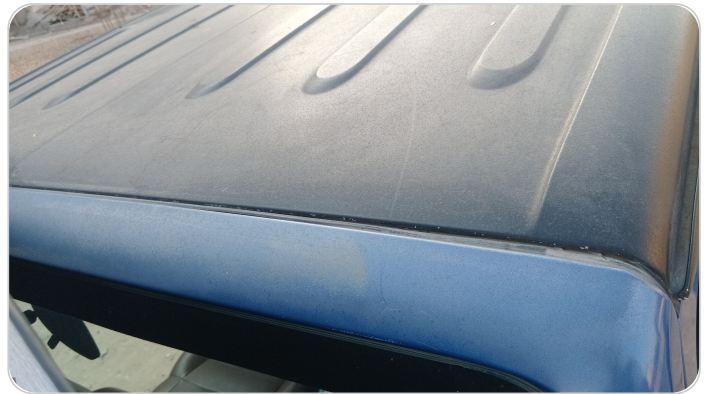
قائم خارجي أمامي شمال : فبريكة (الدهان متآكل)