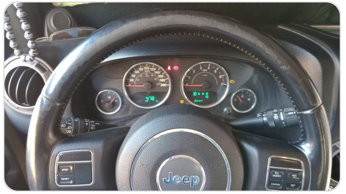
الطاره : متاكله