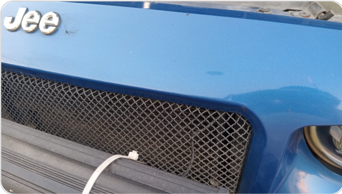
شبكة أمامية : الدهان / النيكل (متآكل)