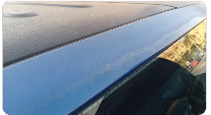
قائم خارجي أمامي يمين : فبريكة (الدهان متآكل)