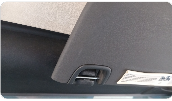
شماسات أمامية : تلف الشماسيتين الاماميه