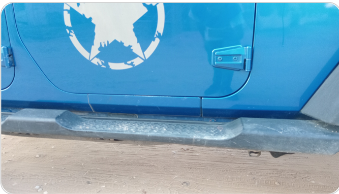
العتب السفلي يمين : فبريكة (خرابيش)