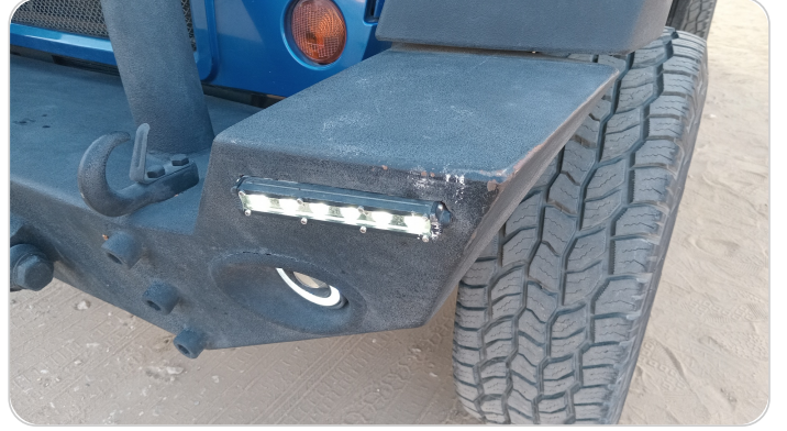
الاكصدام الأمامي : رش مع معجون (خرابيش)