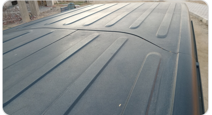
السقف : فبريكة (خرابيش)