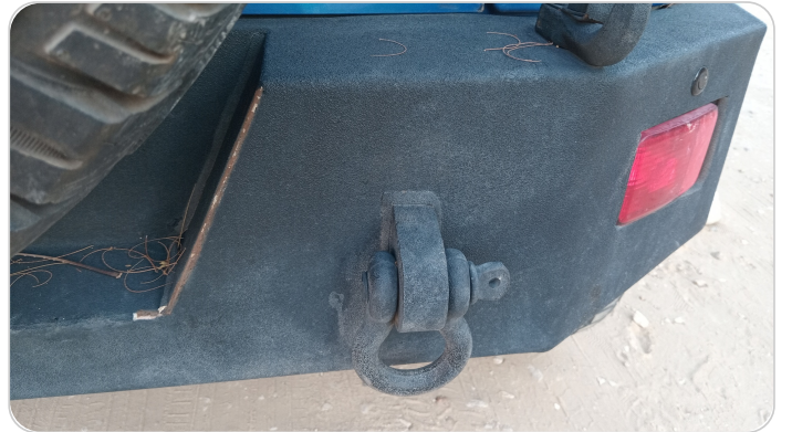
الاكصدام الخلفي : رش مع معجون (خرابيش)