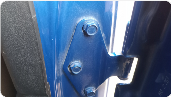
مفصلات ومسامير الباب الخلفي يمين : آثار فك وتركيب