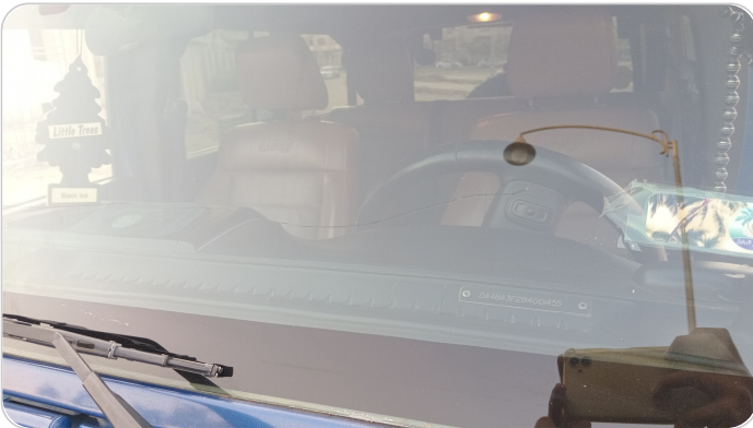
زجاج السيارة الأمامي : شروخ أو كسور