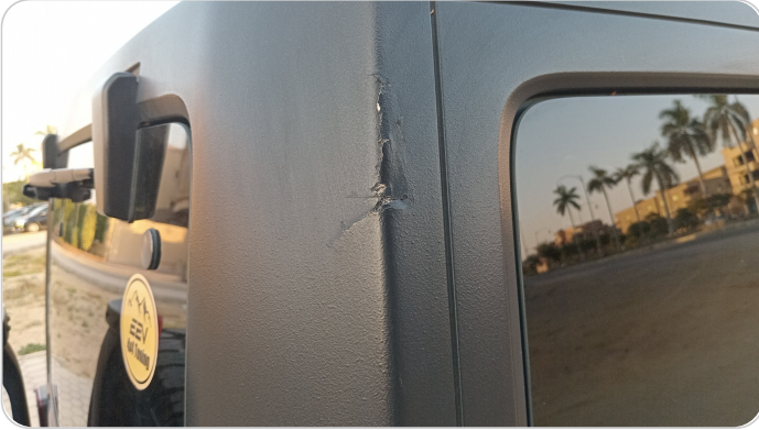
قائم خارجي خلفي يمين : رش بدون معجون (صدمة)