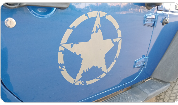
الباب الأمامي يمين : رش بدون معجون (خرابيش)