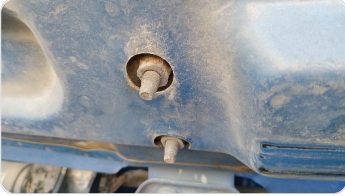
مفصلات ومسامير الكبوت : آثار فك وتركيب