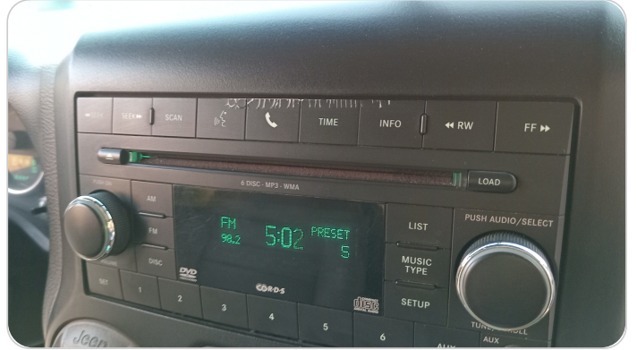
الكاسيت : تاكل في مفاتيح التحكم