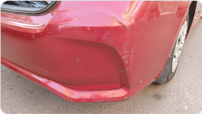
الاكصدام الخلفي : رش بدون معجون (خرابيش)