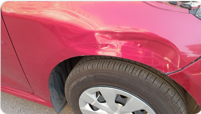
الرفرف الأمامي يمين : فبريكة (صدمة كبيرة)