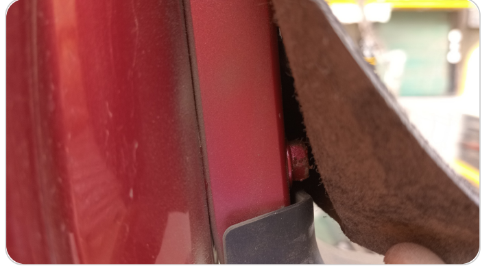
مفصلات ومسامير الشنطة : آثار فك وتركيب