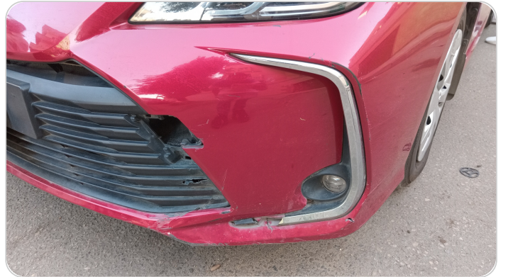
الاكصدام الأمامي : فبريكة (كسر)