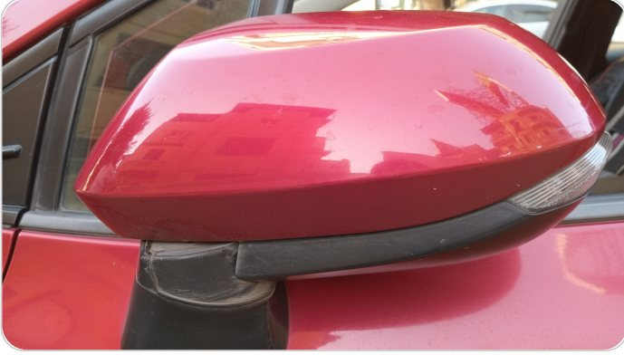
مرآة الباب الأمامي شمال : فبريكة (خرابيش)