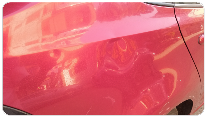
قائم خارجي خلفي يمين : فبريكة (خبطات)