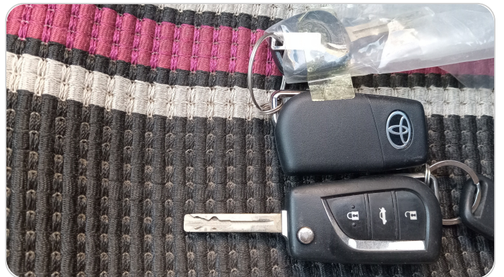
الريموت /المفتاح الاضافي : يعمل بكفاءة