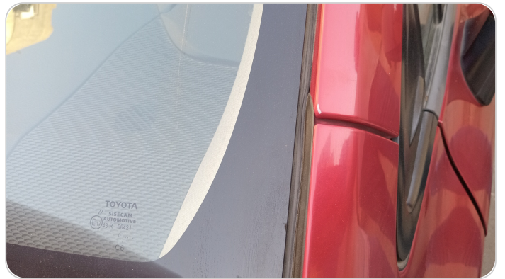
قائم خارجي أمامي شمال : فبريكة (الدهان متآكل)