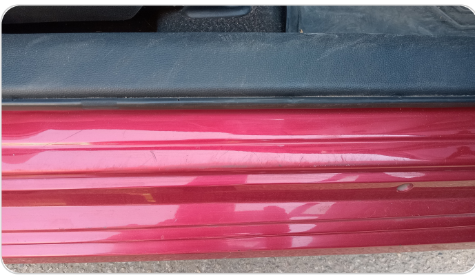
دواخل وقوائم باب أمامي يمين : فبريكة (خرايبش)