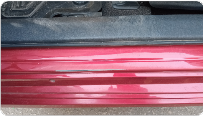
دواخل وقوائم باب الأمامي شمال : فبريكة (خرايش)