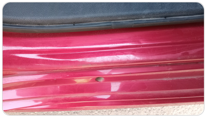
دواخل وقوائم باب خلفي يمين : فبريكة (خرايبش)