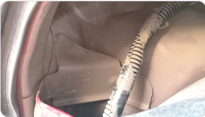
فجوه كشاف خلفي شمال : اعمال سمكره علي البارد