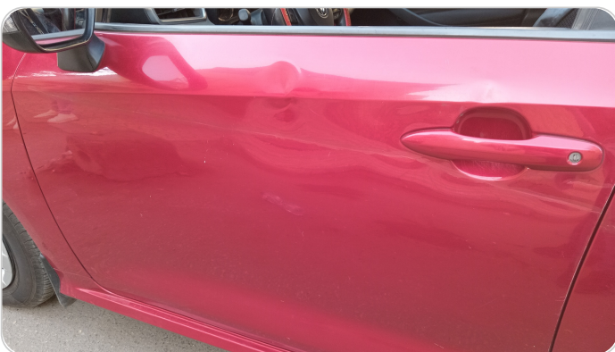
الباب الأمامي شمال : فبريكة (خرايش - خبطات)