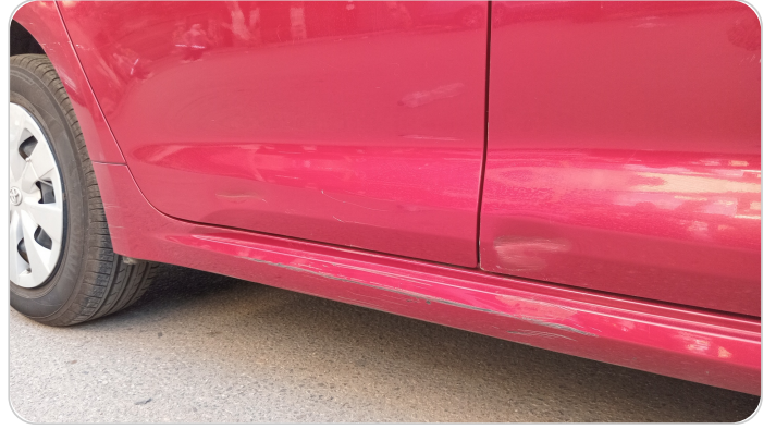
العتب السفلي يمين : فبريكة (خرايش - خبطات)