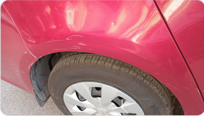
الرفرف الخلفي يمين : فبريكة (خرايش - خبطات)