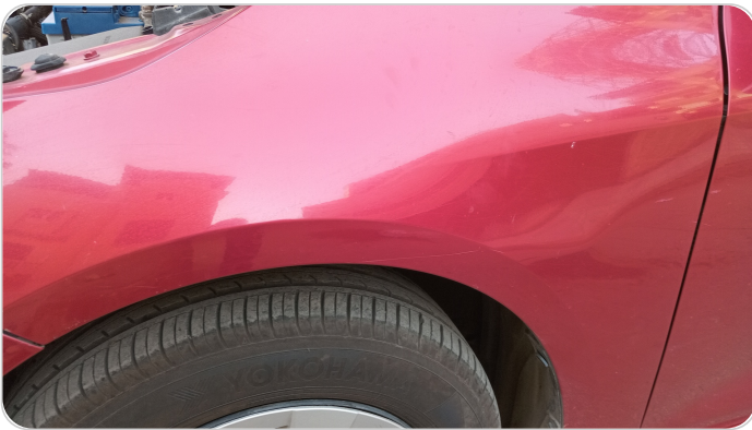
الرفرف الأمامي شمال : فبريكة (خرايش - خبطات)