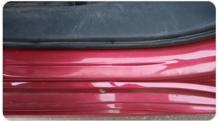
دواخل وقوائم باب الخلفي شمال : فبريكة (خرايش)