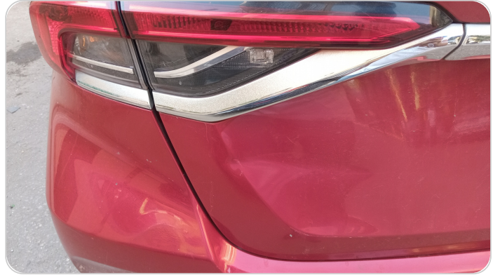
باب الشنطة : رش مع معجون (خبطات)