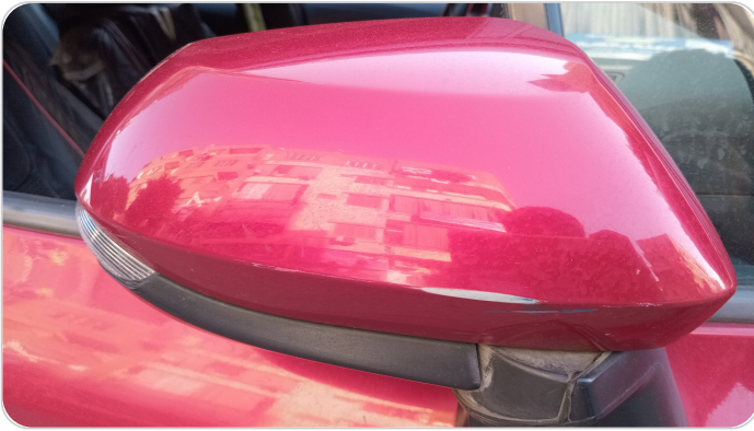
مراية الباب الأمامي يمين : فبريكة (خرايش)