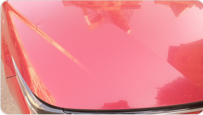
الكبوت : فبريكة (خرايش - خبطات)