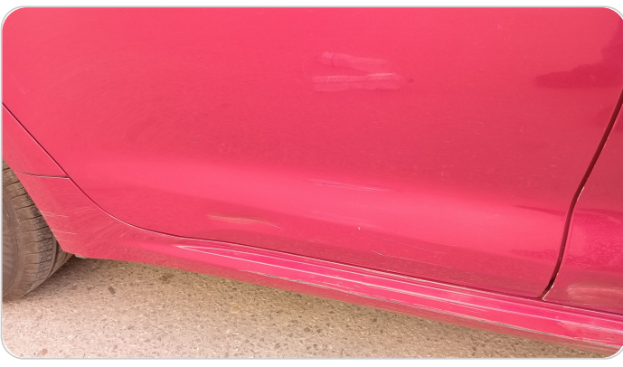
الباب الخلفي يمين : فبريكة (خرايش - خبطات)