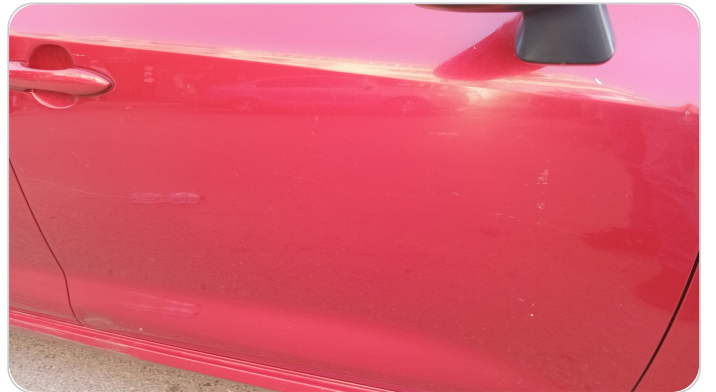
الباب الأمامي يمين : فبريكة (خرابيش - خبطات)