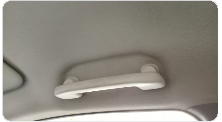
مقبض يد السقف أمامي يمين : كسر / تالف