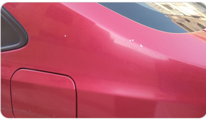
قائم خارجي خلفي شمال : رش بدون معجون (خرابيش)