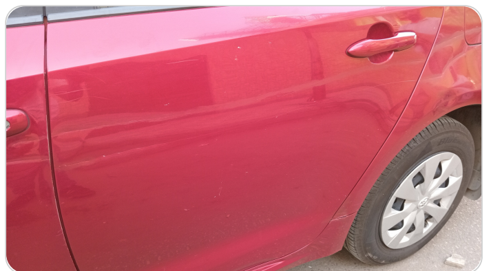
الباب الخلفي شمال : فبريكة (خرايش - خبطات)