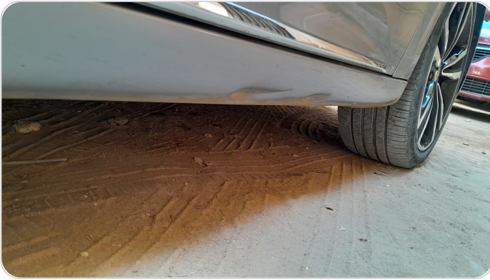
العتب السفلي يمين : فبريكة (خطات)