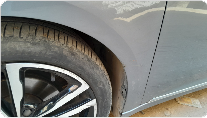
الرفرف الأمامي شمال : فبريكة (خرابيش)