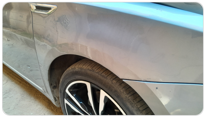
الرفرف الأمامي يمين : فبريكة (خرابيش)