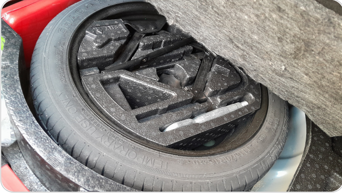
العدة وأدوات الأمان : متوفرة (بحالة جيدة)