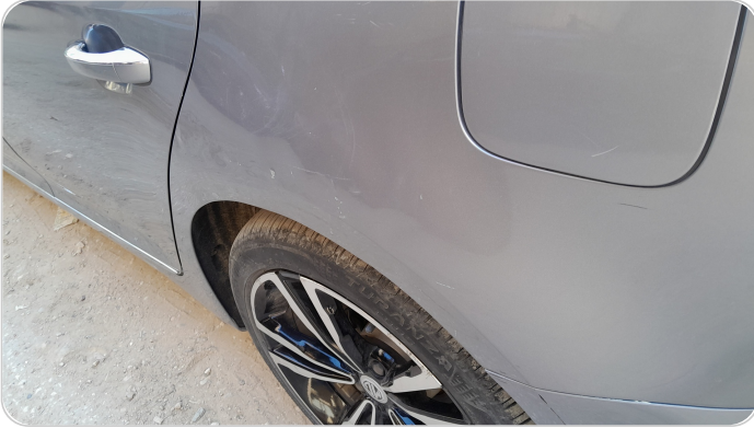
الرفرف الخلفي شمال : فبريكة (سمكره على البارد)