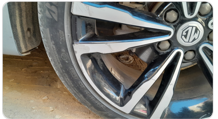
حالة الجنوط الخلفي : تجريحات بسيطه