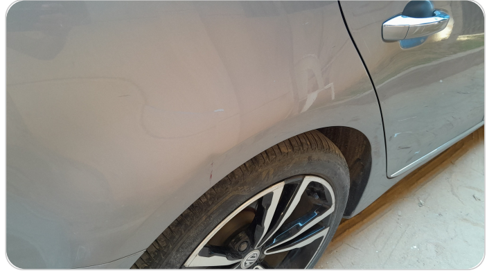
الرفرف الخلفي يمين : فبريكة (خرابيش)