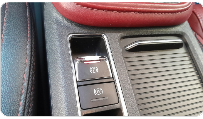
الكنسول الوسطي : تقشير