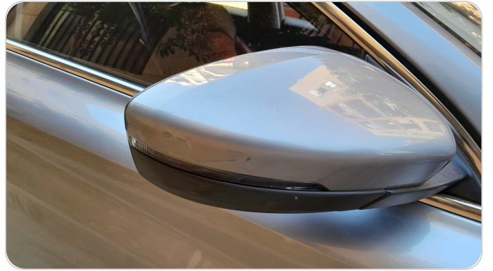
مراية الباب الأمامي يمين : فبريكة (خرابيش)