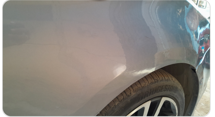
الرفرف الأمامي يمين : فبريكة (سمكره على البارد)