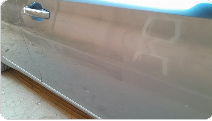
الباب الأمامي يمين : فبريكة (خرابيش)