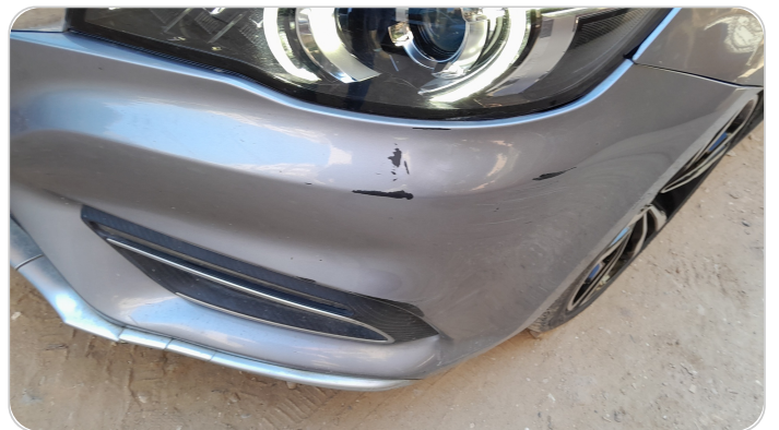
الكصدام الأمامي : فبريكة (خرابيش)