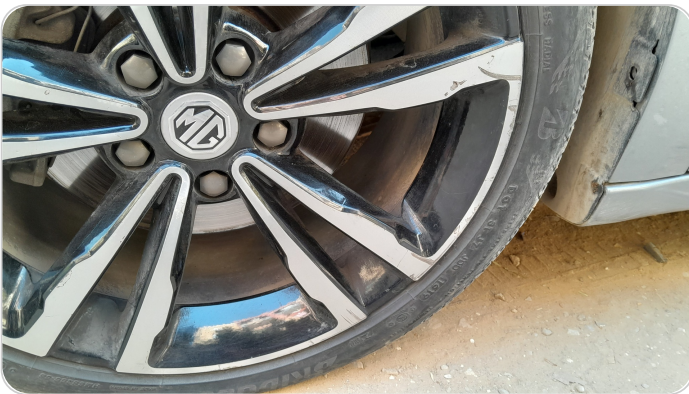
حالة الجنوط الأمامي : تجريحات بسيطة