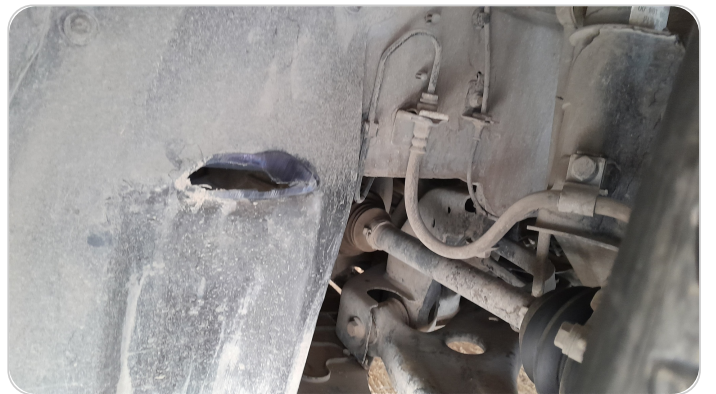
كرتيرة عجل امامي شمال : قطع