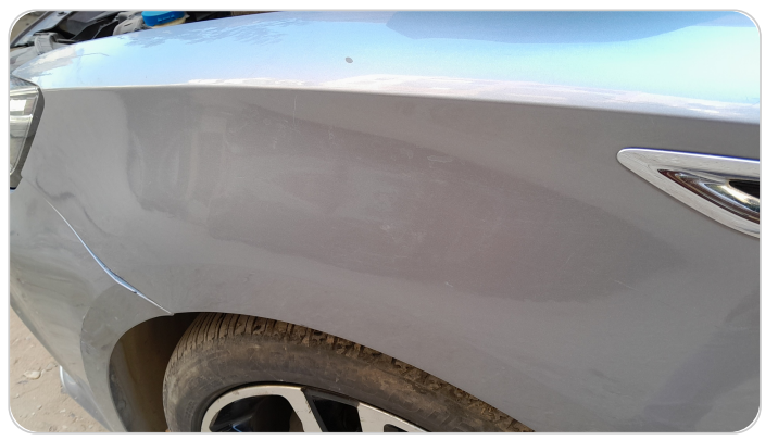
الرفرف الأمامي شمال : فبريكة (سمكره على البارد)