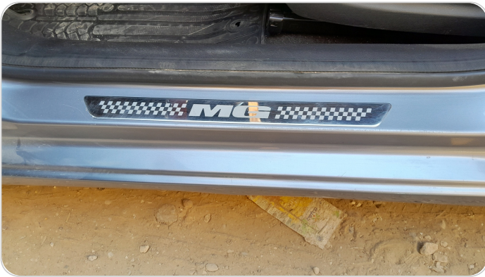
دواخل وقوائم باب الأمامي شمال : فبريكة (خرابيش)