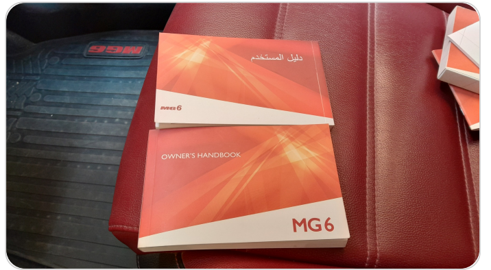
كتالوج السيارة : موجود