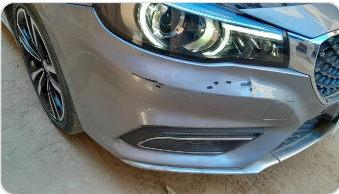
اكصدام امامي : فبريكة (خرابيش)