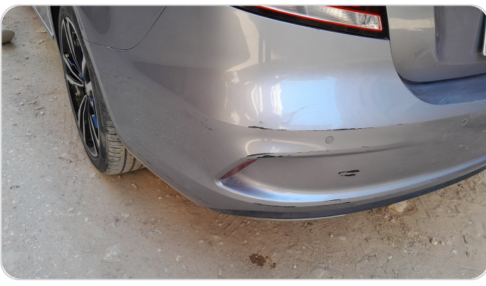
الاكصدام الخلفي : فبريكة (خرابيش)