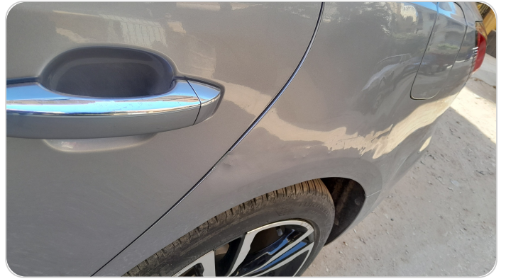
الرفرف الخلفي شمال : فبريكة (خرابيش)