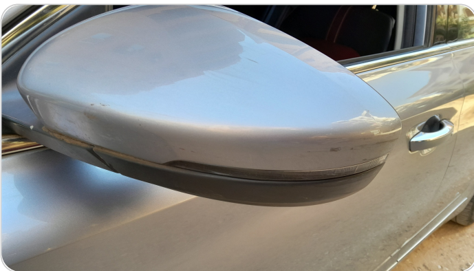
مراية الباب الأمامي شمال : فبريكة (خرابيش)