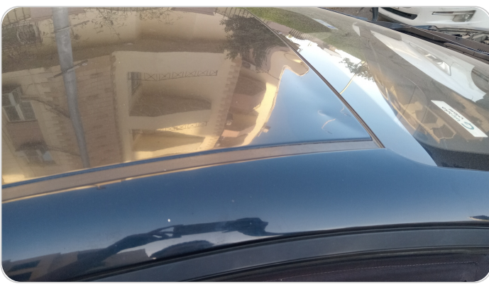
السقف : فبريكة (خرايش - خبطات)