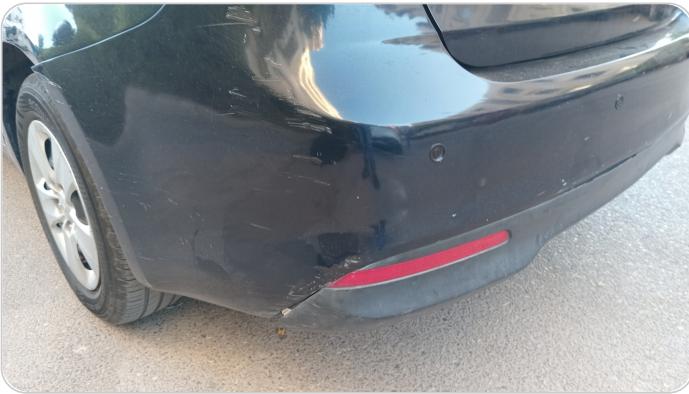
الاكصدام الخلفي : رش مع معجون (خرايش)