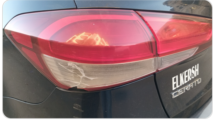
الكشاف الخلفي شمال : كسر بالباغة