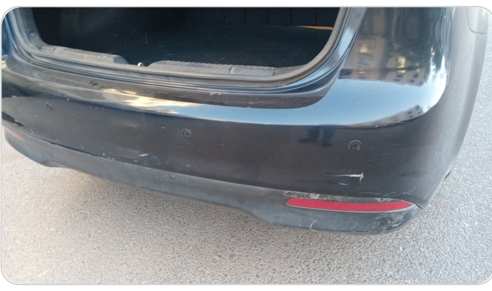
الاكصدام الخلفي : رش مع معجون (خرايش)