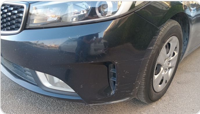
الاكصدام الأمامي : رش مع معجون (خرايش)