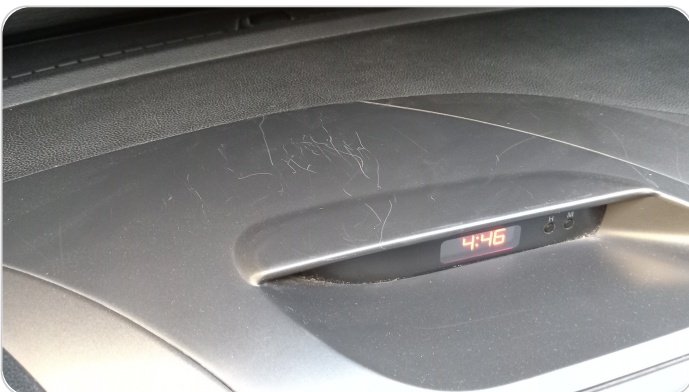
الكونسول الوسط : قطع / كسر / شرخ / تلف