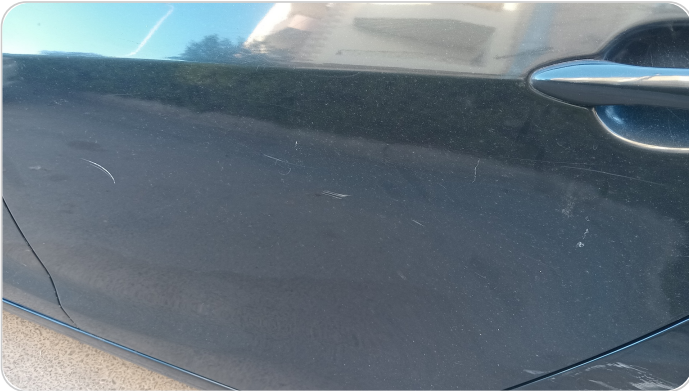
الباب الخلفي شمال : رش مع معجون (خرايش)