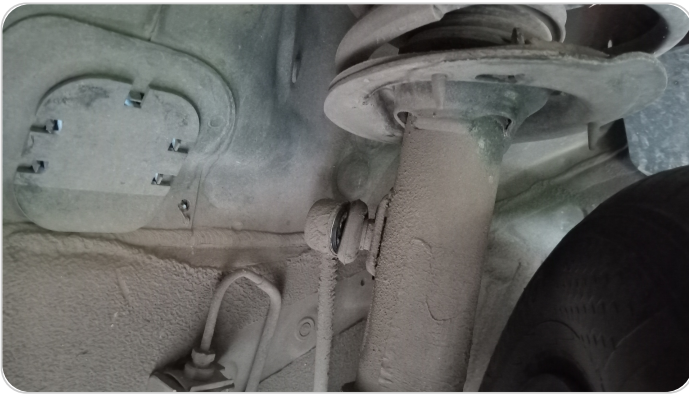
ذراع الميزان : تشققات (كاوتش الميزان)