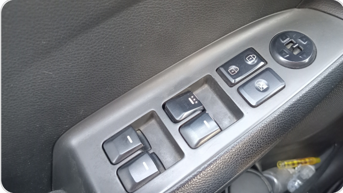
لوحة مفاتيح الزجاج الرئيسية : كسر / فقد في بعض المفاتيح