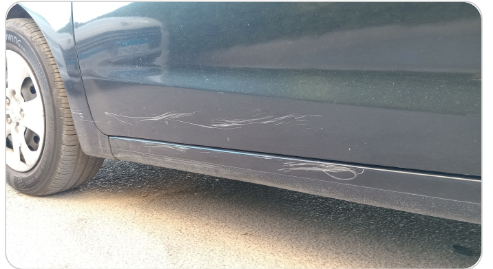
العتب السفلي شمال : رش بدون معجون (خبطات)