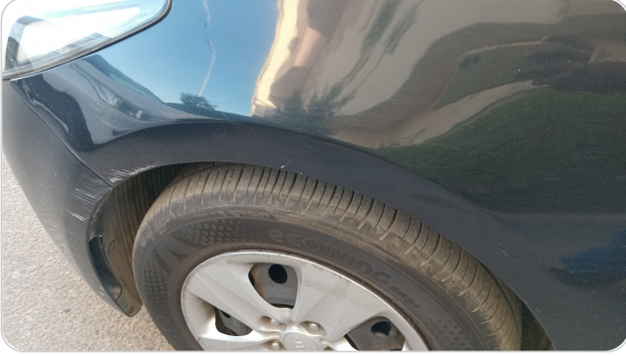
الرفرف الأمامي شمال : رش مع معجون (خرايش)