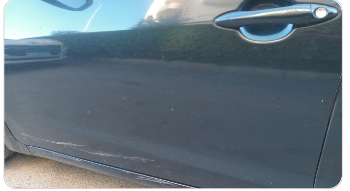
الباب الأمامي شمال : رش مع معجون (خرايش)