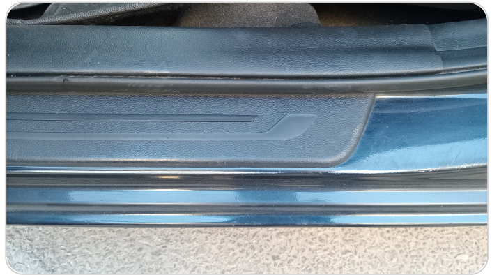
دواخل وقوائم باب الأمامي شمال : فبريكة (خرايش)