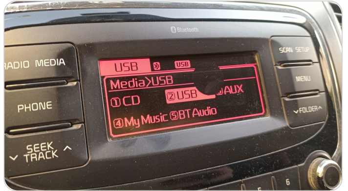
الكاسيت : تلف بالشاشة