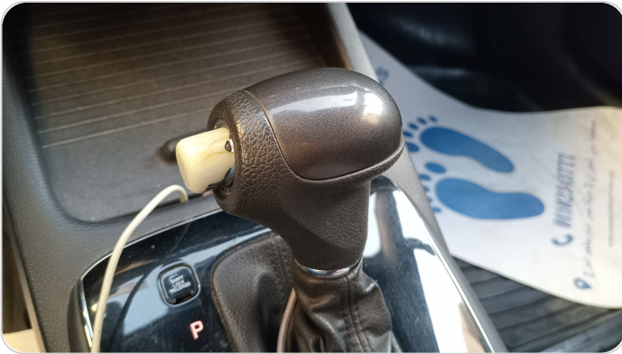
الكونسول الوسط : قطع / كسر / شرخ / تلف