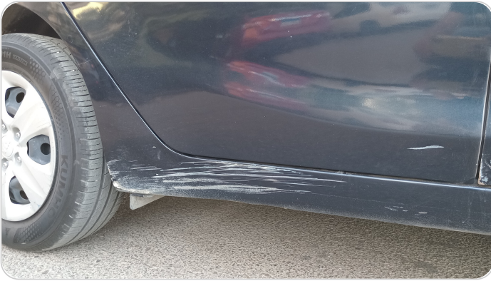
العتب السفلي يمين : رش مع معجون (خبطات)