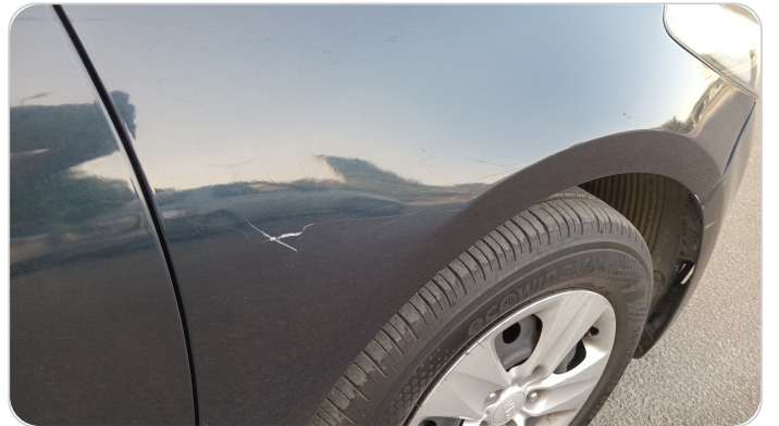
الرفرف الأمامي يمين : رش مع معجون (خرايش)