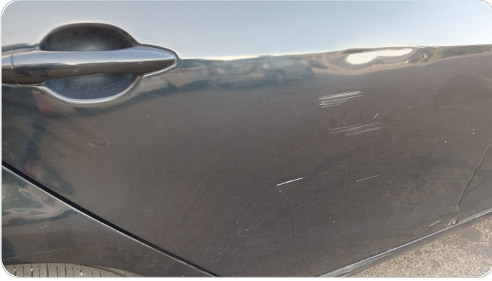
الباب الخلفي يمين : رش مع معجون (خبطات)