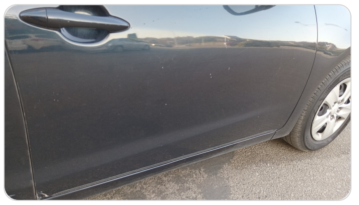
الباب الأمامي يمين : رش مع معجون (خرايش)