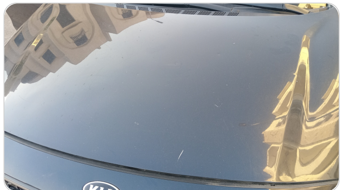
الكبوت : فبريكة (خرايش - خطبات)