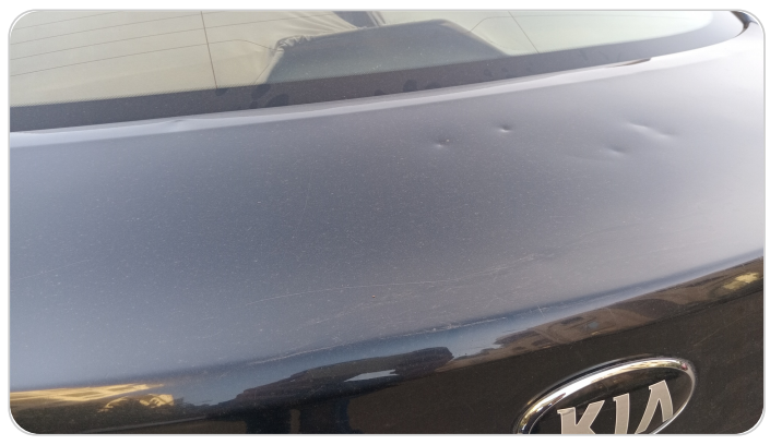
باب الشنطة : فبريكة ( خرايش _خبطات )