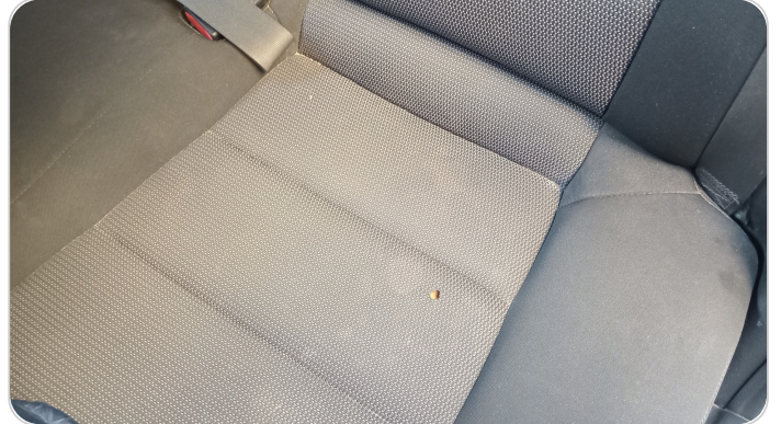
فرش كنبه خلفي : قطع / كسر / شرخ / تلف