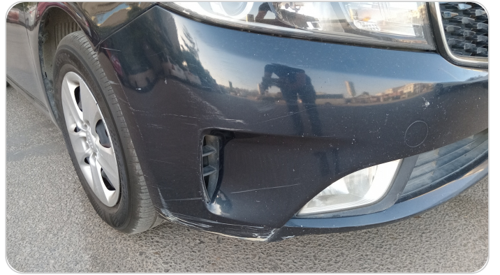
الاكصدام الامامي : رش مع معجون (خرايش)