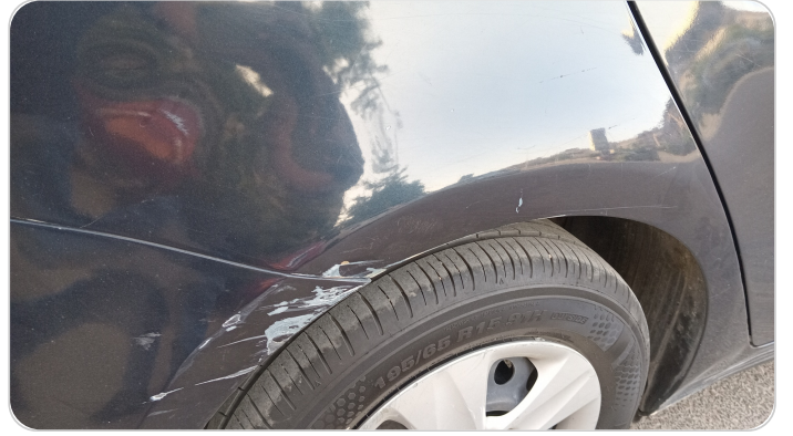
الفراف الخلفي يمين : رش مع معجون (خبطات)