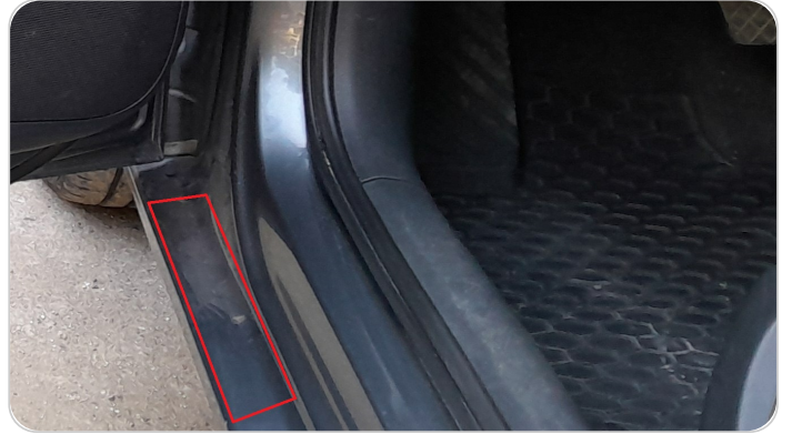
العتب الامامي شمال من الداخل : رش جزئي