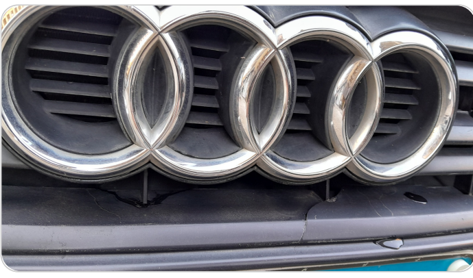
شبكة أمامية : شرخ / كسر