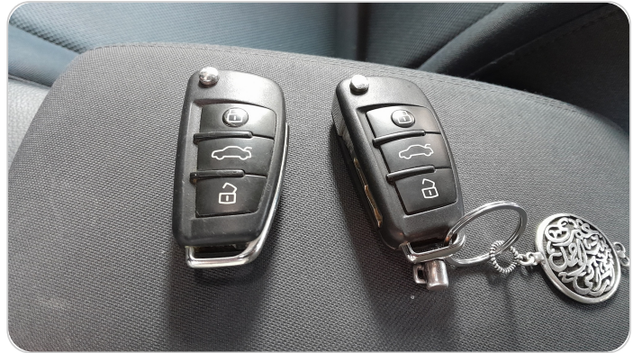
الريموت /المفتاح الاضافي : يعمل بكفاءة