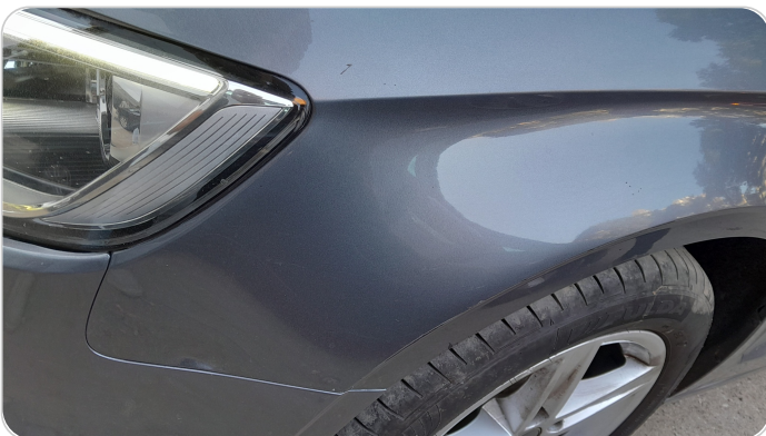
الرفرف الأمامي شمال : فبريكة (خرايش)