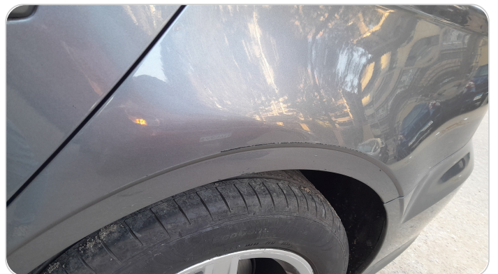
الرفرف الخلفي شمال : فبريكة (خرايش)