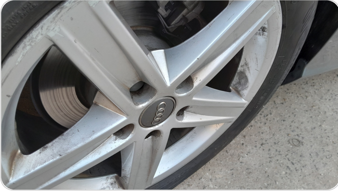
حالة الجنوط الخلفي : تجريحات بسيطه