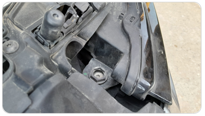
الكشاف الأمامي شمال : كسر في قواعد الكشاف