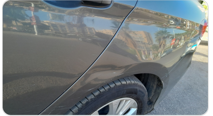
الرفرف الخلفي شمال : فبريكة (خرابيش - خبطات)