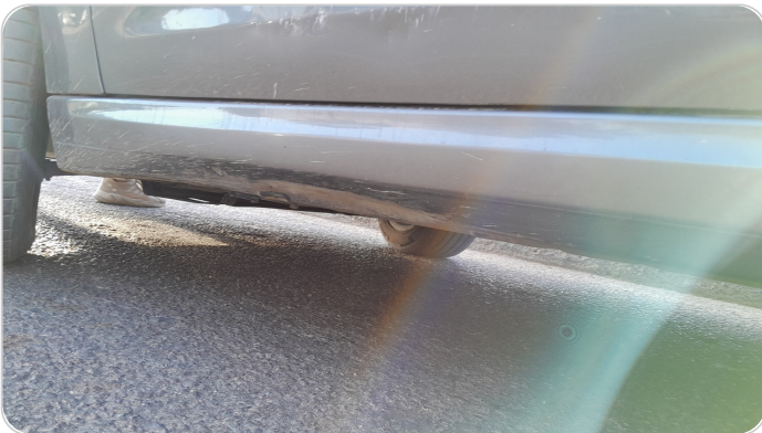
العتب السفلي شمال : فبريكة (خبطات)