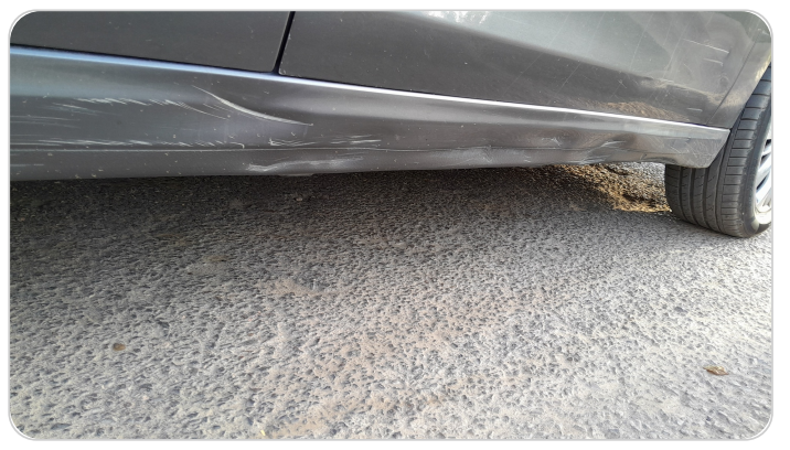
العتب السفلي يمين : فبريكة (خرابيش - خبطات)