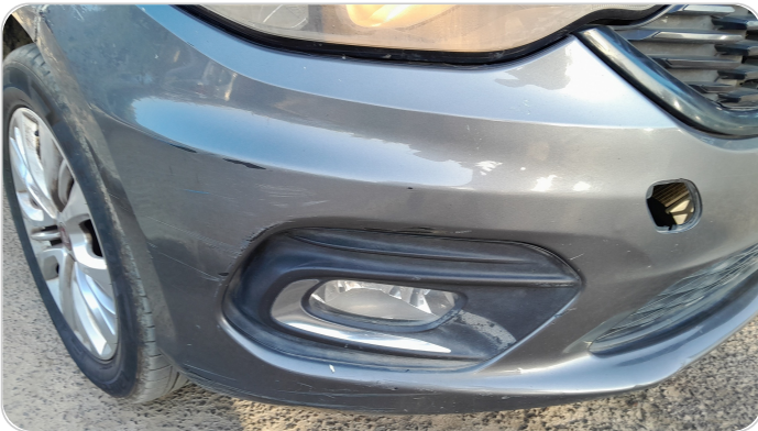
الاكصدام الأمامي : فقد في الطبقة