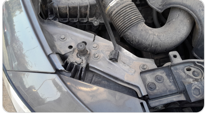
الكشاف الأمامي يمين : كسر في قواعد الكشاف