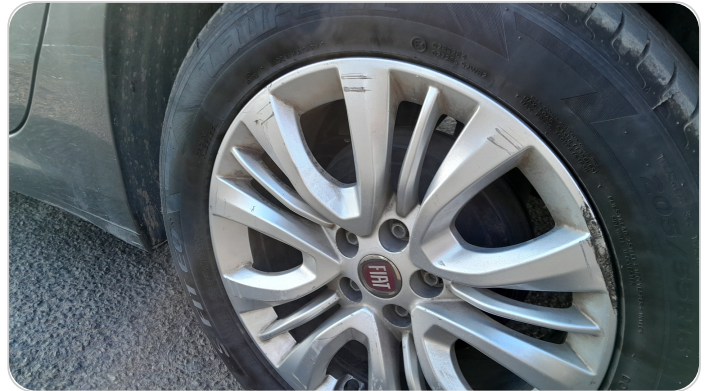
حالة الجنوط الخلفي : تجريحات بسيطة