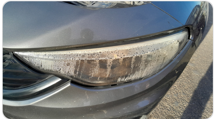
كشاف امامي شمال : الباغة مشبرة