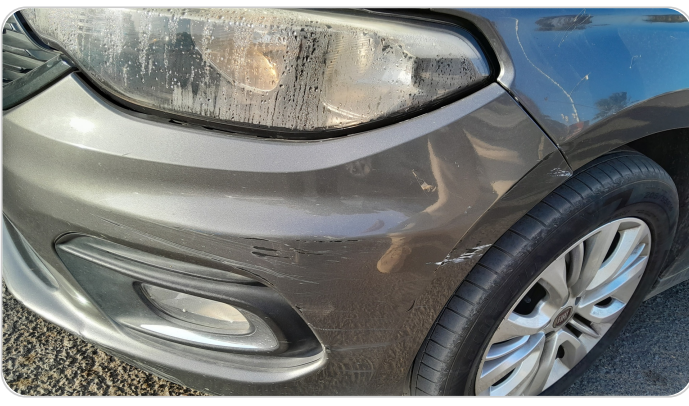
الاكصدام الأمامي : فبريكة (كسر)