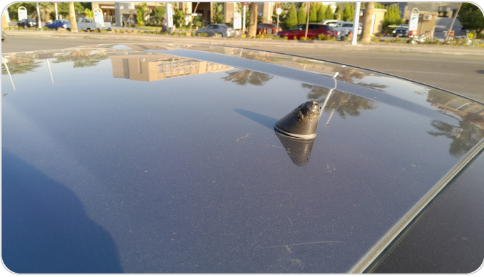
الارياال : فقد