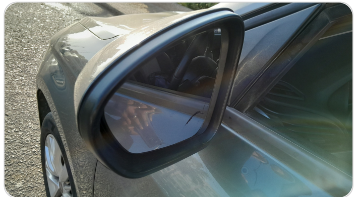
مرآة الباب الأمامي شمال : كسر/فقد (زجاج المرآة)