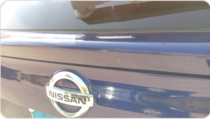
باب الشنطة : فبريكة (خرايش)