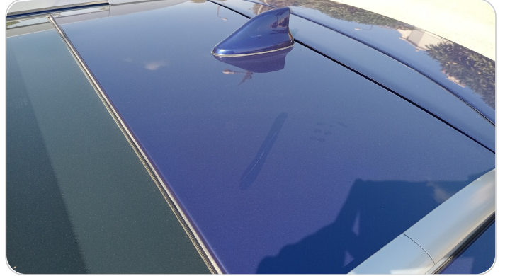
السقف : فبريكة (خرايش)