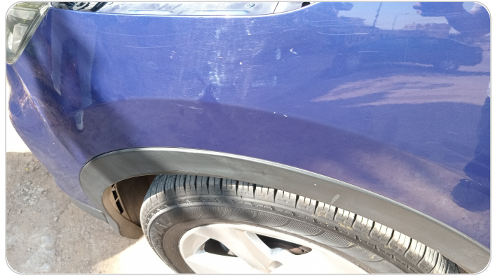
الرفرف الأمامي شمال : فبريكة (خرايش - خبطات)