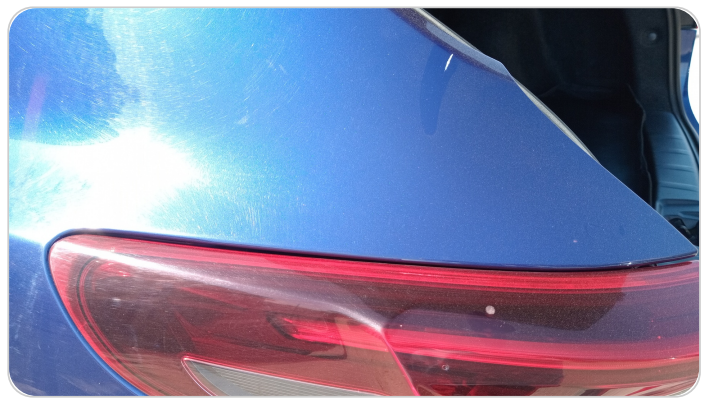
قائم خارجي خلفي شمال : فبريكة (خرابيش)