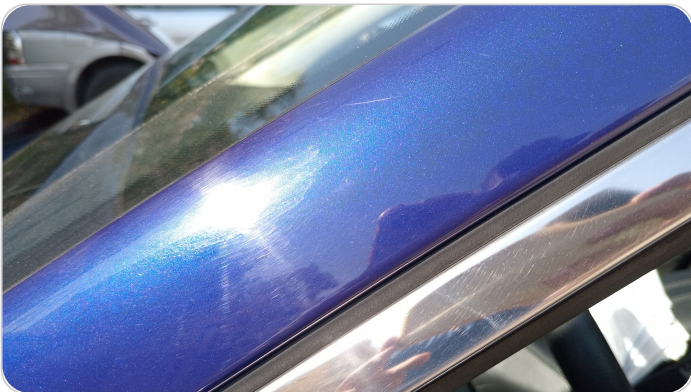
قائم خارجي أمامي شمال : فبريكة (خرايش)