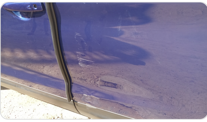
الباب الخلفي شمال : فبريكة (خرابيش - خبطات)