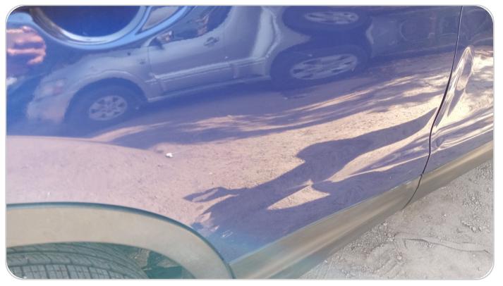
الباب الخلفي يمين : فبريكة (خرابيش - خبطات)