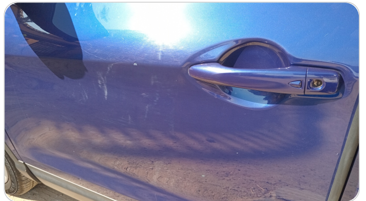
الباب الأمامي شمال : فبريكة (خرايش)