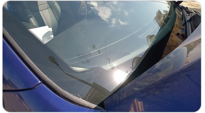
زجاج السيارة الأمامي : شروخ أو كسور