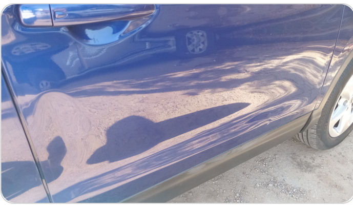
الباب الأمامي يمين : فبريكة (خرابيش - خبطات)