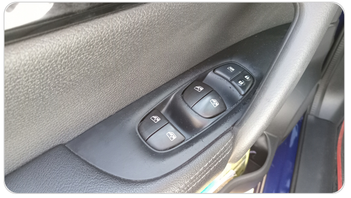
فرش الباب الأمامي شمال : قطع/كسر/شرخ/تلف