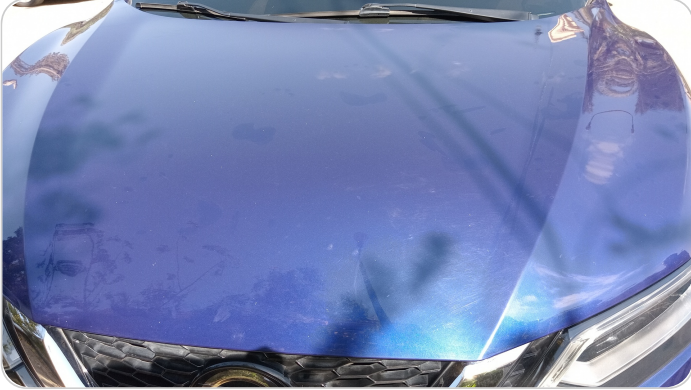
الكبوت : فبريكة (خرايش)