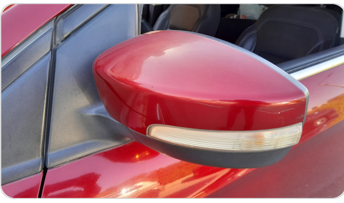
مرآة الباب الأمامي شمال : فبريكة (خرايبش)