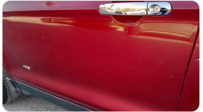
الباب الأمامي شمال : فبريكة (خرابيش)