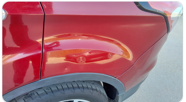
الرفرف الخلفي شمال : فبريكة (خرابيش)