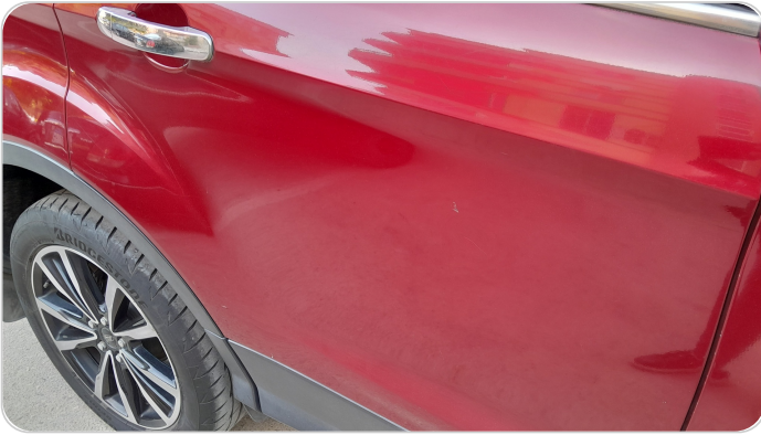
الباب الخلفي يمين : فبريكة (خرايبش)