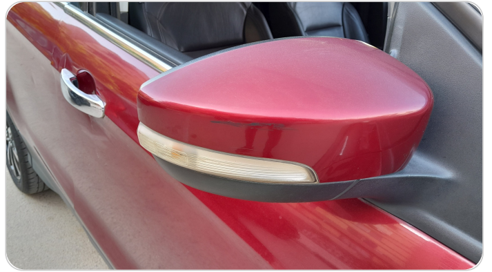
مرآة الباب الأمامي يمين : فبريكة (خرايبش)