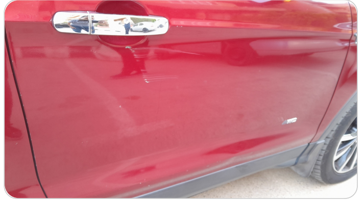
الباب الأمامي يمين : فبريكة (خرايبش)