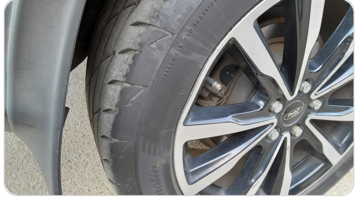
حالة الجنوط الخلفي يمين : اعوجاج بسيط