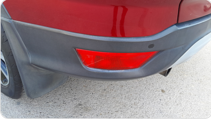
كشافات شبورة خلفي : كسر بالباغة