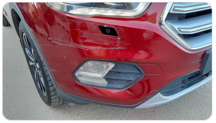
الاكصدام الأمامي : فبريكة (خرايبش)