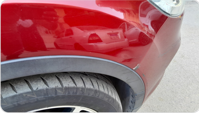
الرفرف الأمامي يمين : فبريكة (خرايبش)