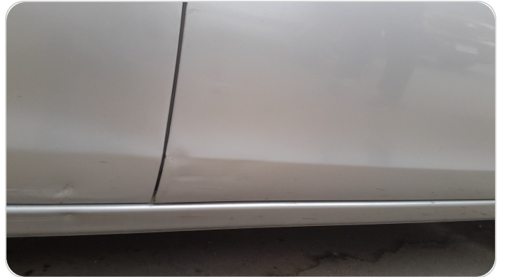
الباب الأمامي يمين : فبريكة (خرابيش)