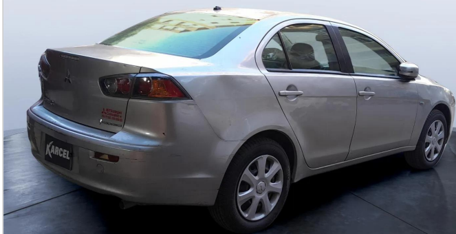
RR R 45