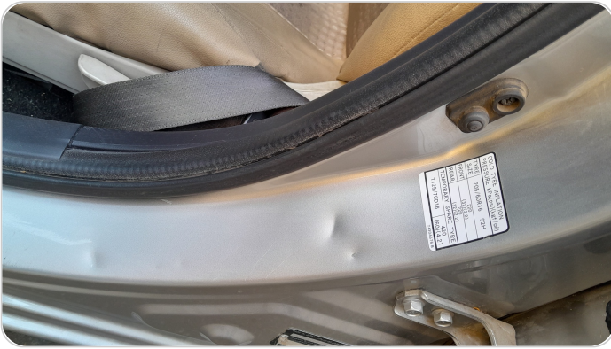
دواخل باب امامي شمال : فبريكة (خرابيش)