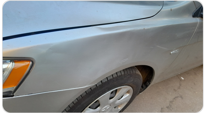
الرفرف الأمامي شمال : فبريكة (خرابيش)