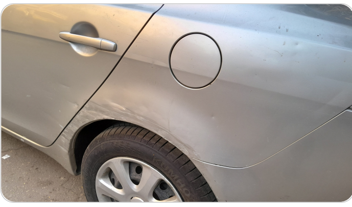
الرفرف الخلفي شمال : فبريكة (خرابيش - خبطات)