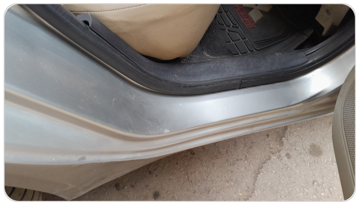
دواخل وقوائم باب خلفي يمين : فبريكة (خرابيش)