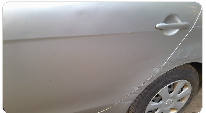
الباب الخلفي شمال : فبريكة (خرابيش)