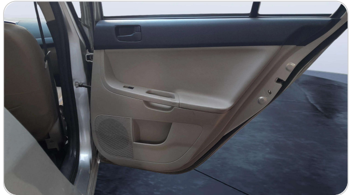
RR R DOOR