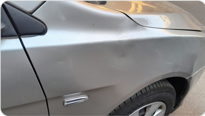
الرفرف الأمامي يمين : فبريكة (خرابيش)