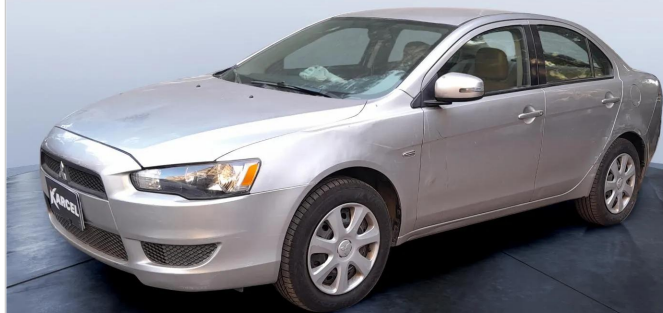
FR L 45