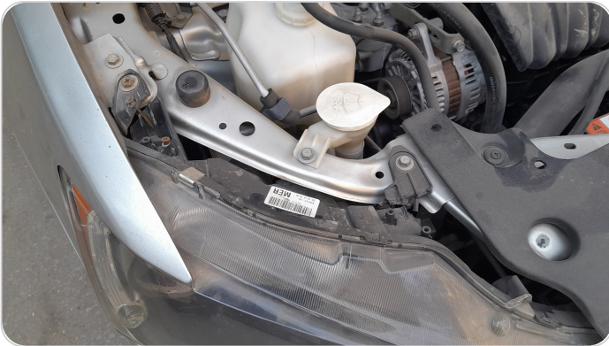
الكشاف الأمامي يمين : كسر في قواعد الكشاف