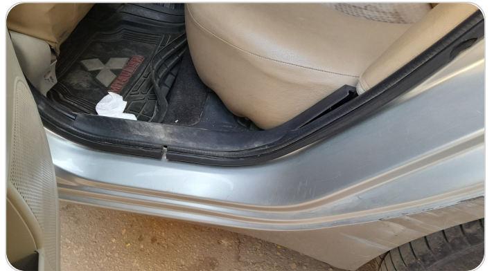
دواخل وقوائم باب الخلفي شمال : فبريكة (خرابيش)