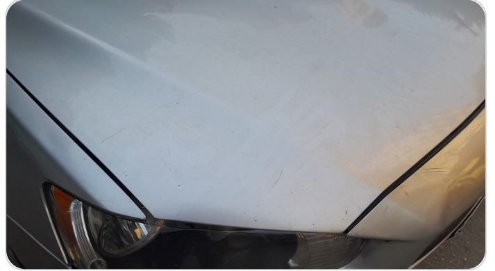
الكبوت : فبريكة (خرابيش)