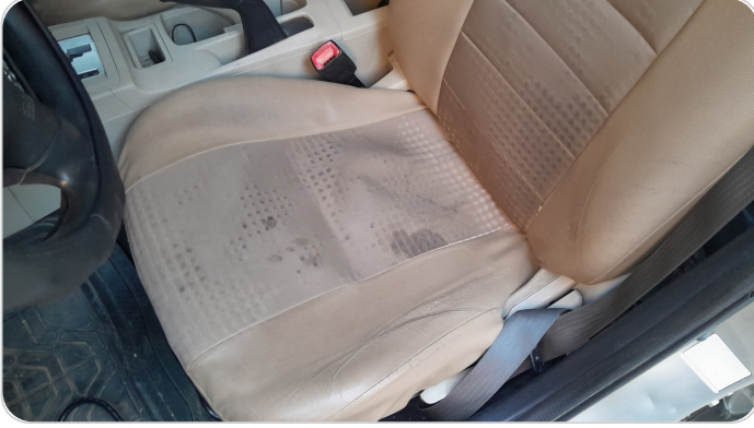
فرش كرسي أمامي شمال : قطع /كسر / شرخ /تلف