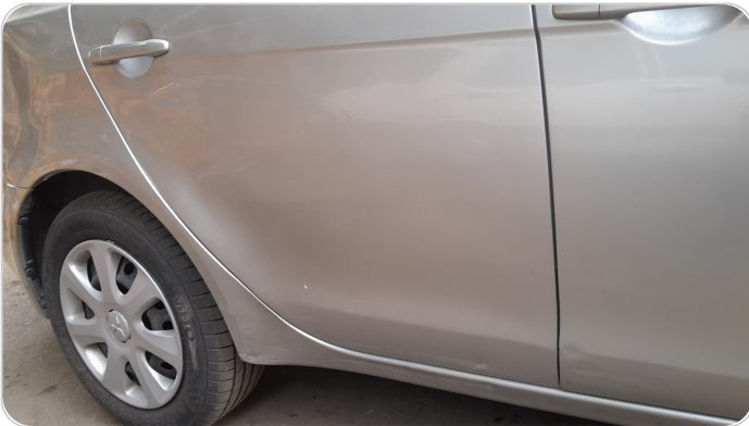
الباب الخلفي يمين : رش مع معجون (خرابيش)