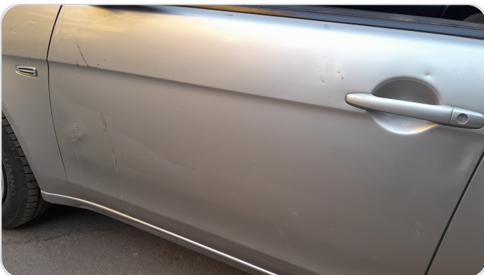
الباب الأمامي شمال : فبريكة (خرابيش - خبطات)