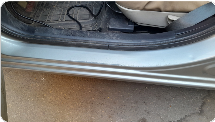
دواخل وقوائم باب الأمامي شمال : فبريكة (خرابيش)