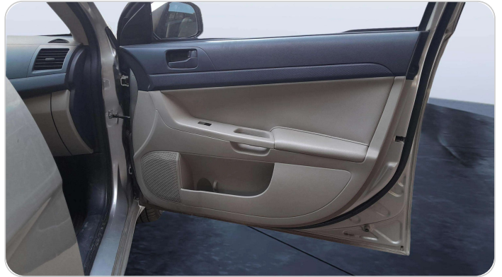
FR R DOOR