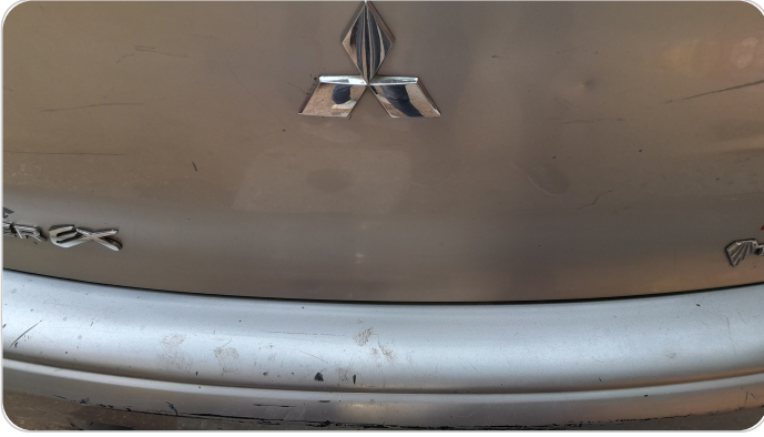
الاكصدام الخلفي : فبريكة (خرابيش)