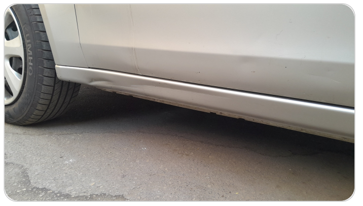
العتب السفلي شمال : فبريكة (خرابيش)