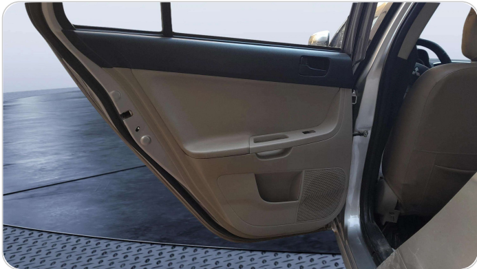
RR L DOOR