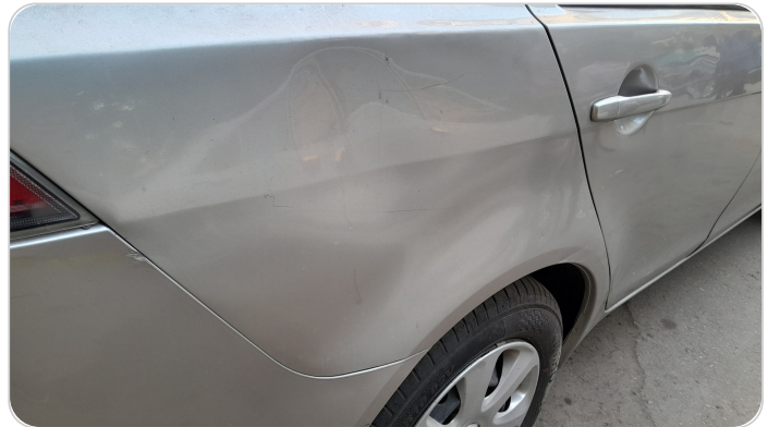
الرفرف الخلفي يمين : فبريكة (خرابيش)