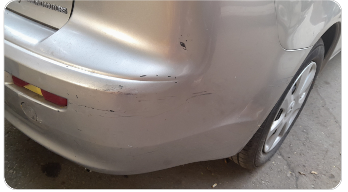
الاكصدام الخلفي : فبريكة (خرابيش)