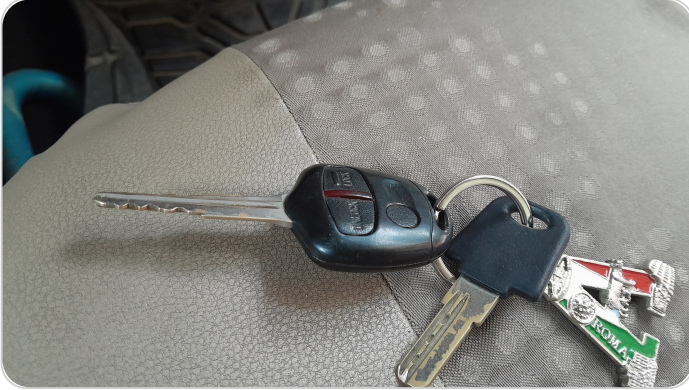
حالة الريموت / المفتاح : يعمل بكفاءة