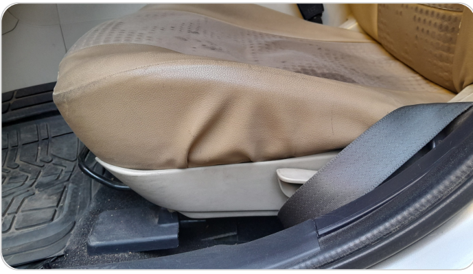
DRIVER SEAT SWITCHES