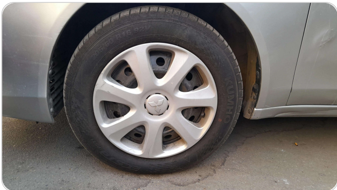
FR L TIRE