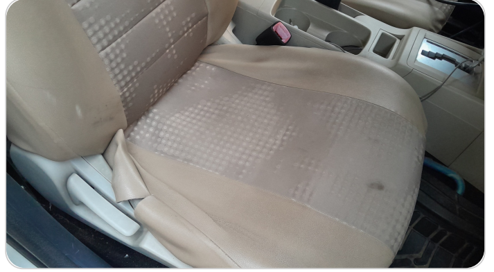
فرش كرسي أمامي يمين : قطع /كسر /شرخ /تلف