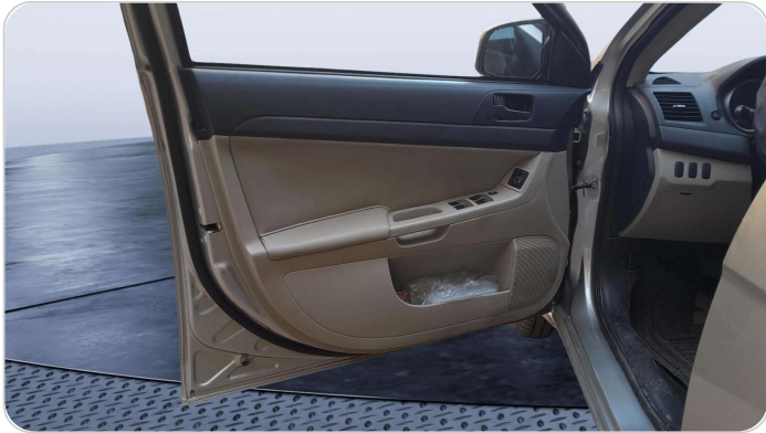
FR L DOOR