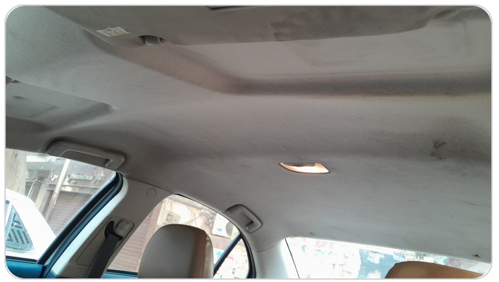
CAR ROOF MAT