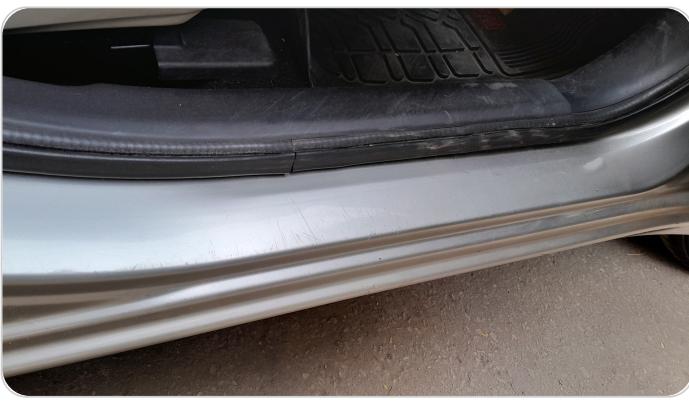
دواخل وقوائم باب أمامي يمين : فبريكة (خرابيش)