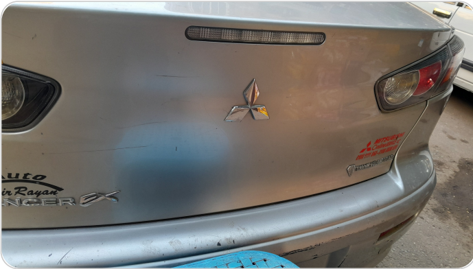
باب الشنطة : فبريكة (خرابيش)