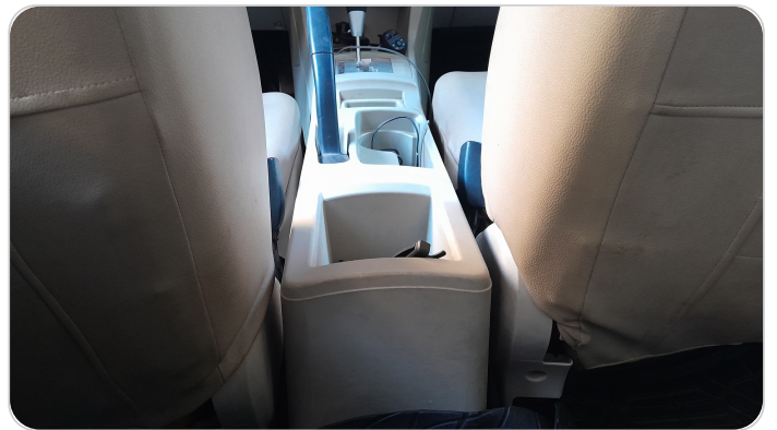
RR AC GRILL