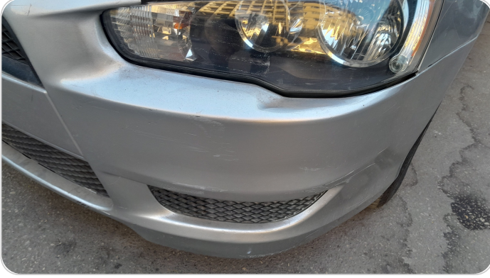
الاكصدام الأمامي : رش مع معجون (خرابيش)