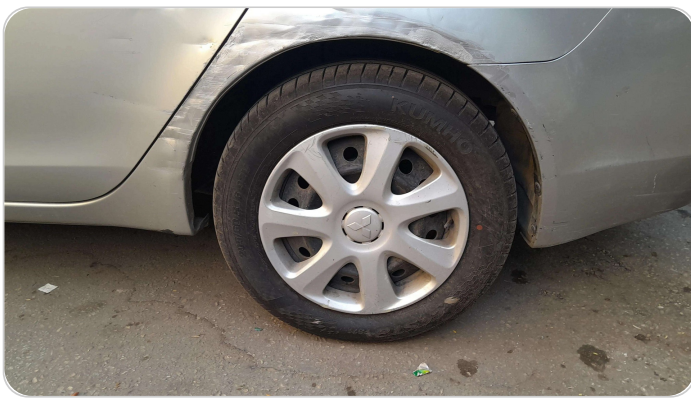
RR L TIRE