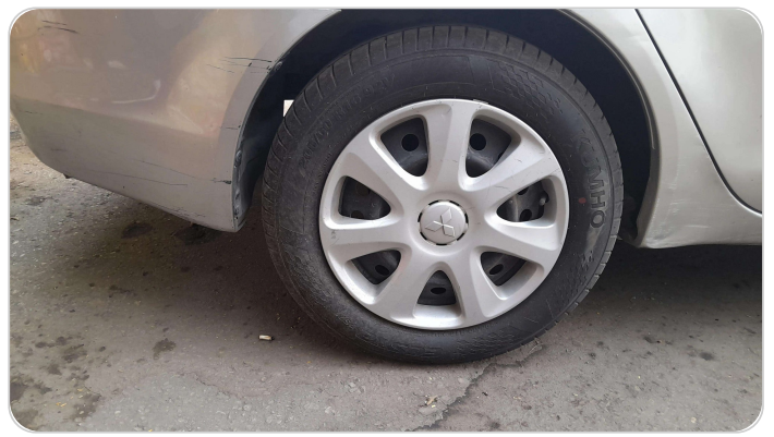
RR R TIRE