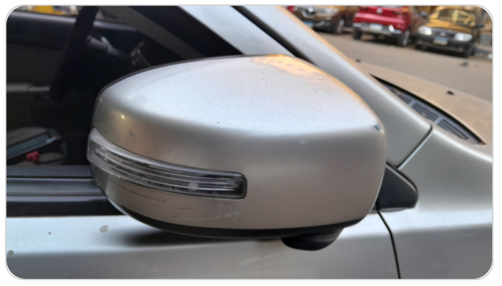
مراية الباب الأمامي يمين : فبريكة (خرابيش)