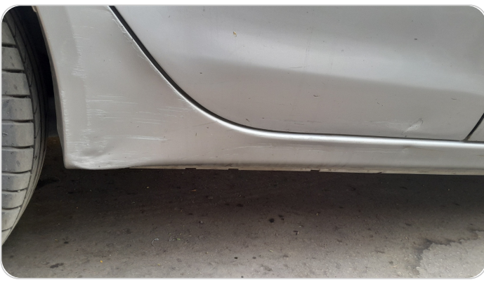
العتب السفلي يمين : فبريكة (خرابيش)