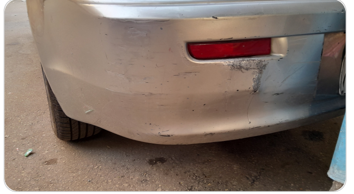
الاكصدام الخلفي : فبريكة (خرابيش)