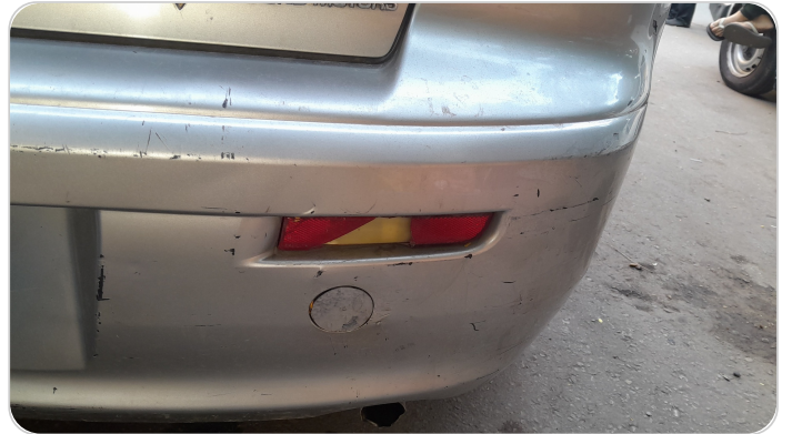
كشافات شبورة خلفي : كسر بالباغة