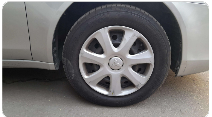
FR R TIRE