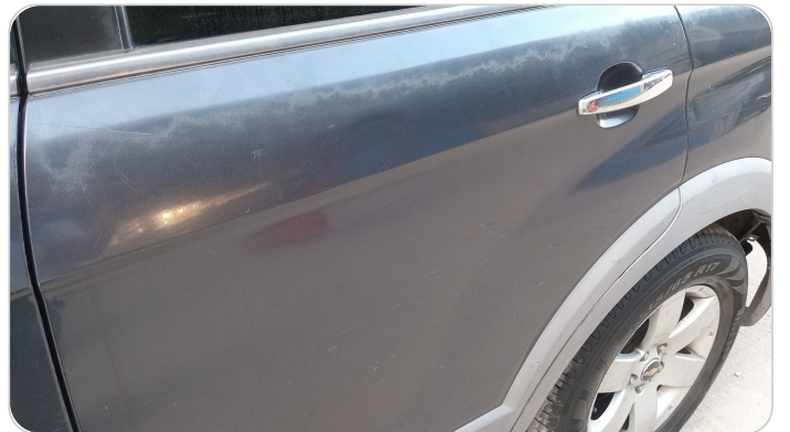
الباب الخلفي شمال : فبريكة (خرابيش - خبطات)