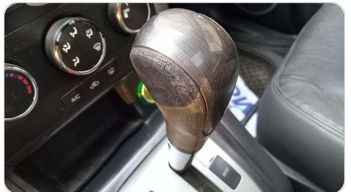
الكونسول الوسط : قطع /كسر / شرخ /تلف