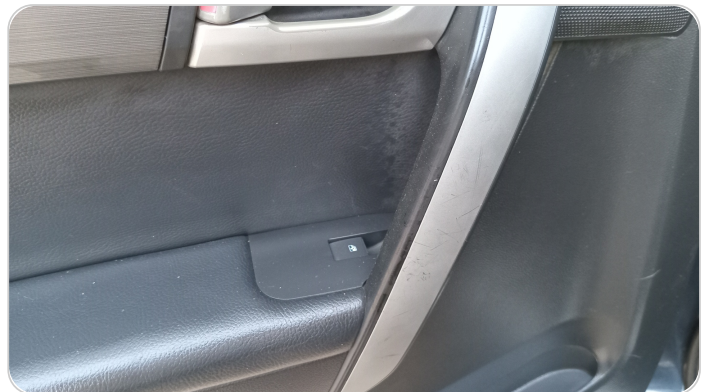
فرش الباب الخلفي شمال : قطع /كسر/شرخ/تلف