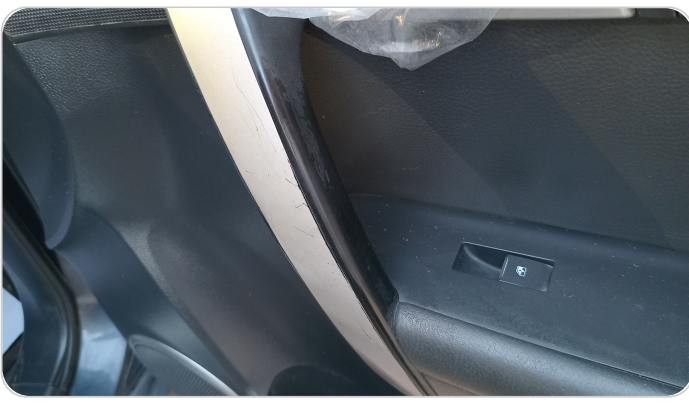
فرش الباب الأمامي يمين : قطع / كسر / شرخ / تلف