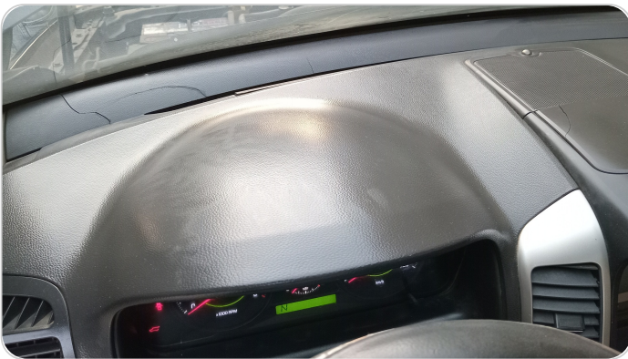
التابلوه : قطع /كسر /تلف /شرح