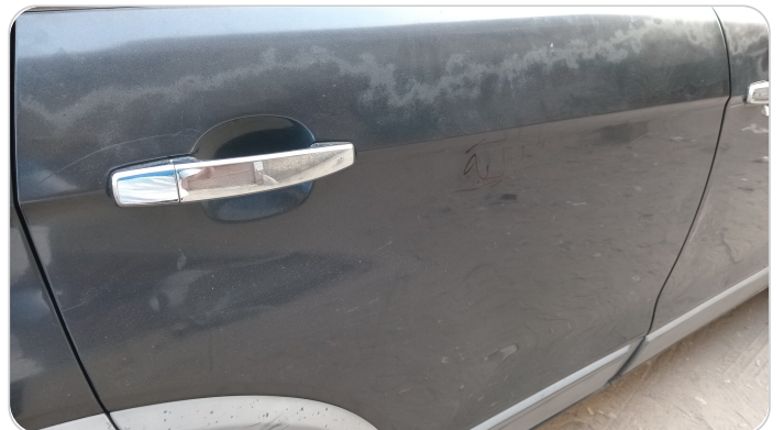
الباب الخلفي يمين : فبريكة (خرابيش - خبطات)