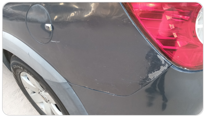
الرفرف الخلفي شمال : فبريكة (سمكره على البارد)