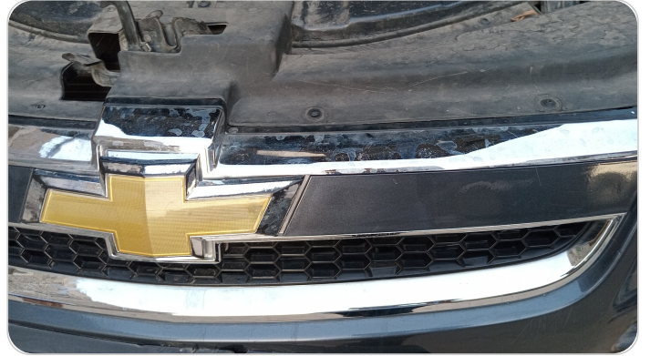
شبكة أمامية : الدهان / النيكل (متآكل)