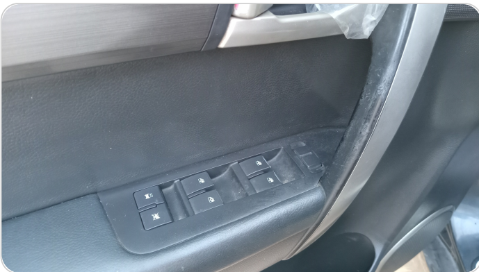
فرش الباب الأمامي شمال : قطع/كسر/شرخ/تلف