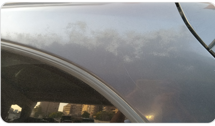
قائم خارجي خلفي شمال : فبريكة (خرابيش)