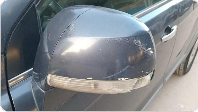
مراية الباب الأمامي شمال : فبريكة (خرابيش)