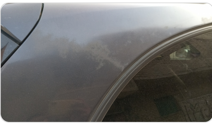
قايم خارجي خلفي يمين : فبريكة (الدهان متآكل)