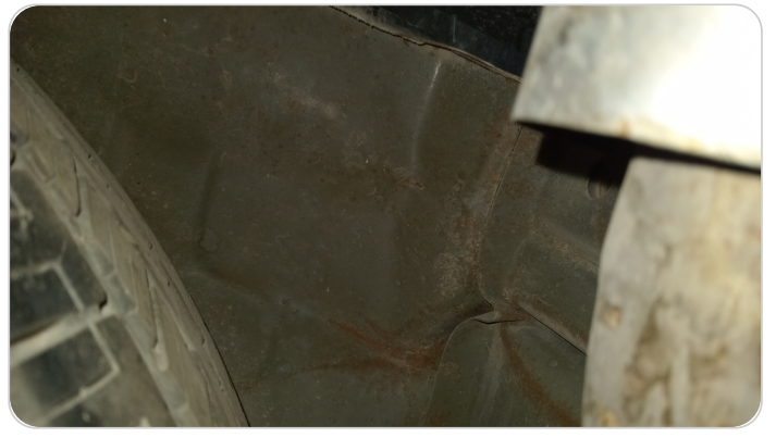
الشاسيه الخلفي : صدمة بسيطه