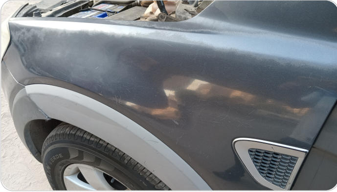
الرفرف الأمامي شمال : فبريكة (خرابيش)