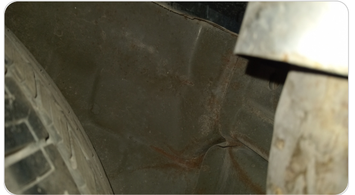
دواخل وأرضية الشنطة : آثار صدمة صغيرة