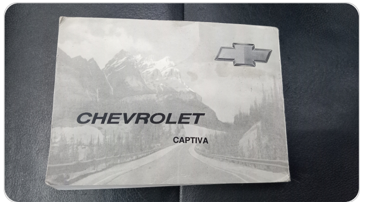
كتالوج السيارة : موجود