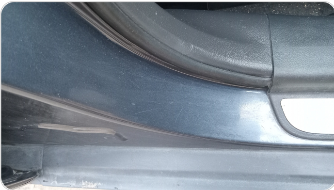
دواخل وقوائم باب أمامي يمين : فبريكة (خرابيش)