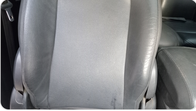
فرش كرسي أمامي يمين : قطع / كسر / شرخ / تلف