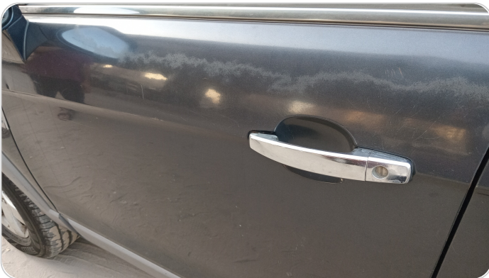
الباب الأمامي شمال : فبريكة (خرابيش)