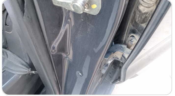
دواخل وقوائم باب الأمامي شمال : فبريكة (خرابيش)