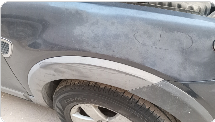
الرفرف الأمامي يمين : فبريكة (خرابيش)