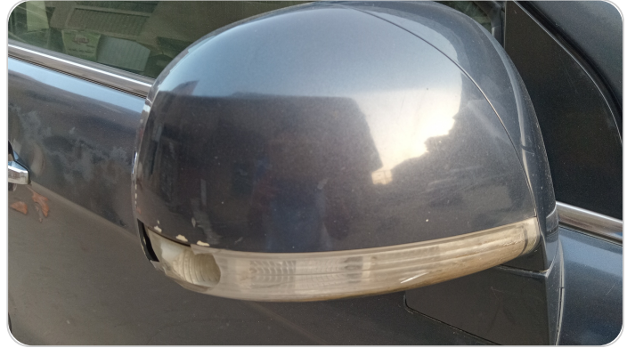
مراية الباب الأمامي يمين : فبريكة (خرابيش)