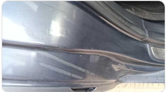
دواخل وقوائم باب خلفي يمين : فبريكة (خرابيش)