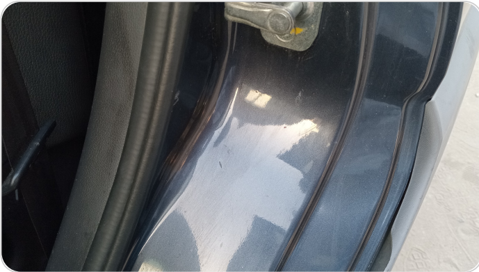
دواخل وقوائم باب الخلفي شمال : فبريكة (خرابيش)