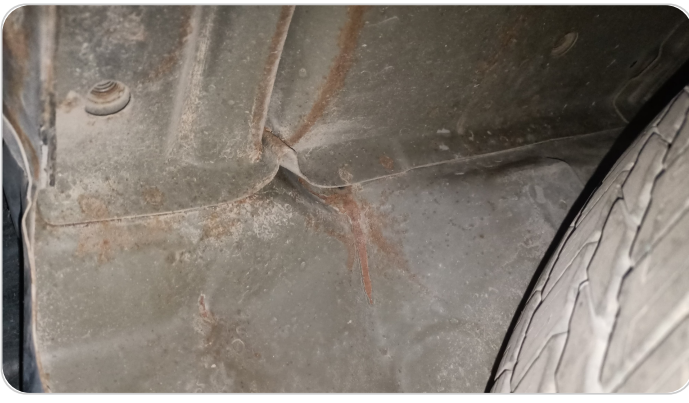
ستارة شنطة خلفية : صدمة بسيطة