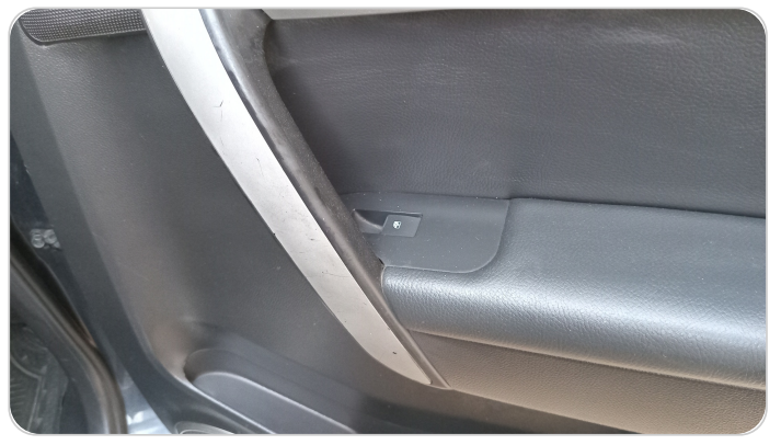
فرش الباب الخلفي يمين : قطع / كسر / شرخ / تلف