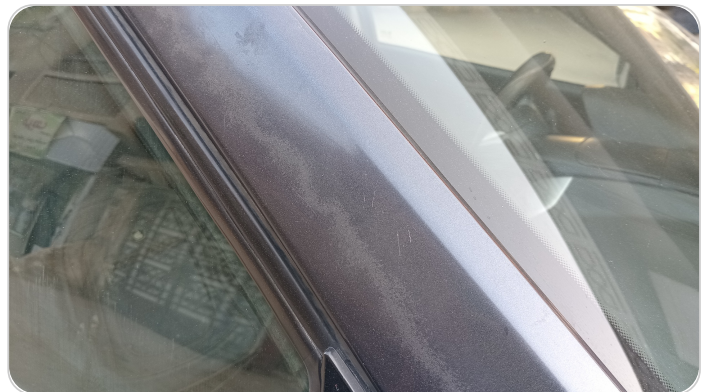
قائم خارجي أمامي يمين : فبريكة (الدهان متآكل)