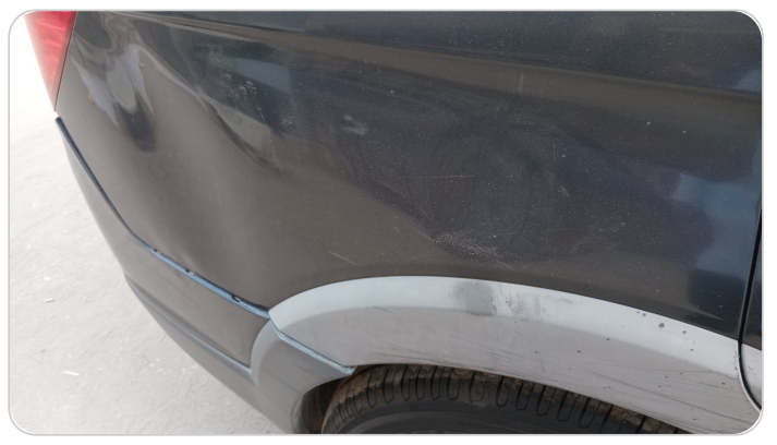
الرفرف الخلفي يمين : فبريكة (خرابيش - خبطات)