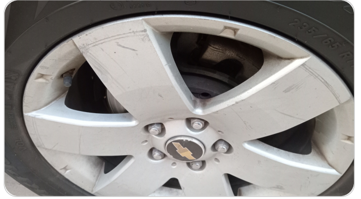
حالة الجنوط الخلفي : تجريحات بسيطه