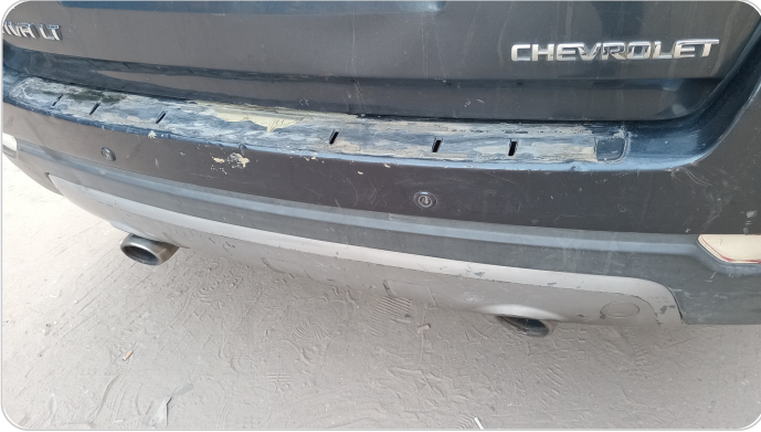
الاكصدام الخلفي : رش بدون معجون (خرابيش)