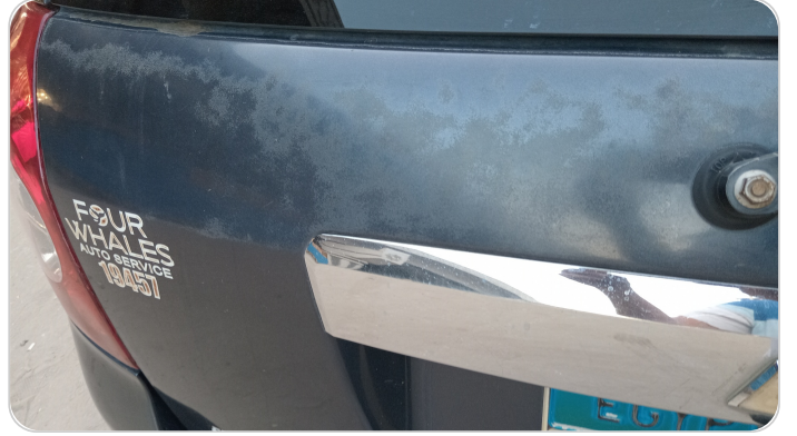
باب الشنطة : فبريكة (الدهان متآكل)