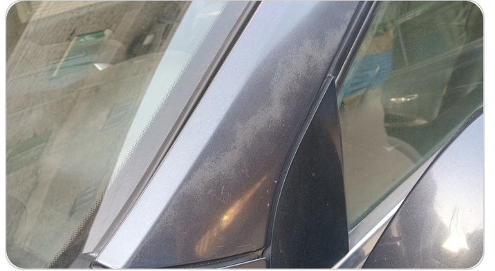
قائم خارجي أمامي شمال : فبريكة (خرابيش)