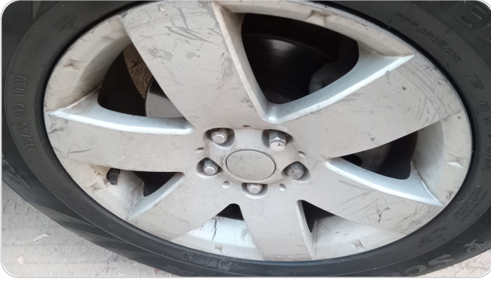
حالة الجنوط الأمامي : تجريحات بسيطة