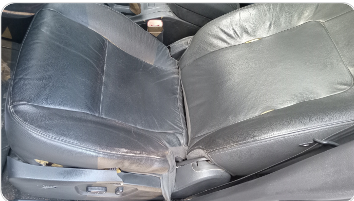
فرش كرسي أمامي شمال : قطع /كسر / شرخ /تلف