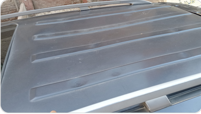
السقف : فبريكة (خبطات)