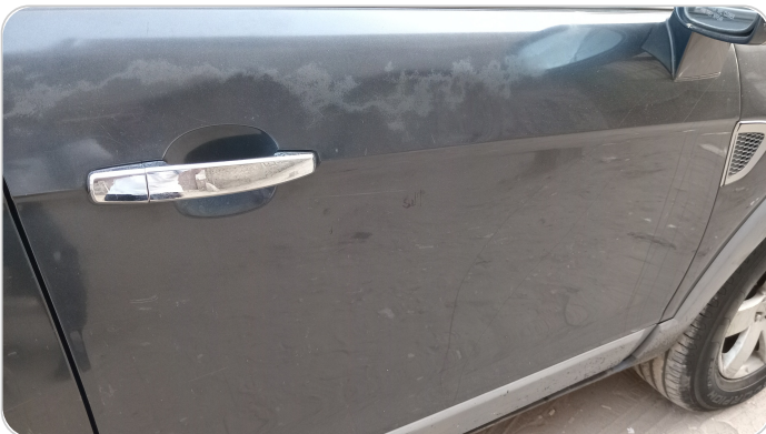
الباب الأمامي يمين : فبريكة (خرابيش)