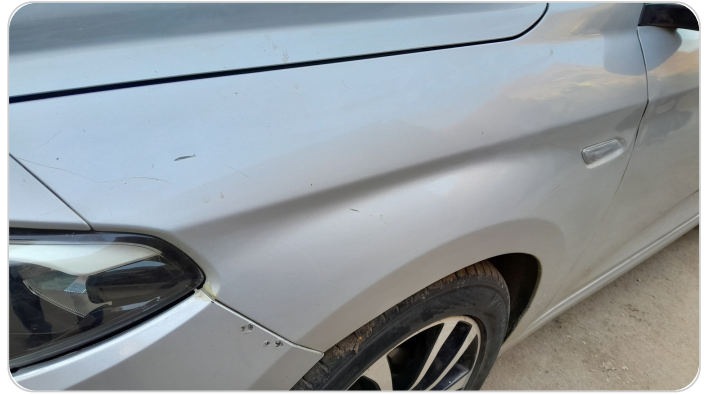
الرفرف الأمامي شمال : رش مع معجون (خرابيش)