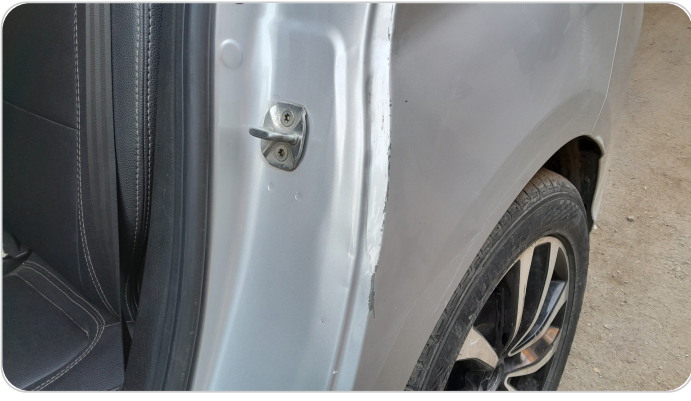
حرف دواخل باب خلفي شمال : سمكرة علي البارد