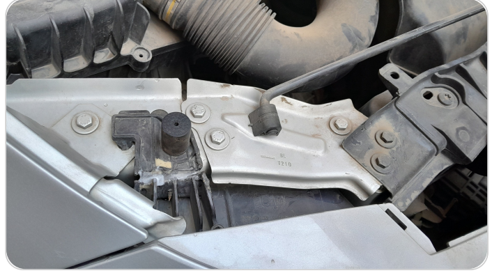
الكشاف الأمامي يمين : كسر في قواعد الكشاف