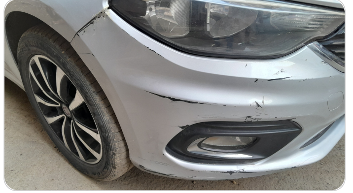
الاكصدام الأمامي : فبريكة (كس)