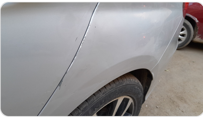
الرفرف الخلفي شمال : فبريكة (سمكره على البارد)