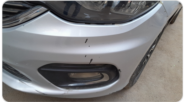
الاكصدام الامامي : فبريكة (كسر)