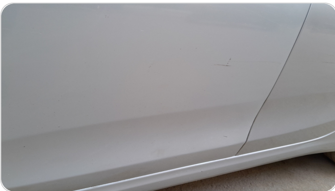
الباب الأمامي شمال : رش مع معجون (خرابيش)