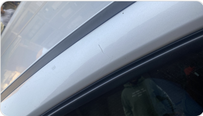
قائم خارجي أمامي يمين : فبريكة (خرابيش)