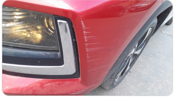
الكصدام الأمامي : رش بدون معجون (خرابيش)