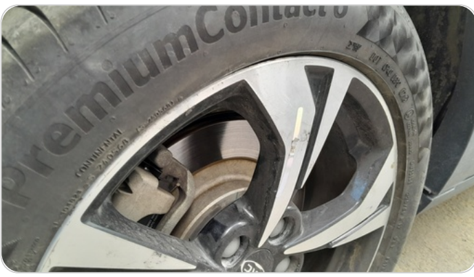
حالة الجنوط الخلفي : تجريحات بسيطة