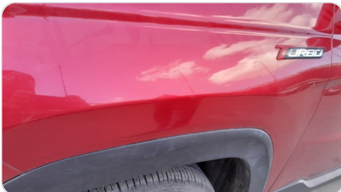
الرفرف الأمامي شمال : رش بدون معجون (خرايش)