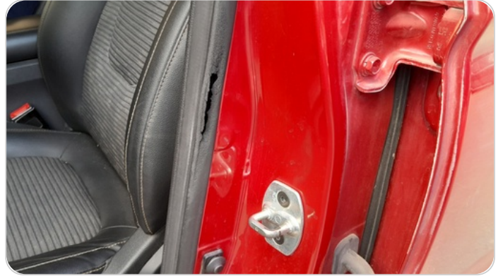
كاوتش الابواب : متاكل