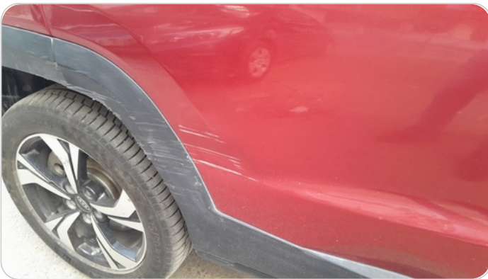
الباب الخلفي يمين : رش مع معجون (خرابيش)