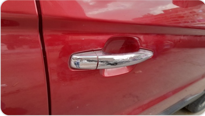
مقبض باب امامي يمين : تاكل في النيكل