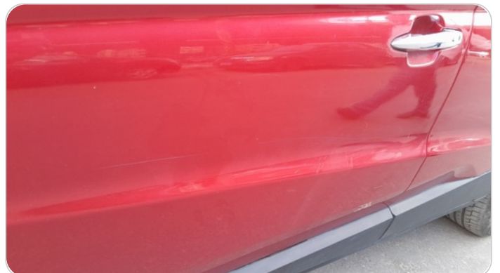
الباب الأمامي شمال : رش مع معجون (خرايش)