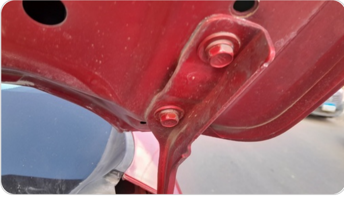
مفصلات ومسامير الكبوت : آثار فك وتركيب