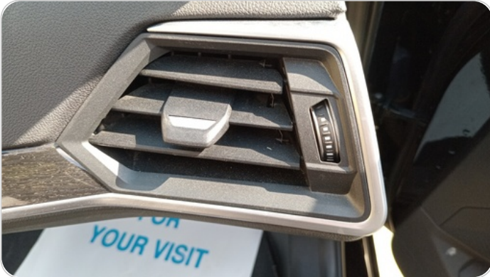
هوايات التكييف : كسر (هواية واحدة)