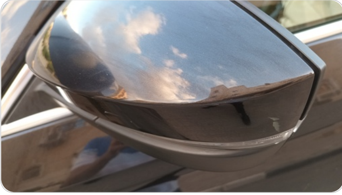
مراية الباب الأمامي شمال : فبريكة (خرابيش)