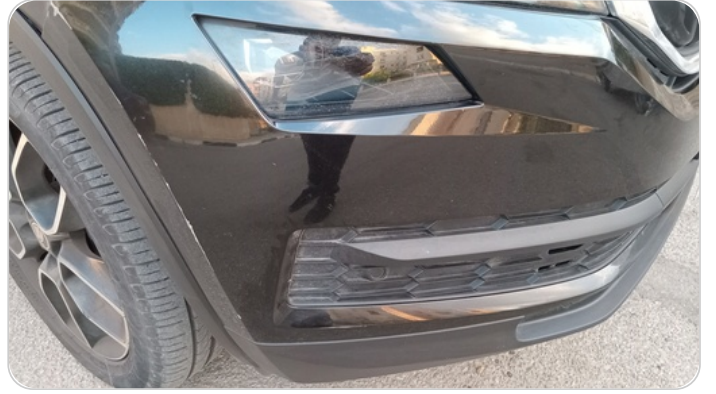
الاكصدام الأمامي : رش بدون معجون (خرابيش)