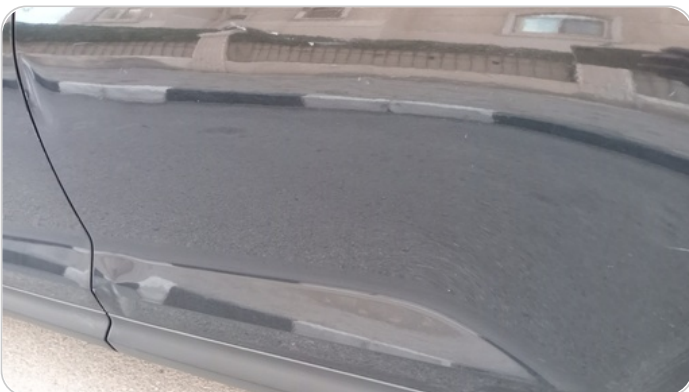
الباب الخلفي شمال : فبريكة (خرابيش - خبطات)