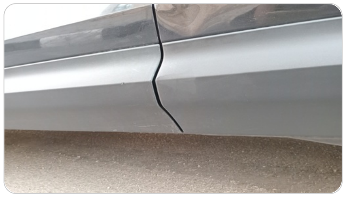
العتب السفلي شمال : فبريكة (خرابيش)