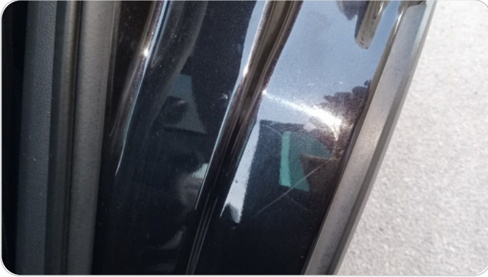
دواخل وقوائم باب الخلفي شمال : فبريكة (خرابيش)