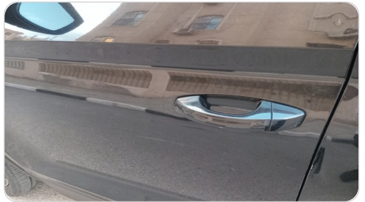
الباب الأمامي شمال : فبريكة (خرابيش)