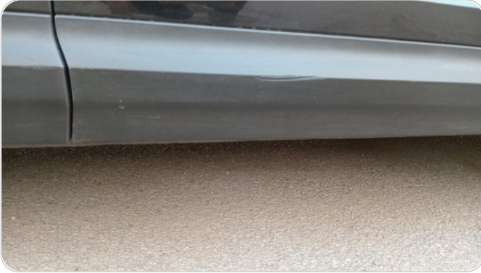
العتب السفلي يمين : فبريكة (خرابيش)