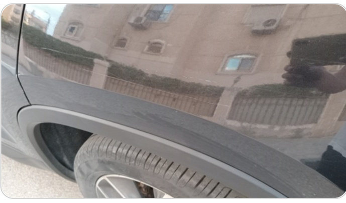
الرفرف الخلفي شمال : فبريكة (خرابيش)