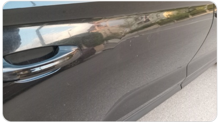
الباب الخلفي يمين : فبريكة (خرابيش - خبطات)