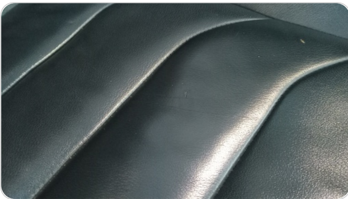
فرش كرسي أمامي يمين : قطع /كسر /شرخ /تلف