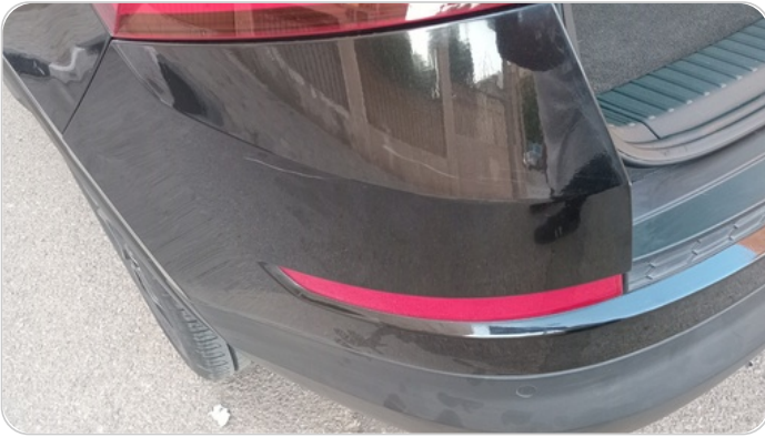
الاكصدام الخلفي : رش بدون معجون (خرابيش)