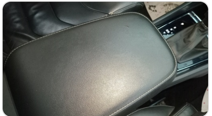
الكونسول الوسط : قطع /كسر / شرخ /تلف