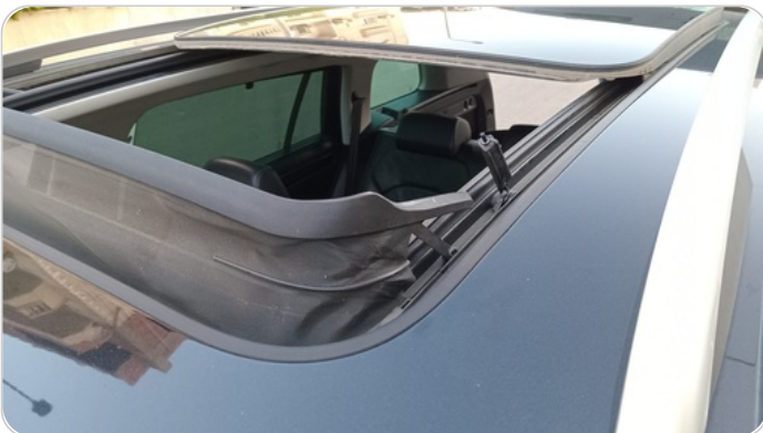
دراع فيبر تثبيت شبكه هواء فتحه السقف : كسر