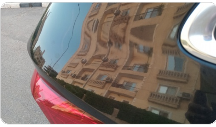
قائم خارجي خلفي يمين : فبريكة ( خرابيش )