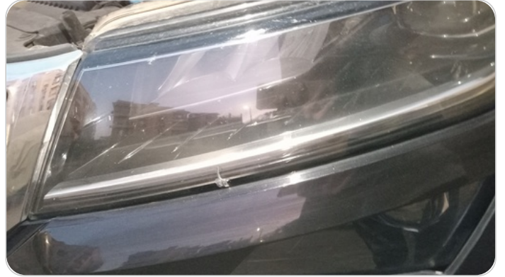
الكشاف الأمامي شمال : كسر بالباغة