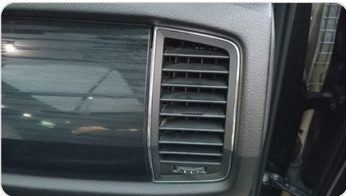
هوايات التكييف : كسر (أكثر من هواية)