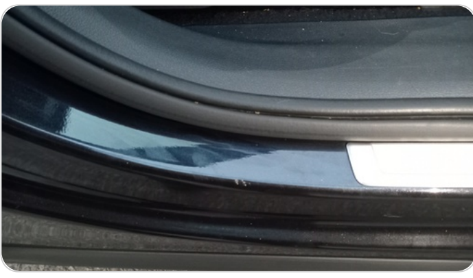
دواخل وقوائم باب أمامي يمين : فبريكة (خرابيش)