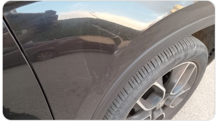
الرفرف الأمامي يمين : فبريكة (خرابيش)