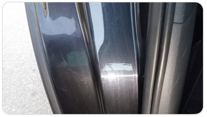
دواخل وقوائم باب خلفي يمين : فبريكة (خرابيش)