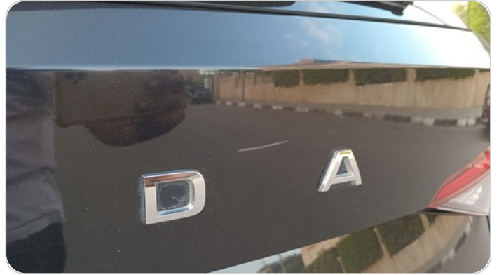
باب الشنطة : فبريكة (خرابيش)