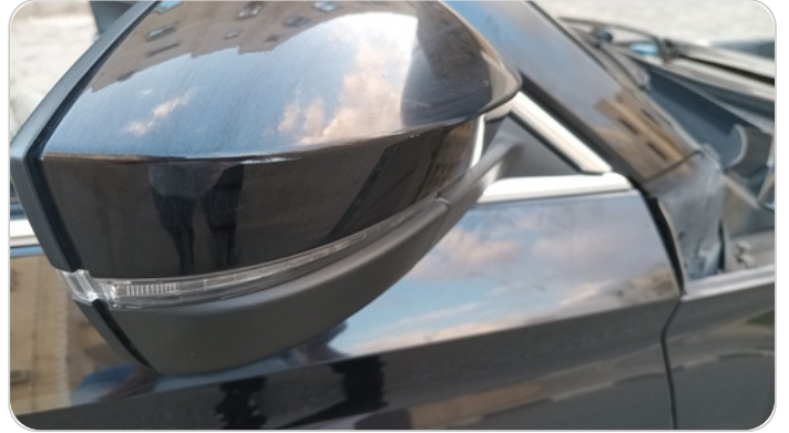
مراية الباب الأمامي يمين : فبريكة (خرابيش)