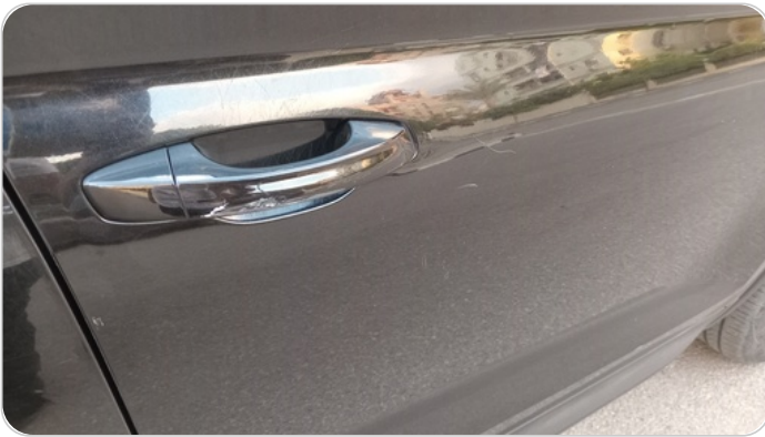
الباب الأمامي يمين : فبريكة (خرابيش)