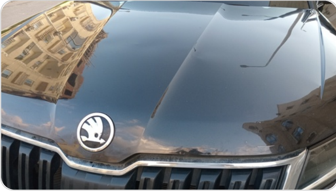
الكبوت : فبريكة (سمكره على البارد)