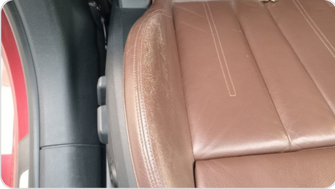
فرش كرسي أمامي يمين : قطع / كسر / شرخ / تلف