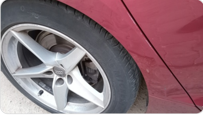
العتب السفلي يمين : فبريكة (خرابيش)