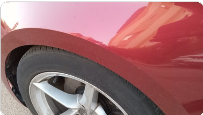
الرفرف الأمامي شمال : فبريكة (خرابيش)