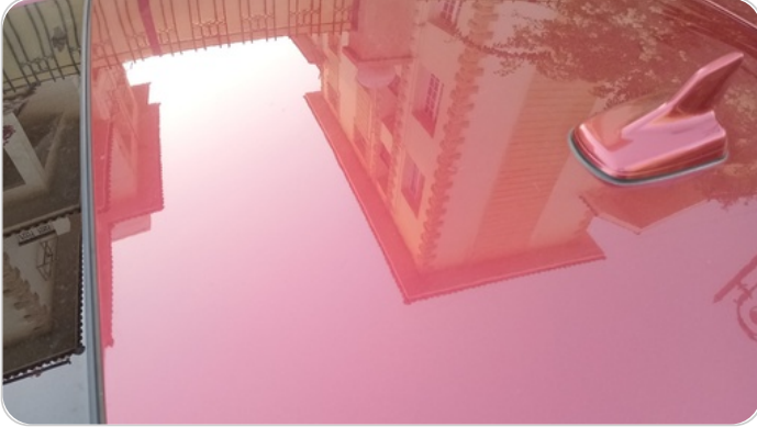
السقف : فبريكة (خرابيش)