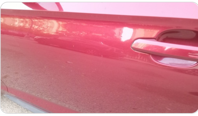
الباب الأمامي شمال : فبريكة (خرابيش)