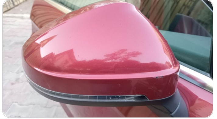
مراية الباب الأمامي يمين : فبريكة (خرابيش)