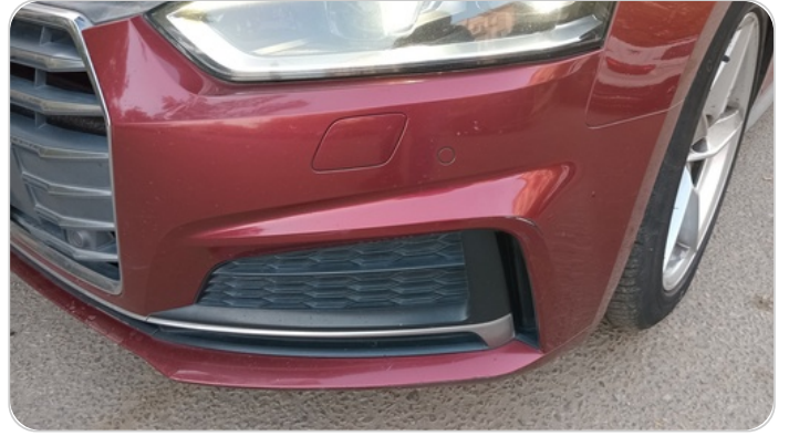
الاكصدام الأمامي : فبريكة (خرابيش)