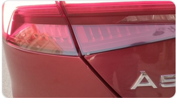
الكشاف الخلفي شمال : كسر بالباغة