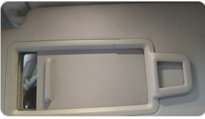
شماسات أمامية : تلف في الشمال