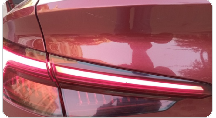
باب الشنطة : فبريكة (خرابيش)