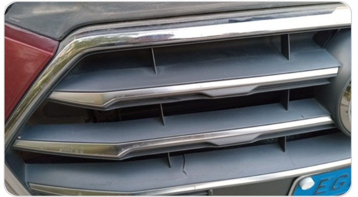
شبكة أمامية : شرخ / كسر