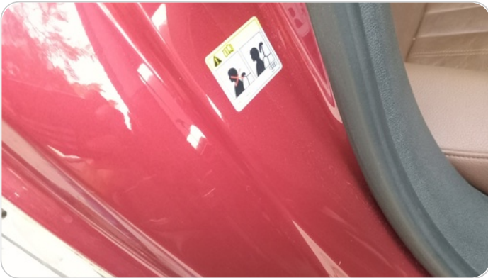
دواخل وقوائم باب خلفي يمين : فبريكة (خرابيش)