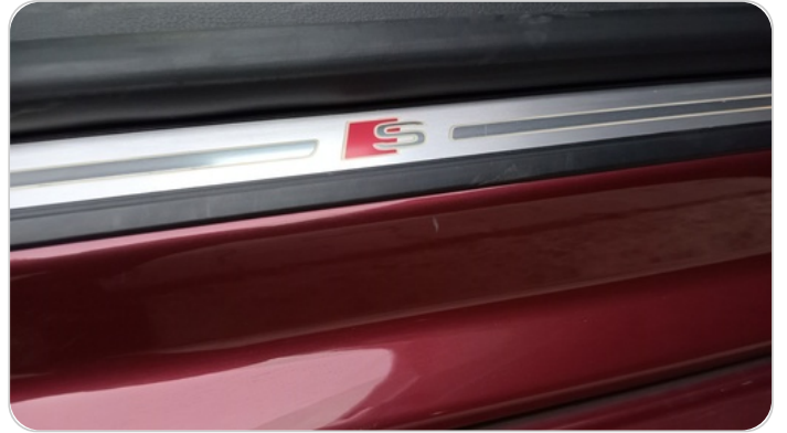
دواخل وقوائم باب أمامي يمين : فبريكة (خرابيش)