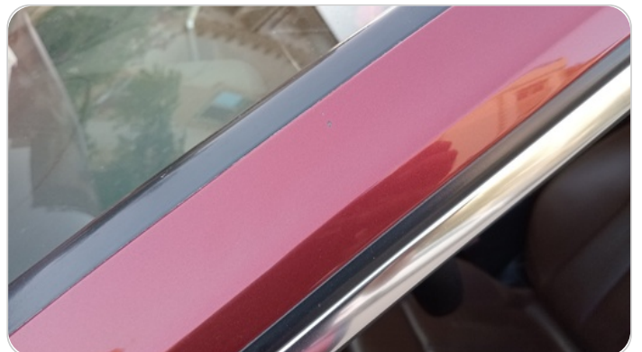
قائم خارجي أمامي شمال : فبريكة (خرابيش)