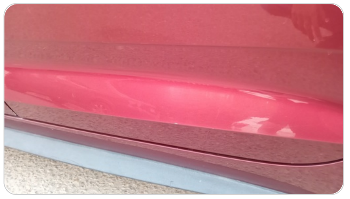
الباب الخلفي شمال : فبريكة (خرابيش)