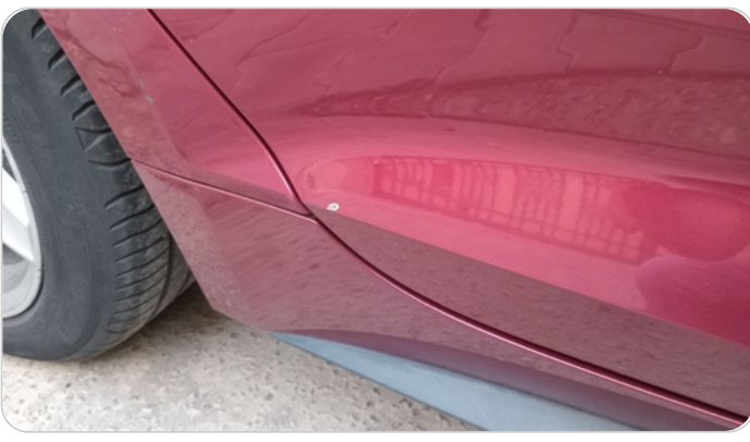
الباب الخلفي يمين : فبريكة (خرابيش)