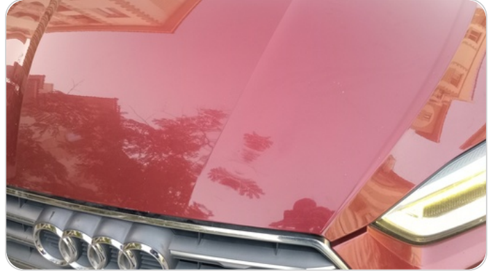
الكبوت : فبريكة (خرابيش)