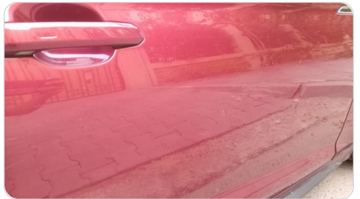
الباب الأمامي يمين : فبريكة (خرابيش)