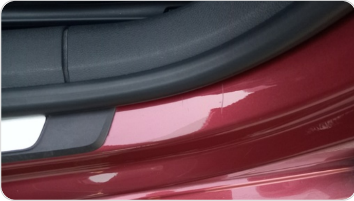
دواخل وقوائم باب الأمامي شمال : فبريكة (خرابيش)