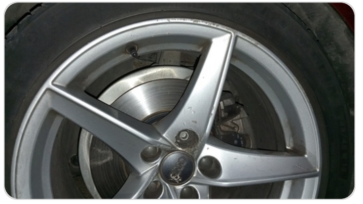
حالة الجنوط الأمامي : تجريحات بسيطة