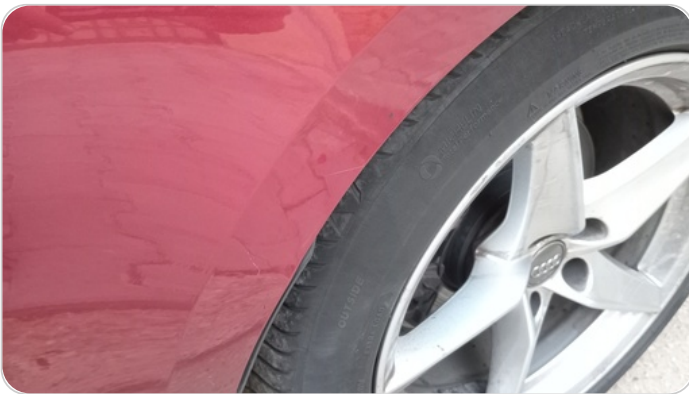
الرفرف الأمامي يمين : فبريكة (خرابيش)