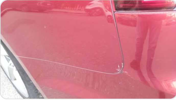
الرفرف الخلفي شمال : فبريكة (خرابيش)