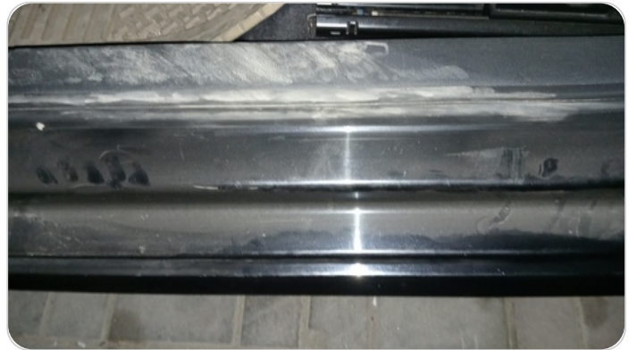
دواخل وقوائم باب الأمامي شمال : فبريكة (خرابيش)