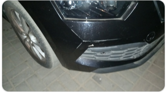
الاكصدام الأمامي : فبريكة (خرابيش)