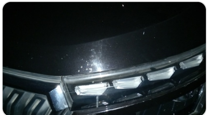
الكبوت : فيريكه (خرابيش)