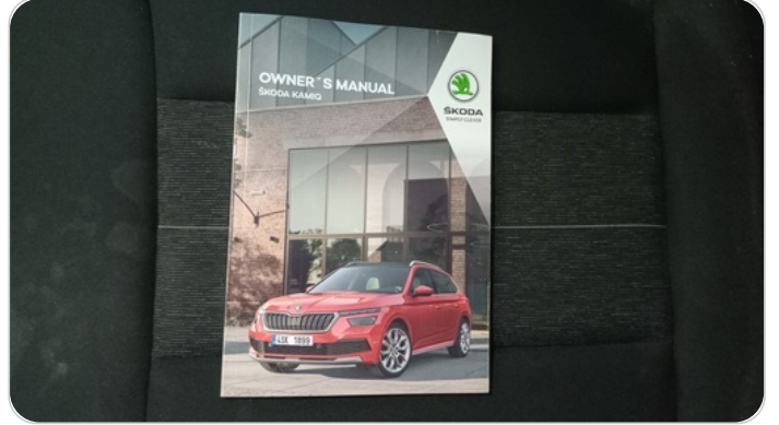
كتالوج السيارة : موجود