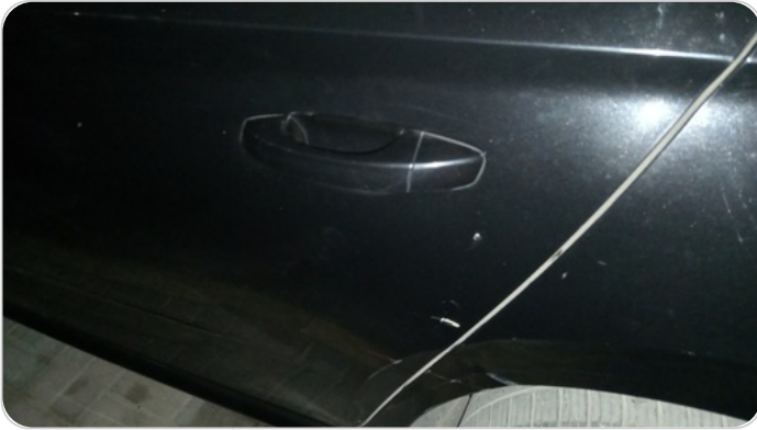
الباب الخلفي شمال : فبريكة (خرايش)