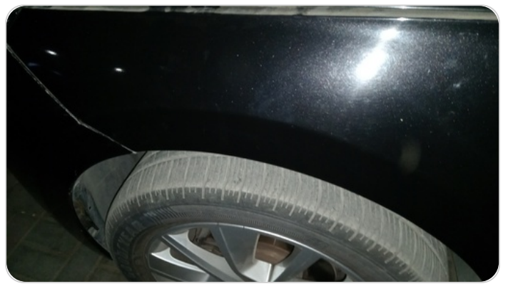
الرفرف الأمامي شمال : رش مع معجون (خرايش)