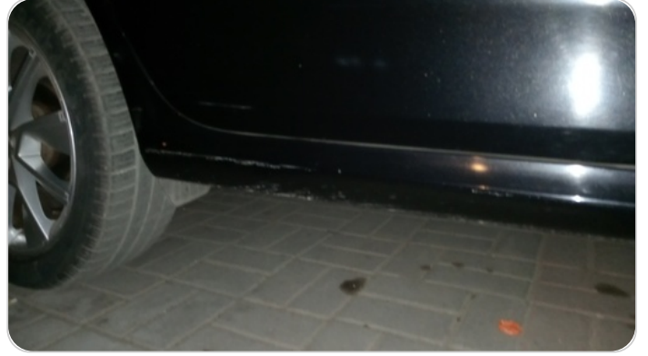
العتب السفلي يمين : فبريكة (خرابيش)