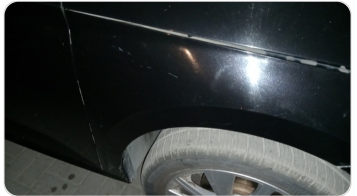
الرفرف الأمامي يمين : فبريكة (خرايش)