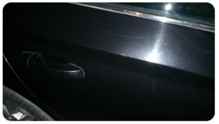
الباب الخلفي يمين : رش مع معجون (خرابيش)