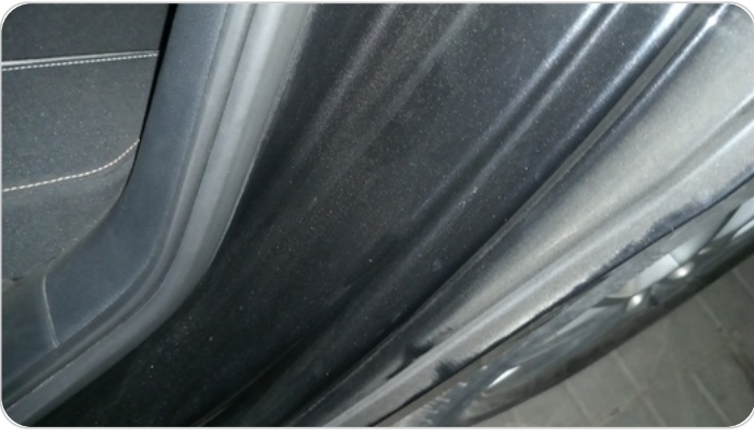
دواخل وقوائم باب الخلفي شمال : فبريكة (خرايش)