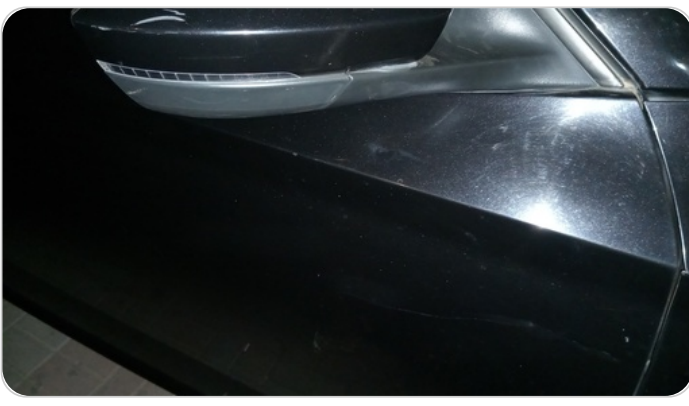
الباب الأمامي يمين : رش بدون معجون (خبطات)