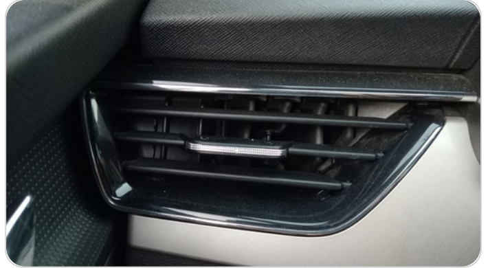
هوايات التكييف : كسر (هواية واحدة)