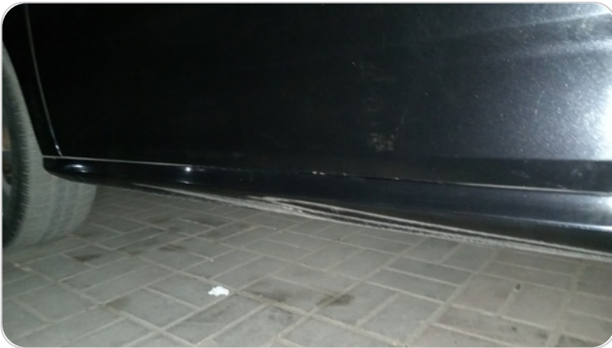
العتب السفلي شمال : فبريكة (خرايش - خبطات)