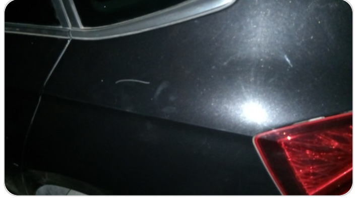
قائم خارجي خلفي شمال : فبريكة (خرايش)