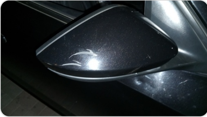
مراية الباب الأمامي يمين : فبريكة (خرابيش)