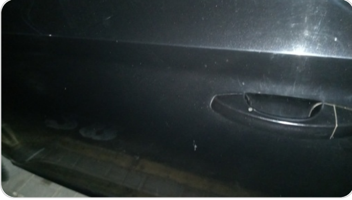
الباب الأمامي شمال : فبريكة (خرايش)