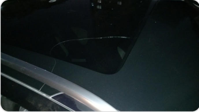
زجاج البانوراما : شروخ أو كسور