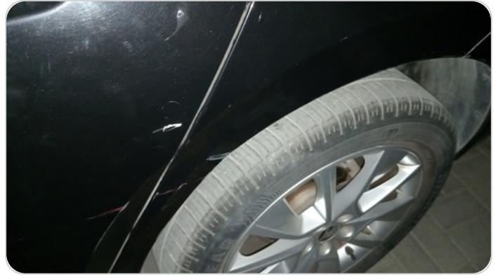
الرفرف الخلفي شمال : فبريكة (خرايش)