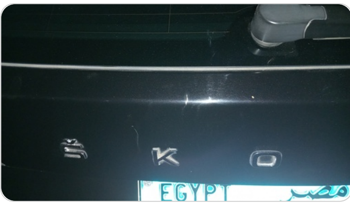
باب الشنطة : فبريكة (خرايش)