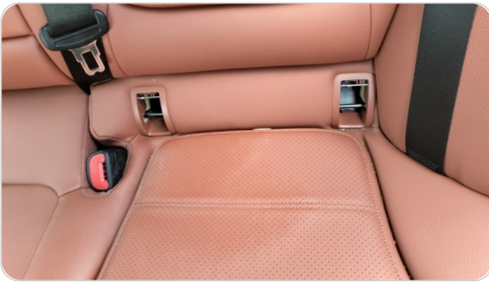
فرش كنبه خلفي : قطع / كسر / شرخ / تلف