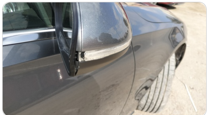
مرآة الباب الأمامي يمين : كسر في الغطاء