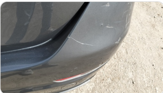
الاكصدام الخلفي : فبريكة (كسر)